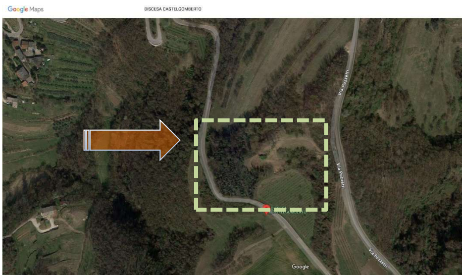
IMG 3. GOOGLE MAPS individuazione beni