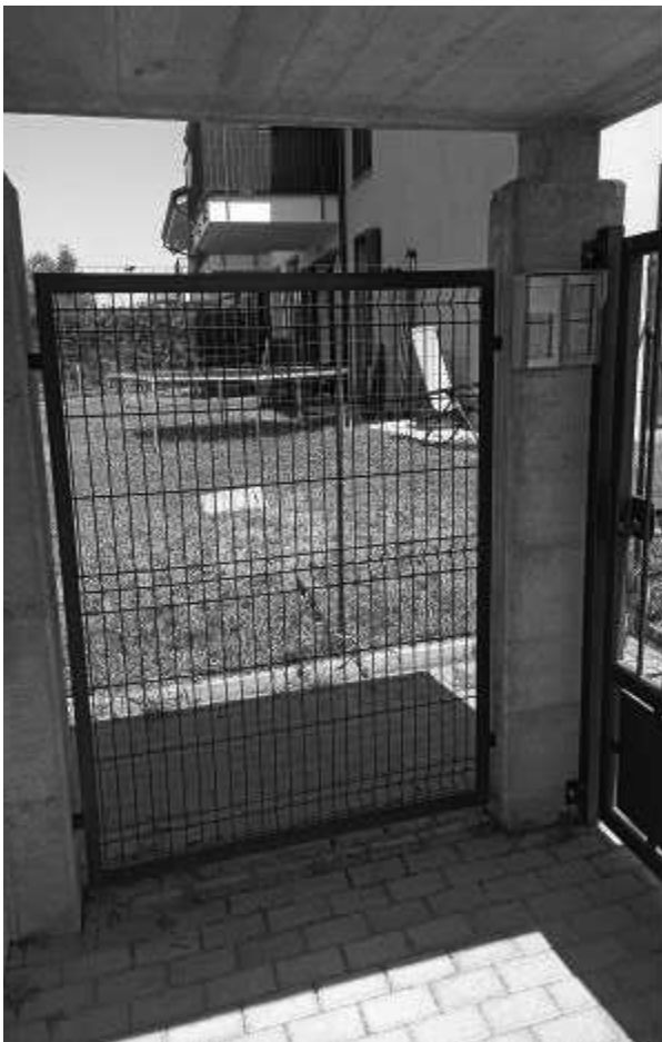
Accesso pedonale al condominio