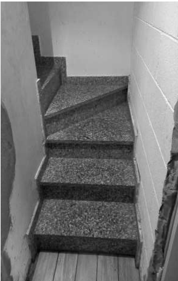
SCALA INTERNA PT - 1PS