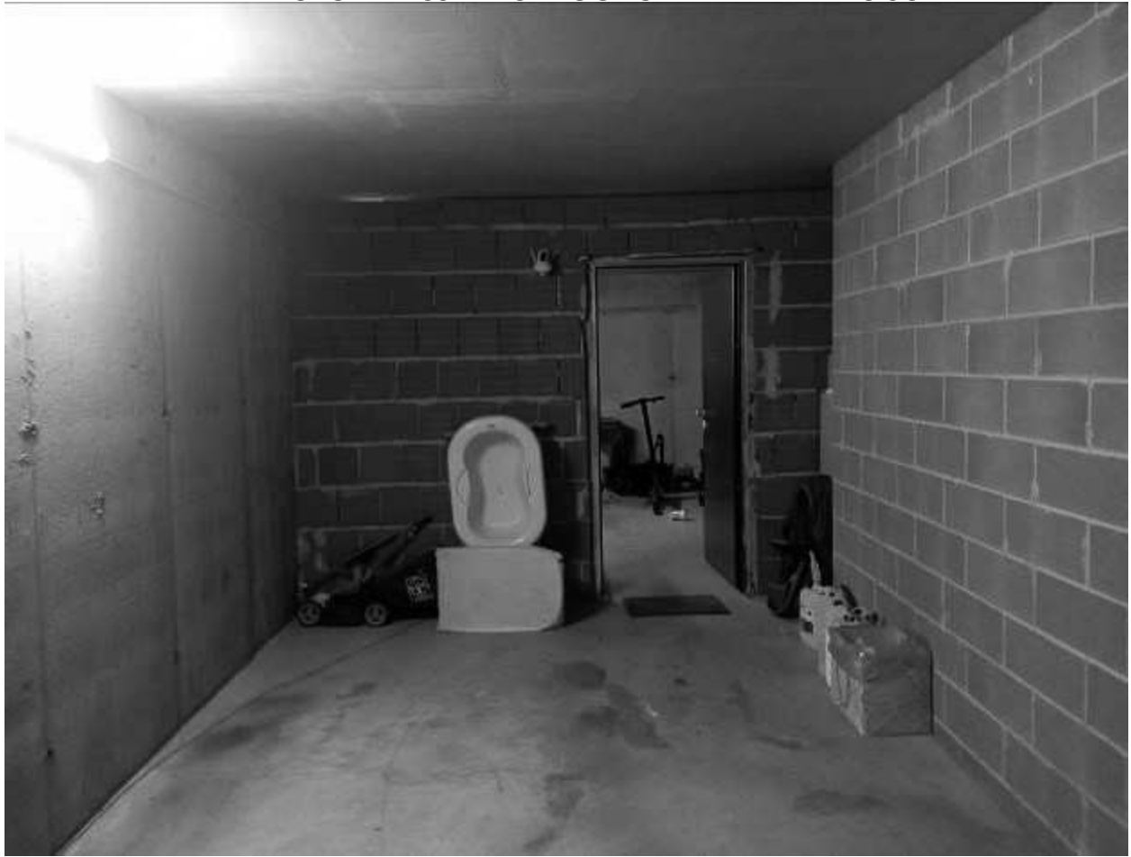
AUTORIMESSA - DIVISORIO NON AUTORIZZATO