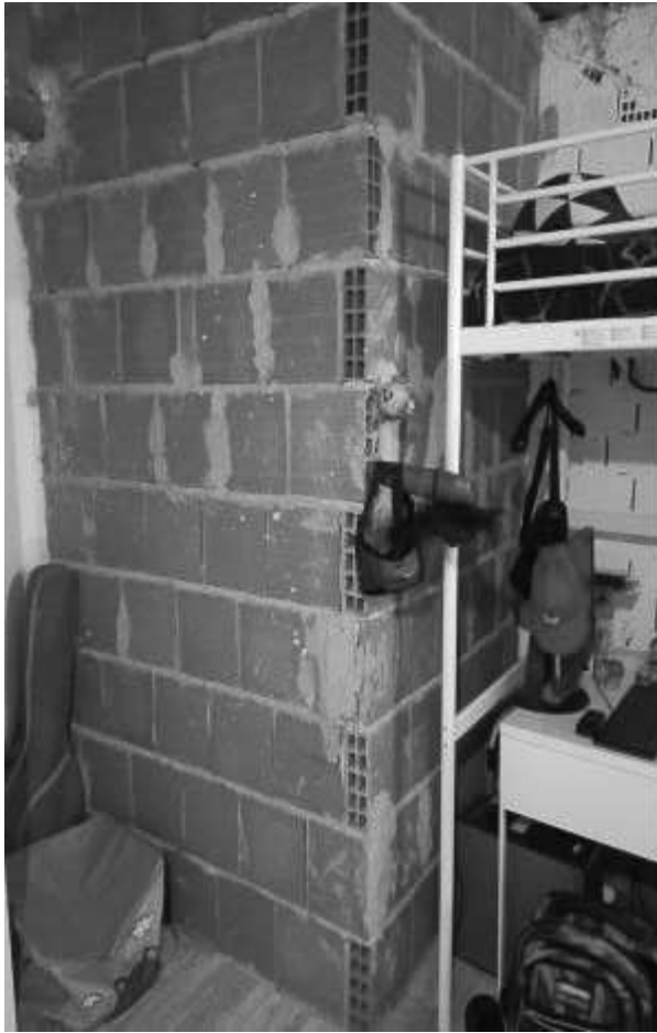
CANTINA - 1PS