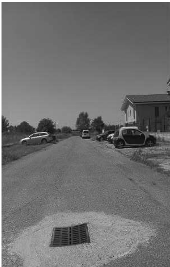
VIA ELSA MORANTE