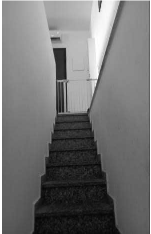
SCALA INTERNA PT - 1PS