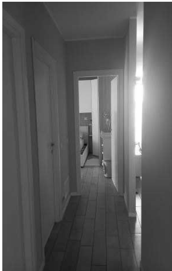
Disimpegno su zona notte