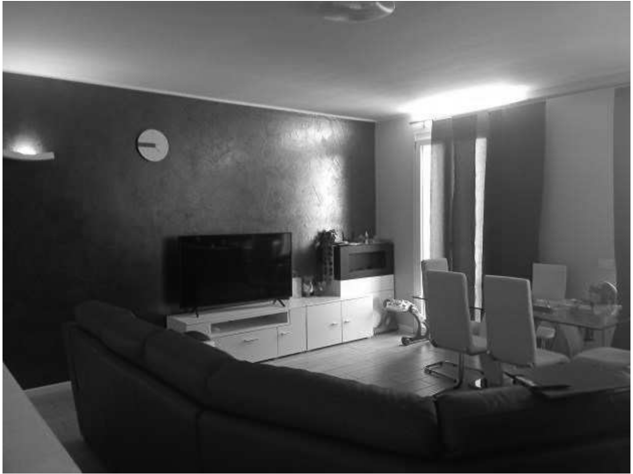
Ingresso su soggiorno cucina