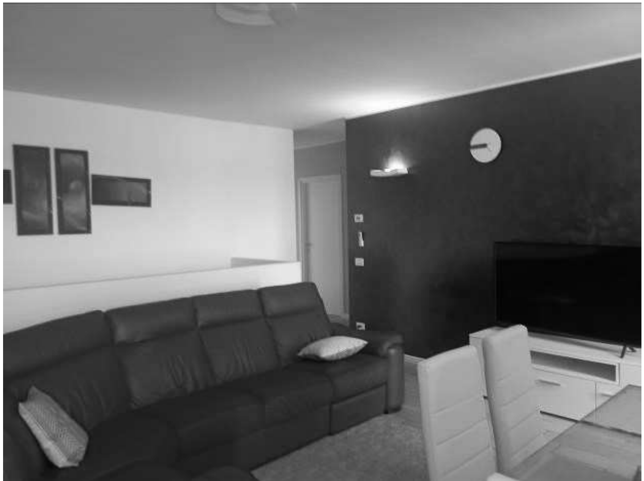
Ingresso su soggiorno cucina