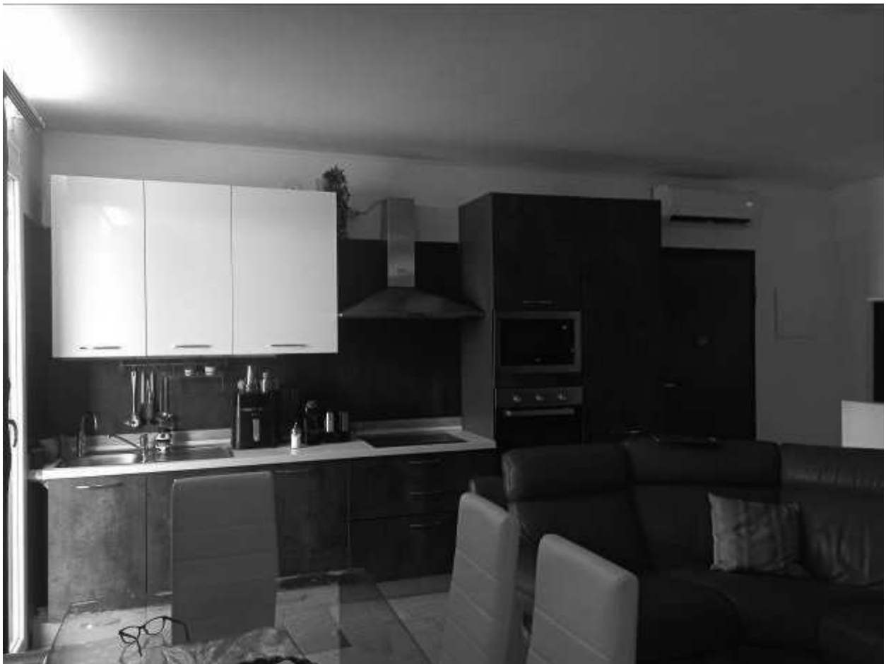
Ingresso su soggiorno cucina