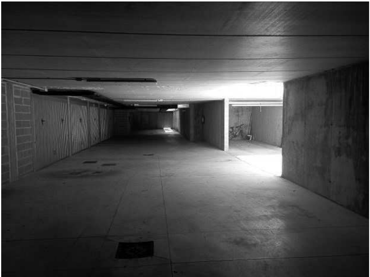
SPAZIO MANOVRA CONDOMINIALE 1PS