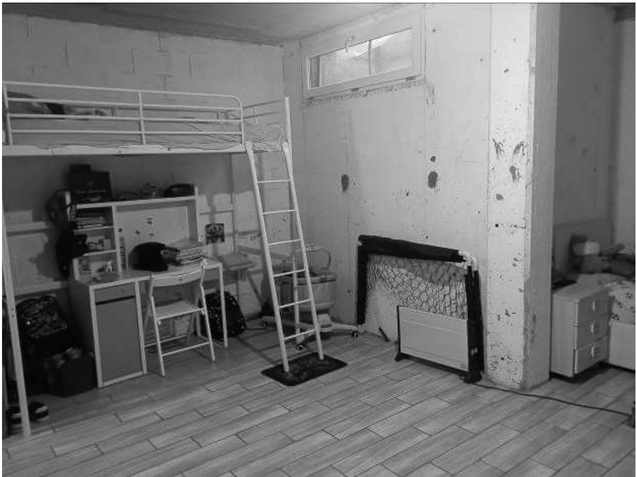
CANTINA - 1PS