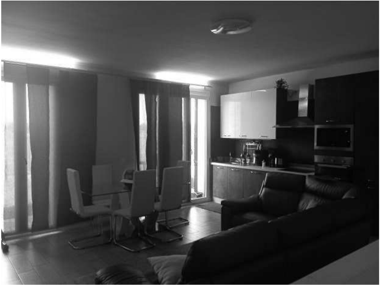
Ingresso su soggiorno cucina