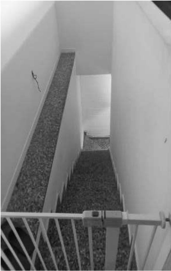
SCALA INTERNA PT - 1PS