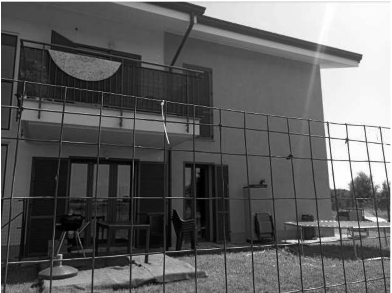
Prospetto lato Nord