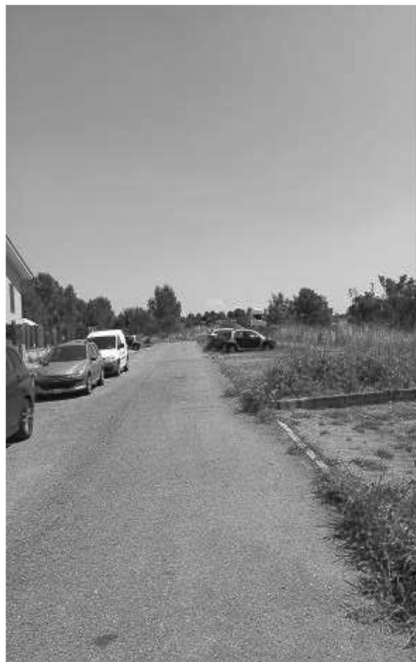
VIA ELSA MORANTE