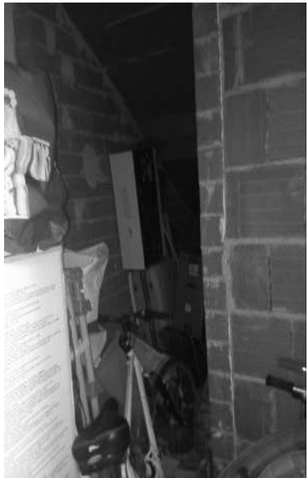
PORZIONE DI CANTINA MODIFICATA