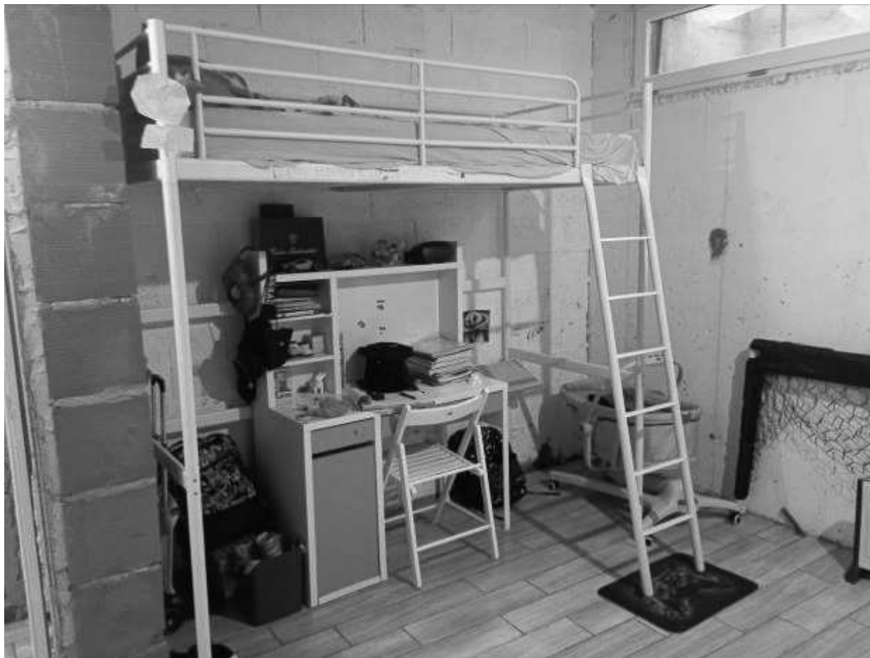
CANTINA - 1PS