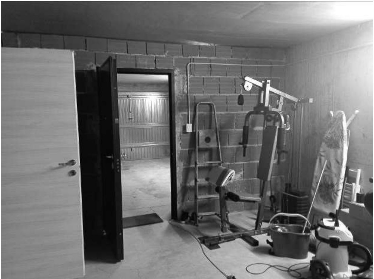
AUTORIMESSA - DIVISORIO NON AUTORIZZATO