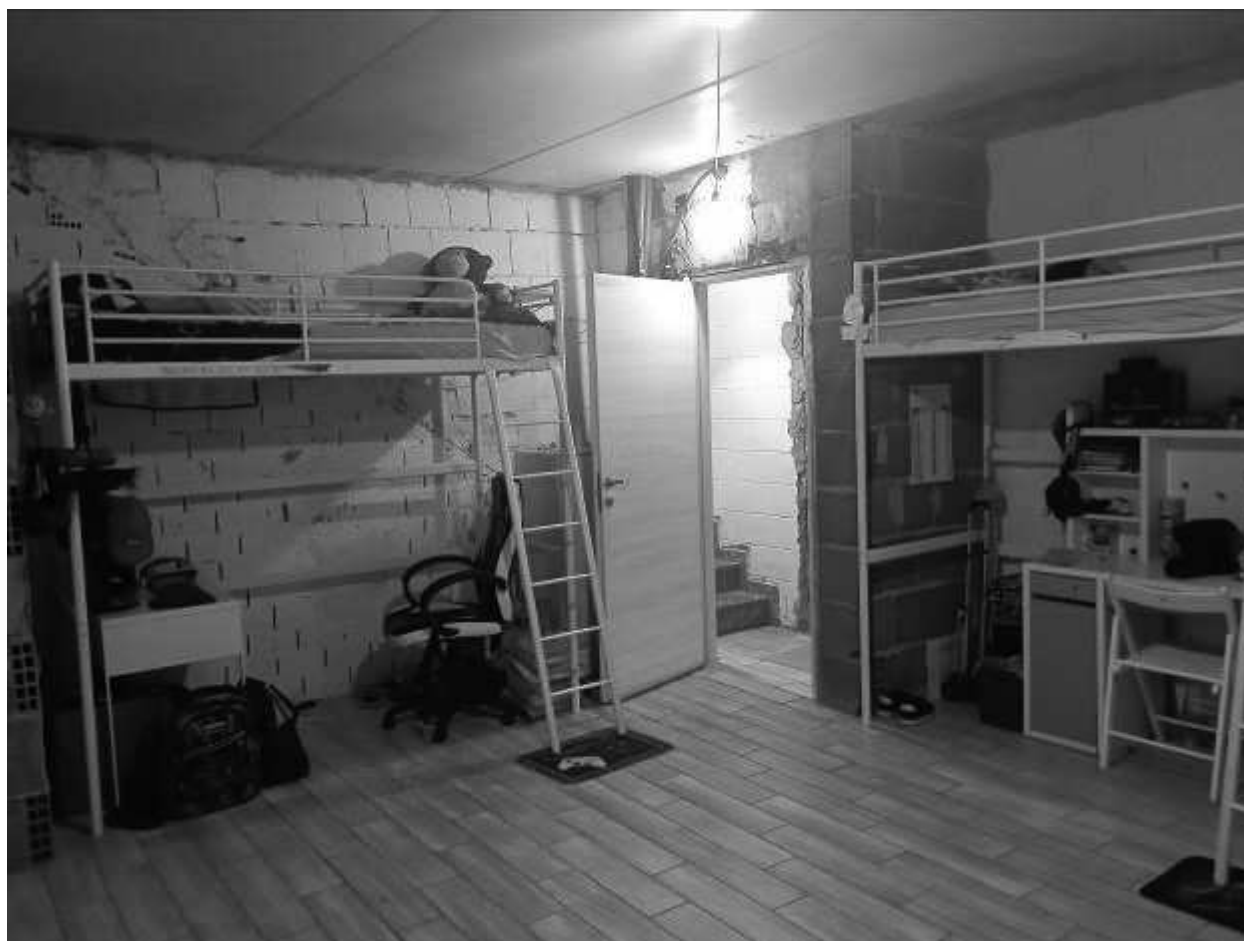
CANTINA - 1PS