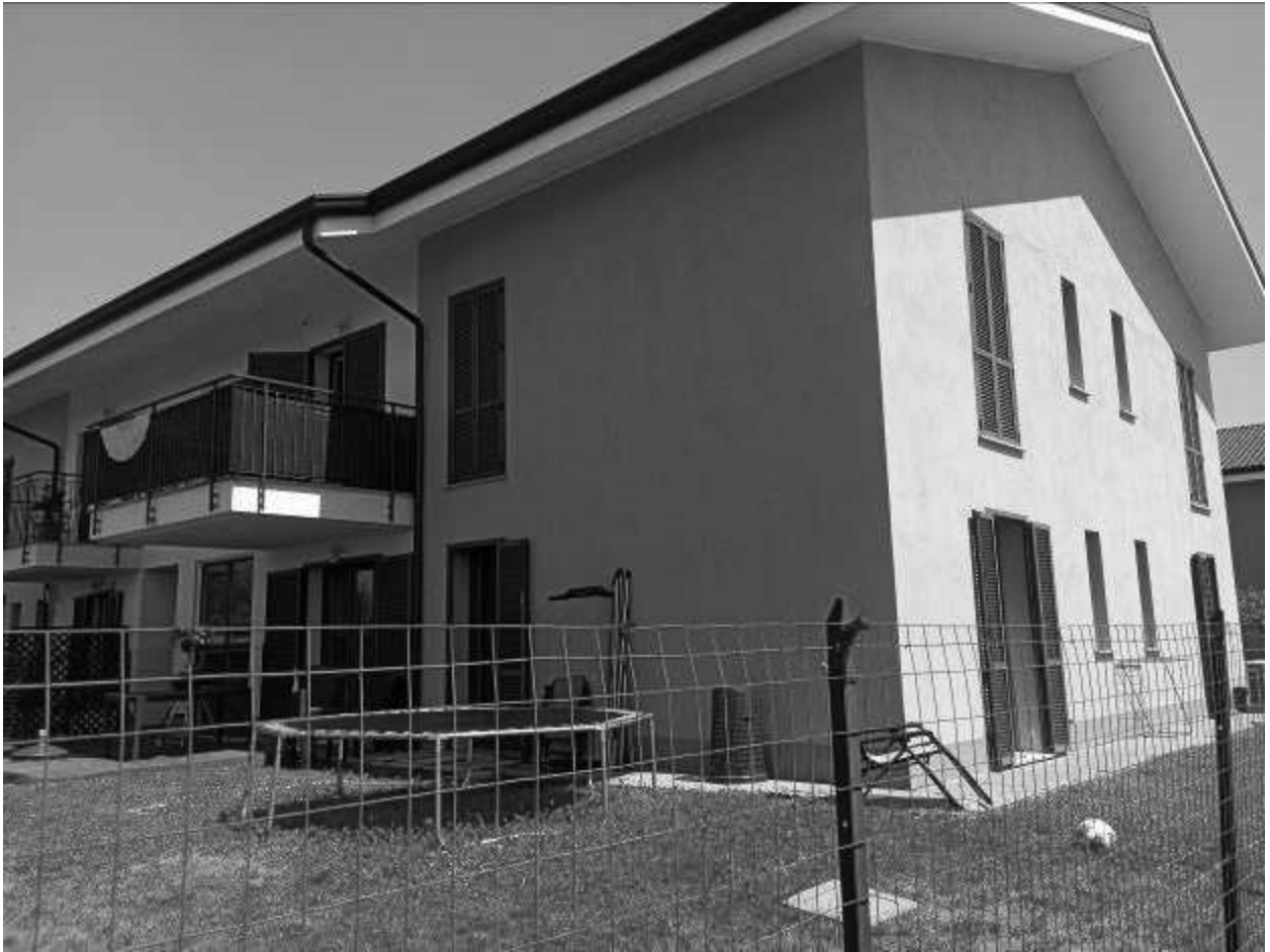
Prospetto lato Nord Ovest