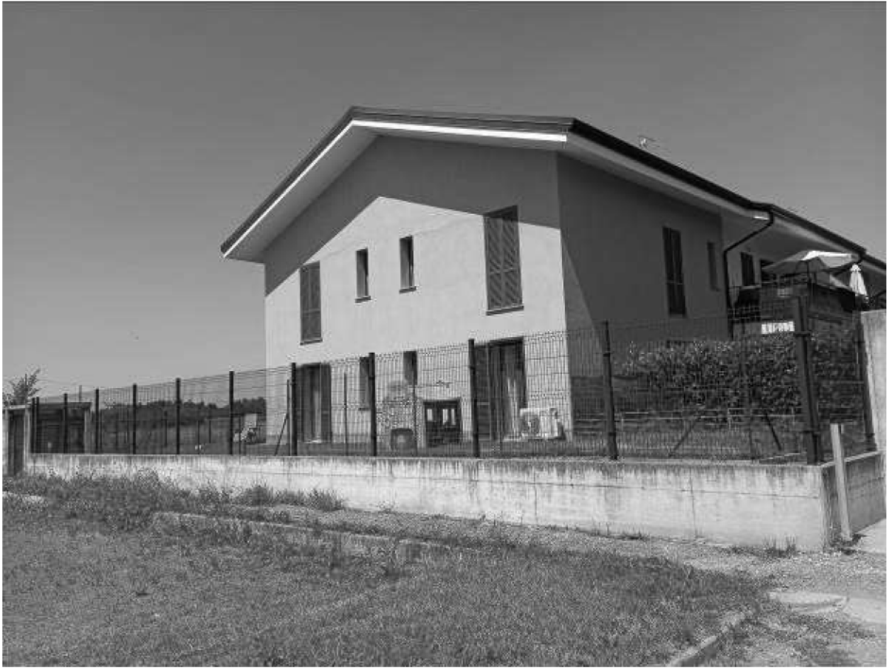
Prospetto Lato Sud Ovest