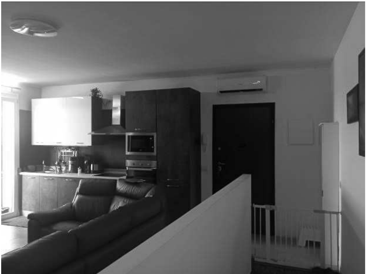
Ingresso su soggiorno cucina