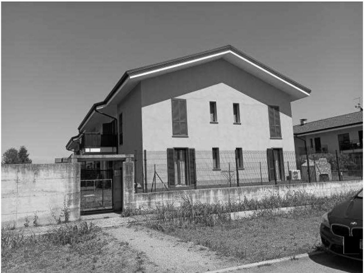
Prospetto Lato Sud Ovest