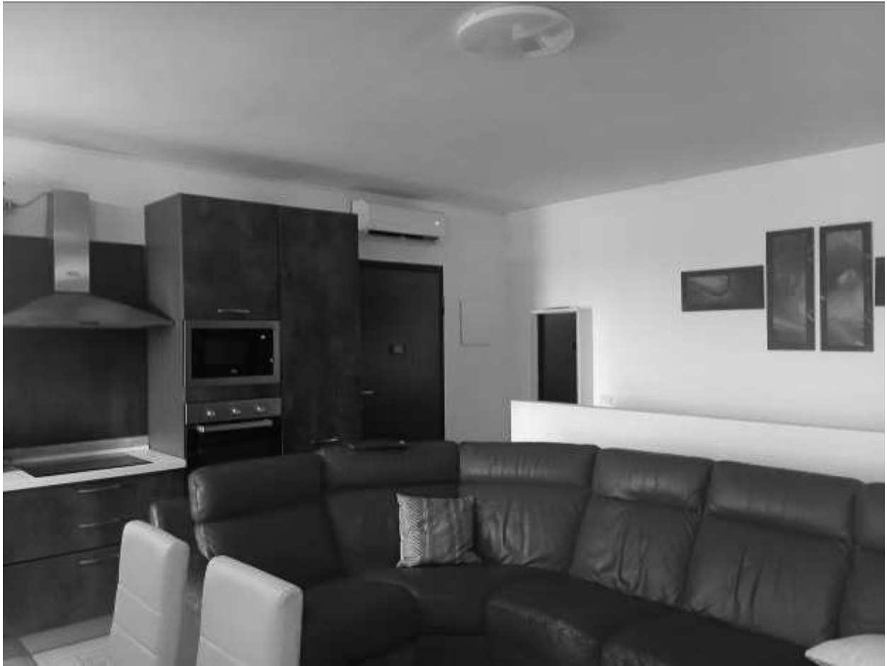
Ingresso su soggiorno cucina