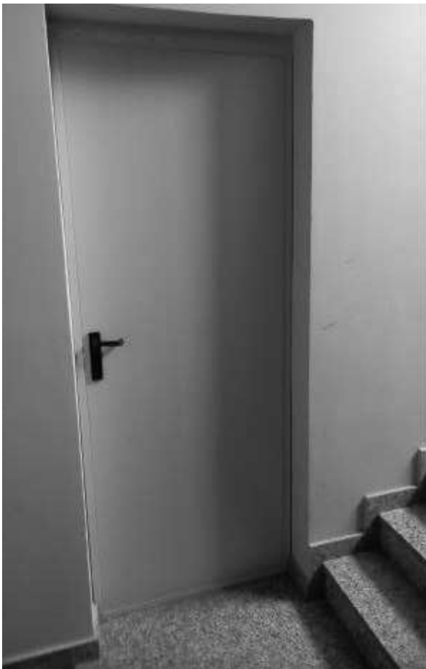
ACCESSO ALLA CANTINA 1PS