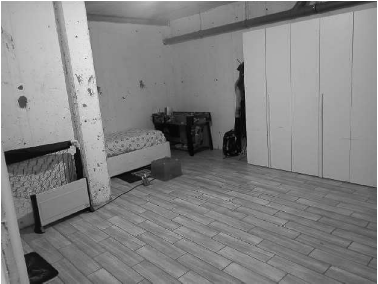
CANTINA - 1PS