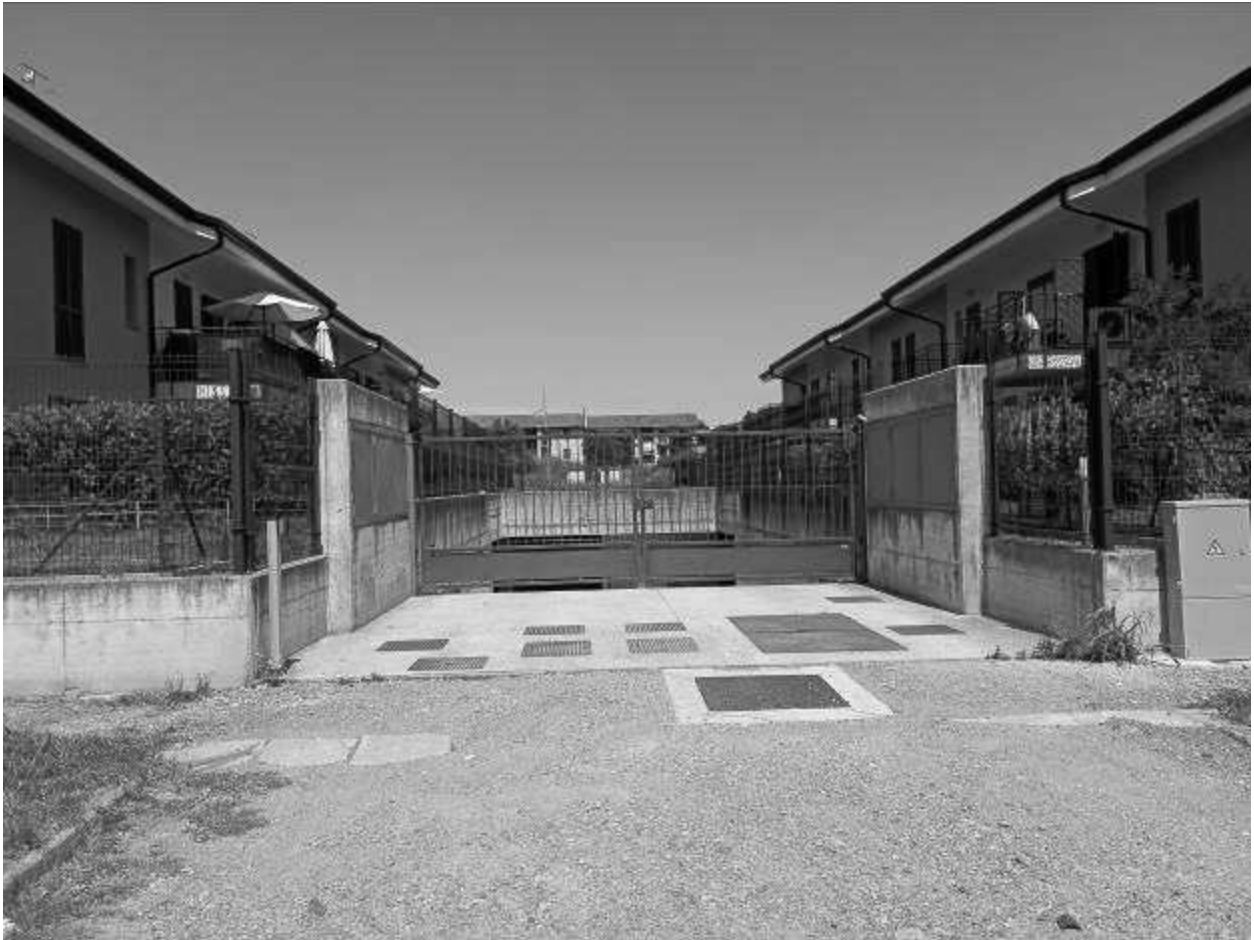
Accesso carrabile al 1PS