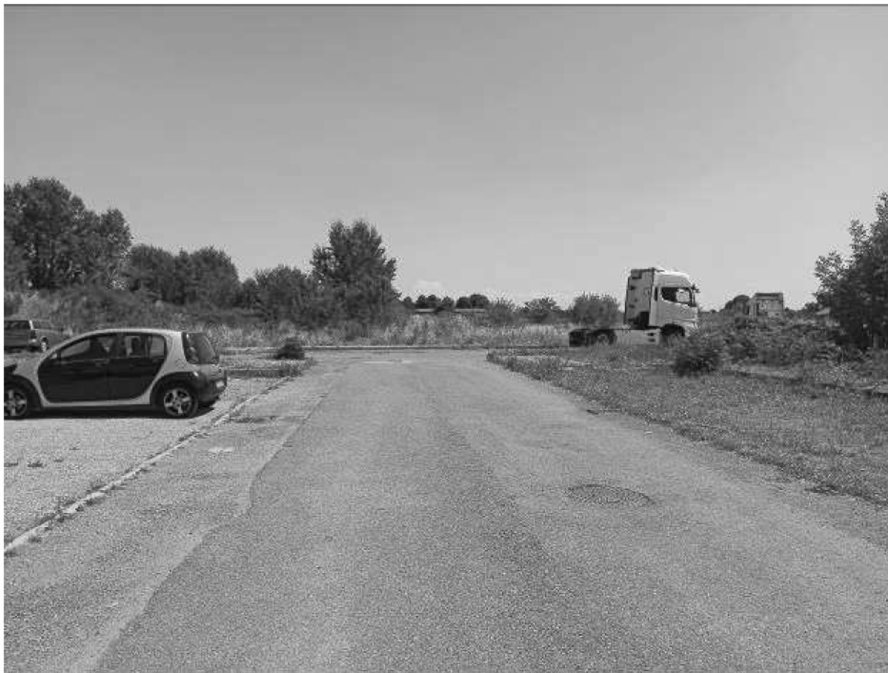
VIA ELSA MORANTE