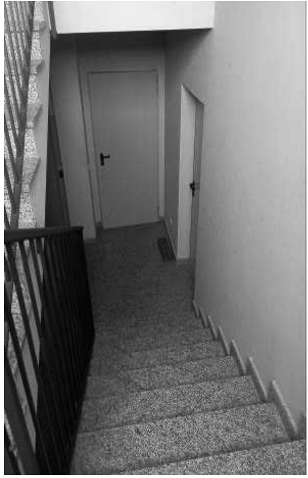
VANO SCALA CONDOMINIALE 1PS