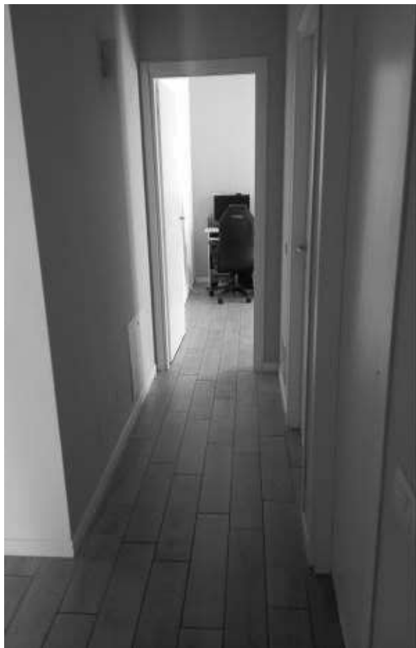
Disimpegno su zona notte