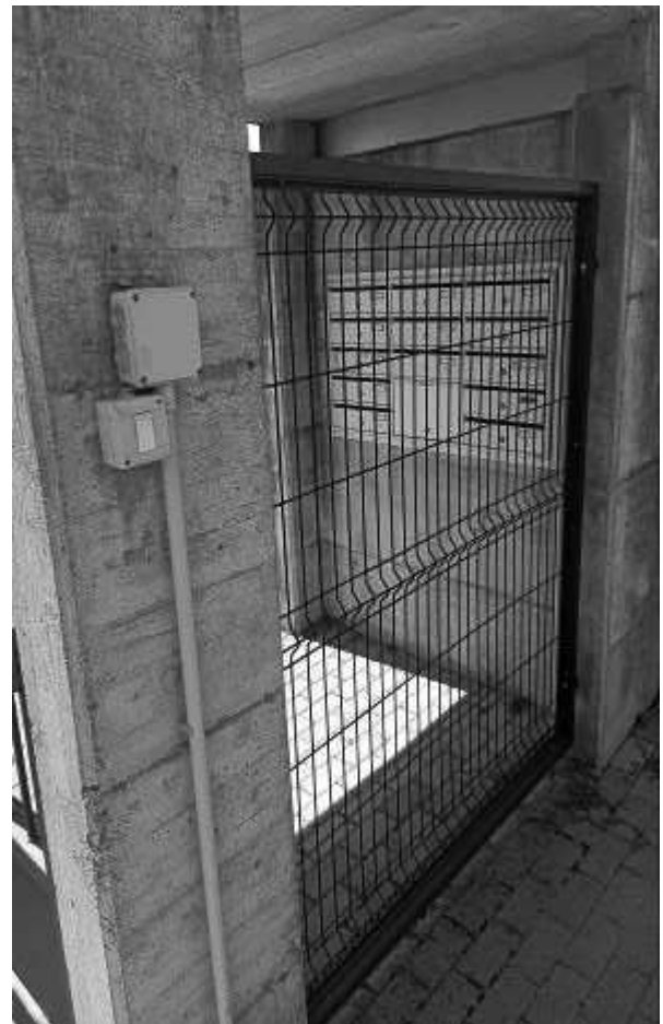
Accesso pedonale al condominio