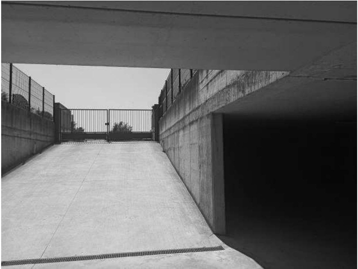
RAMPA DI ACCESSO CONDOMINIALE AL 1PS