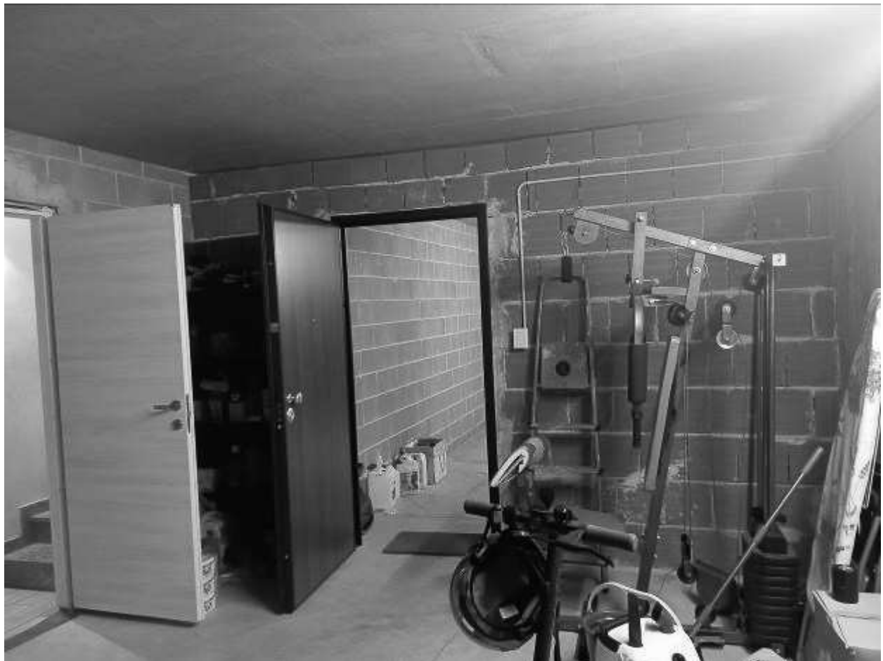
AUTORIMESSA - DIVISORIO NON AUTORIZZATO