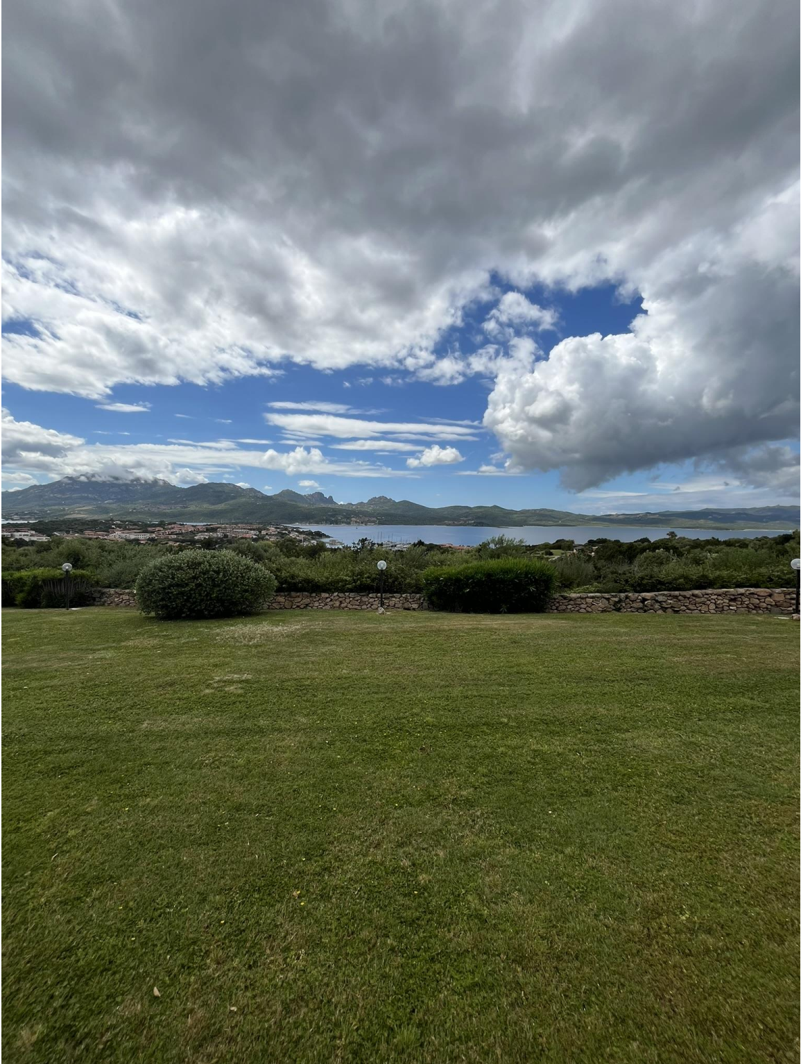
Vista dalla veranda coperta