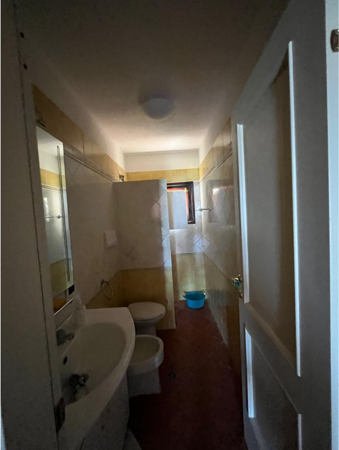
Bagno di servizio