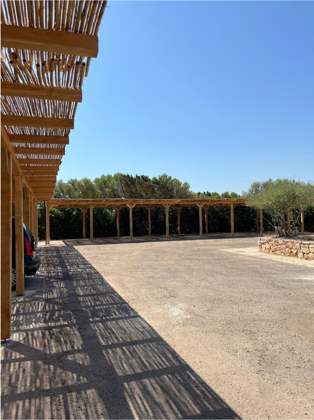
Posti auto condominiali