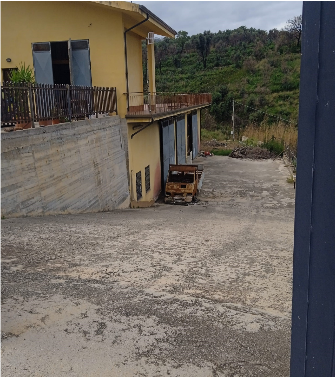
Foto n. 4 strada di accesso al magazzino seminterrato