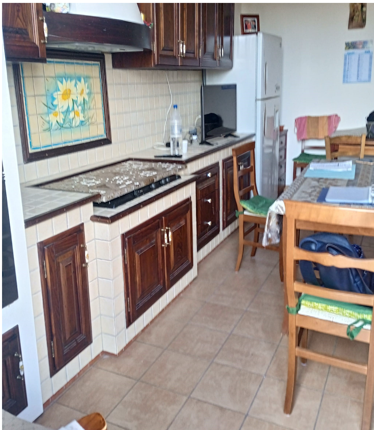
Foto n. 9 Interno uffici utilizzato anche come angolo cottura