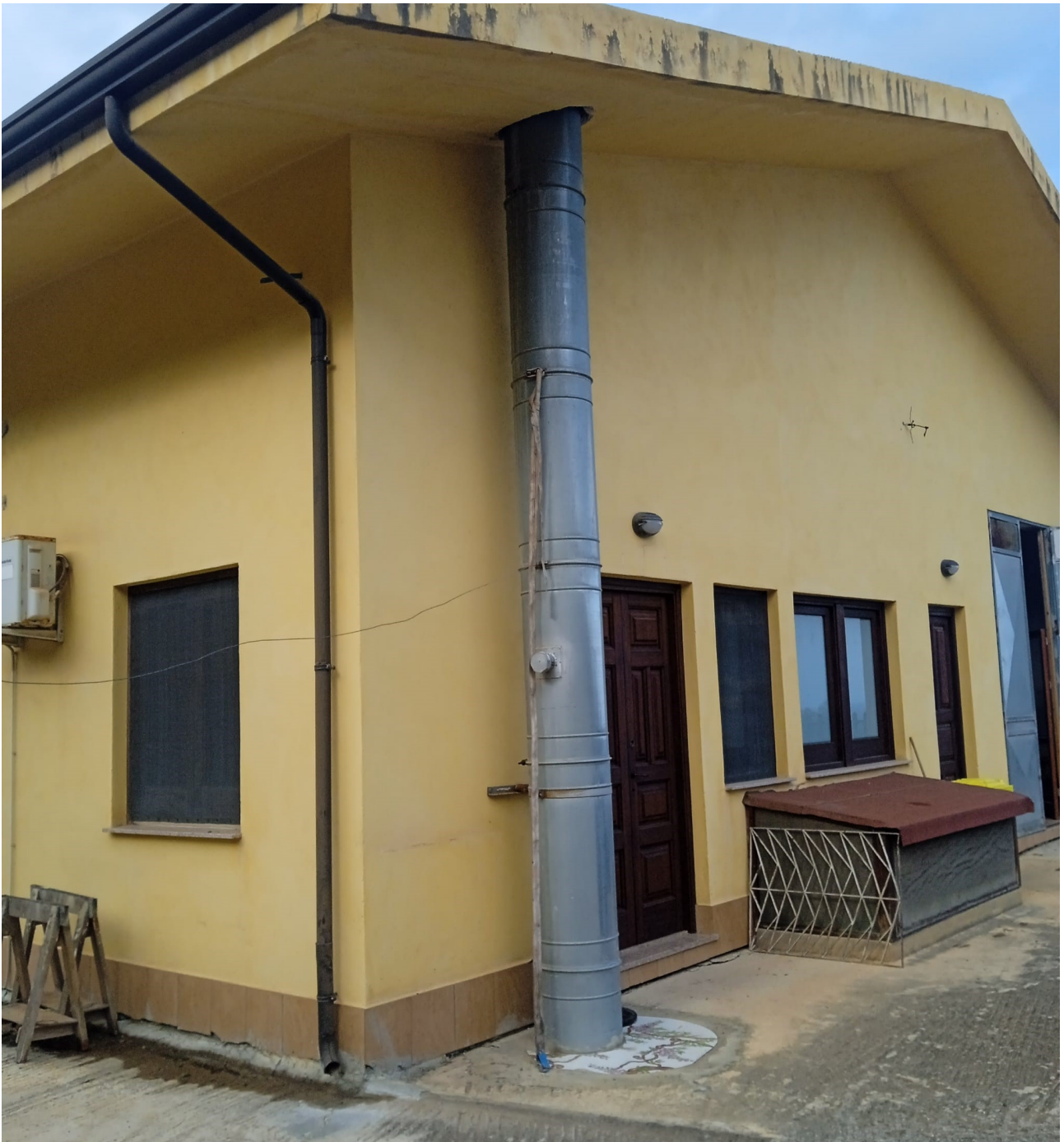
Foto n.1 Comune di Sant'Agata di Militello foglio 3 particella 1578 Esterno fabbricato lato est Uffici piano terra