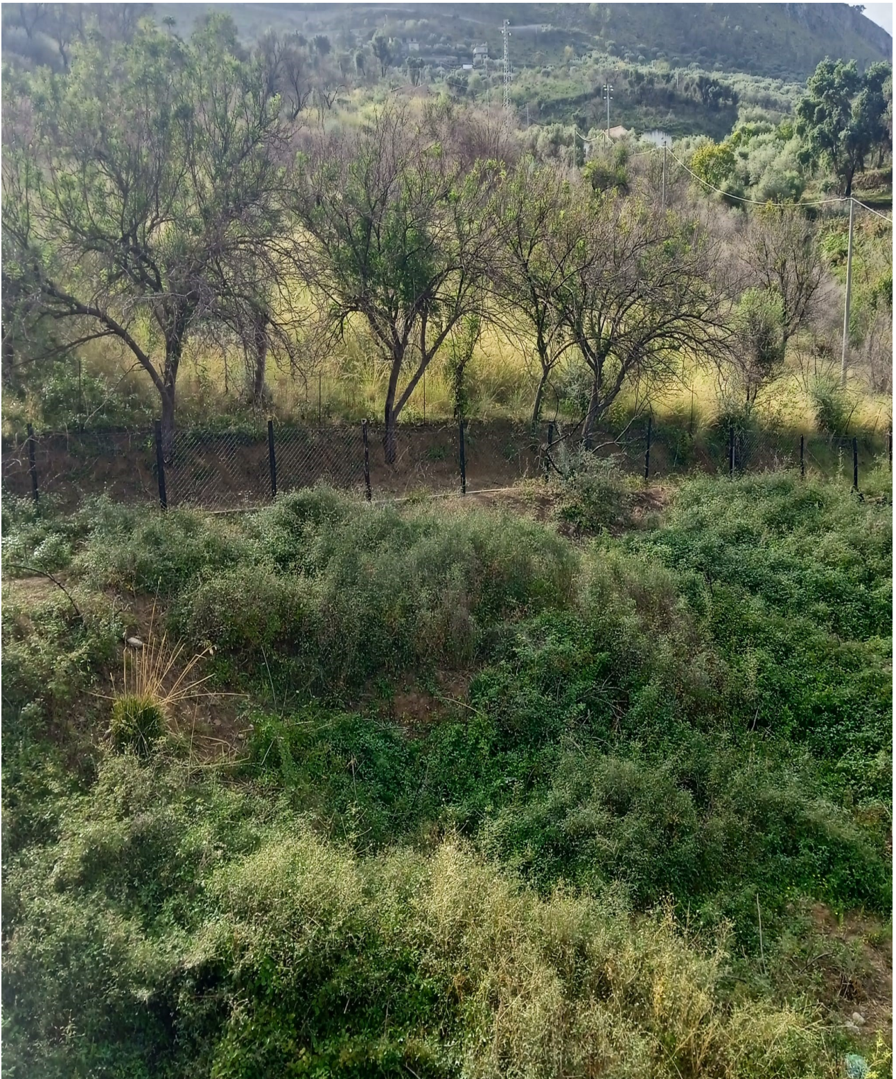
Foto n. 14 Uliveto Comune di Sant'Agata di Militello foglio 3 particella 603