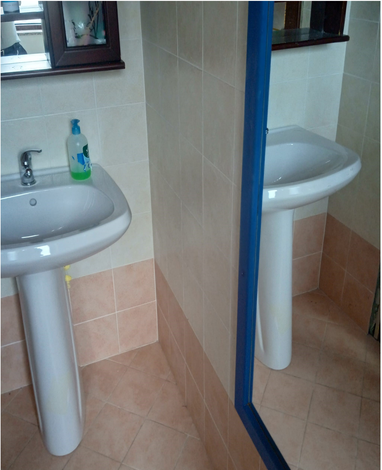
Foto n. 12 bagno interno uffici