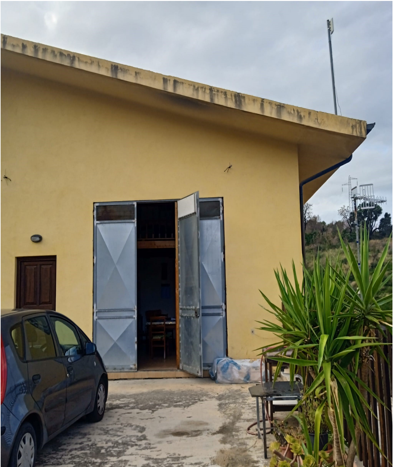
Foto n. 2 Ingresso magazzino e uffici