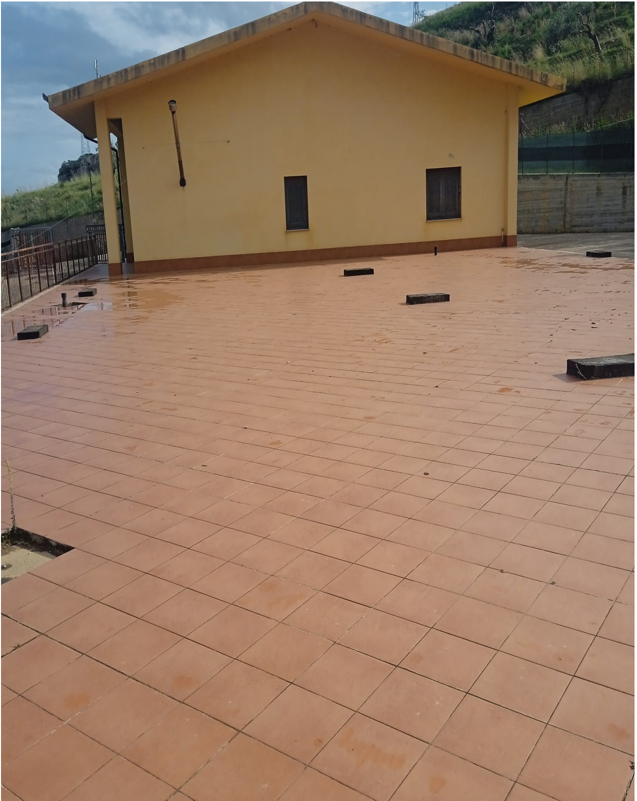
Foto n. 3 Terrazza calpestabile con fabbricato uffici