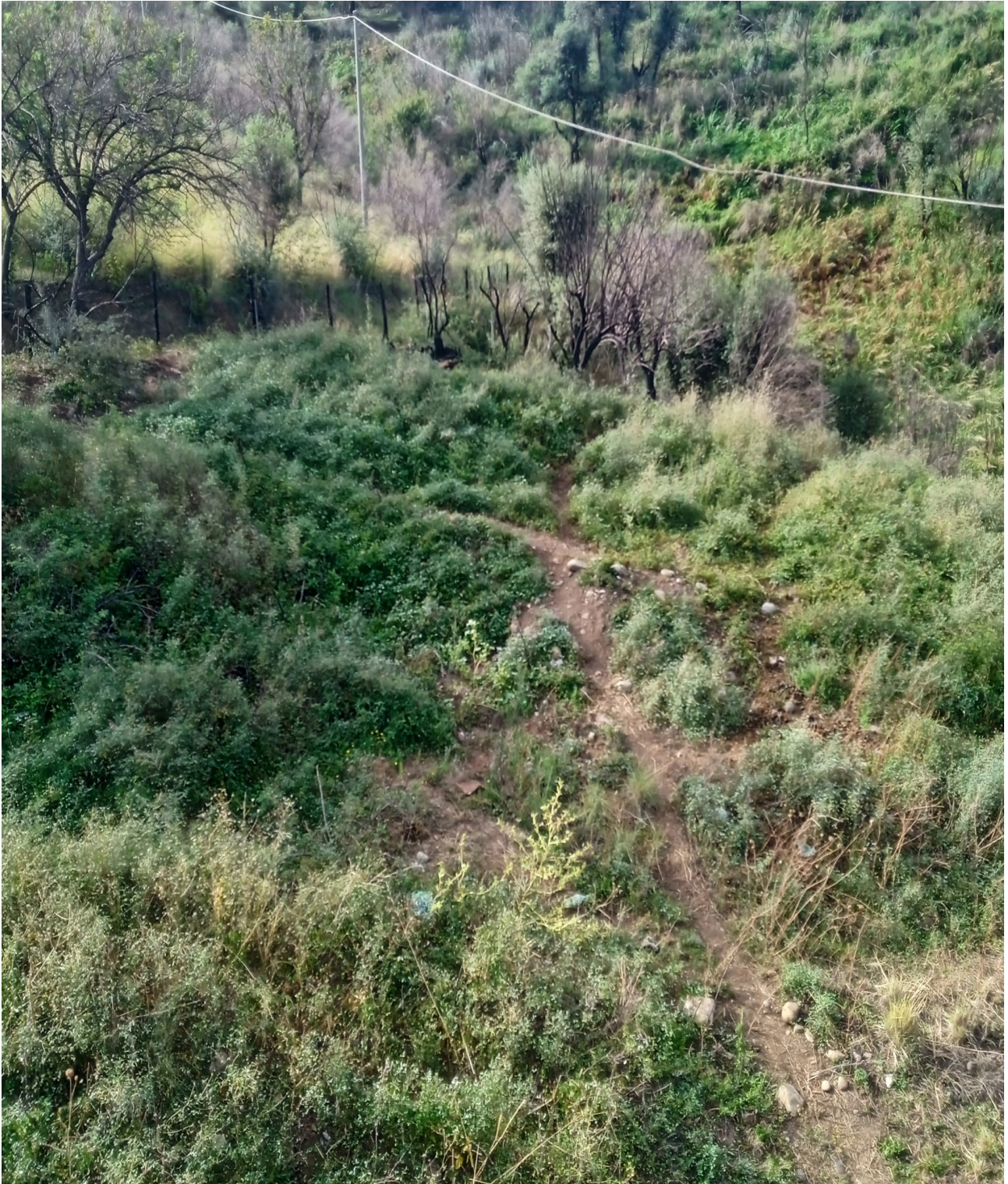
Foto n. 16 Comune di Sant'Agata di Militello foglio 3 particella 823 Terreno uliveto e pascolo