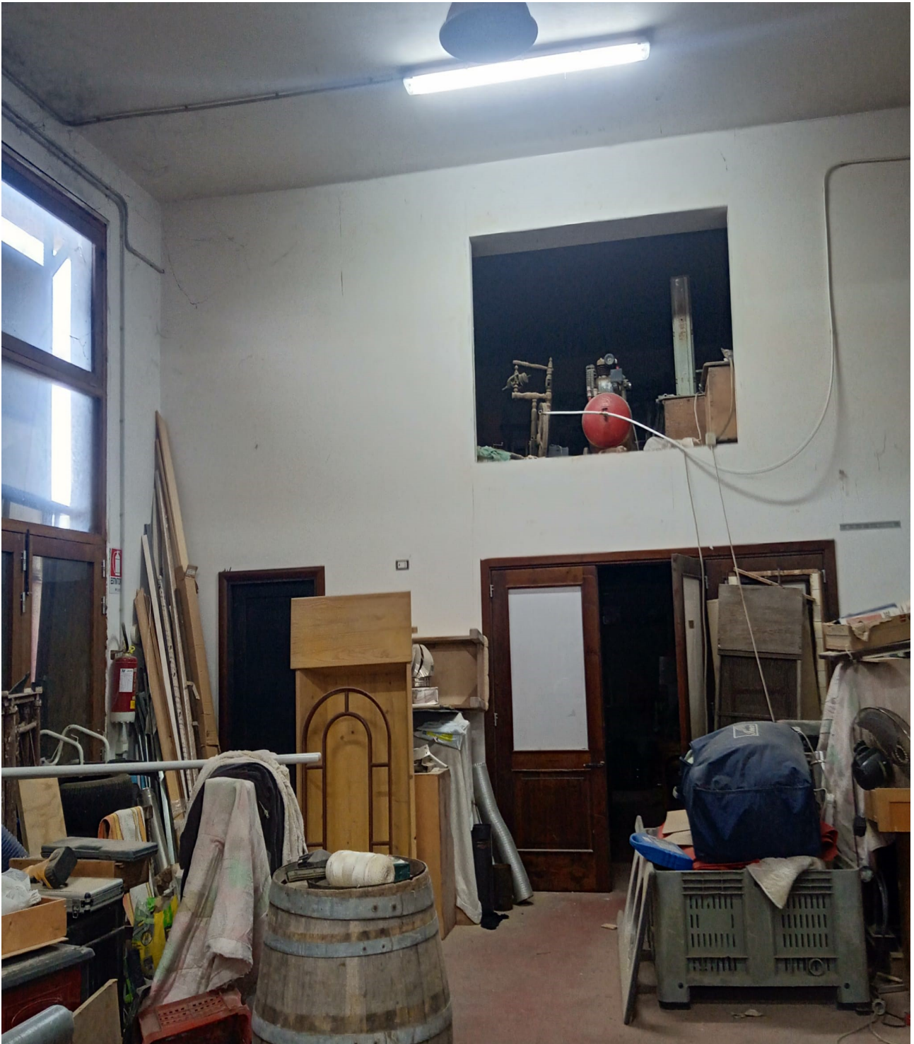
Foto n. 7 Interno falegnameria con soppalco