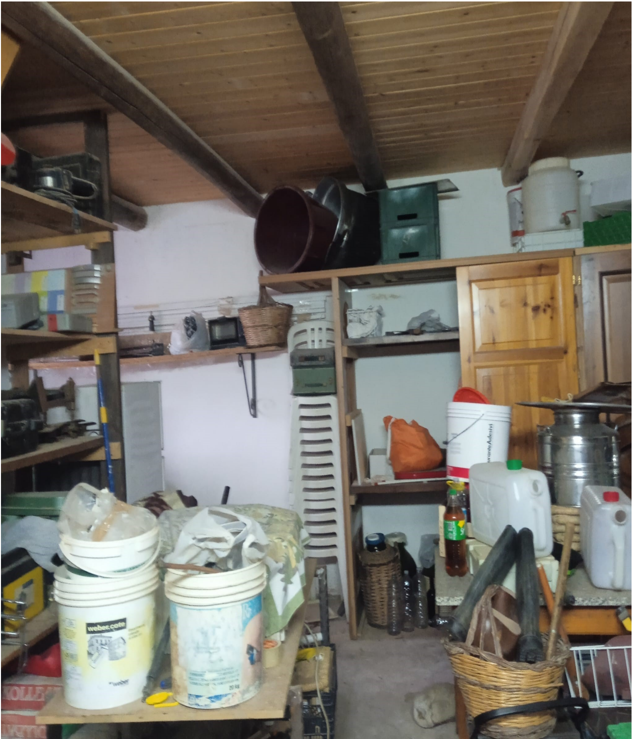
Foto n. 8 Interno magazzino con soppalco