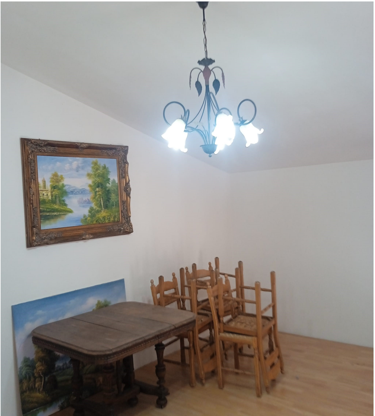
Foto n. 10 soppalco utilizzato come soggiorno