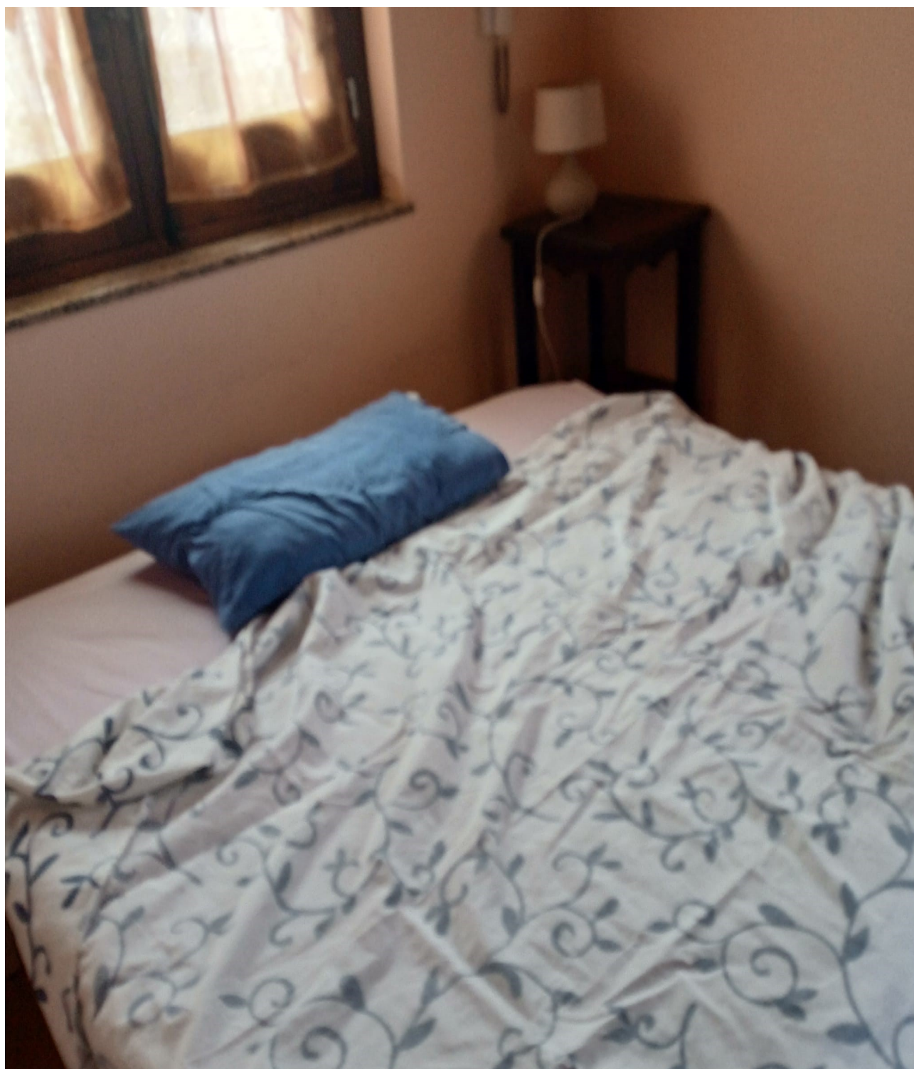
Foto n. 11 camera da letto