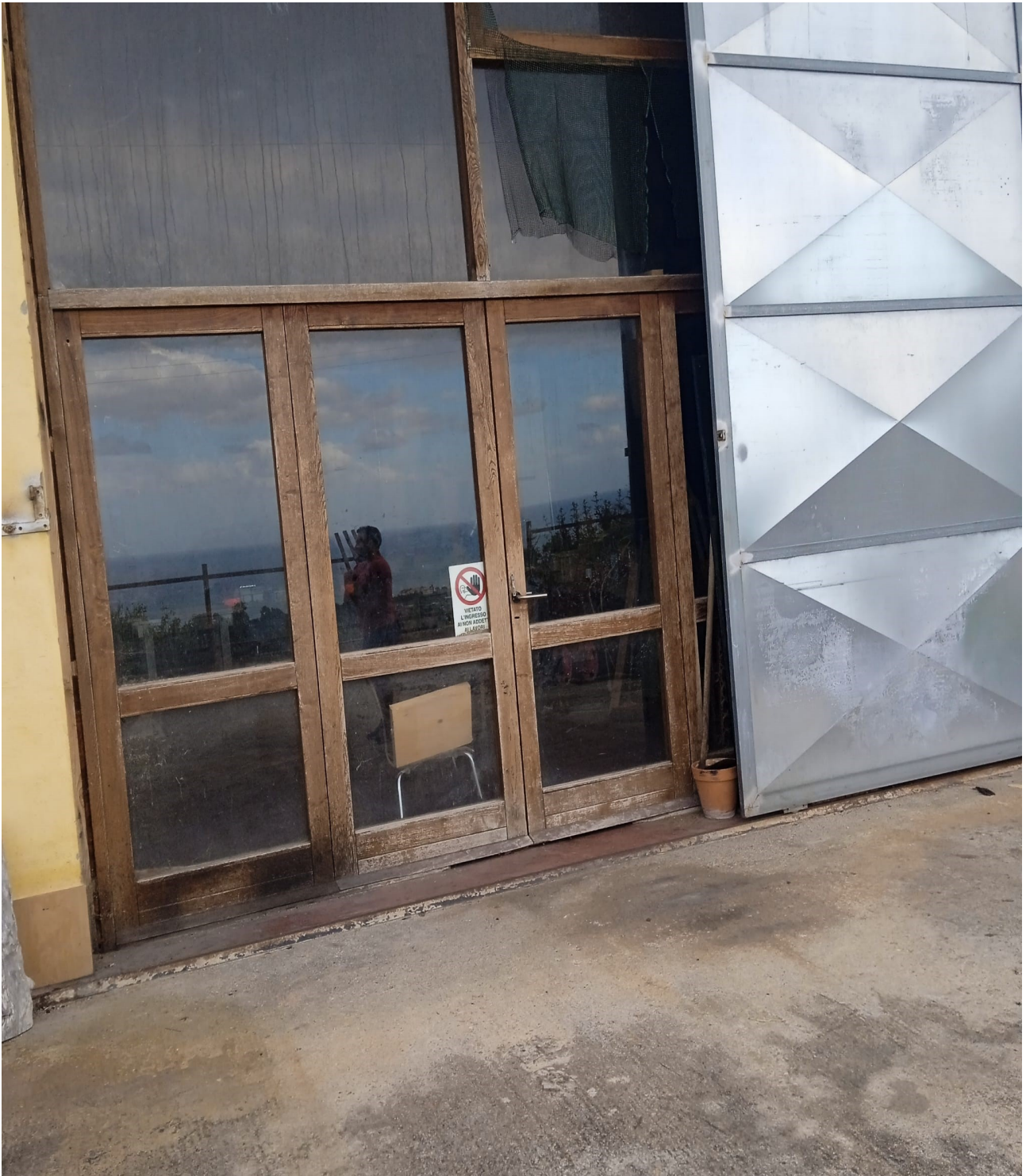
Foto n. 6 Porta ingresso magazzino laboratorio con porta a vetri