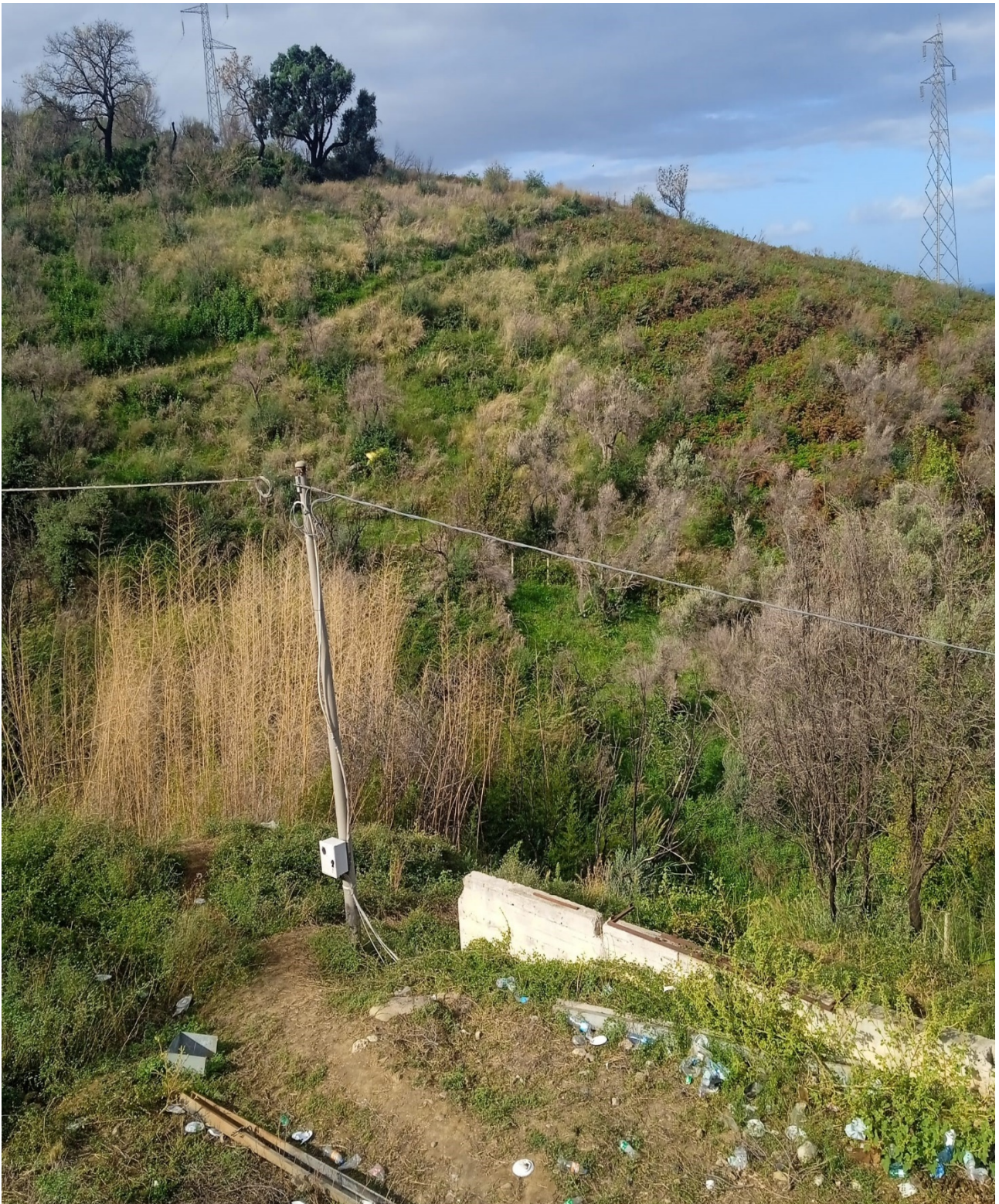
Foto n. 15 Comune di Sant'Agata di Militello foglio 3 particella 823 uliveto e pascolo