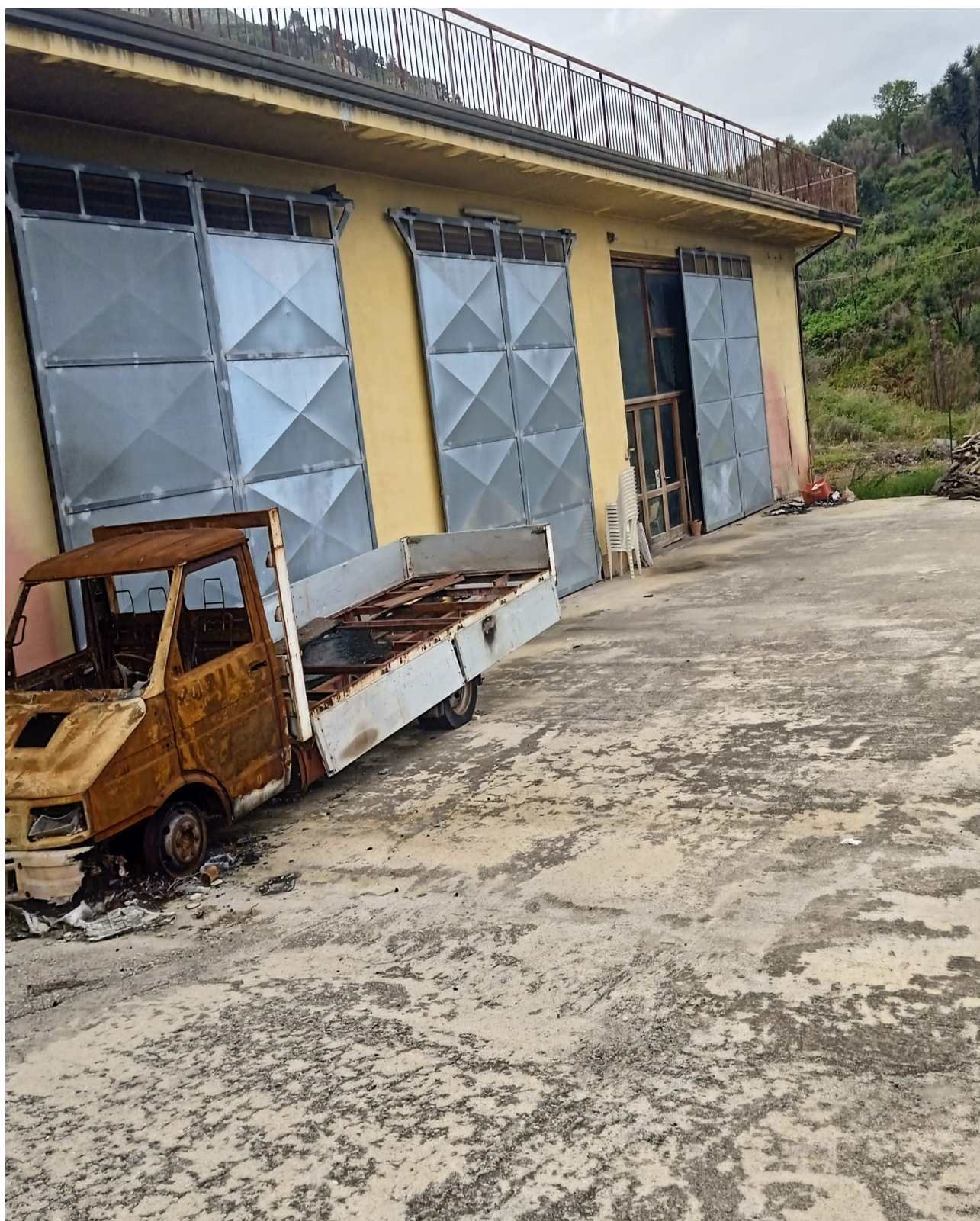
Foto n. 5 Portoni ingresso al magazzino laboratorio di falegnameria