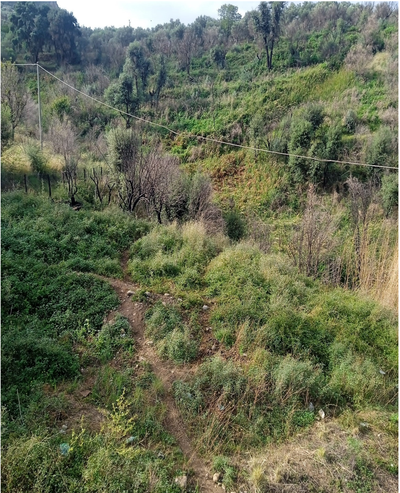
Foto n. 13 Terreno uliveto e pascolo Comune di Sant'Agata di Militello foglio 3 particella 603