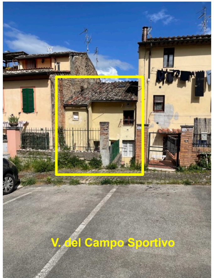
V. del Campo Sportivo