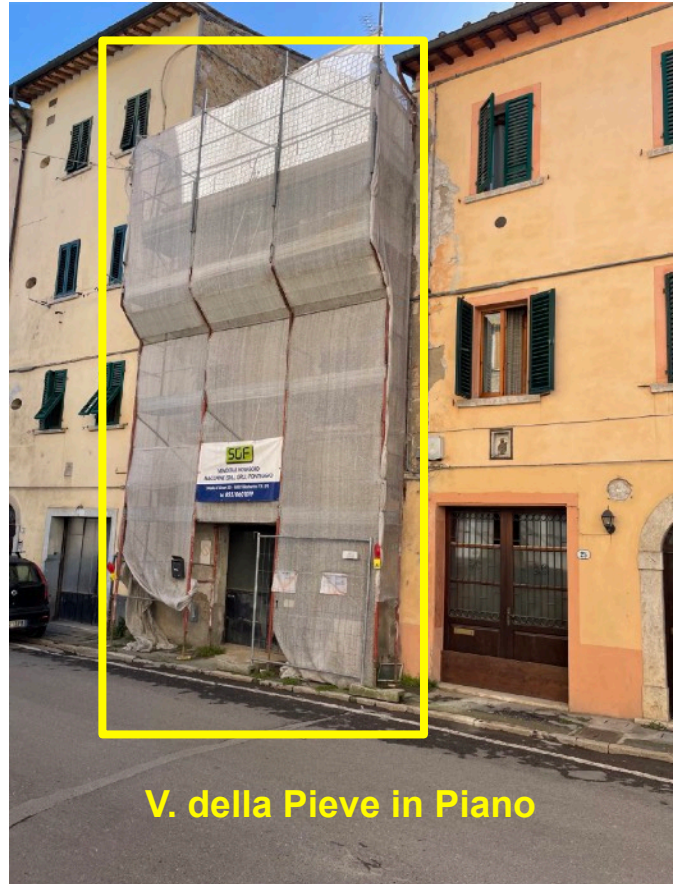
V. della Pieve in Piano