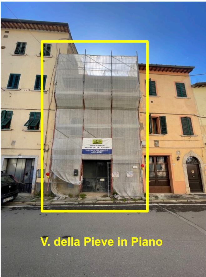
V. della Pieve in Piano