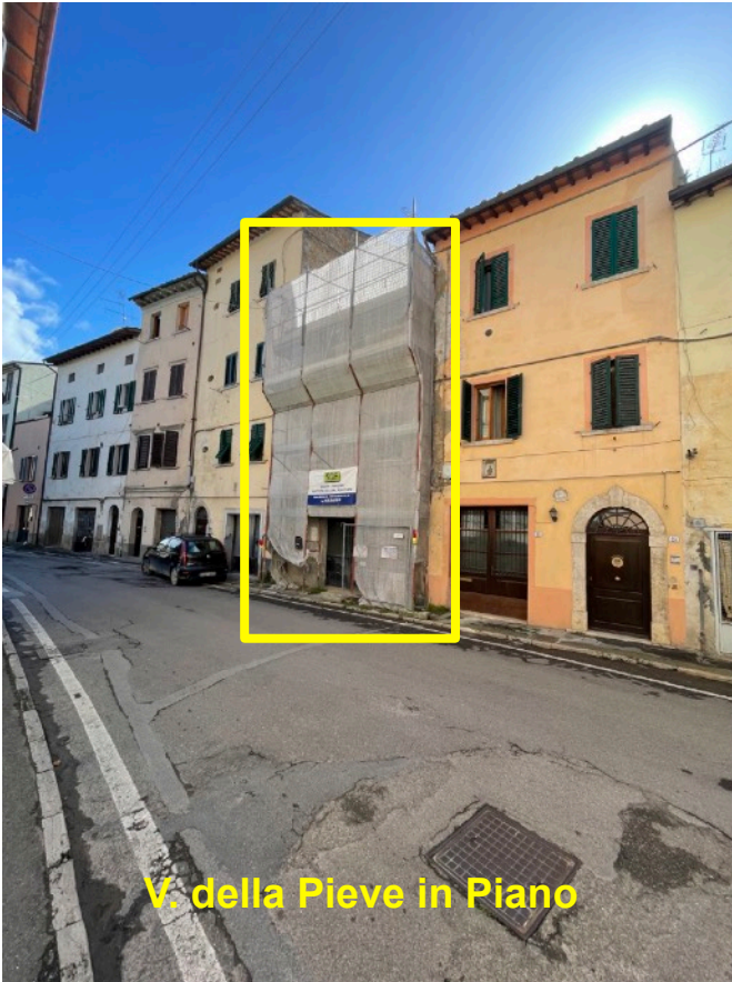
V. della Pieve in Piano