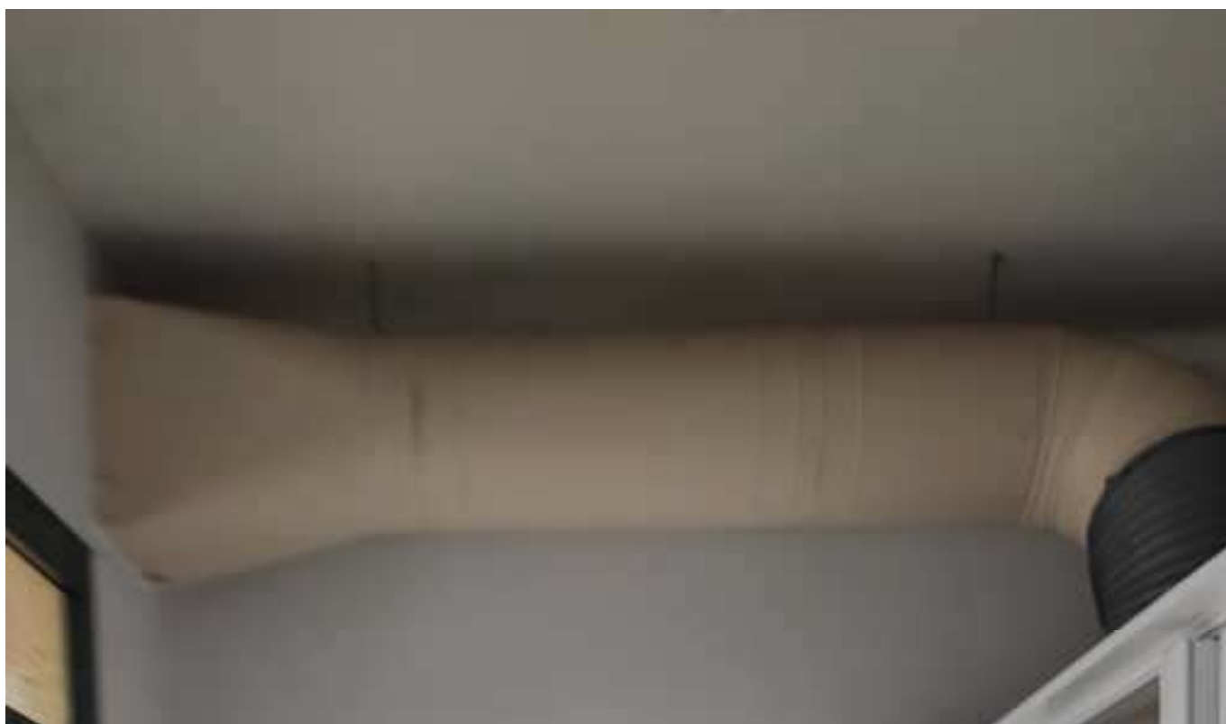
Foto 39 - DETTAGLIO IMPIANTO CANALE DI ESTRAZIONE ARIA