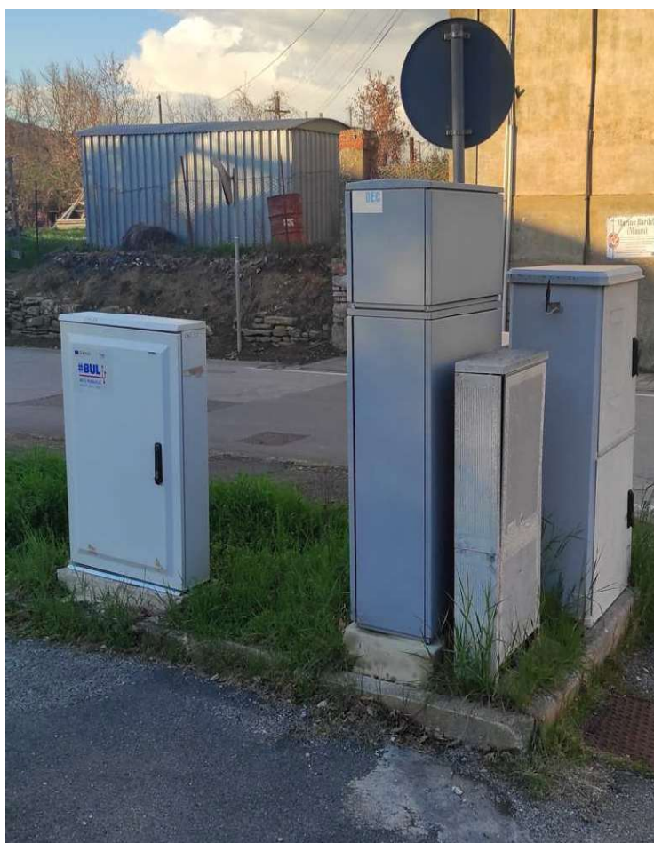
Foto 10 - VISTA DELL'AREA PERTINENZIALE PARCHEGGIO, SOTTOSERVIZI A SERVIZIO DELL'EDIFICIO E DELL'AREA