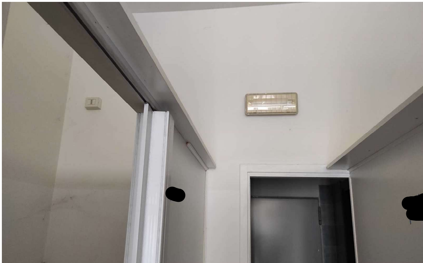
Foto 19 - STRUTTURA DEGLI ELEMENTI REMOVIBILI DI DIVISIONE DELLE CABINE DEL CENTRO ESTETICO