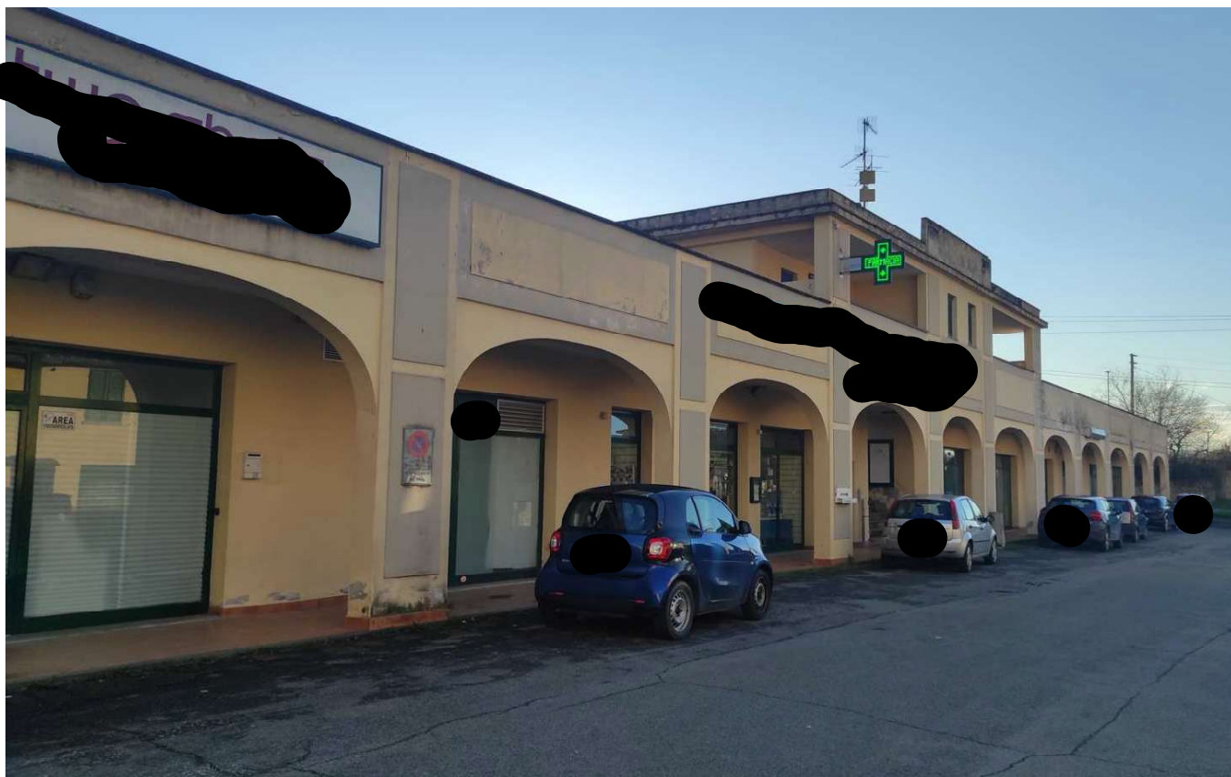
Foto 2 - VISTA DELL'AREA ESTERNA SUL FABBRICATO