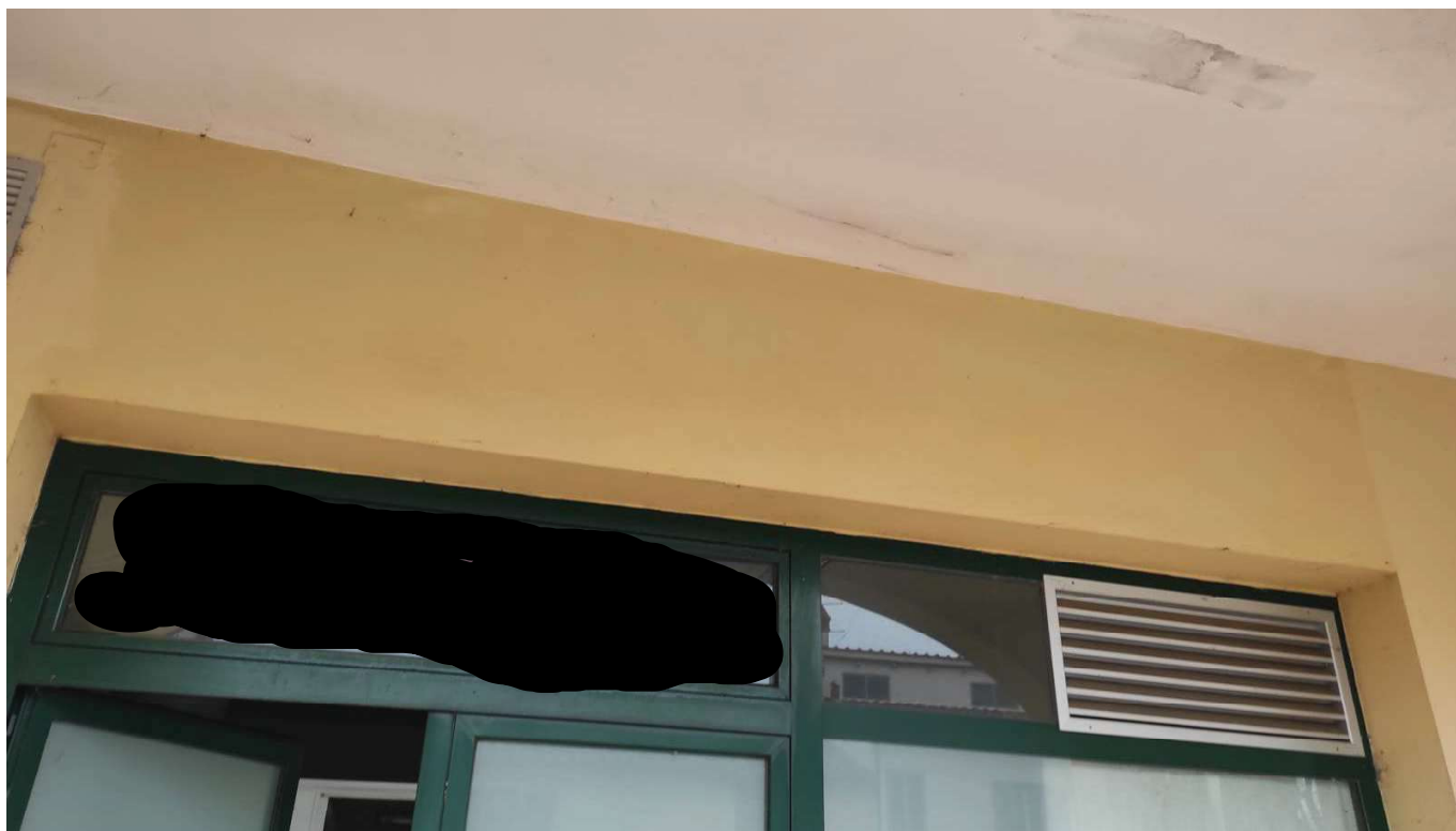
Foto 44 - DETTAGLIO GRIGLIA SU FACCIATA ESTERNA PER MACCHINA MOTOCONDENSANTE