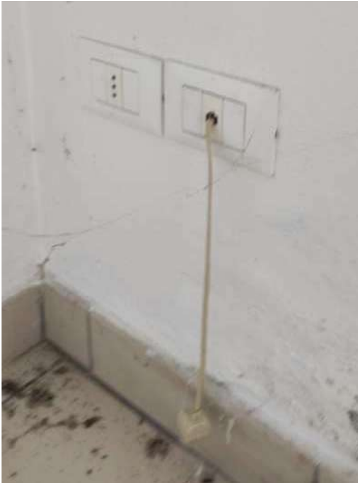
Foto 47 - DETTAGLIO IMPIANTO RETE DATI