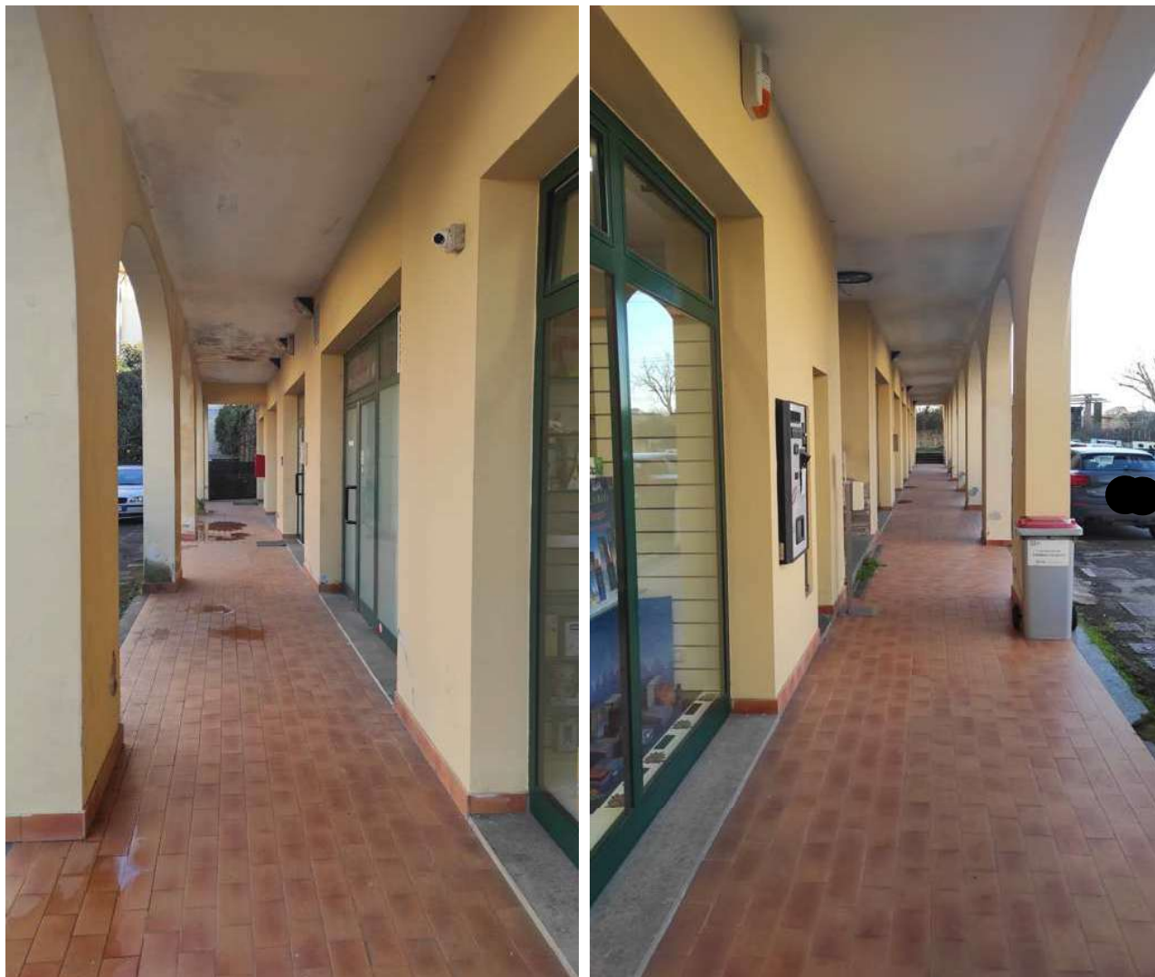
Foto 5, 6 - VISTA DELL'AREA ESTERNA - PORTICO