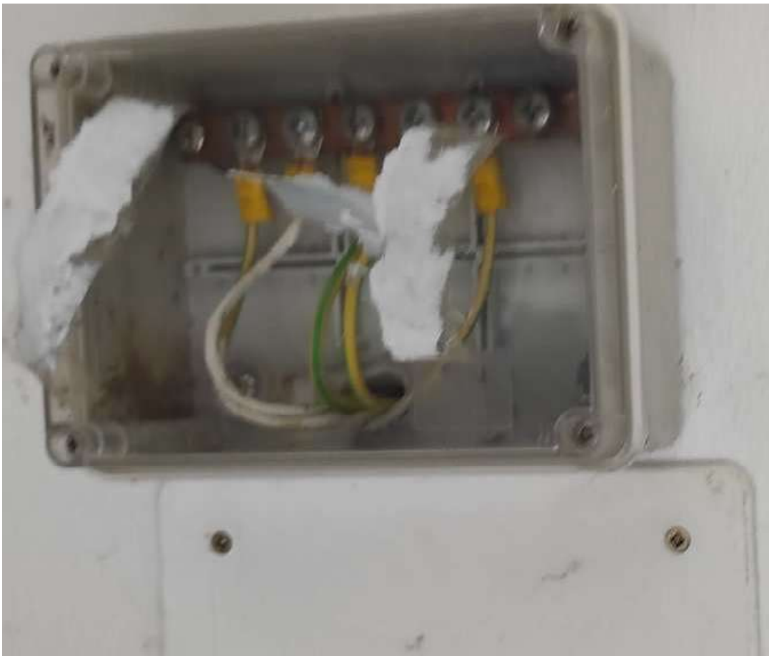
Foto 49 - DETTAGLIO IMPIANTO ELETTRICO