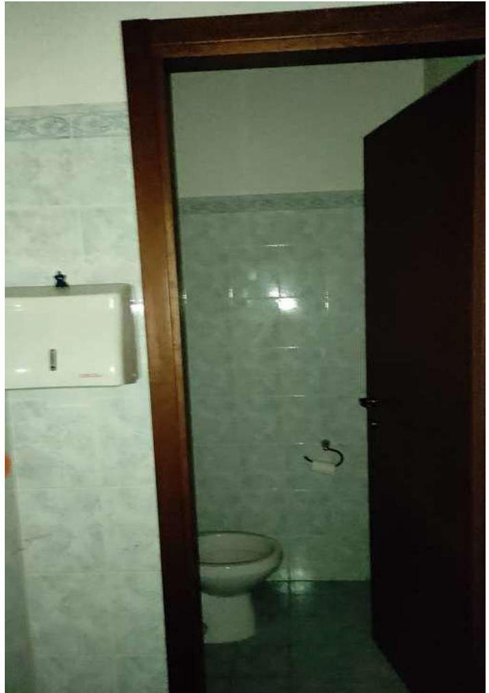
Foto 29, 30 - - INTERNI DEI LOCALI, DOCCIA E ACCESSO AL WC