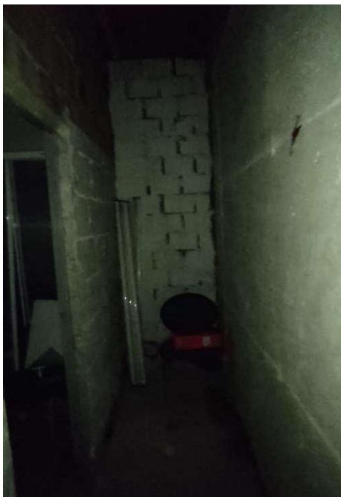
Foto 45 - CAVEDIO LATO DX