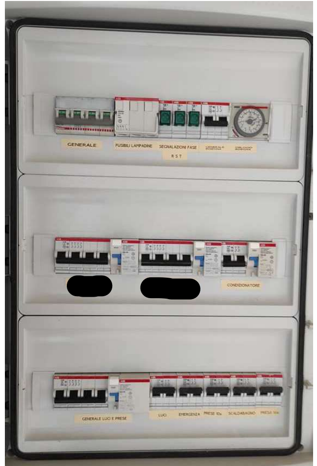
Foto 48 - QUADRO ELETTRICO GENERALE