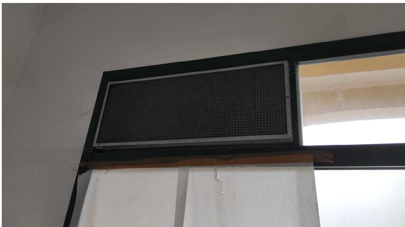
Foto 43 - DETTAGLIO GRIGLIA SU FACCIATA ESTERNA PER MACCHINA MOTOCONDENSANTE