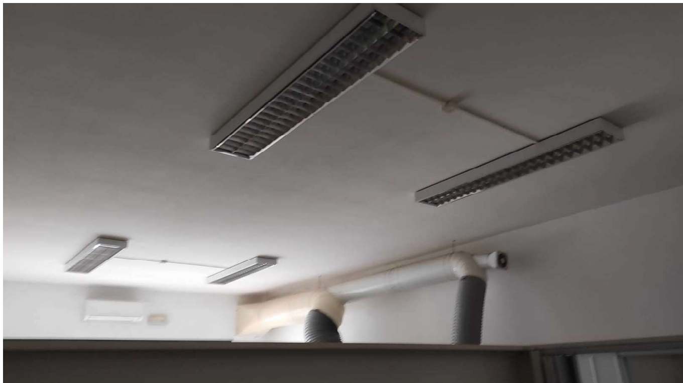
Foto 36 - DETTAGLIO IMPIANTO DI ILLUMINAZIONE E RACCORDO IMPIANTO DI ESTRAZIONE ARIA