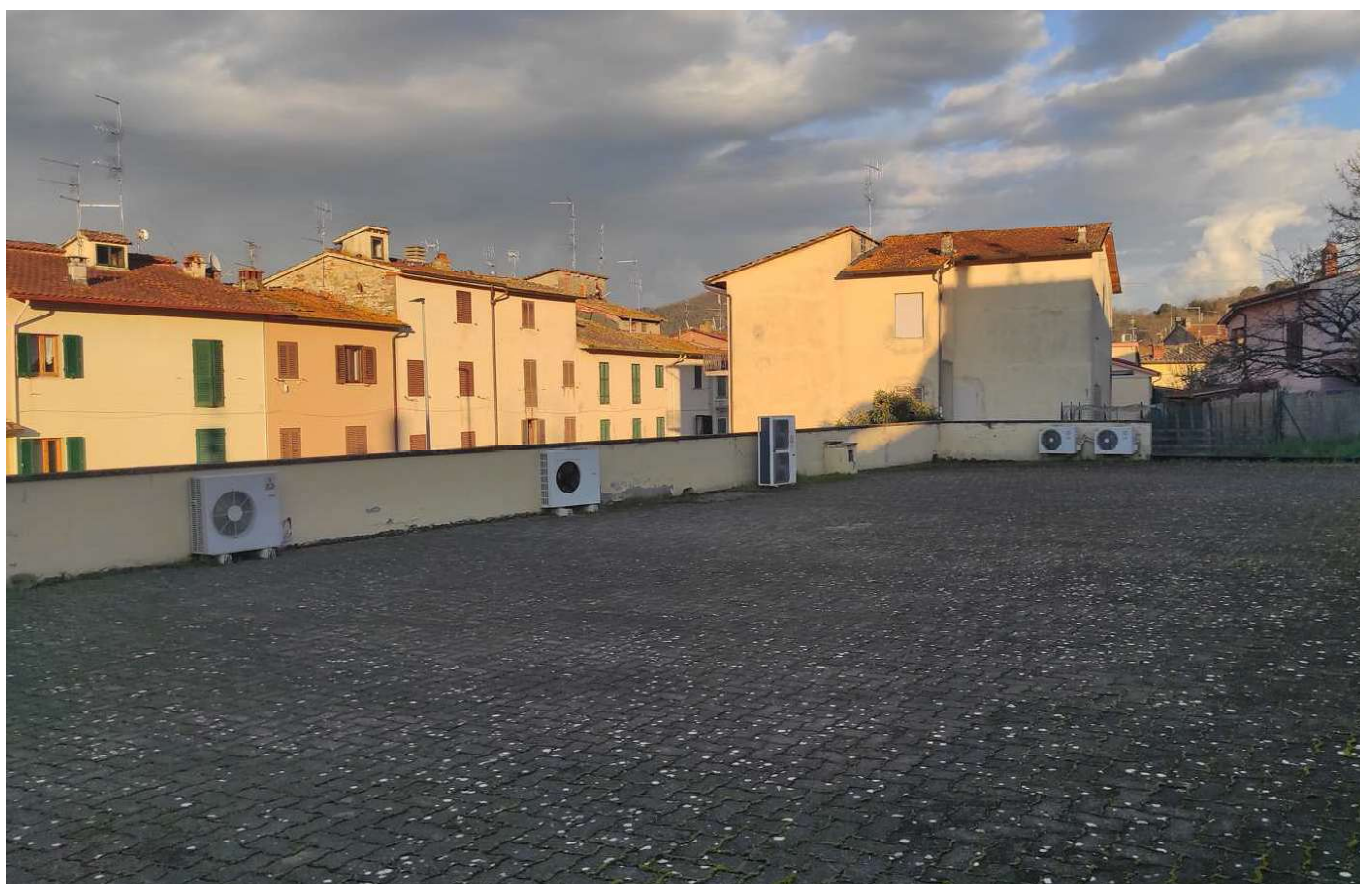
Foto 14 - VISTA DELL'AREA PERTINENZIALE, PIANO PRIMO, COPERTURA PIANA TERRAZZA