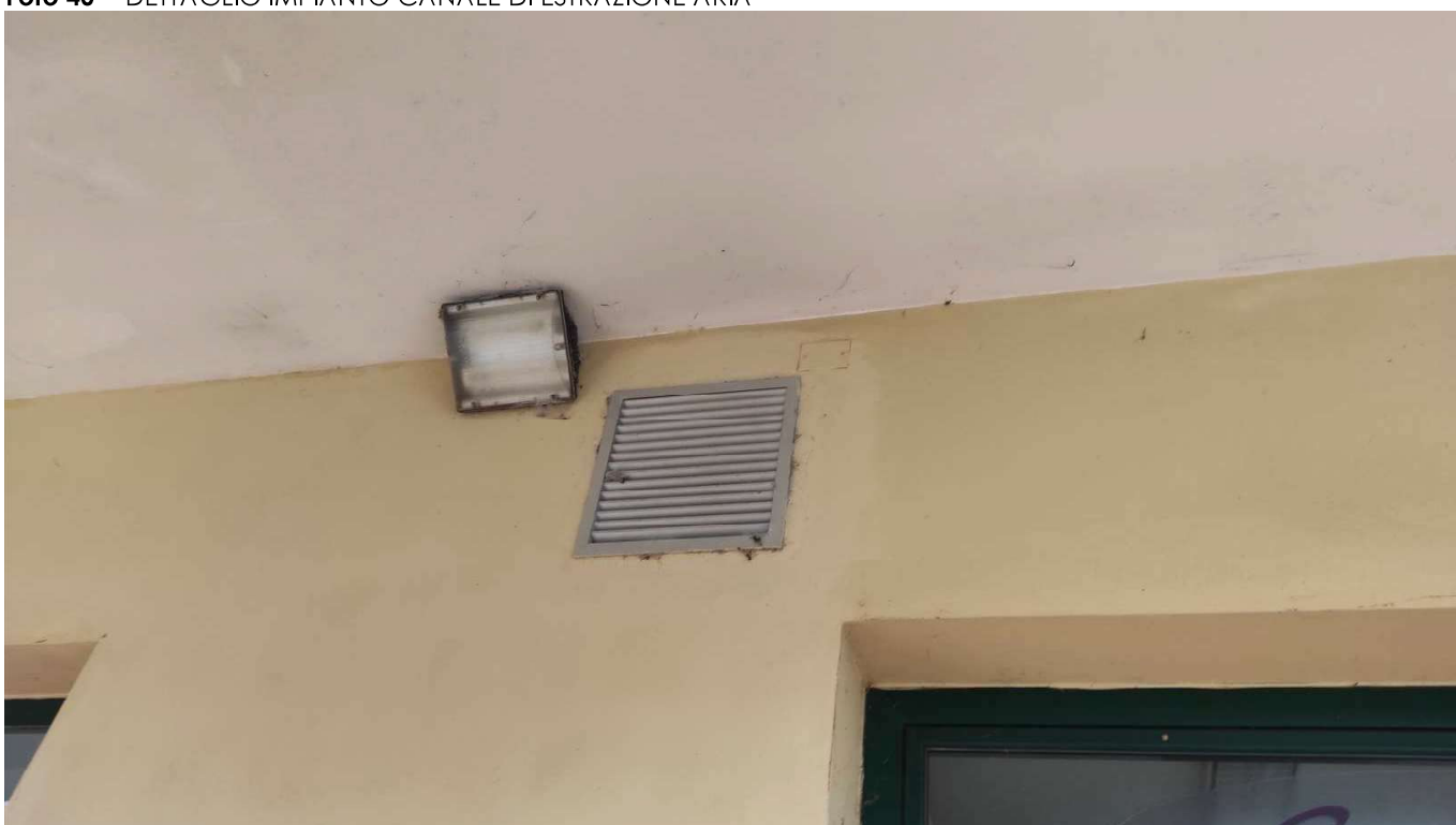
Foto 41 - DETTAGLIO IMPIANTO DI ESTRAZIONE ARIA, GRIGLIA ESTERNA SOTTO IL PORTICO