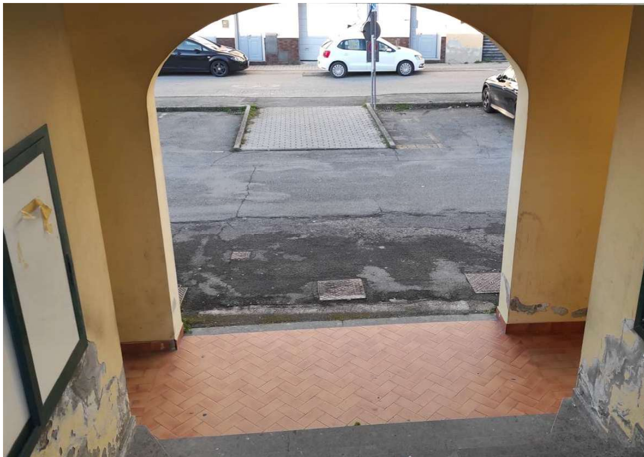
Foto 8 - VISTA DELL'AREA PERTINENZIALE, ACCESSO CON SCALA ESTERNA AL PIANO PRIMO, COPERTURA PIANA TERRAZZA