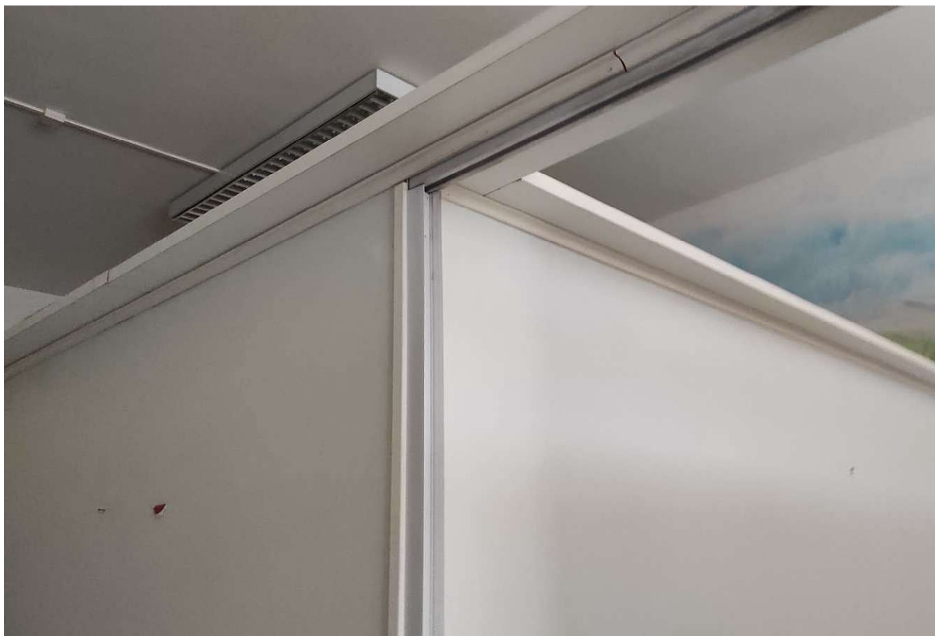
Foto 20 - STRUTTURA DEGLI ELEMENTI REMOVIBILI DI DIVISIONE DELLE CABINE DEL CENTRO ESTETICO - DETTAGLIO