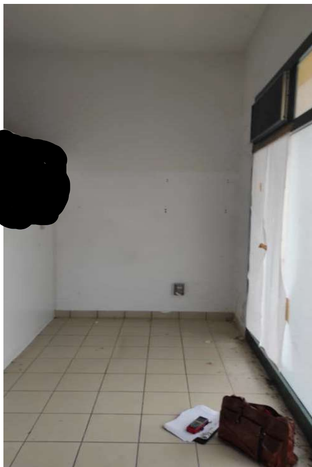
Foto 16 - ACCESSO AI LOCALI, LATO SX