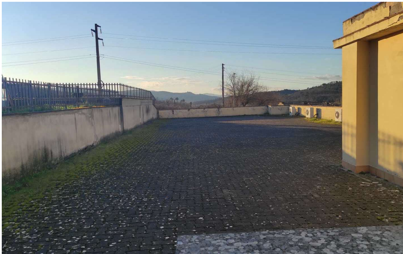
Foto 11 -VISTA DELL'AREA PERTINENZIALE, PIANO PRIMO, COPERTURA PIANA TERRAZZA