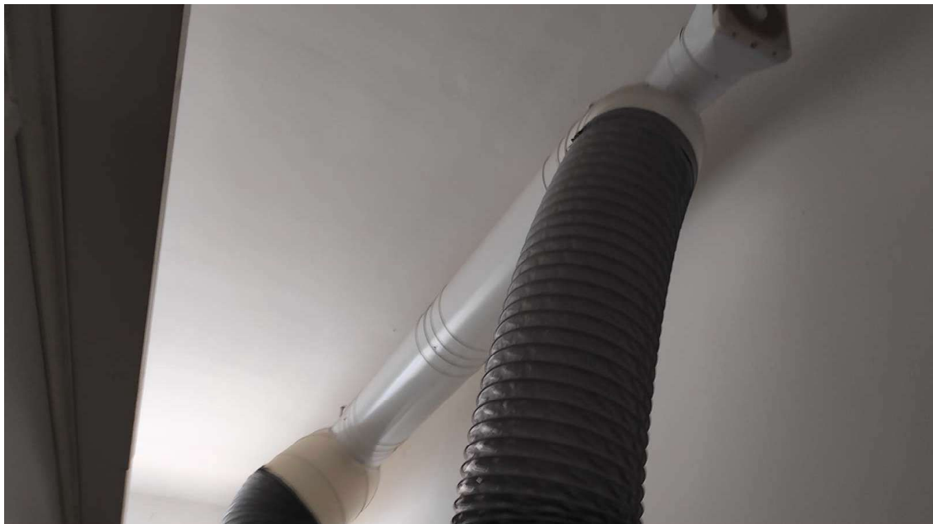
Foto 38 - DETTAGLIO IMPIANTO DI ESTRAZIONE ARIA