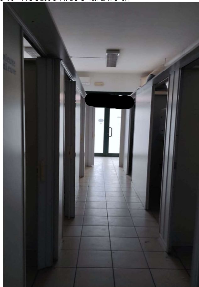
Foto 18 - CORRIDOIO DI DISTRUBUZIONE DA RETRO