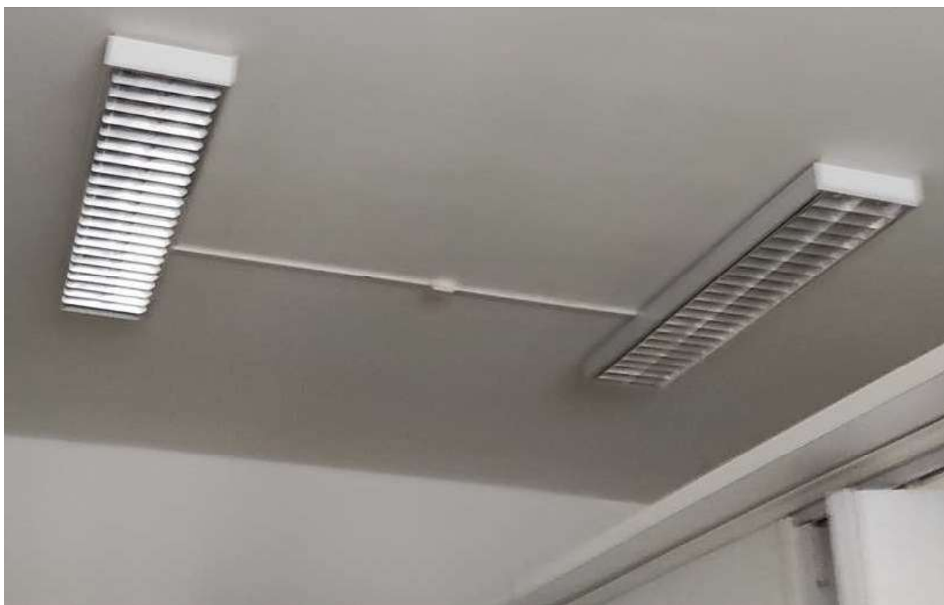
Foto 37 - DETTAGLIO IMPIANTO DI ILLUMINAZIONE A NEON A SOFFITTO