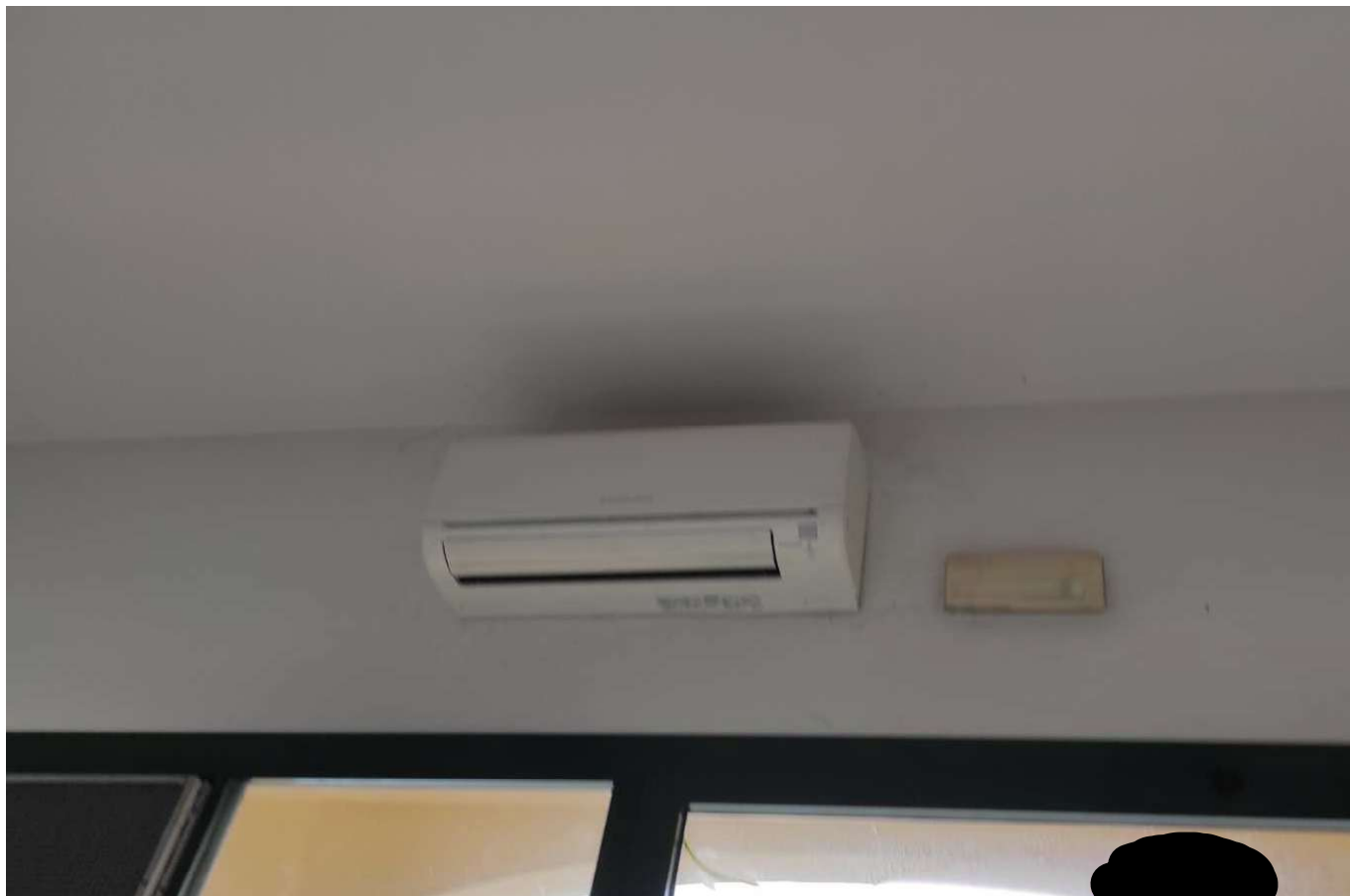
Foto 42 - DETTAGLIO IMPIANTO RISCALDAMENTO/RAFFRESCAMENTO, FAN COIL