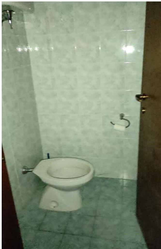
Foto 34 - WC, DETTAGLIO SANITARI