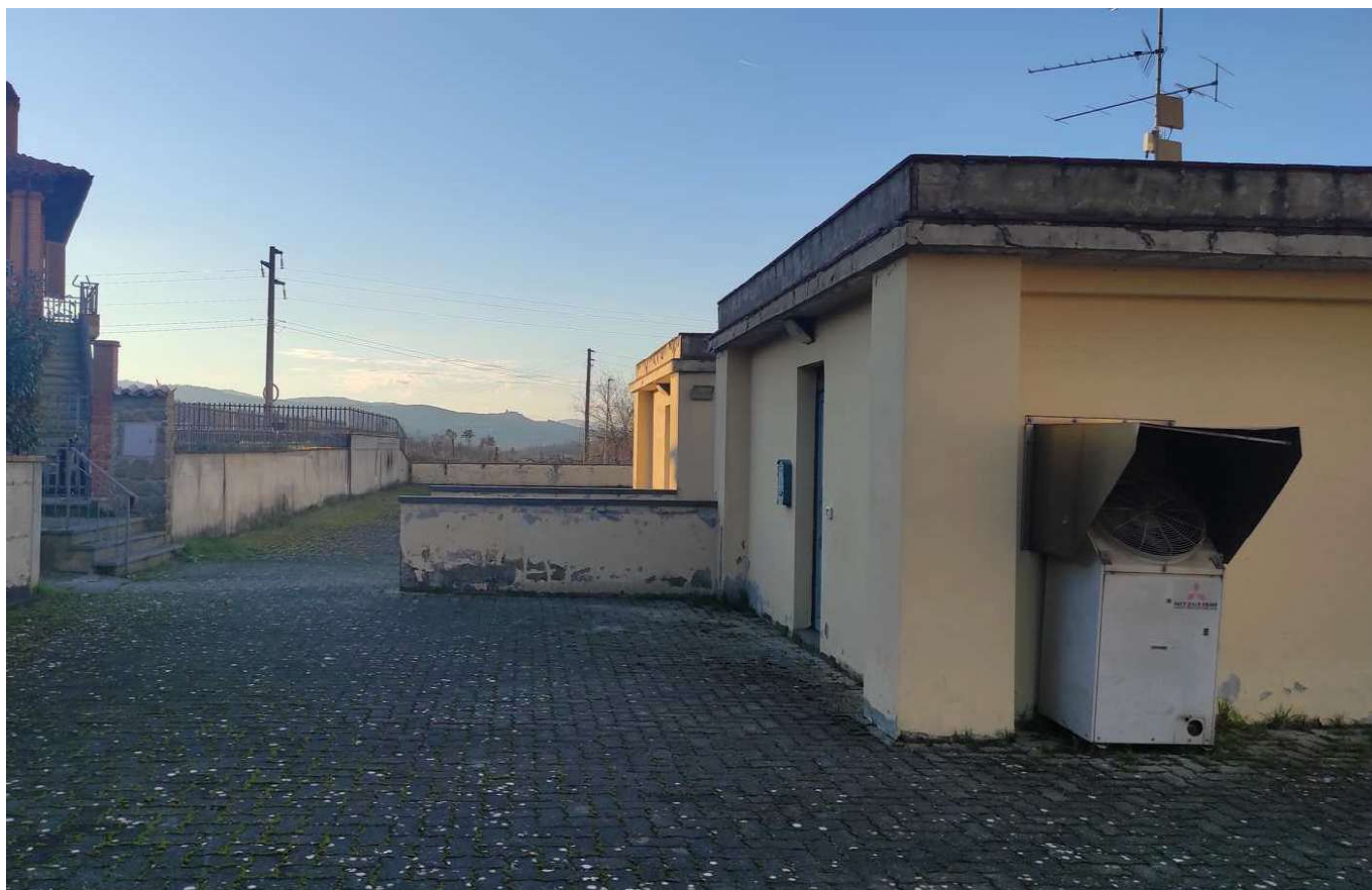
Foto 12 -VISTA DELL'AREA PERTINENZIALE, PIANO PRIMO, COPERTURA PIANA TERRAZZA E IMPIANTI IN COPERTURA