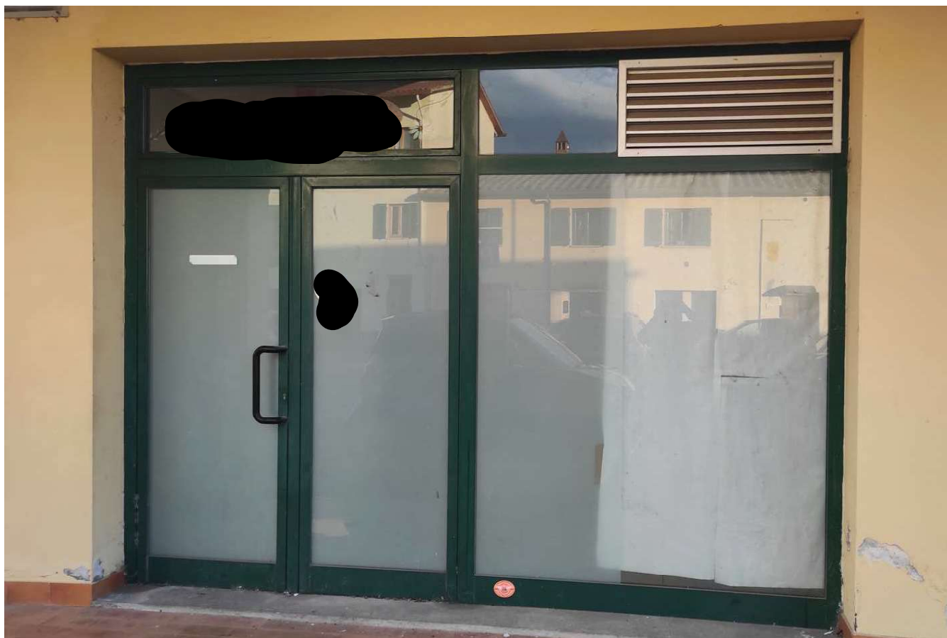
Foto 4 - VISTA DELL'AREA ESTERNA - porta di accesso all'unità immobiliare