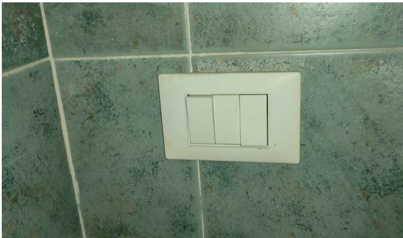
Foto 35 - DETTAGLIO PRESE DI ACCENSIONE IMPIANTO ELETTRICO