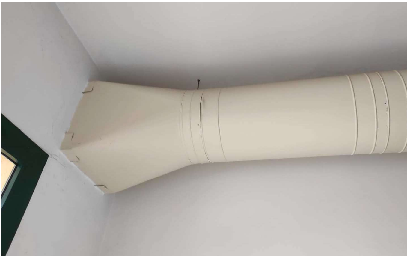
Foto 40 - DETTAGLIO IMPIANTO CANALE DI ESTRAZIONE ARIA