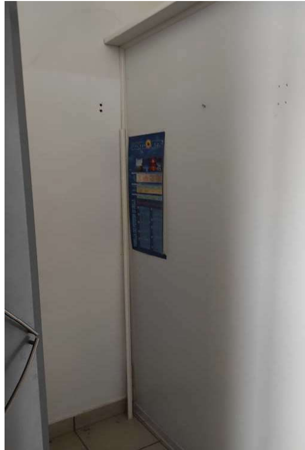
Foto 25, 26 - INTERNI DEI LOCALI, CON ATTREZZATURE A SERVIZIO DELL'ATTIVITA'