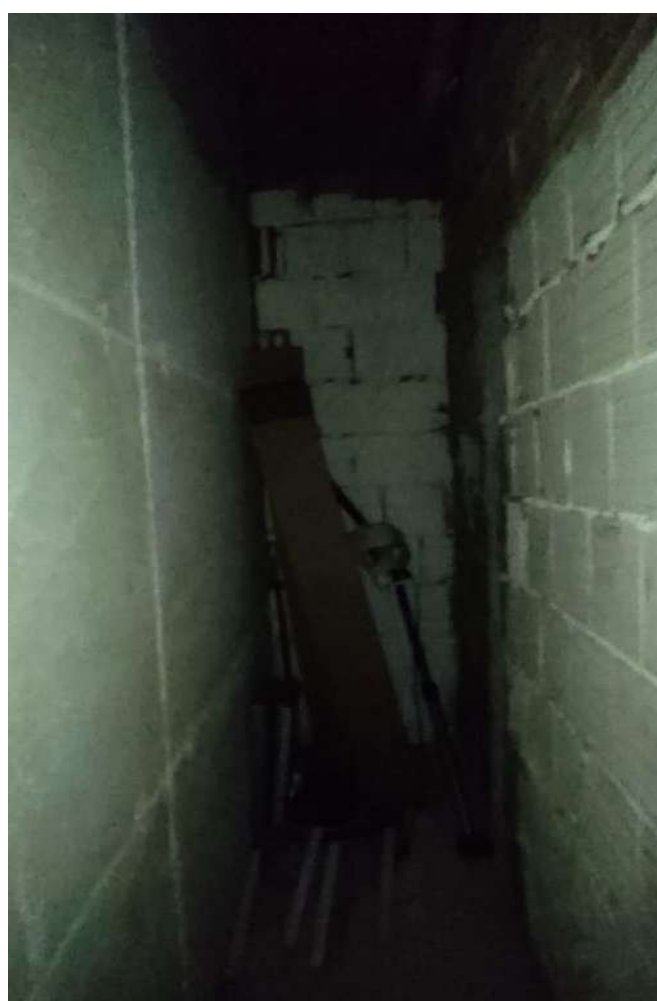
Foto 46 - CAVEDIO LATO SX