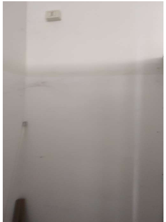
Foto 27, 28 - - INTERNI DEI LOCALI, CON ATTREZZATURE A SERVIZIO DELL'ATTIVITA'