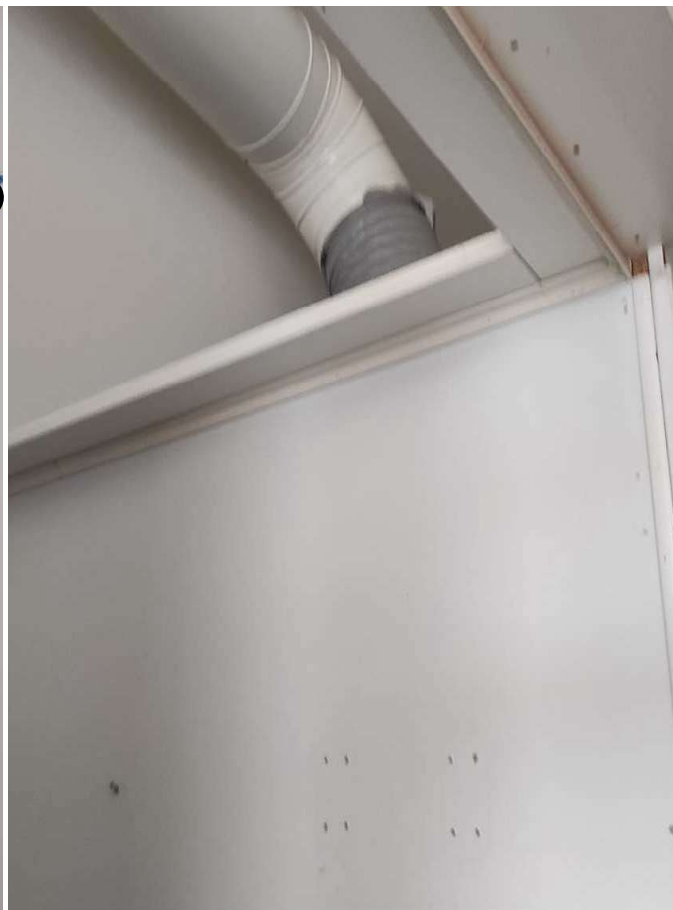
Foto 21 - DETTAGLIO DELLA STRUTTURA A PANNELLI REMOVIBILI CON APERTURE A SOFFIETTO