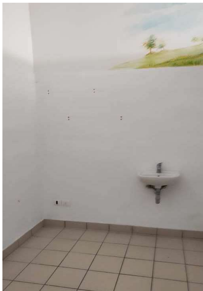
Foto 23, 24 - - INTERNI DEI LOCALI, CON ATTREZZATURE A SERVIZIO DELL'ATTIVITA'