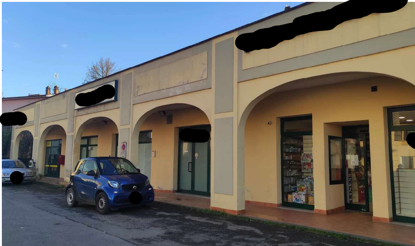
Foto 3 VISTA DELL'AREA ESTERNA SUL FABBRICATO