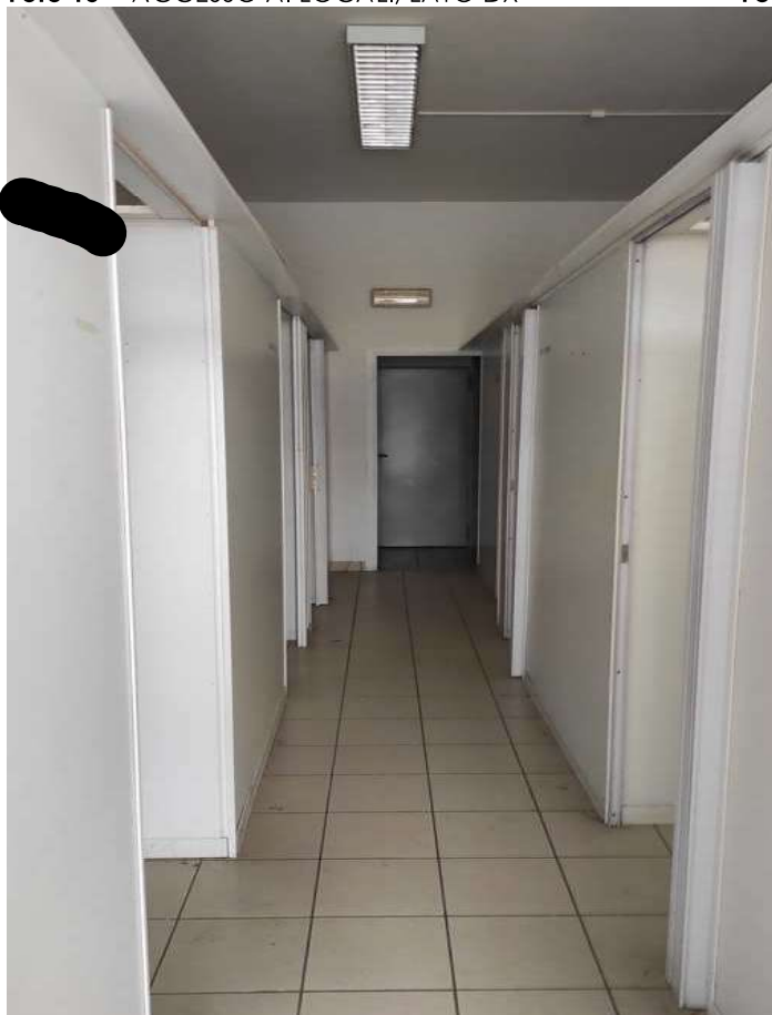
Foto 17 - CORRIDOIO DI DISTRUBUZIONE DA ACCESSO