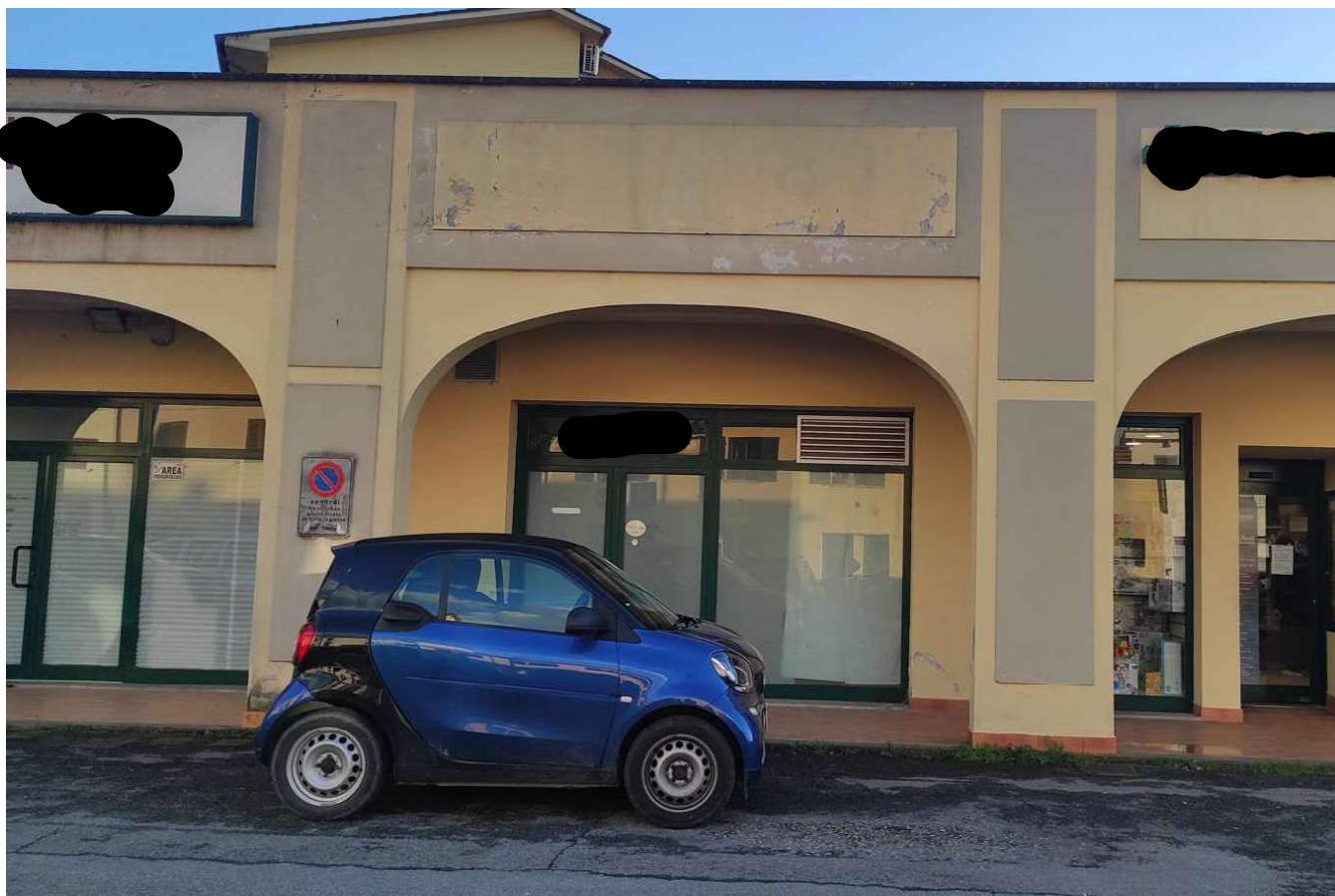
Foto 1 - VISTA DELL'AREA ESTERNA SUL FABBRICATO