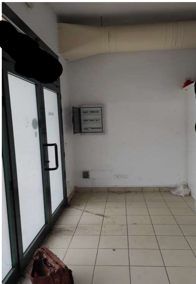
Foto 15 - ACCESSO AI LOCALI, LATO DX