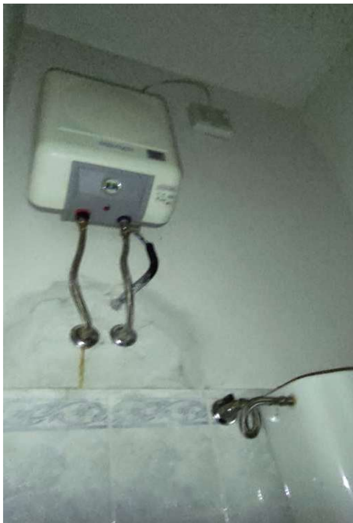
Foto 33 - WC, DETTAGLIO SANITARI E BOILER ELETTRICO