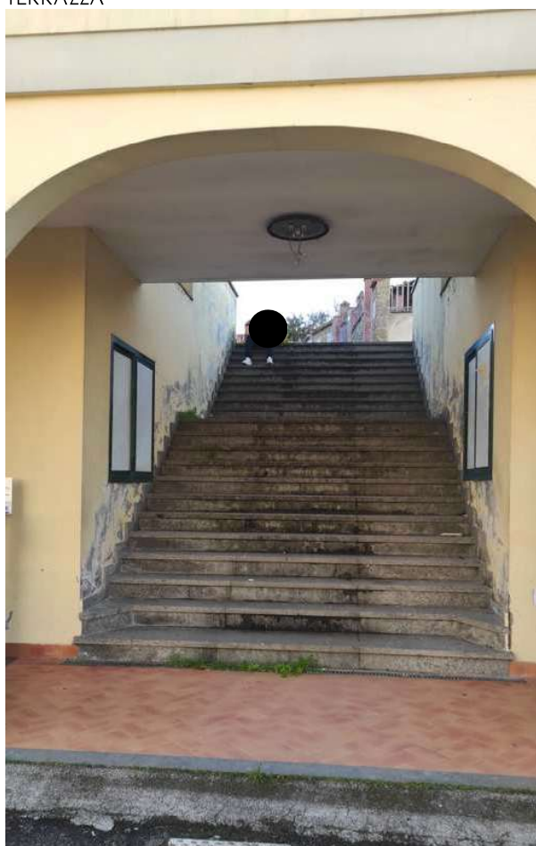
Foto 9 -VISTA DELL'AREA PERTINENZIALE, ACCESSO CON SCALA ESTERNA AL PIANO PRIMO, COPERTURA PIANA TERRAZZA