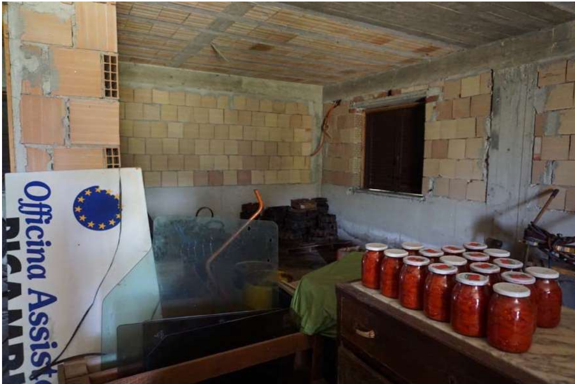
Fig.9 – Vista del Fabbricato in contrada Terraloggia alla via Contrada Piane