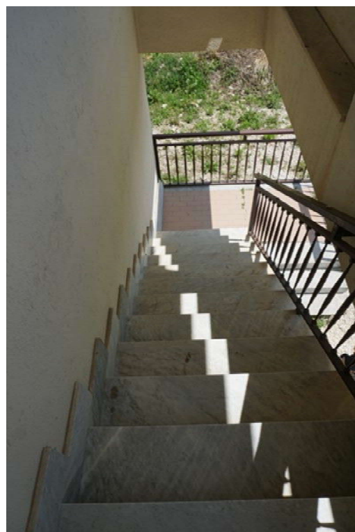
Fig.14 – Vista su impianti e scala