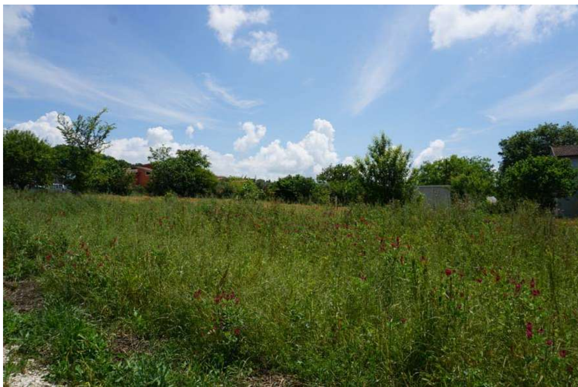
Fig.7 – Vista dei terreni posti afferenti alle particelle 270-1259