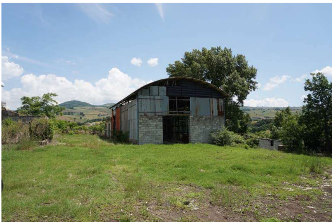
Fig.2 – Vista del capannone agricolo presente all'interno della p.lla 632