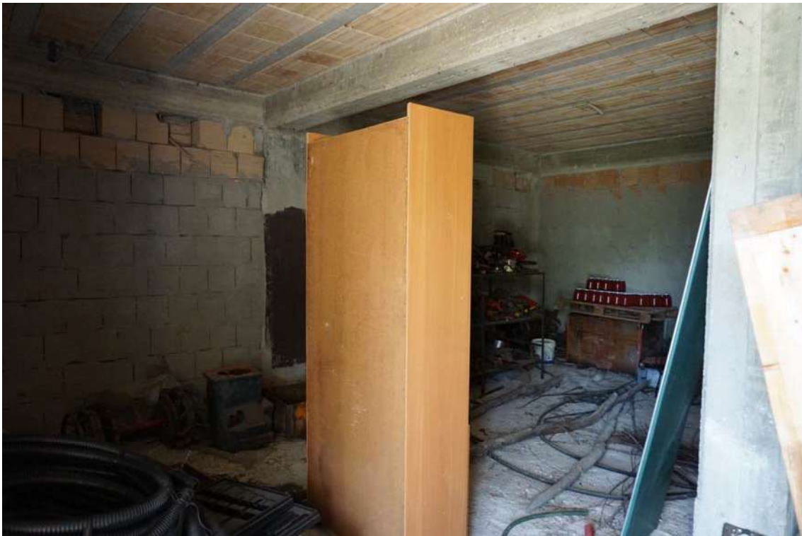
Fig.12 – Vista del vano deposito/magazzino al piano terra