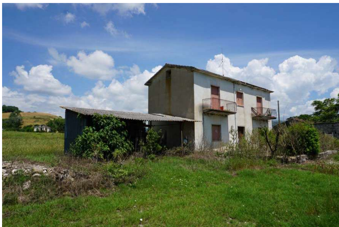
Fig.2 – Vista dell'immobile residenziale