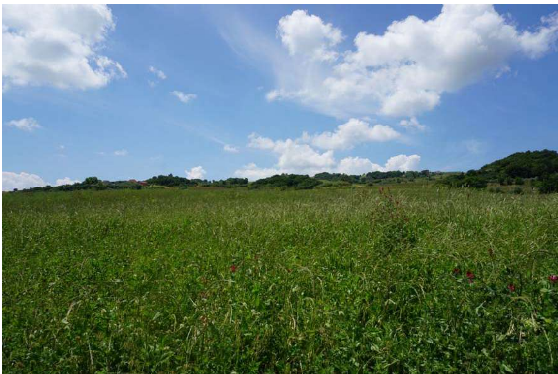
Fig.4 – Vista su p.lle 218-219-220 del Fg.63 nel Territorio di San Giorgio La Molara (BN)