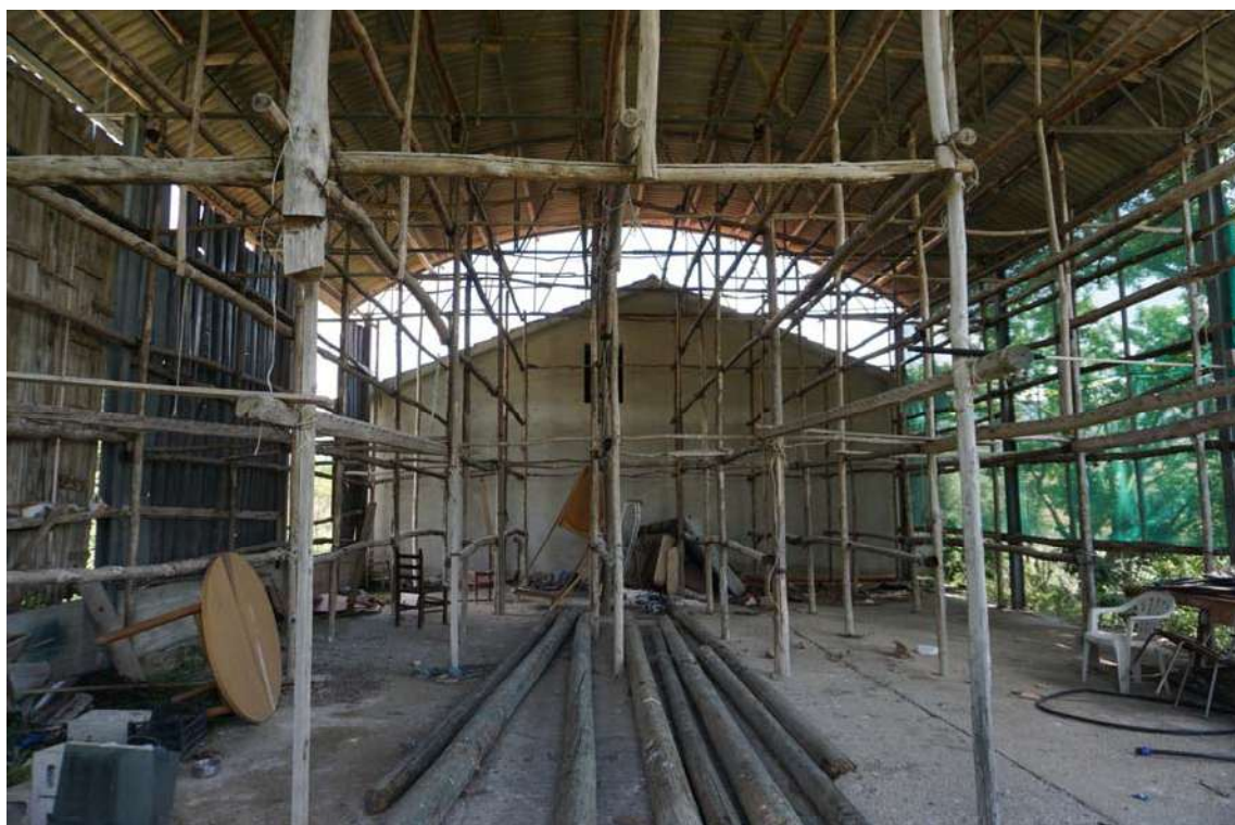
Fig.4 – Vista interna del capannone agricolo presente all’interno della p.lla 632