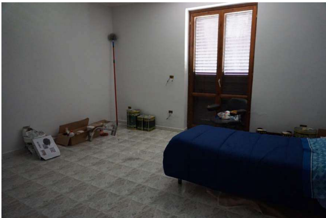
Fig.20 – Vista della camera da letto singola posta al primo piano