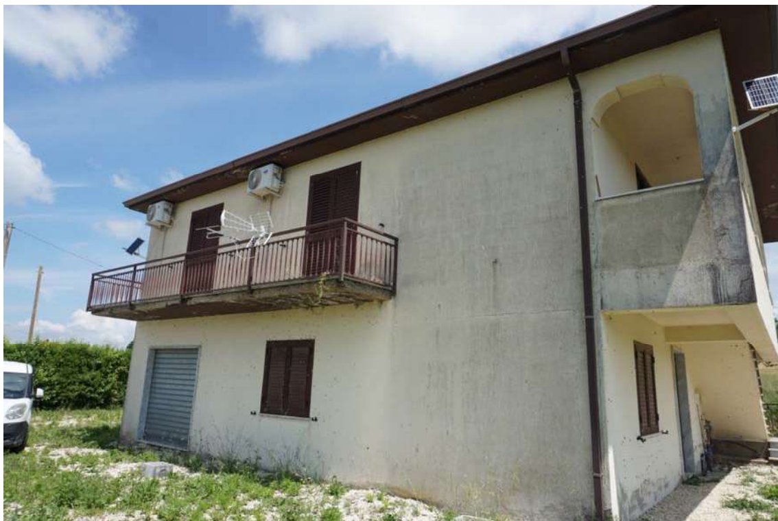
Fig.3 – Vista del Fabbricato in contrada Terraloggia alla via Contrada Piane