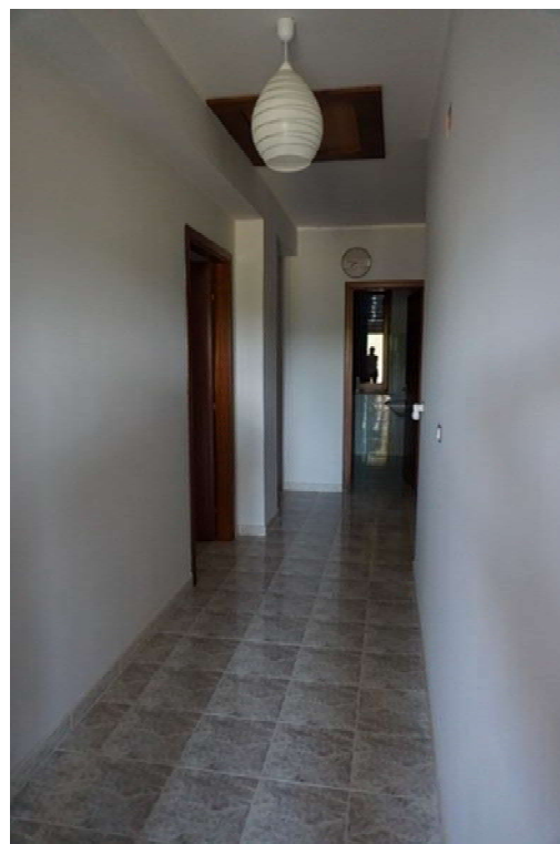
Fig.17-18 – Vista ingresso e disimpegno posti al primo piano