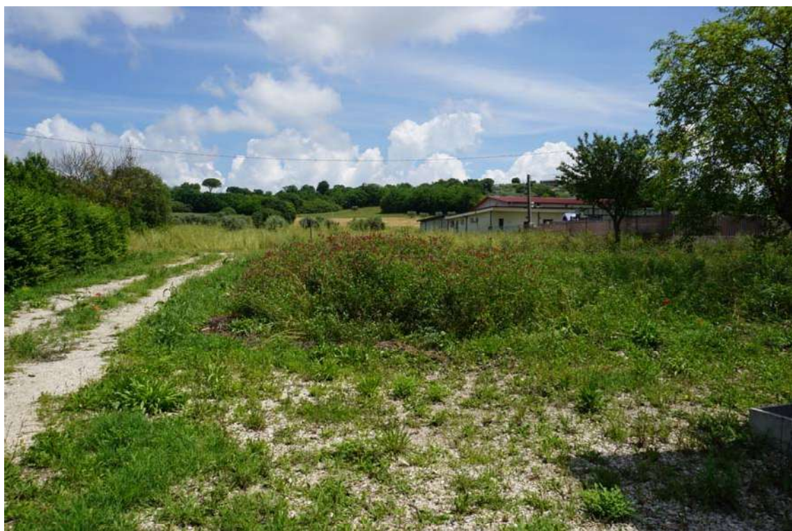
Fig.5 – Vista del terreno alla p.lla 272