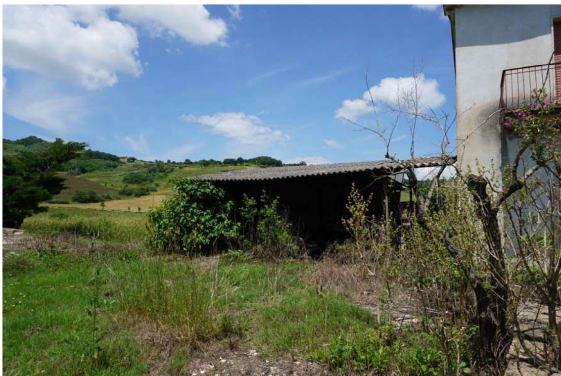
Fig.7 – Vista del ricovero attrezzi contiguo il fabbricato residenziale