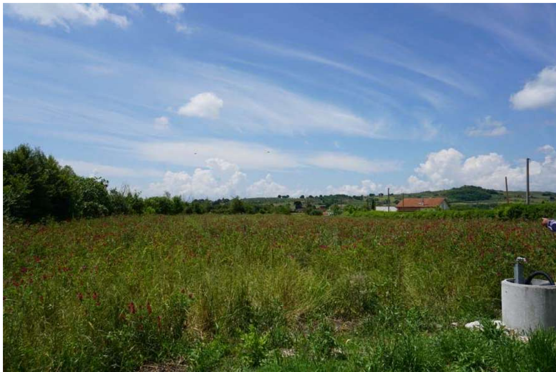
Fig.6 – Vista dei terreni posti afferenti alle particelle 270-1259