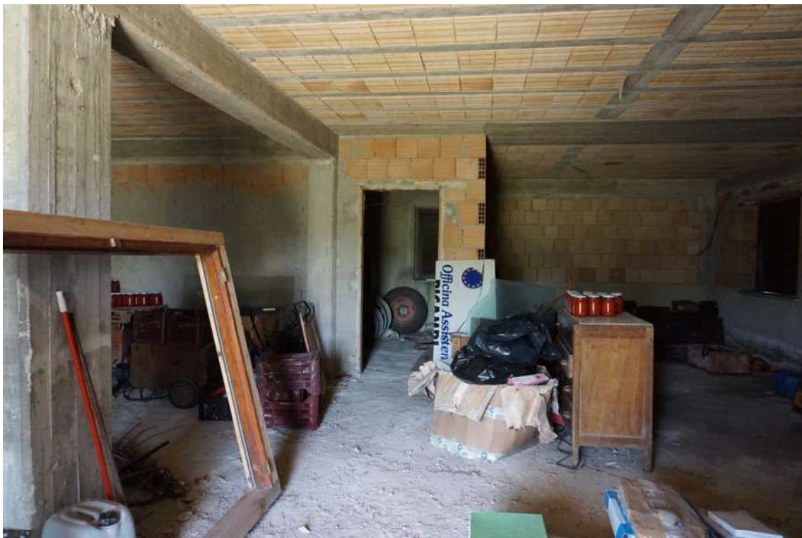
Fig.10 – Vista del vano deposito/magazzino al piano terra