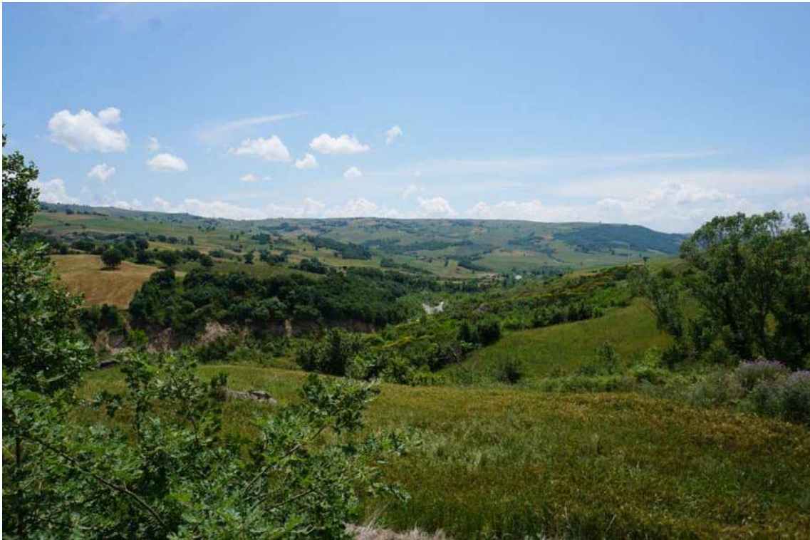
Fig.15 – Vista su terreni riguardanti il Lotto 2