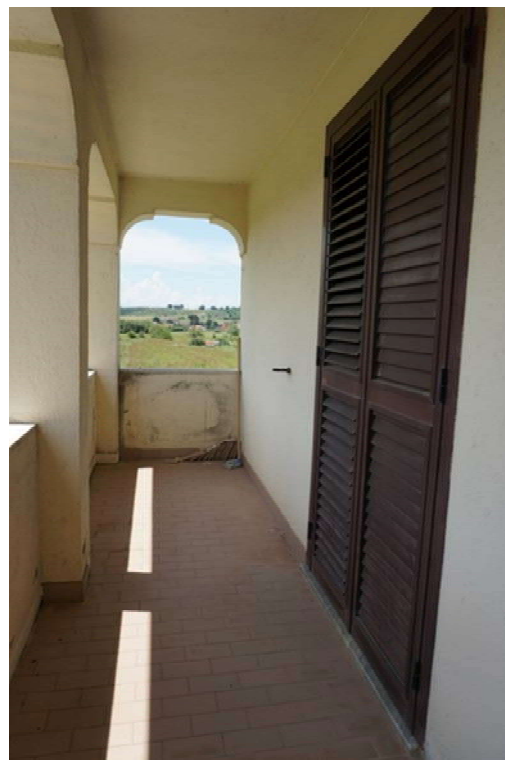
Fig.15-16 – Vista su scala e balcone porticato