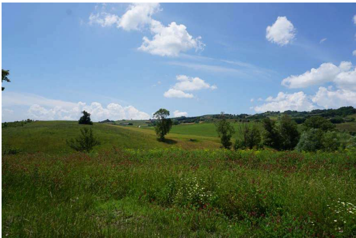
Fig.14 – Vista su terreni riguardanti il Lotto 2