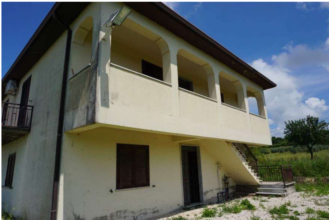
Fig.2 – Vista del Fabbricato in contrada Terraloggia alla via Contrada Piane