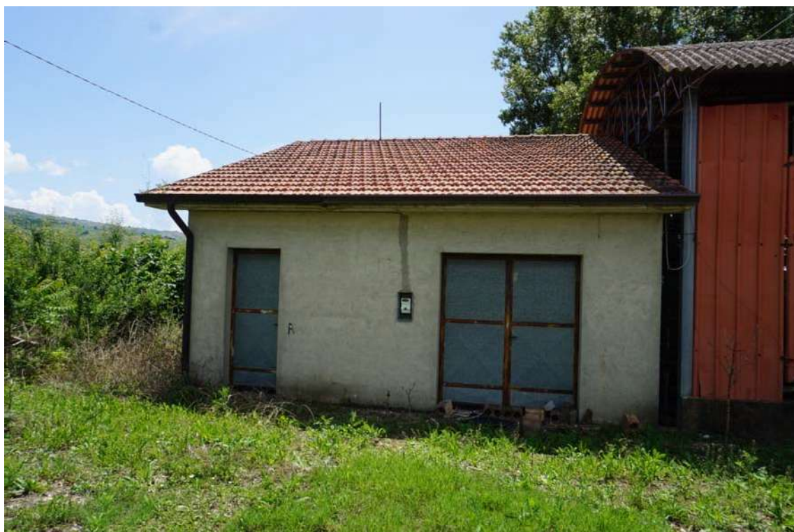
Fig.6 – Vista dell'edificio addossato al capannone con funzione di ricovero attrezzi e derrate