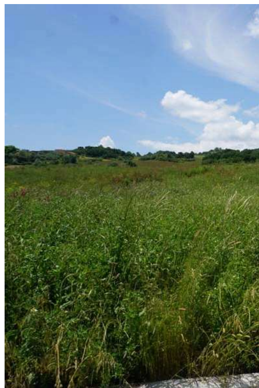
Figg.2-3 – Accesso e vista su p.lle 218-219-220 del Fg.63 nel Territorio di San Giorgio La Molara (BN)