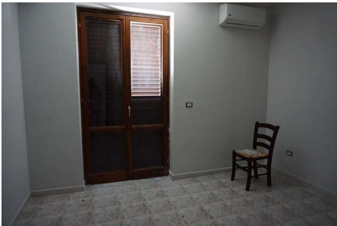
Fig.22 – Vista del vano camera posto al primo piano