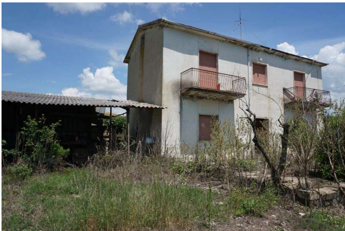
Fig.8 – Vista del Fabbricato residenziale all'interno della p.lla 632