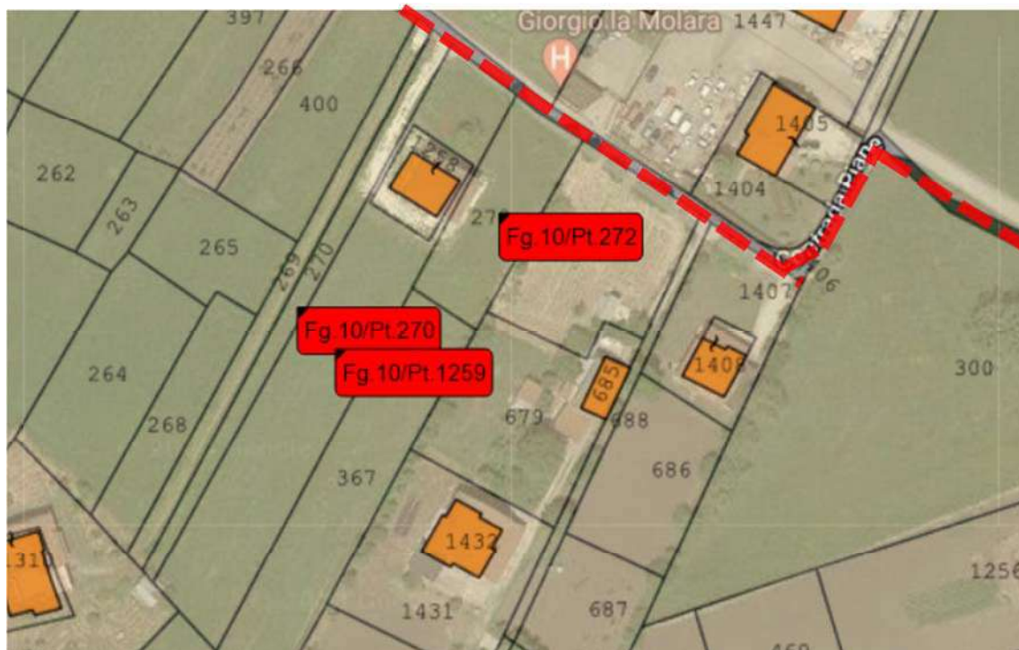
Fig.1 – Vista del Fabbricato e Terreni su ortofoto con individuazione dell'asse viario di Via Piane