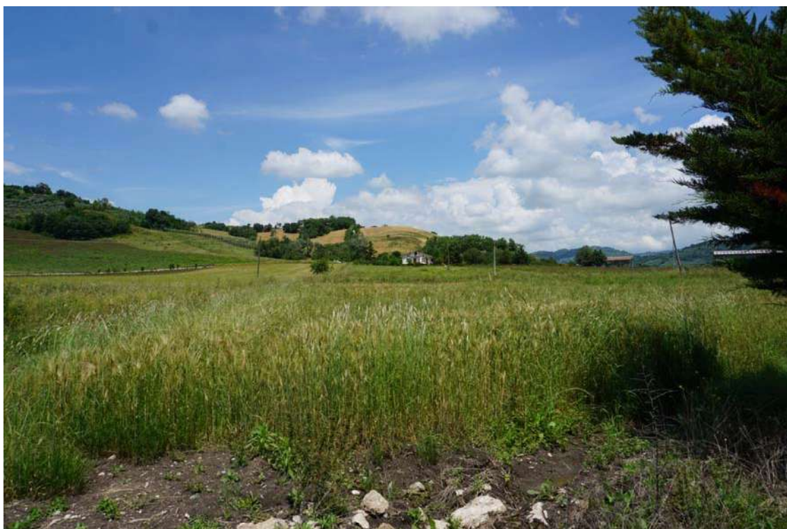
Fig.13 – Vista su terreni riguardanti il Lotto 2