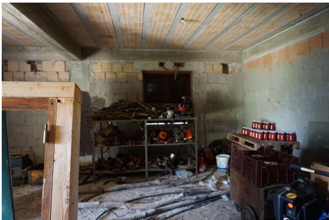
Fig.13 – Vista del vano deposito/magazzino al piano terra