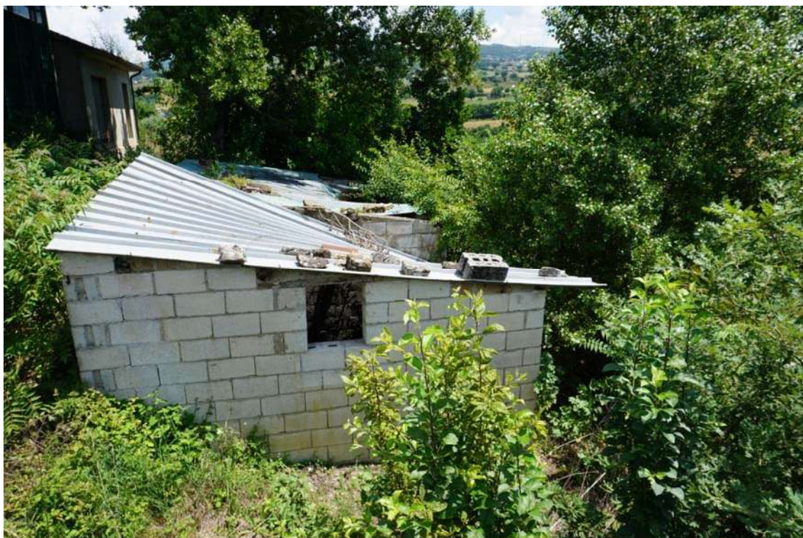
Fig.12 – Vista di dettaglio del diruto nei pressi del capannone