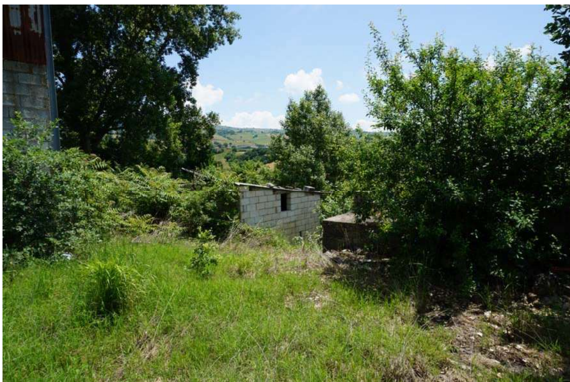
Fig.11 –Vista su caseggiato in rovina nei pressi del capannone ad uso agricolo