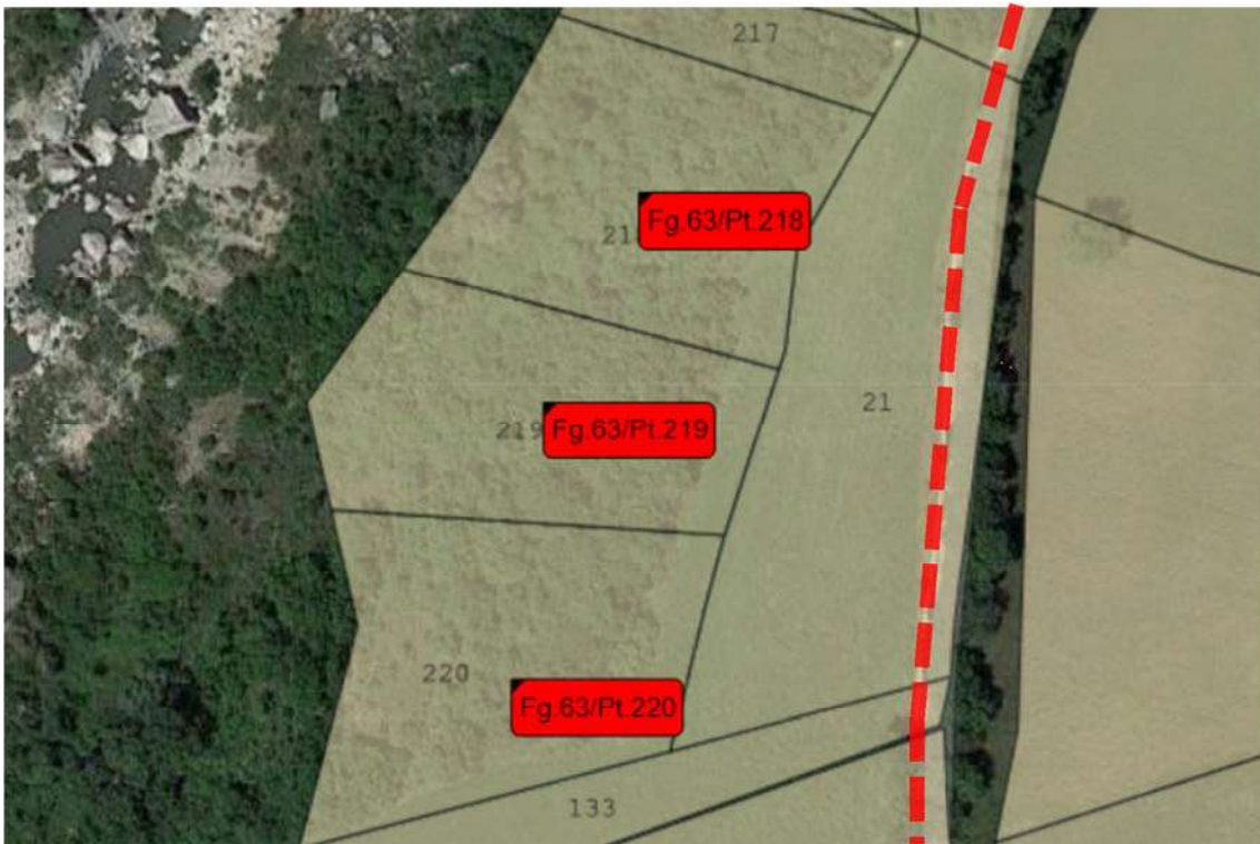
Fig.1 – Vista dei terreni su ortofoto con individuazione dell'asse viario di Contrada Ceracchio