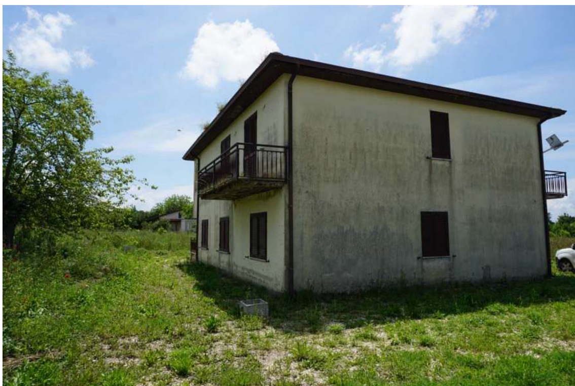
Fig.4 – Vista del Fabbricato in contrada Terraloggia alla via Contrada Piane