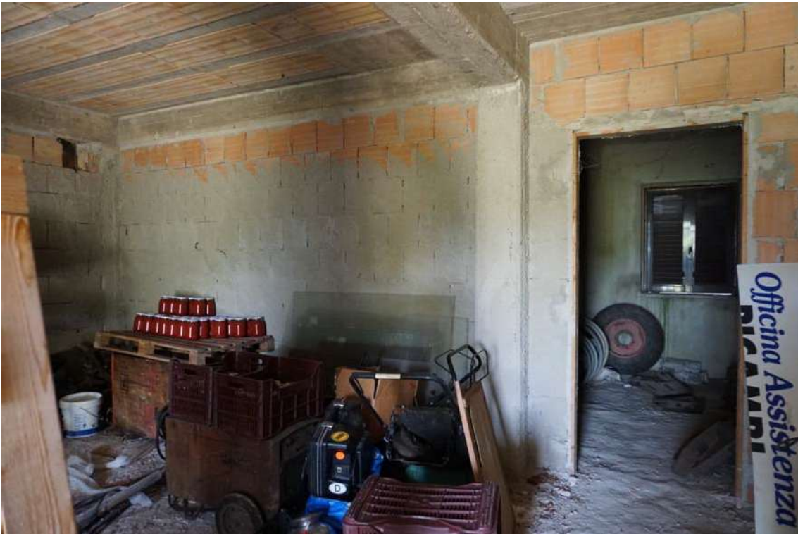
Fig.11 – Vista del vano deposito/magazzino al piano terra