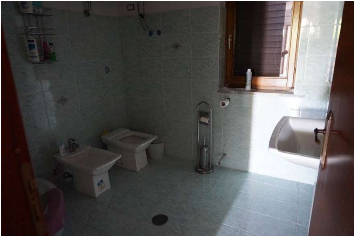
Fig.23 – Vista del bagno posto al primo piano

2.2- Lotto 2 – Terreni siti a Pago Veiano (BN) in Località Contrada Terraloggia SNC censiti al catasto terreni al Foglio 12 p.lla 33-36 -257-310 e Fabbricati - Unità Immobiliare Collabente (F/2) con pertinenza annessa sita a Pago Veiano (BN) in Località Contrada Terraloggia SNC, censiti al catasto fabbricati al Foglio 12 p.lla 632