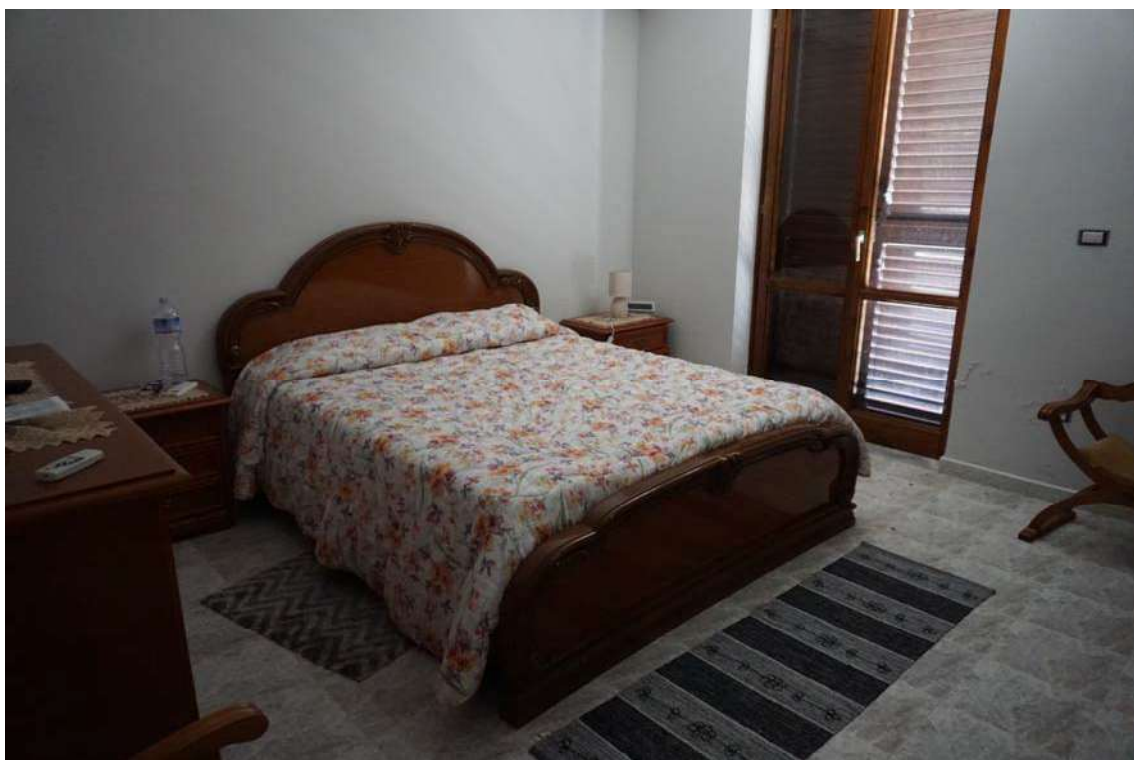
Fig.21 – Vista della camera da letto matrimoniale posta al primo piano