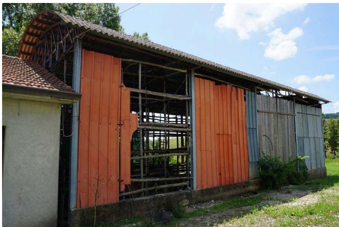
Fig.5 – Vista prospetto laterale