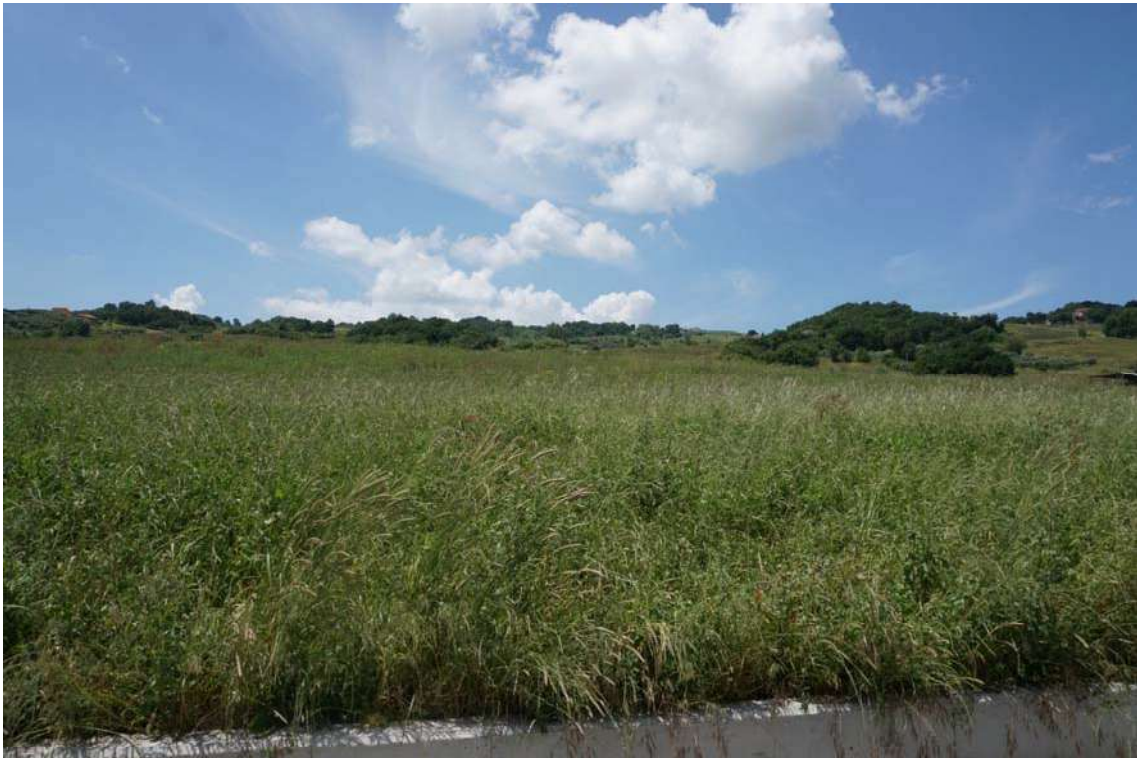
Fig.5 – Vista su p.lle 218-219-220 del Fg.63 nel Territorio di San Giorgio La Molara (BN)