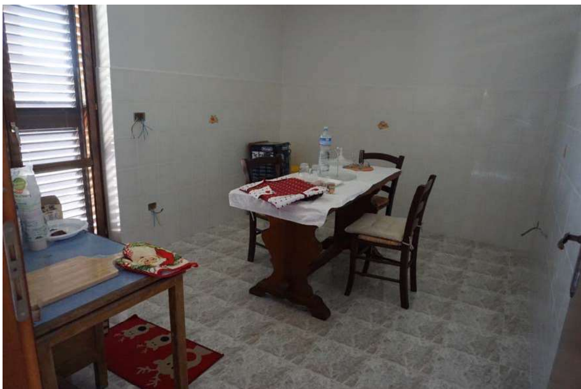
Fig.19 – Vista vano cucina posto al primo piano