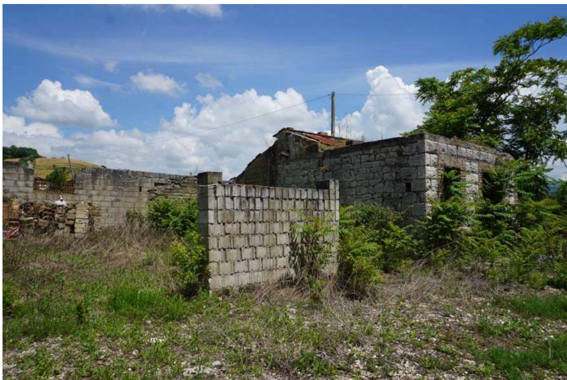
Fig.10 – Vista su caseggiato in rovina nei pressi del fabbricato residenziale