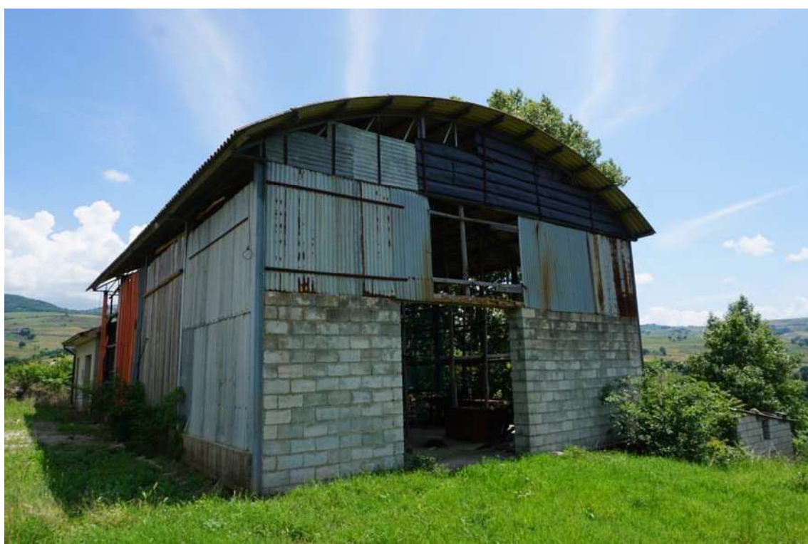
Fig.3 – Vista del capannone agricolo presente all'interno della p.lla 632