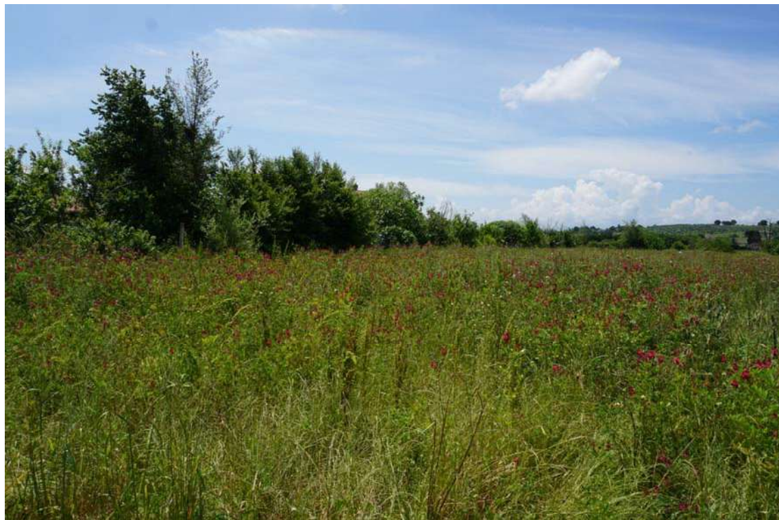
Fig.8 – Vista dei terreni posti afferenti alle particelle 270-1259