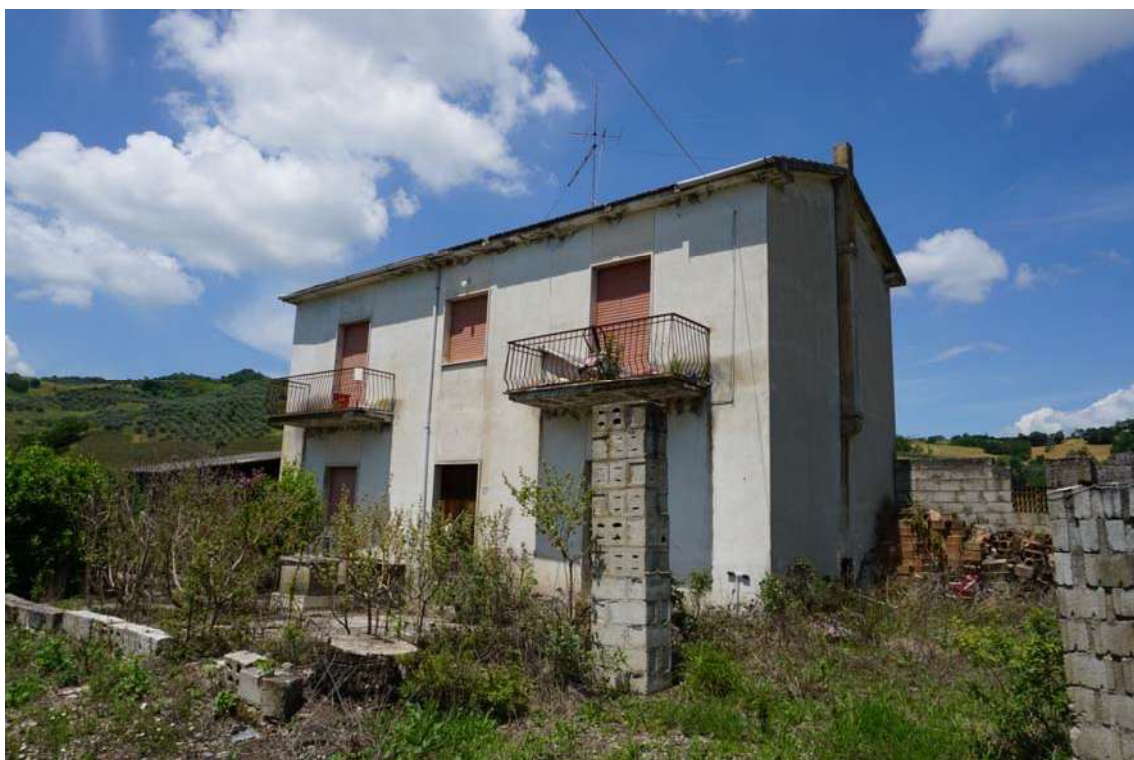
Fig.9 – Vista del Fabbricato residenziale all'interno della p.lla 632