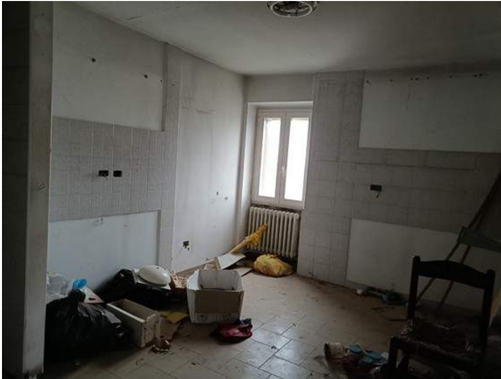
Fotografia I.19 - Cucina piano primo