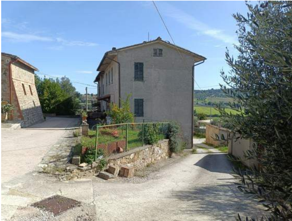
Fotografia I.11 - Strada di accesso lato sud