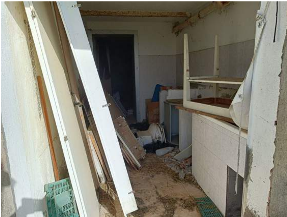
Fotografia I.16 - Altro fondo piano terra