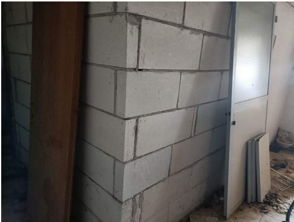
Fotografia I.36 - Divisorio fondo piano terra