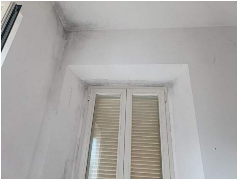
Fotografia I.34 - Umidità pareti e vetri rotti infissi piano secondo