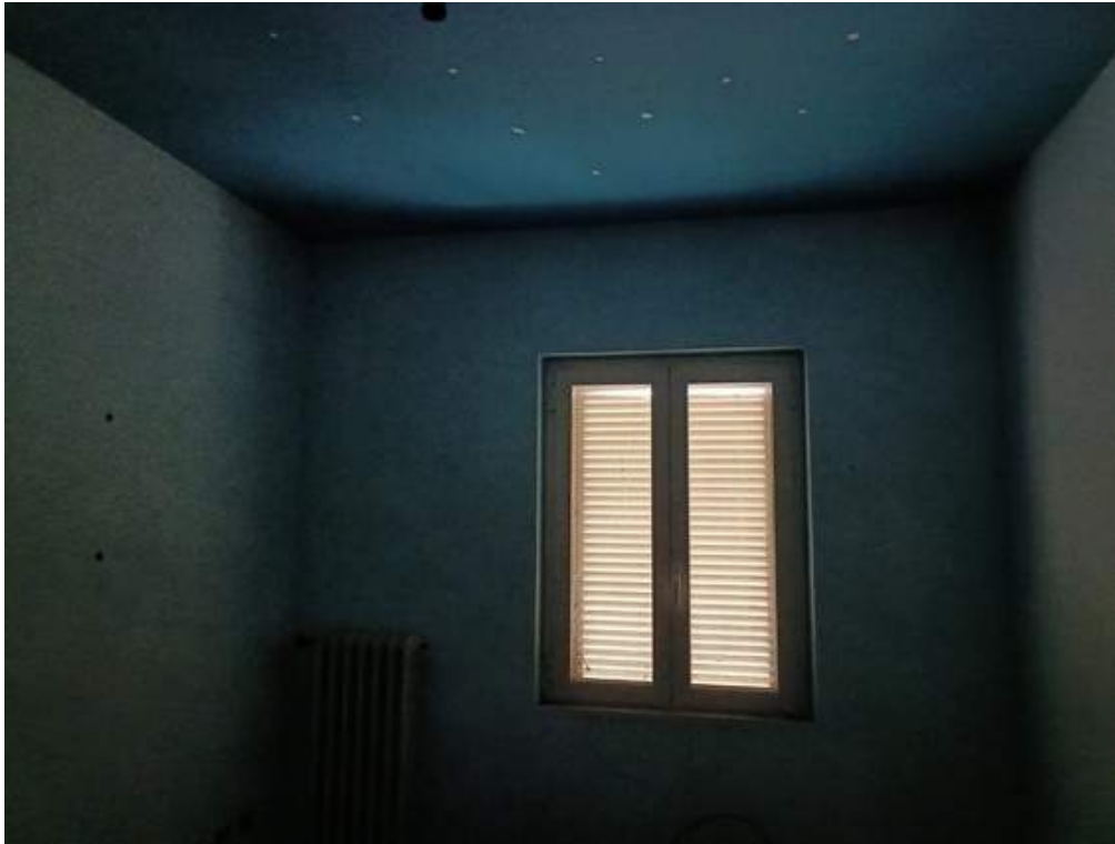
Fotografia I.25 - Terza camera piano secondo