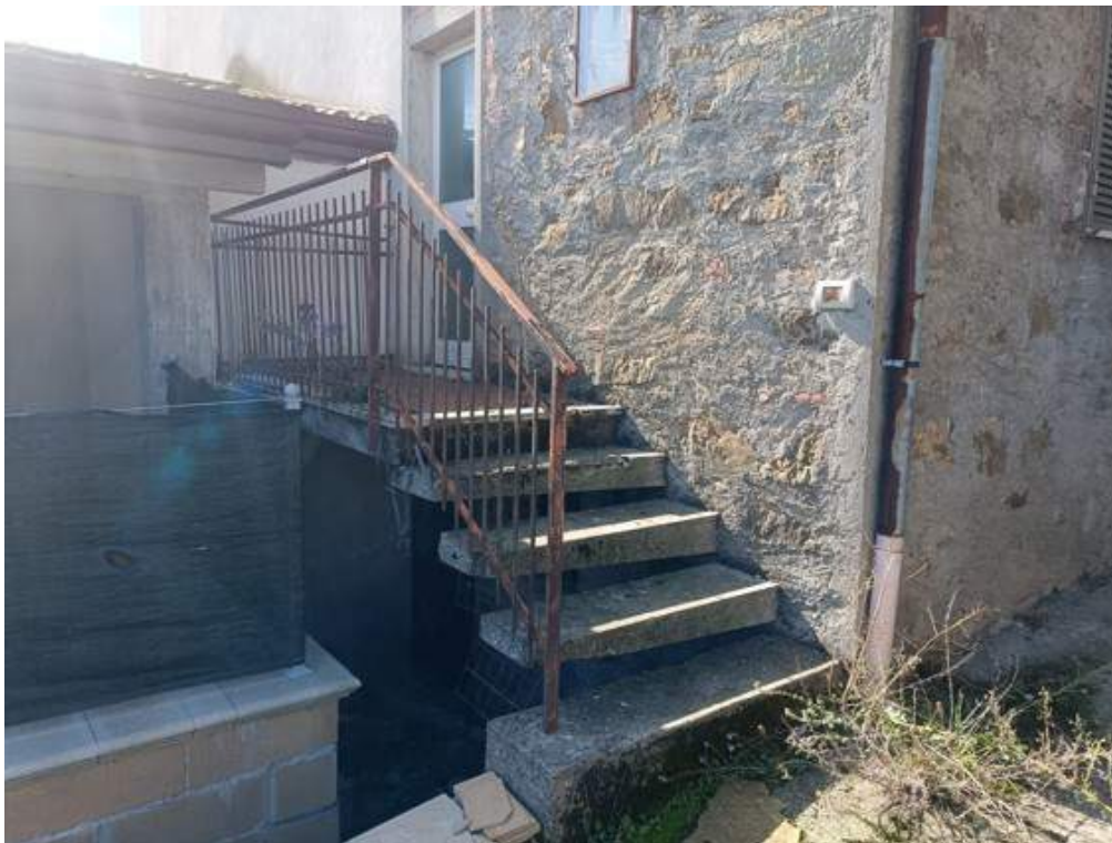
Fotografia I.7 - Scala esterna accesso secondario lato Est