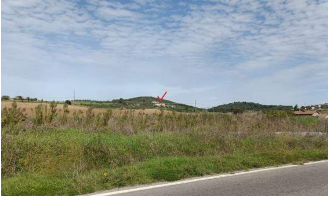
Fotografia I.3 - Foto del contesto paesaggistico