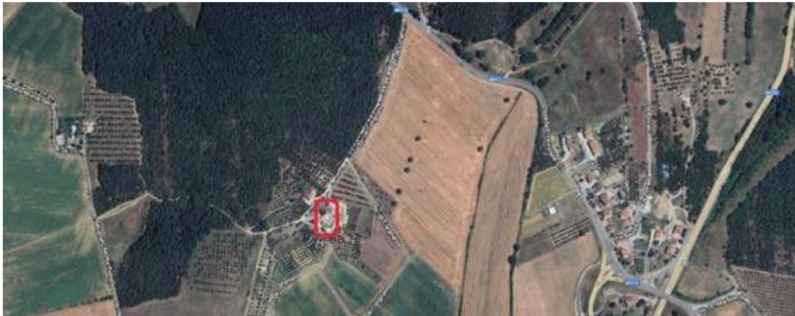
Fotografia I.1 - Immagine aerea della zona