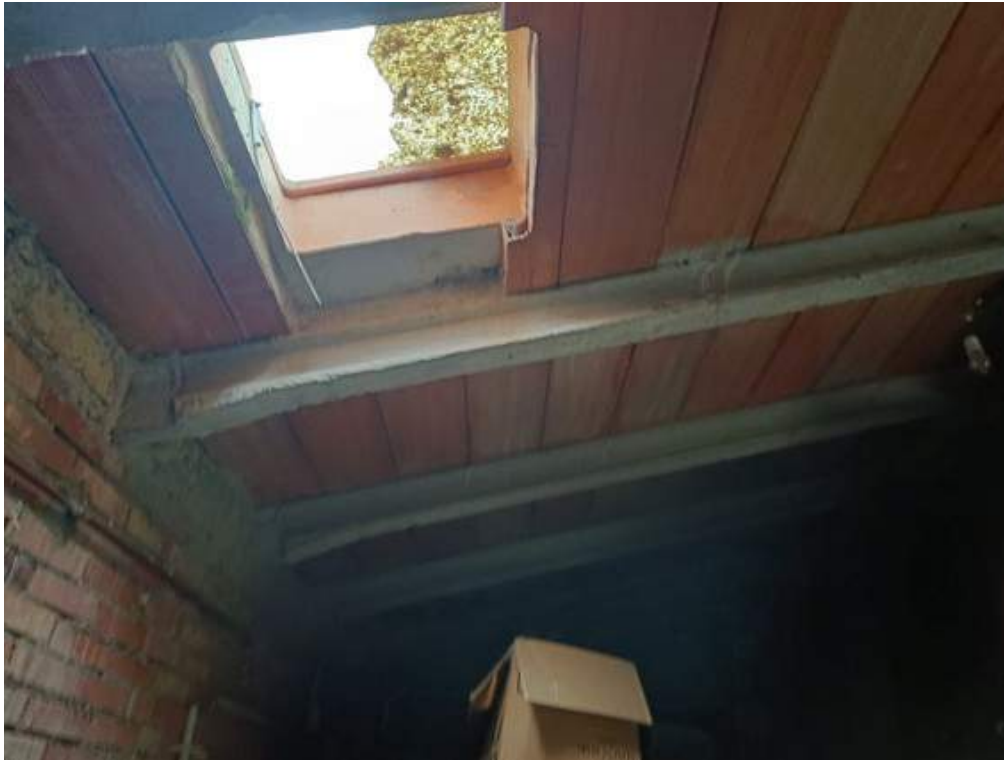
Fotografia I.29 - Lucernario rotto tetto