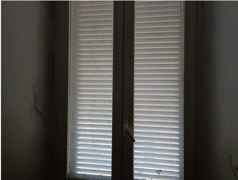
Fotografia I.35 - Vetro rotto infisso camera piano secondo