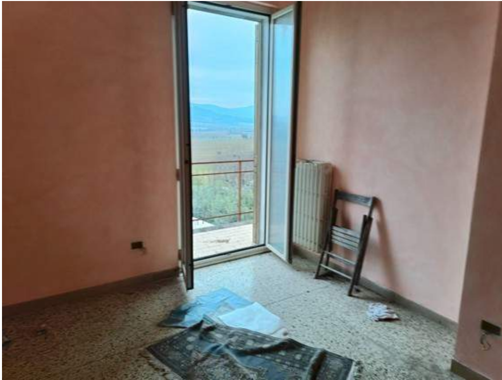
Fotografia I.23 - Camera piano secondo