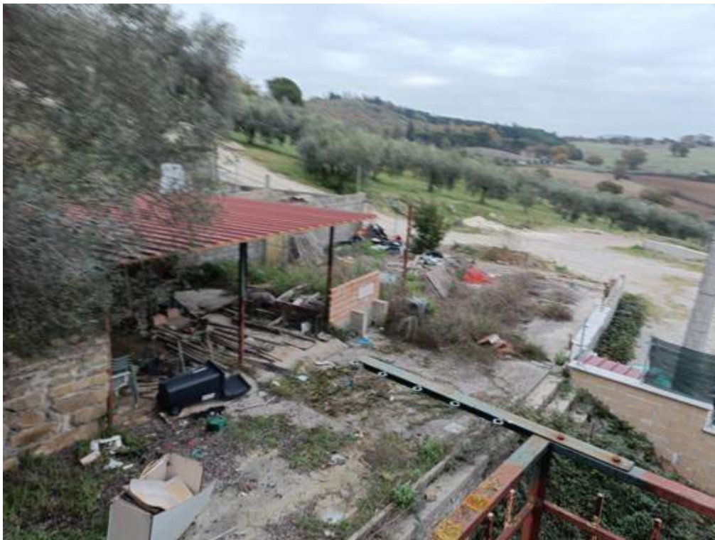
Fotografia I.32 - Corte esterna lato nord