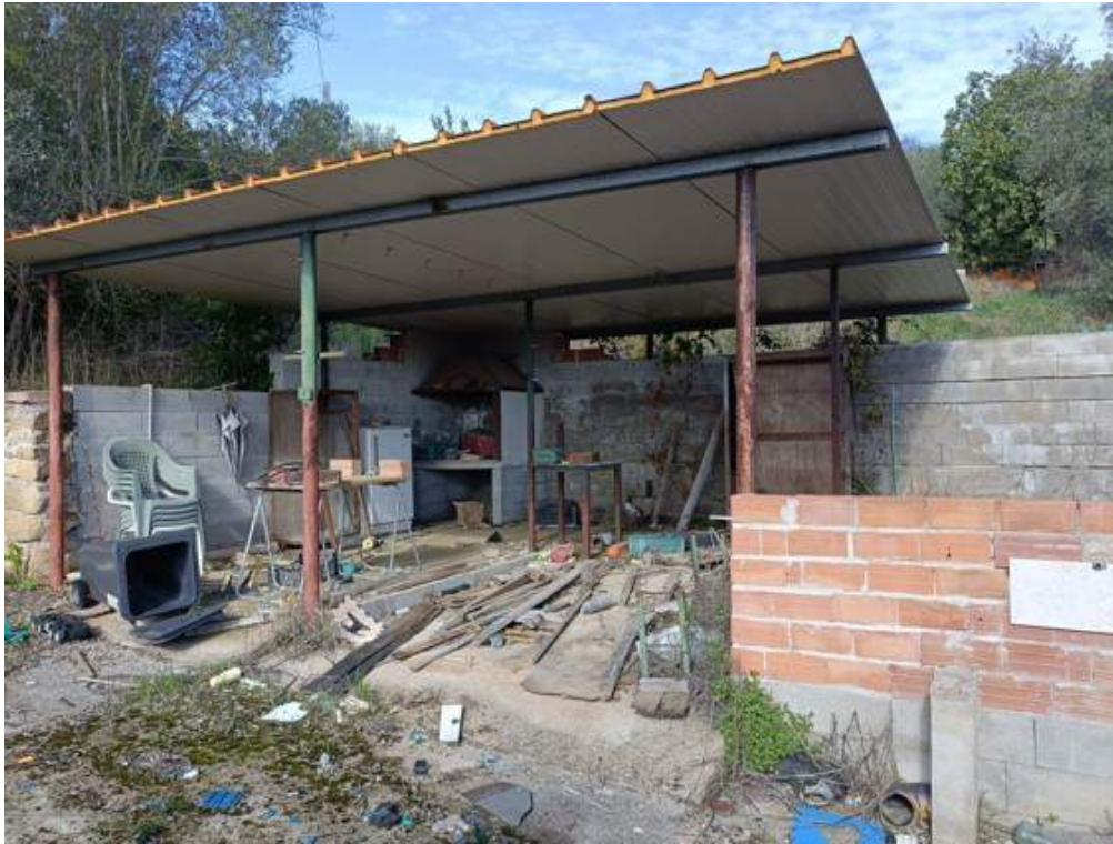
Fotografia I.9 - Manufatto abusivo su corte esterna lato nord