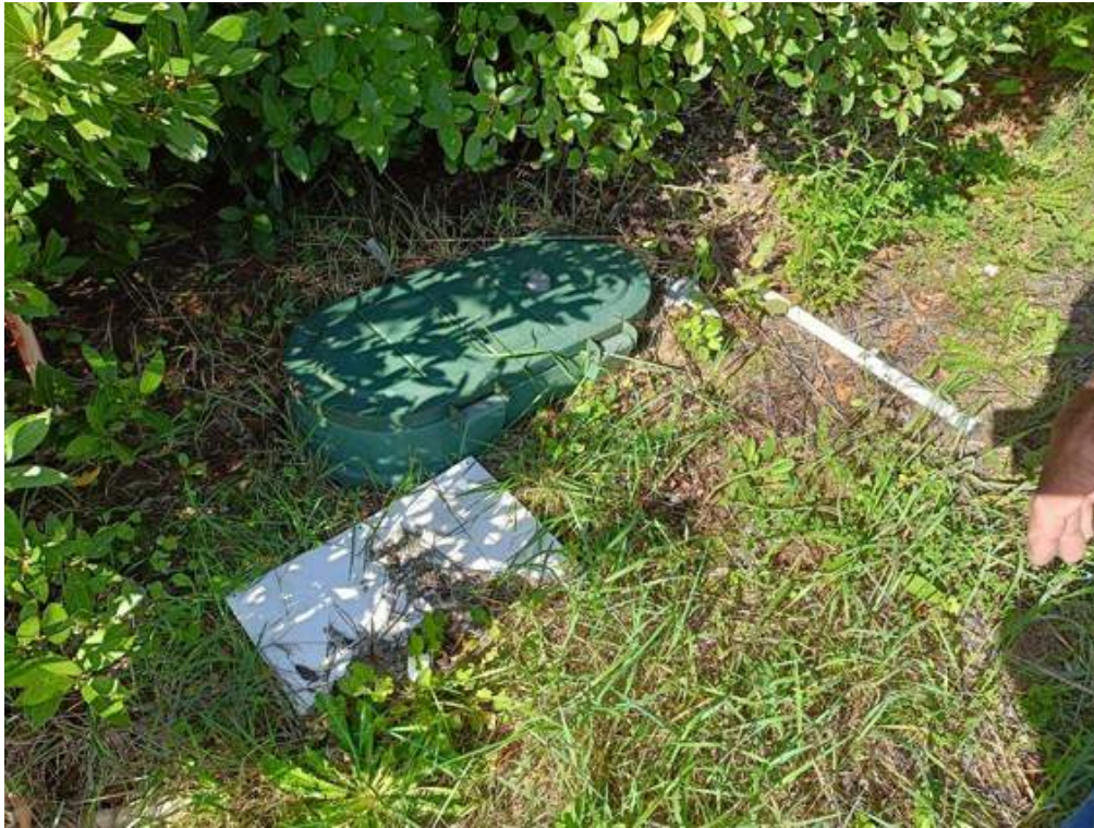
Fotografia I.13 - Bombolone interrato gpl a servizio di vari immobili