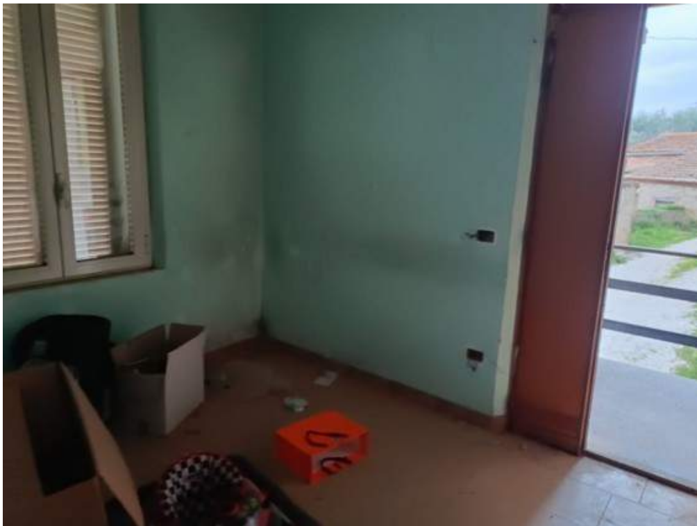
Fotografia I.18 - Ingresso soggiorno piano primo