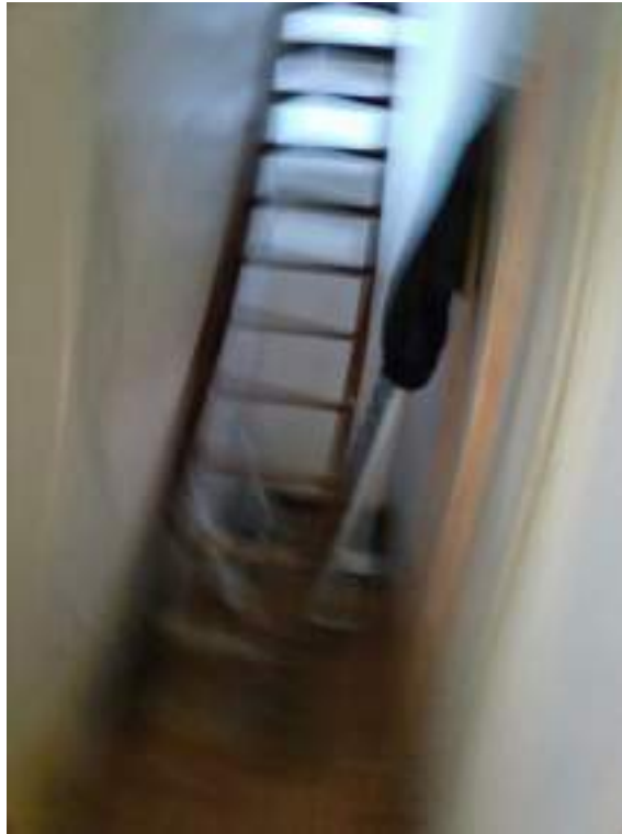
Fotografia I.27 - Scala in legno accesso soffitto