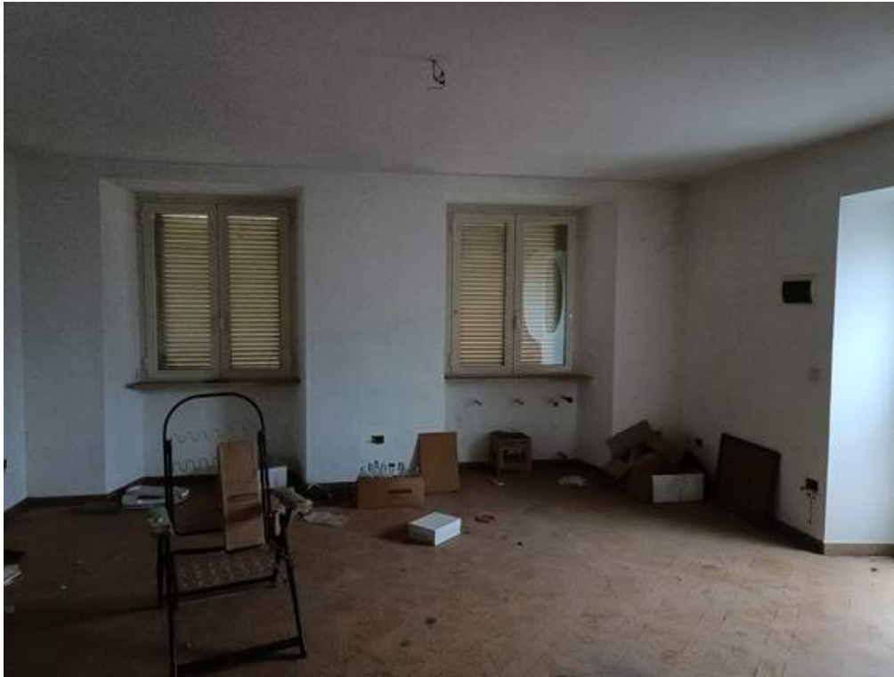
Fotografia I.21 - Locale abitativo piano primo