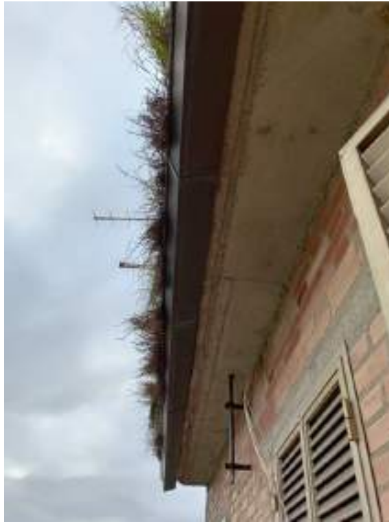
Fotografia I.33 - Gronda tetto lato sud