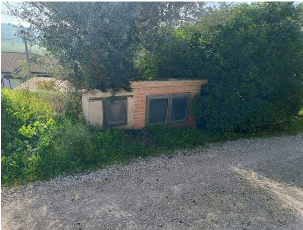
Fotografia I.12 - Contatori utenza acqua