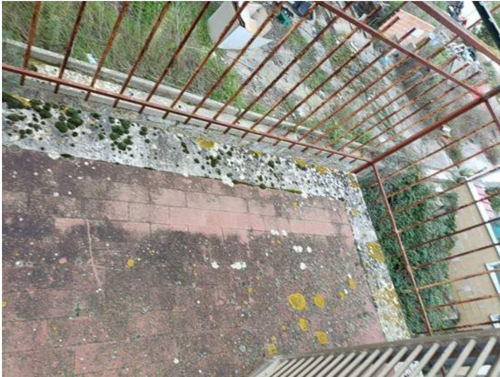
Fotografia I.31 - Balcone piano secondo lato nord