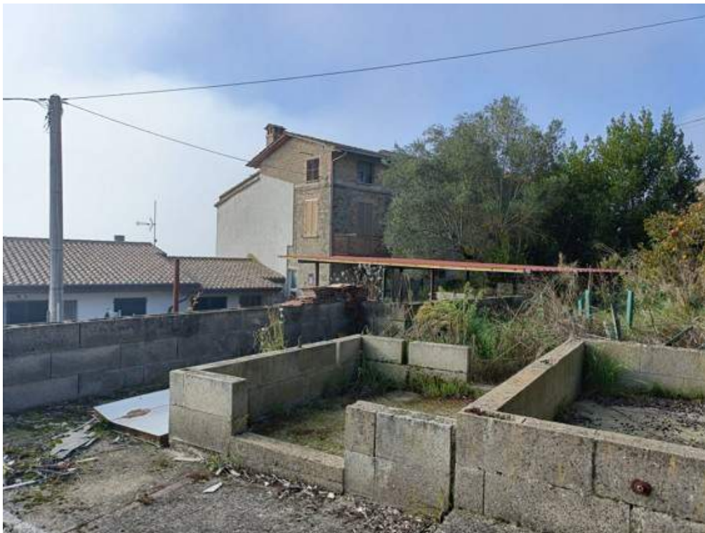
Fotografia I.14 - Muretti su corte esterna di pertinenza