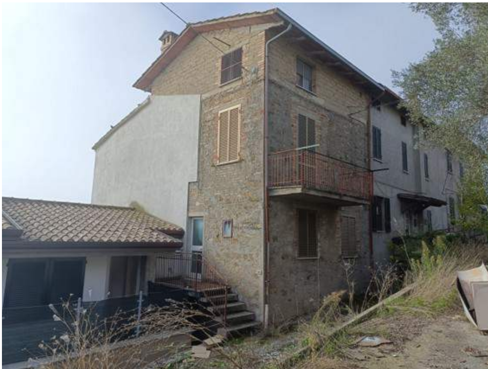
Fotografia I.4 - Fabbricato esterno lati Nord ed Est