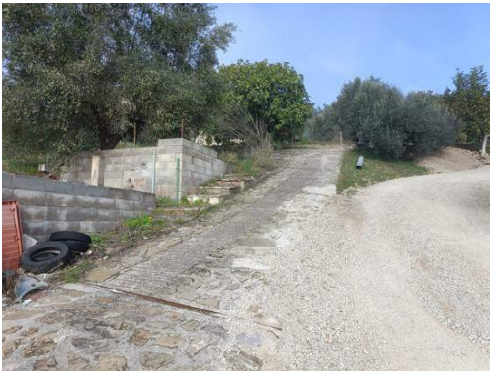
Fotografia I.10 - Strada di servitù passaggio accesso lato nord