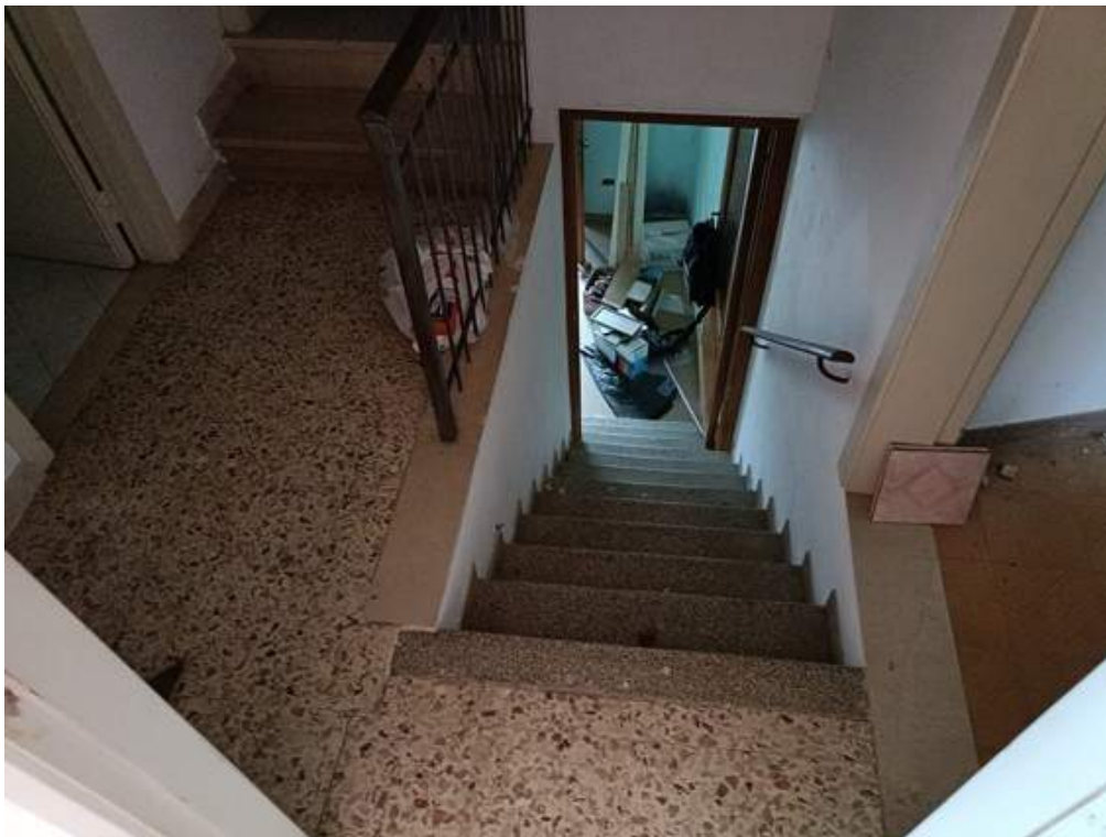
Fotografia I.22 - Scala interna tra piano primo e secondo