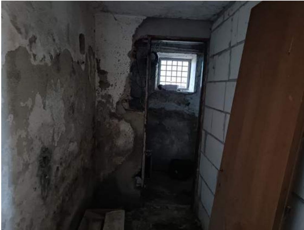
Fotografia I.17 - Piano terra infiltrazioni parete controterra