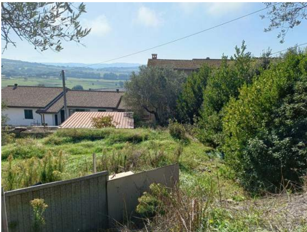
Fotografia I.8 - Corte annessa di pertinenza lato nord