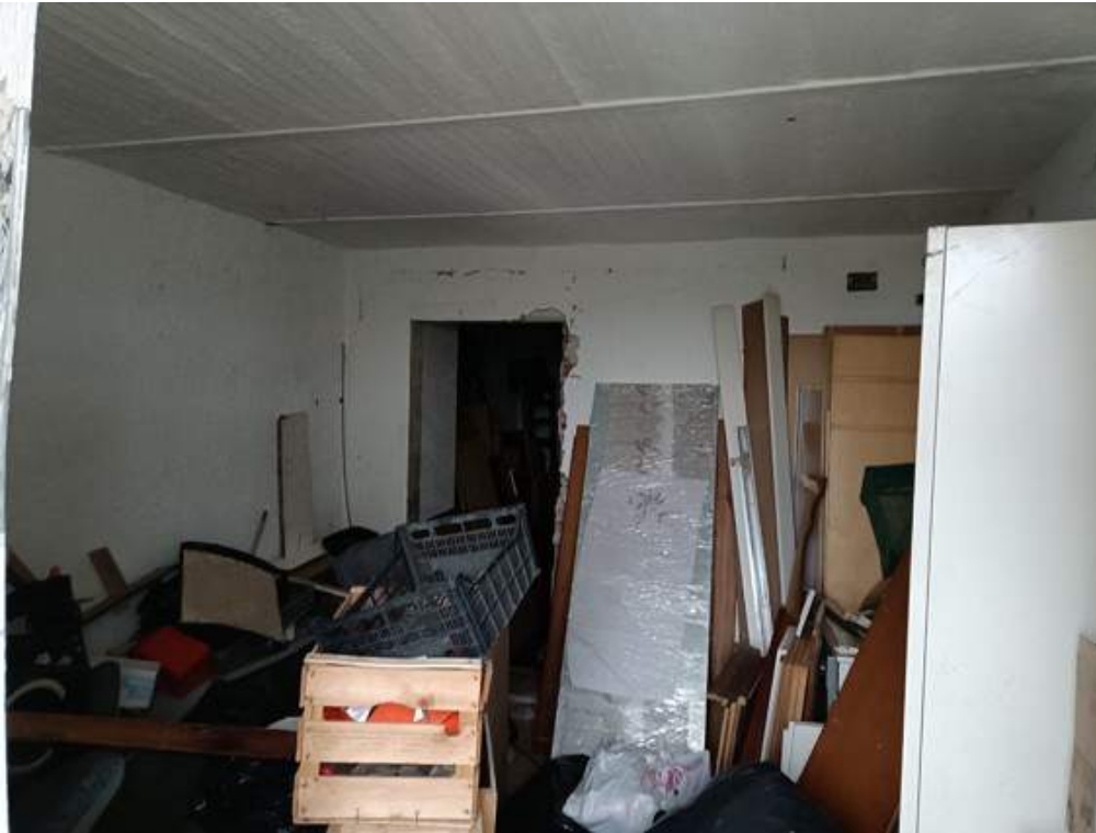
Fotografia I.15 - Fondo piano terra