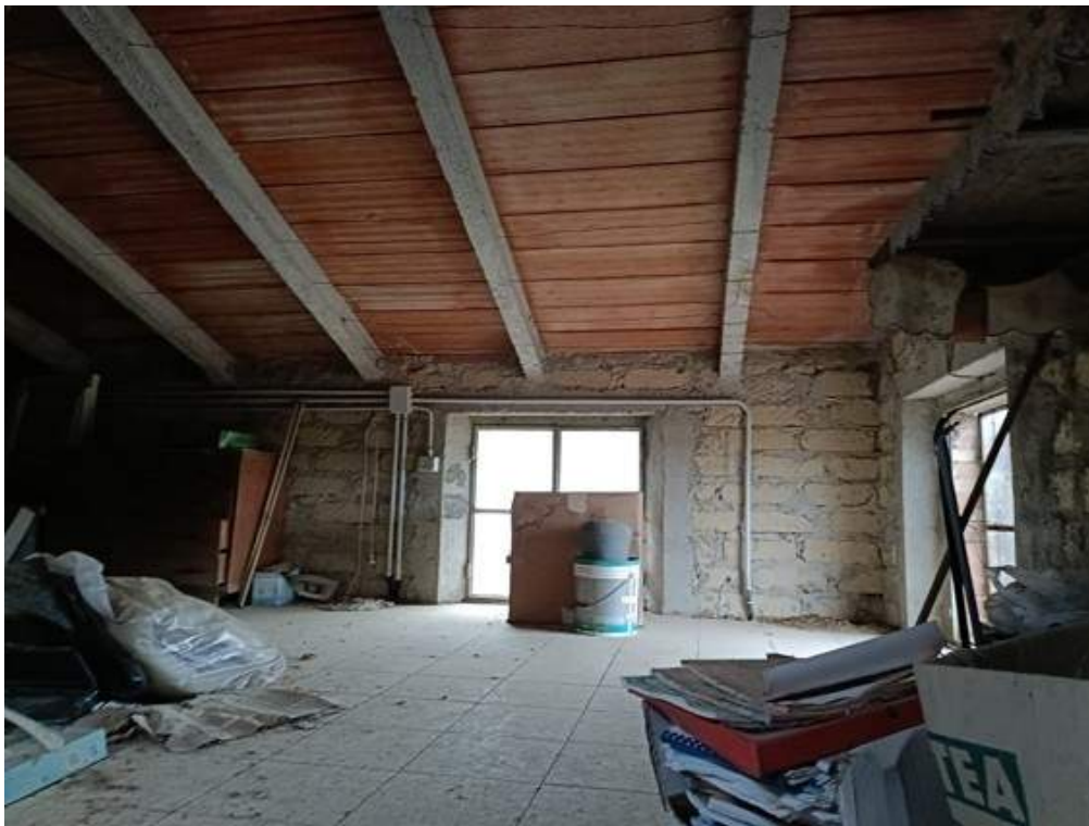
Fotografia I.28 - Soffitta piano terzo