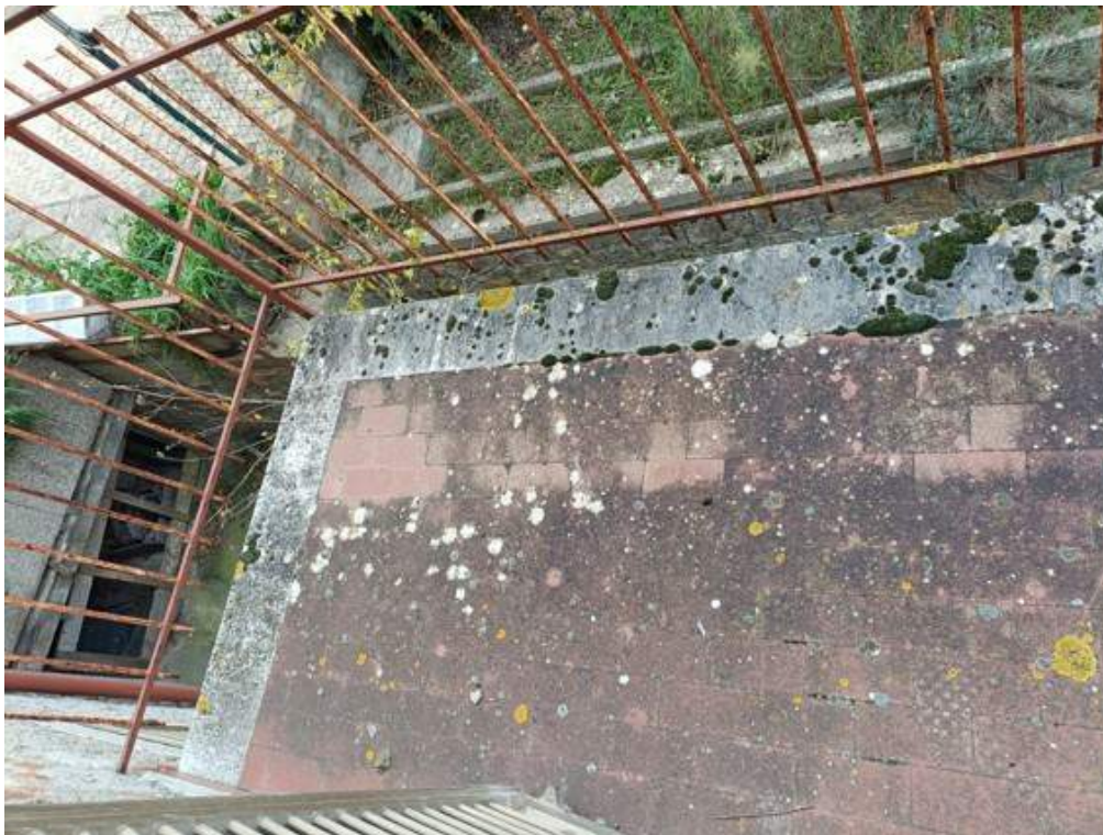
Fotografia I.30 - Balcone piano secondo lato sud