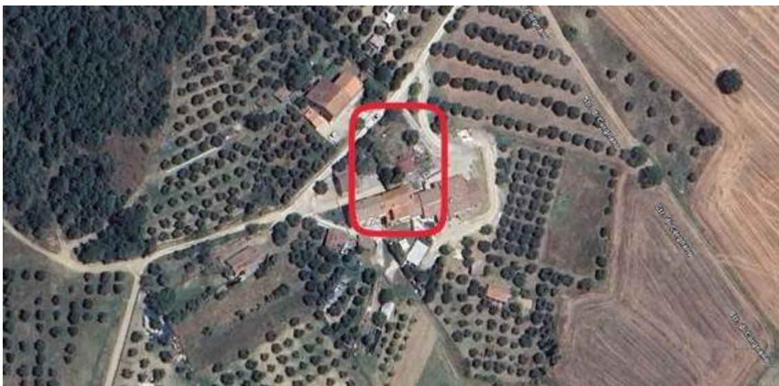
Fotografia I.2 - Foto aerea del fabbricato con corte