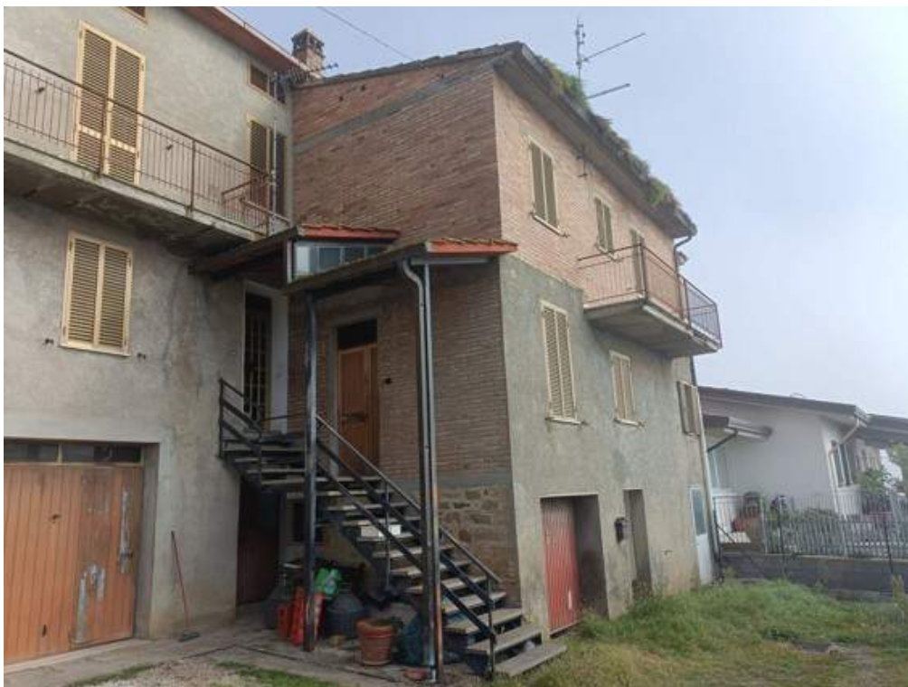
Fotografia I.6 - Fabbricato esterno lato Sud con scala comune lato Ovest