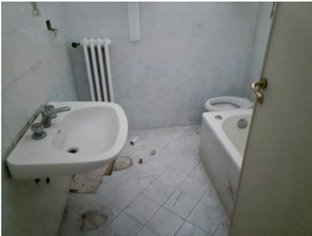
Fotografia I.26 - Bagno piano secondo