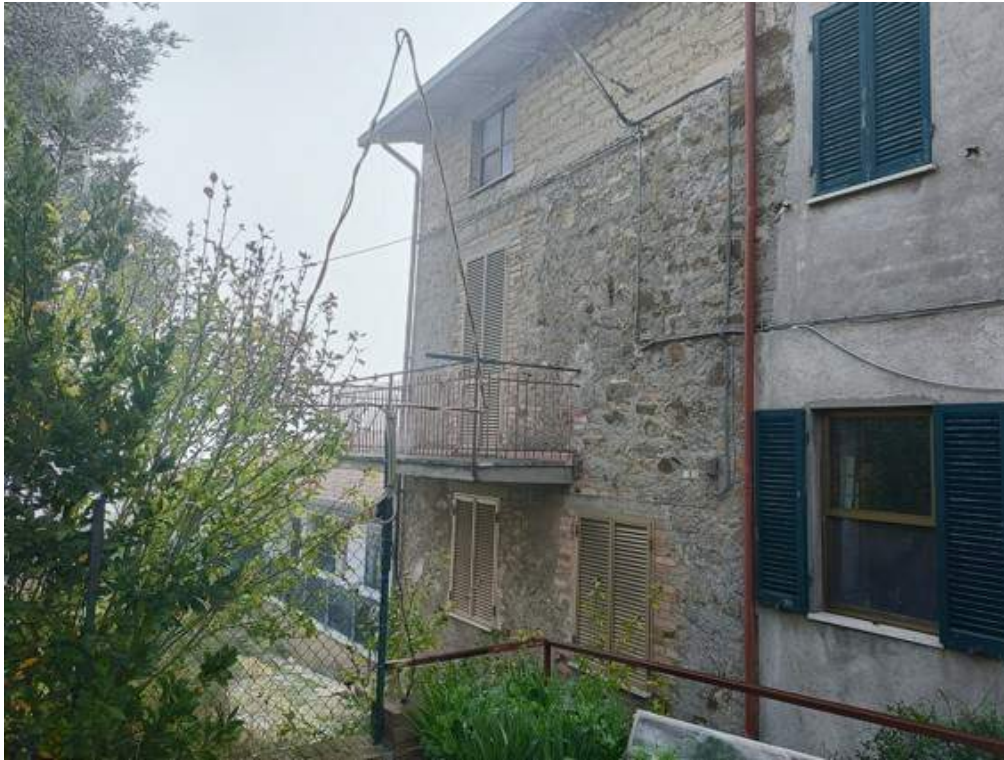
Fotografia I.5 - Esterno lato Est