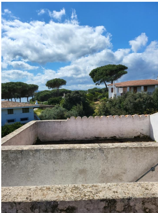
Foto 15 - Terrazze al piano primo