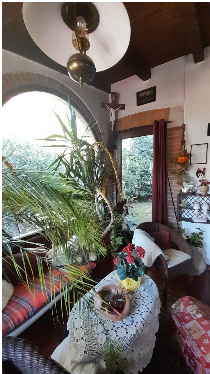
FOTO 21 – FINESTRA AUTORIZZATA E NON INDICATA IN PLANIMETRIA CATASTALE