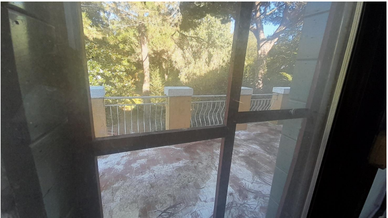
FOTO 31 – TERRAZZO FRONTE EST, ACCESSIBILE DA CAMERA ADIBITA A CUCINA