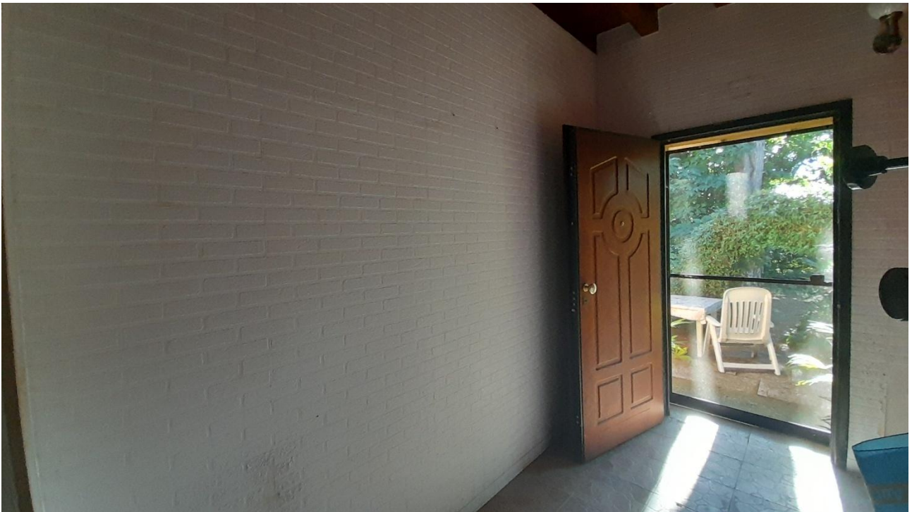
FOTO 27 – PORTA DI ACCESSO E PARETE REALIZZATI IN ASSENZA DI TITOLO