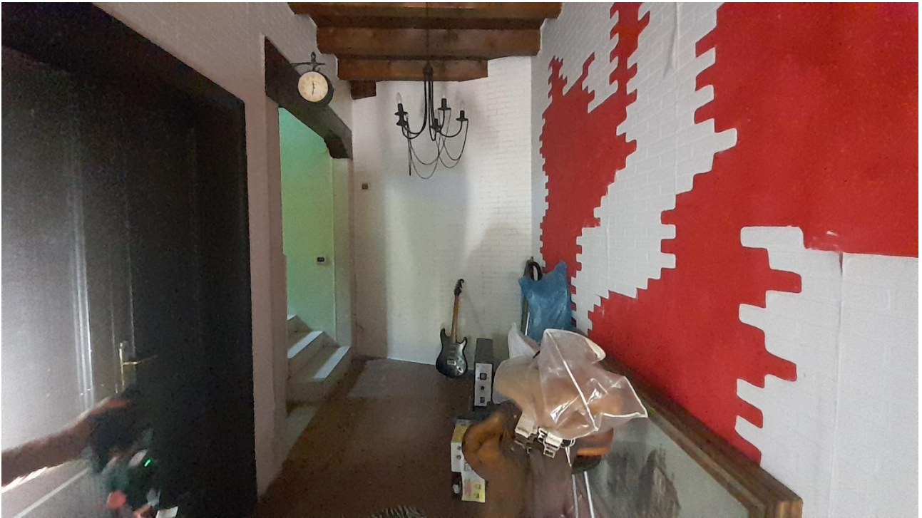
FOTO 28 – SCALA DI ACCESSO AL PIANO PRIMO E PARETI REALIZZATE IN ASSENZA DI TITOLO ANDRONE RICAVATO PER ACCEDERE AUTONOMAMENTE AL PIANO PRIMO