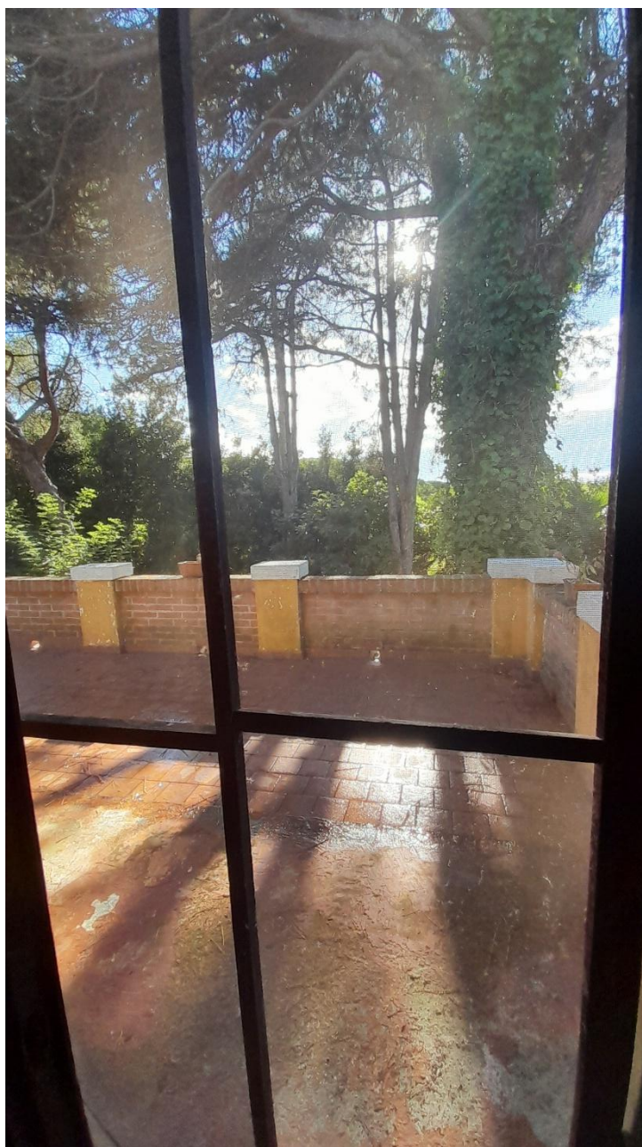
FOTO 31 – TERRAZZO FRONTE OVEST ACCESSIBILE DA CORRIDOIO AL PIANO PRIMO