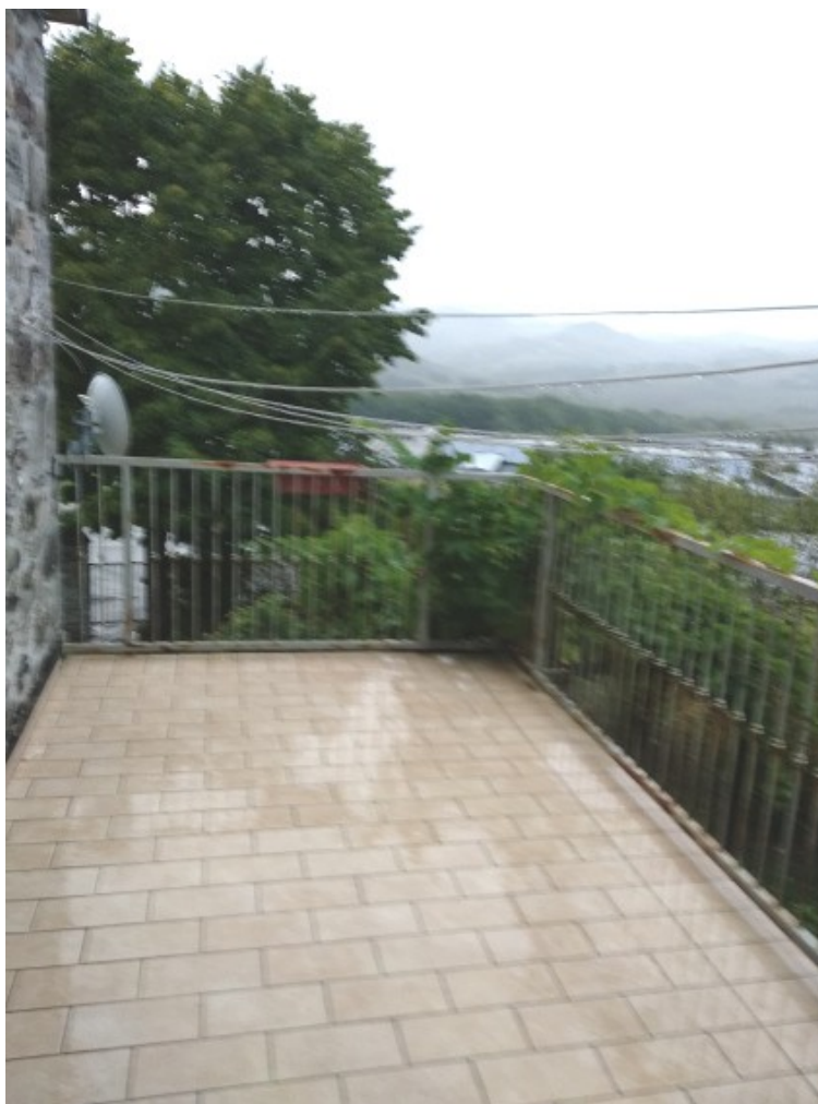
FOTO 18- terrazzo piano primo