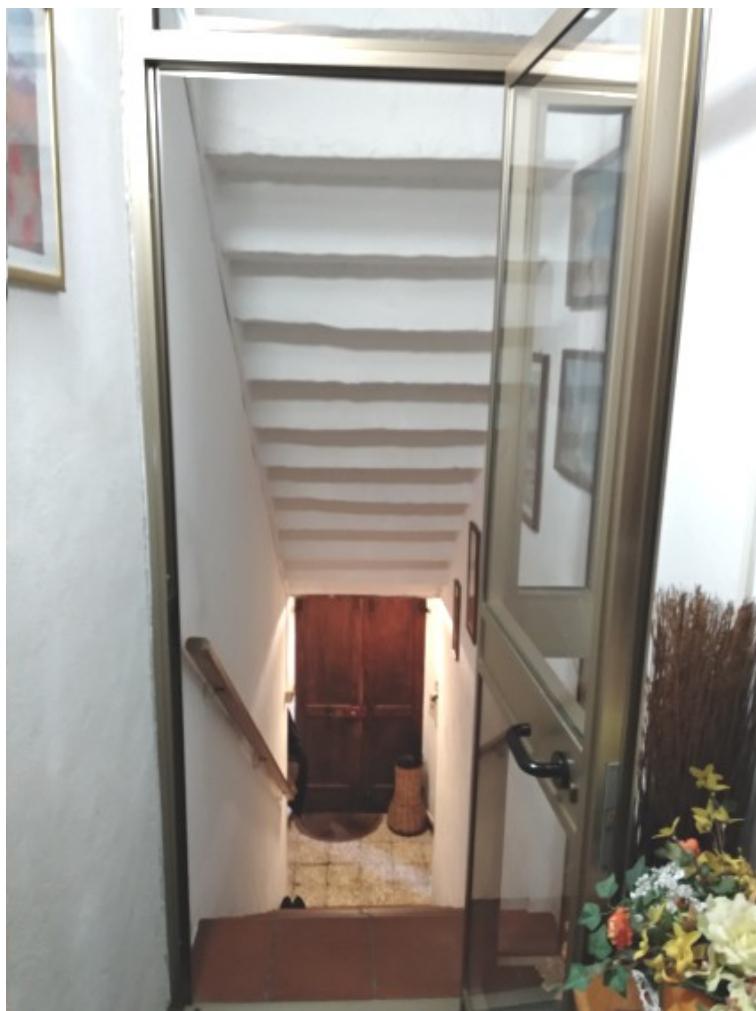
FOTO 12 - interno piano primo