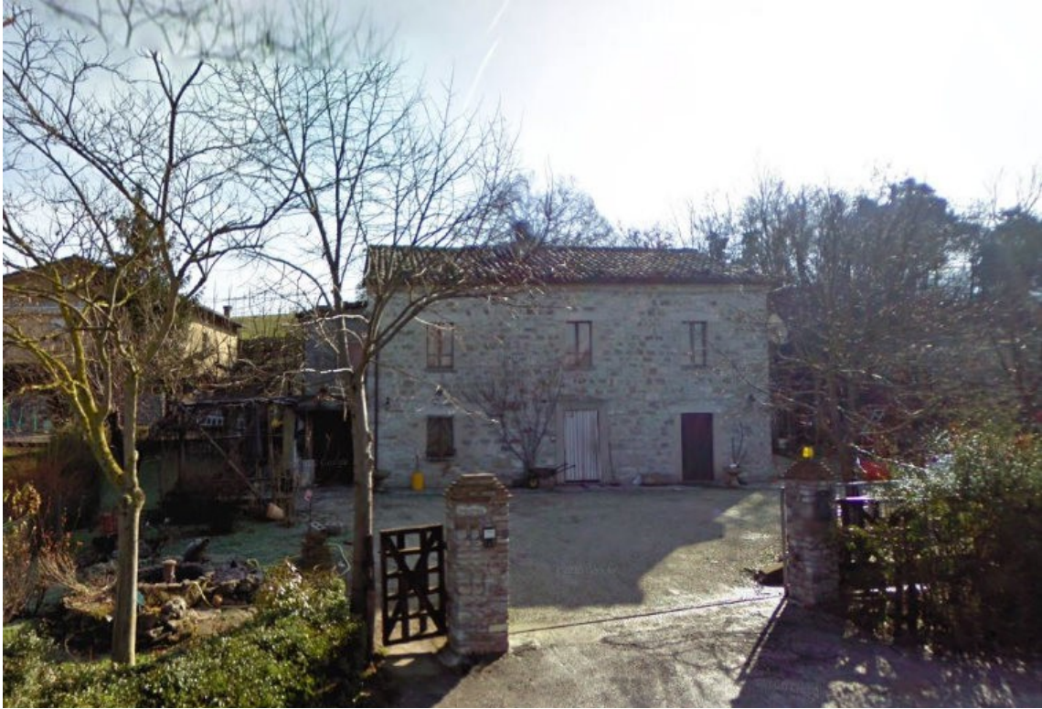
FOTO 02 - esterno