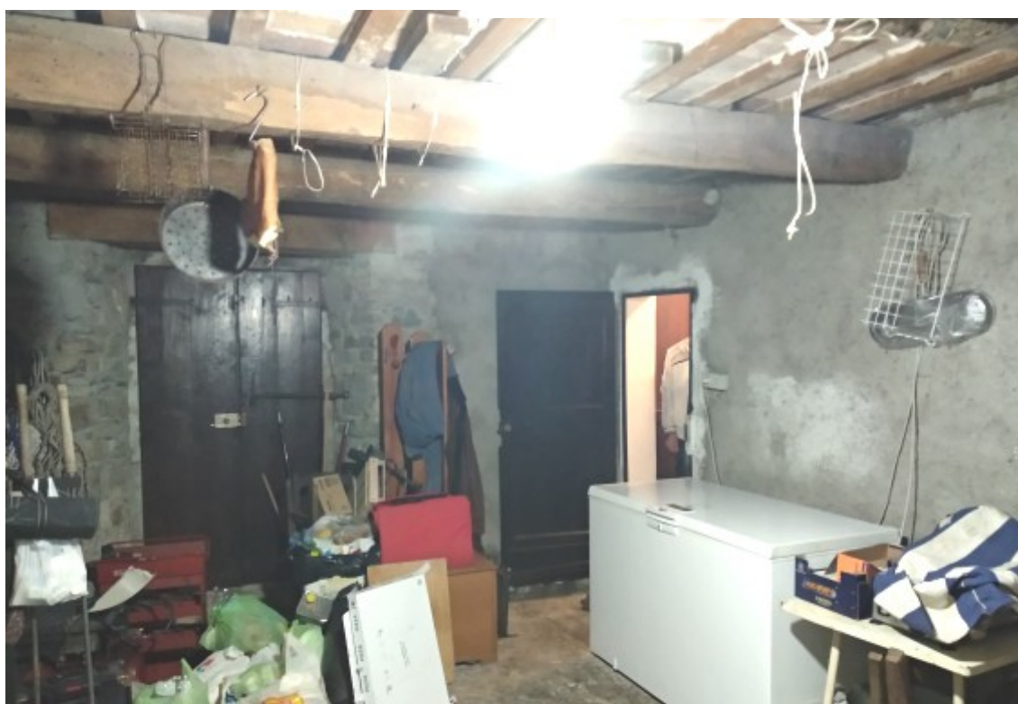
FOTO 11- cantina