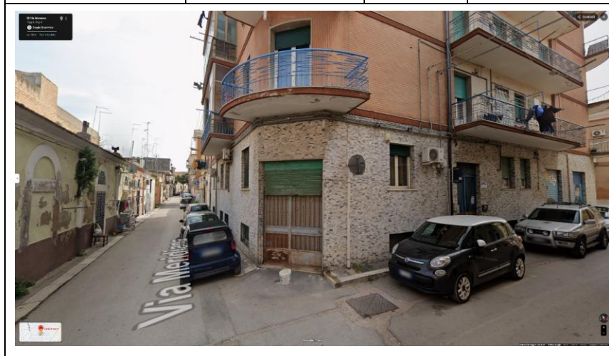
Unità Negoziale in FOGGIA (FG) via Meridiana n. 44- Piano Terra