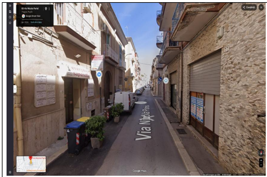
Unità Negoziale in FOGGIA (FG) via Parisi n. 77- Piano Terra