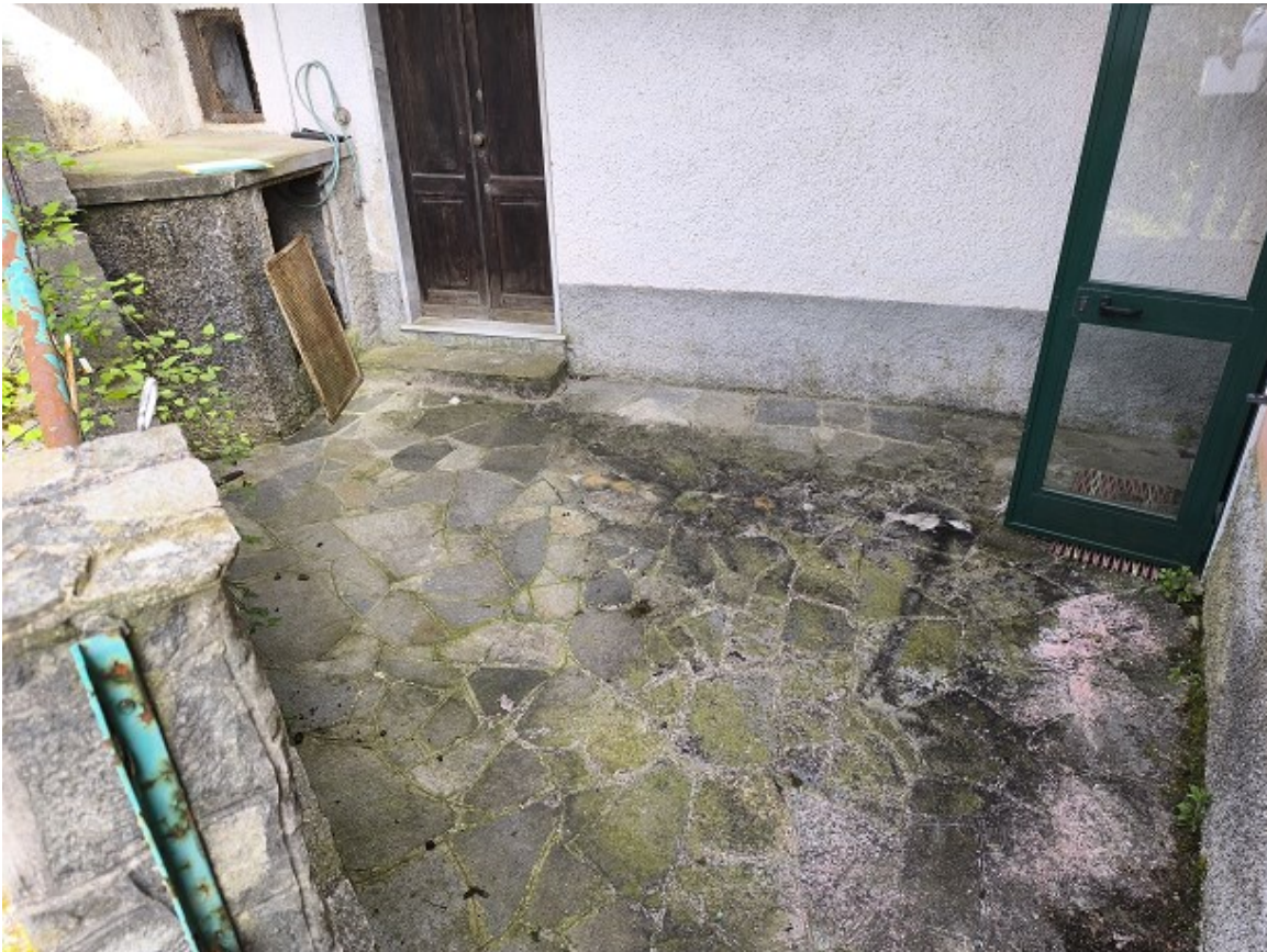
Foto 3: Piano primo sotto strada, cortile annesso con porta di ingresso alla cantina sulla sinistra e sulla destra anche all'unità immobiliare Part. 485 Sub. 2 non in oggetto