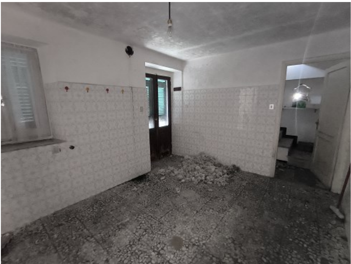
Foto 16: P.T, cucina con porta finestra sul poggiatesta di ingresso. Oltre la porta interna sulla destra si accede al vano scala che collega al piano primo