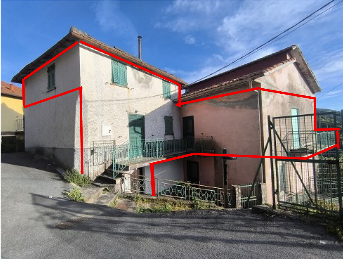
Foto 2: Fronte nord ovest con evidenziazione dell'appartamento sub. 4