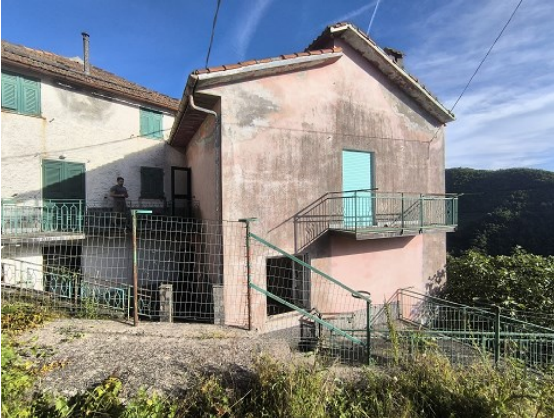
Foto 29: Fronte nord ovest; l'edificio di colore rosa presenta il poggiolo della camera dell'unità immobiliare in oggetto (catastalmente a piano terreno) e al piano sottostante (primo sotto strada) si vede la finestra dell'u.i. Part. 845 Sub. 2 non in oggetto