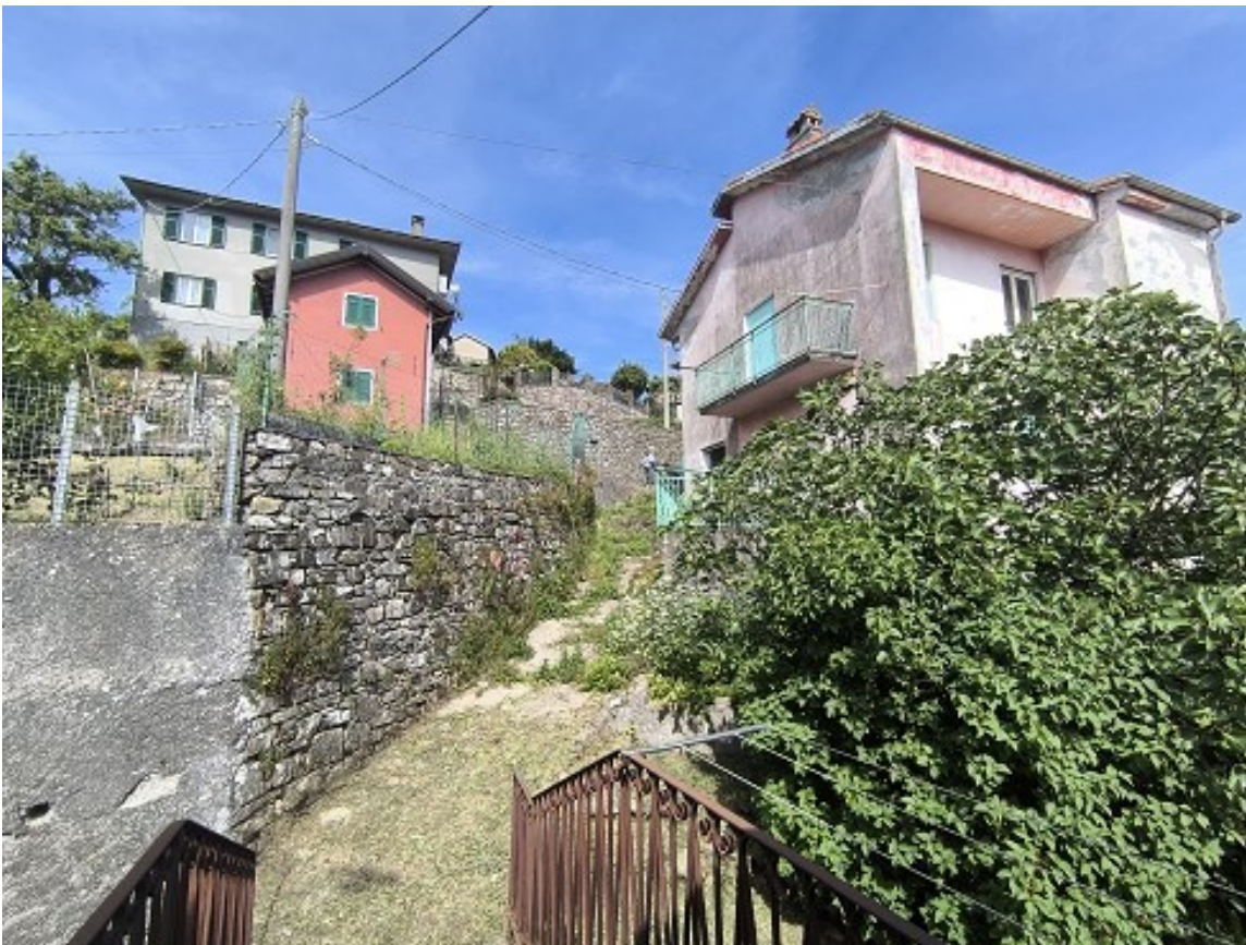
Foto 28: Strada comunale che separa il giardino sulla sinistra dal fabbricato sulla destra