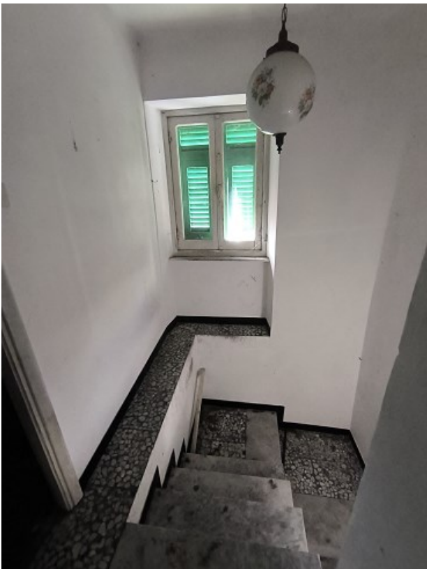
Foto 19: vano scala, pianerottolo con finestra sopra al poggiolo di ingresso verso nord ovest