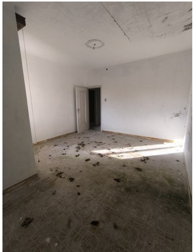
Foto 12-13: camera con affaccio verso sud ovest, pavimento disseminato di escrementi di animali