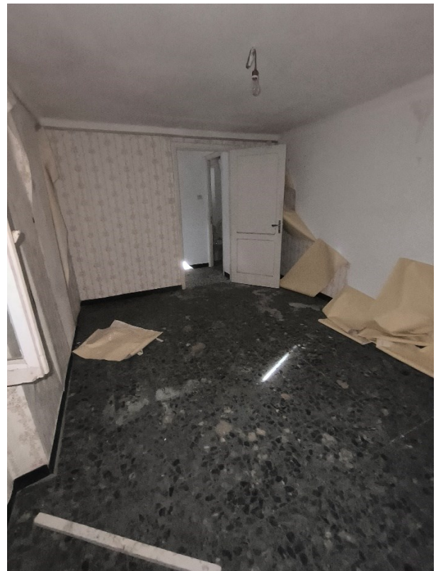
Foto 23-24: Piano primo camera con tappezzeria cadente e finestra verso nord ovest