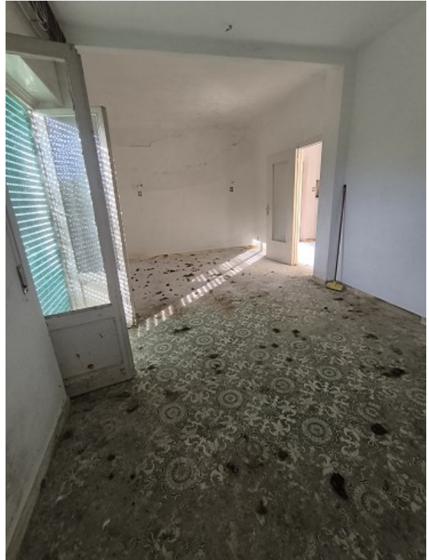
Foto 14-15: camera con affaccio verso ovest, finestra sul fronte sud ovest e porta finestra con poggiatesta sul fronte nord ovest, pavimento disseminato di escrementi di animali