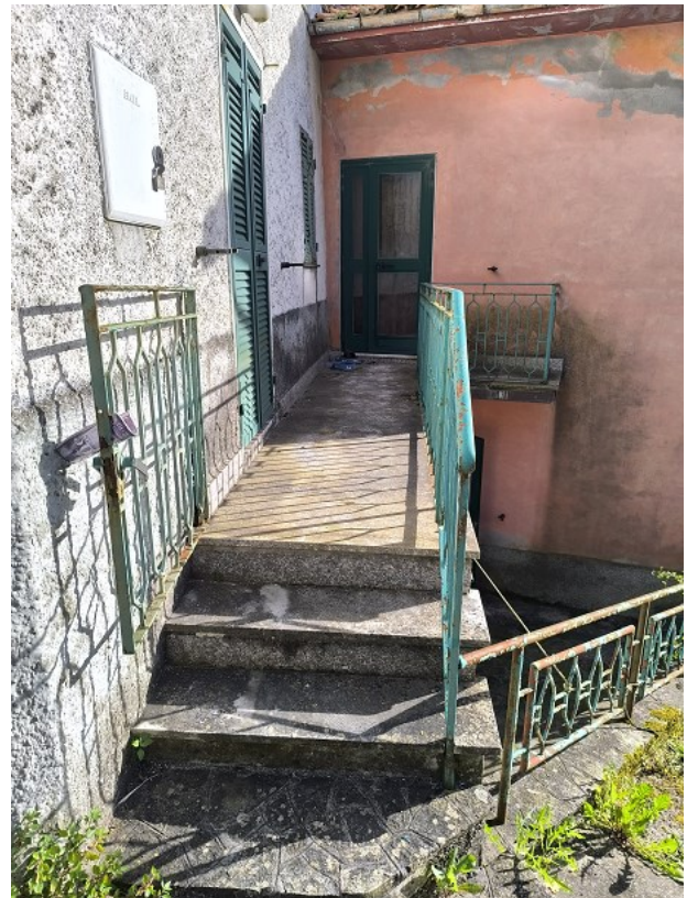
Foto 10: Piano Terra, poggiolo di ingresso (porta verde sul fronte di colore rosa)