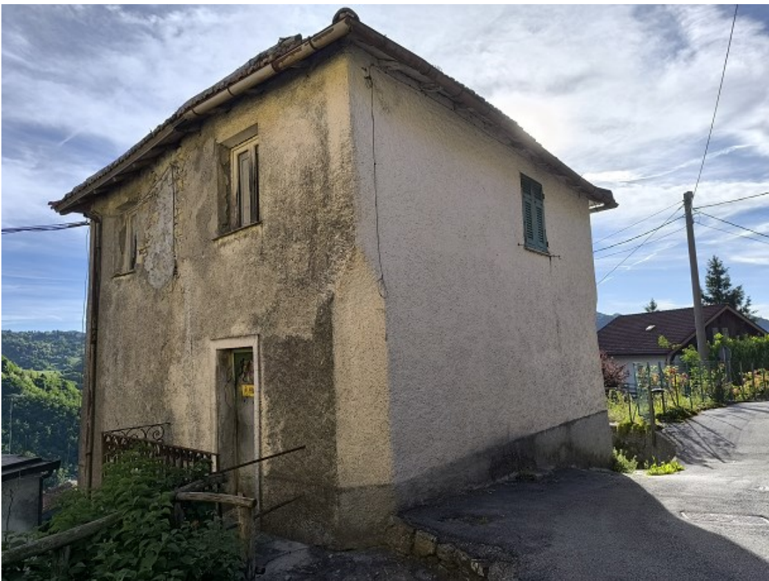
Foto 30: Fronte Nord est sulla strada pubblica; solo la finestra sul fronte di colore bianco a piano primo corrisponde all'u.i. in oggetto (bagno)