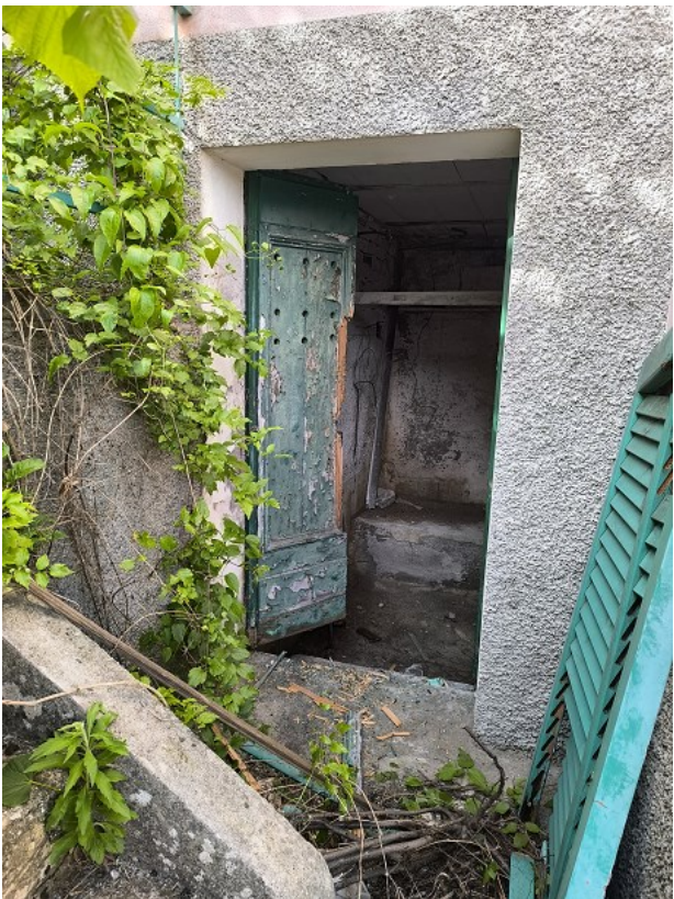
Foto 13: Piano terzo sotto strada fronte sud ovest, porta ingresso cantina