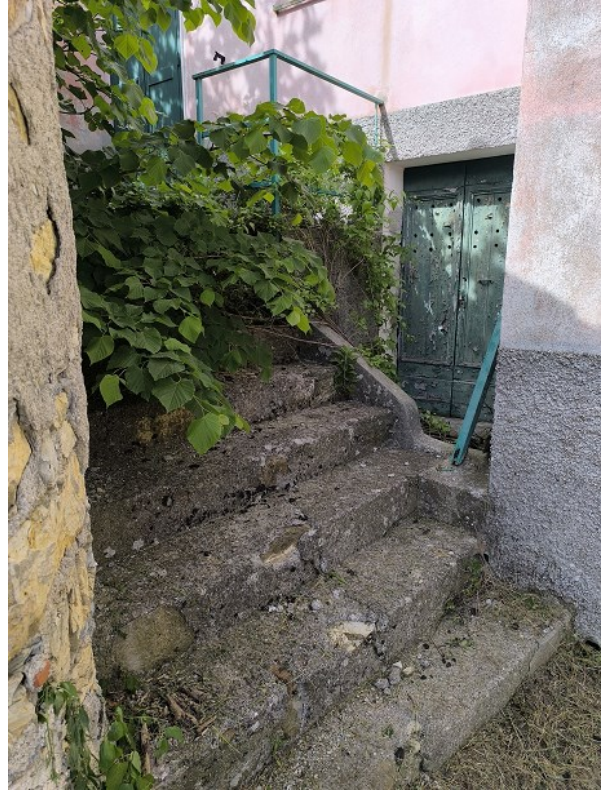
Foto 5: Piano terzo sotto strada, fronte sud ovest, ingresso alla cantina