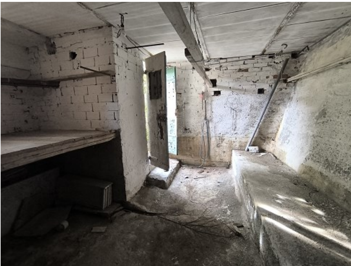
Foto 16: Interno cantina, a destra il muro inclinato verso l'intercapedine