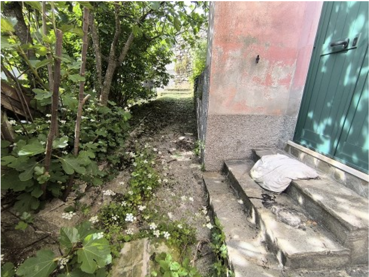
Foto 19: spazio antistante l'ingresso dell'appartamento (nella cucina), sulla destra lungo il fronte, in posizione sopraelevata l'aiuola di proprietà