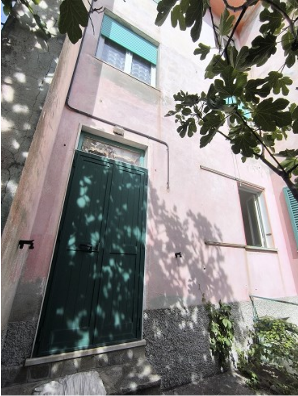
Foto 4: Piano secondo sotto strada, fronte sud ovest, ingresso alla cucina dell'appartamento e sulla destra finestre della camera e del bagno