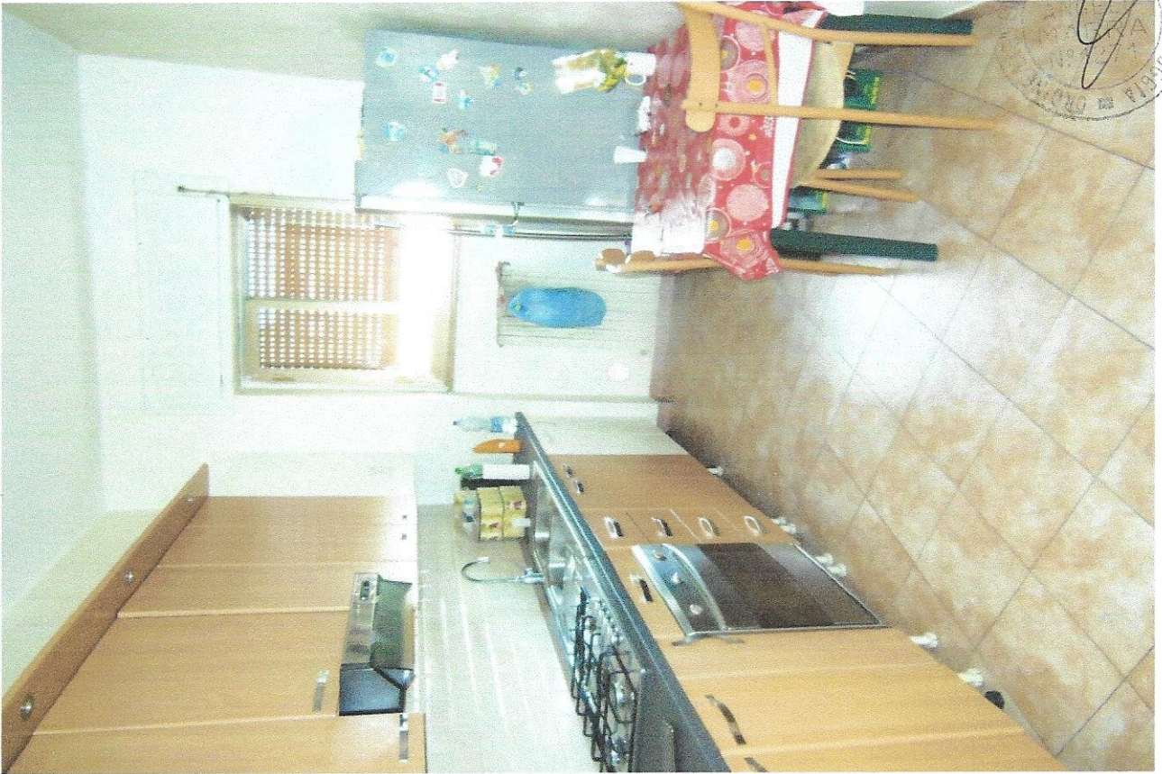
5 – Part. ambiente cucina