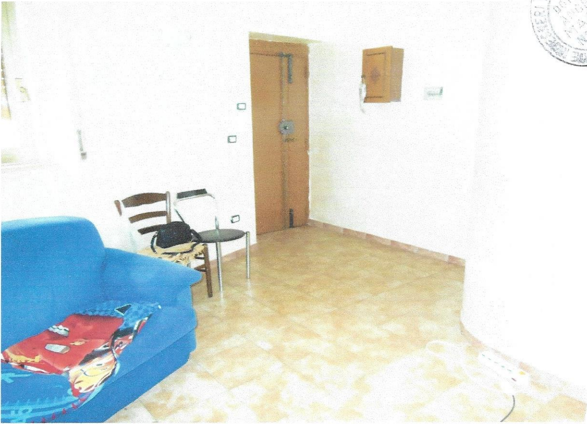
3 – Part. ambiente ingresso – soggiorno/pranzo