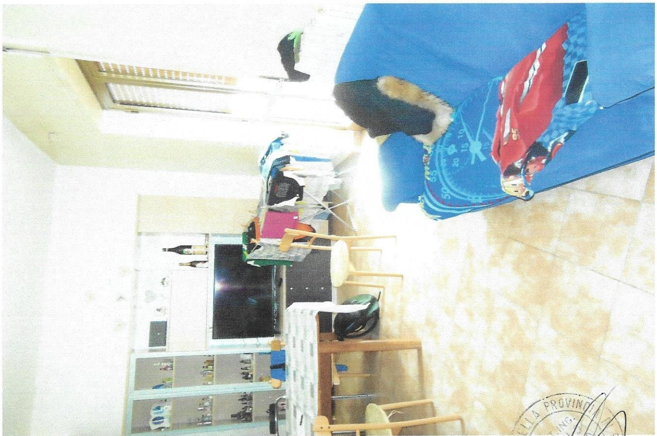
4 – Part. ambiente soggiorno/pranzo – cucina