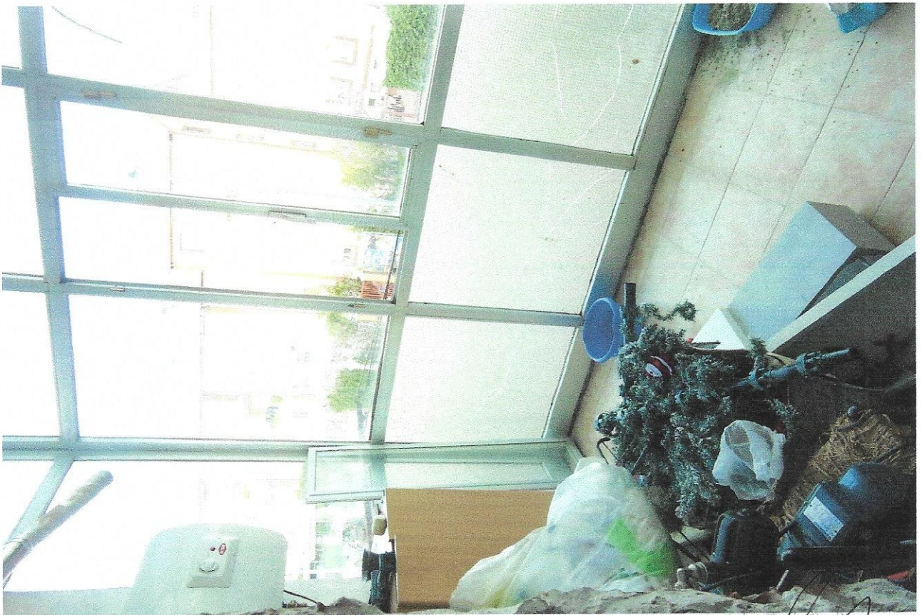
10 – Part. balcone