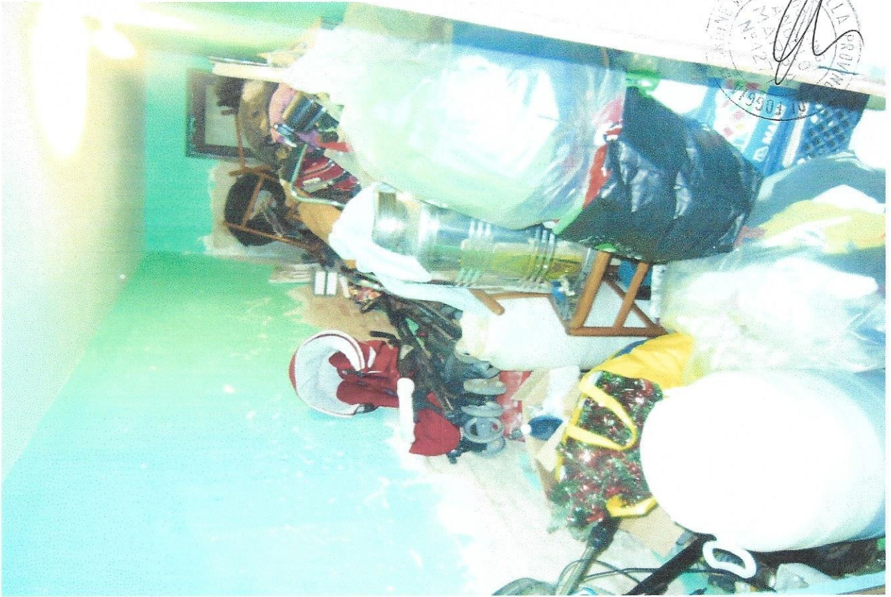
11 – Part. deposito a p.t.