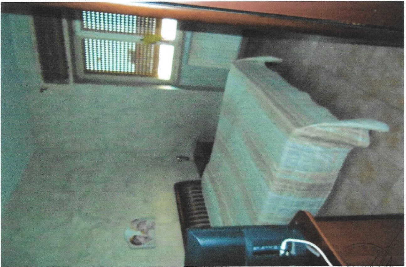
6 – Part. camera da letto matrimoniale