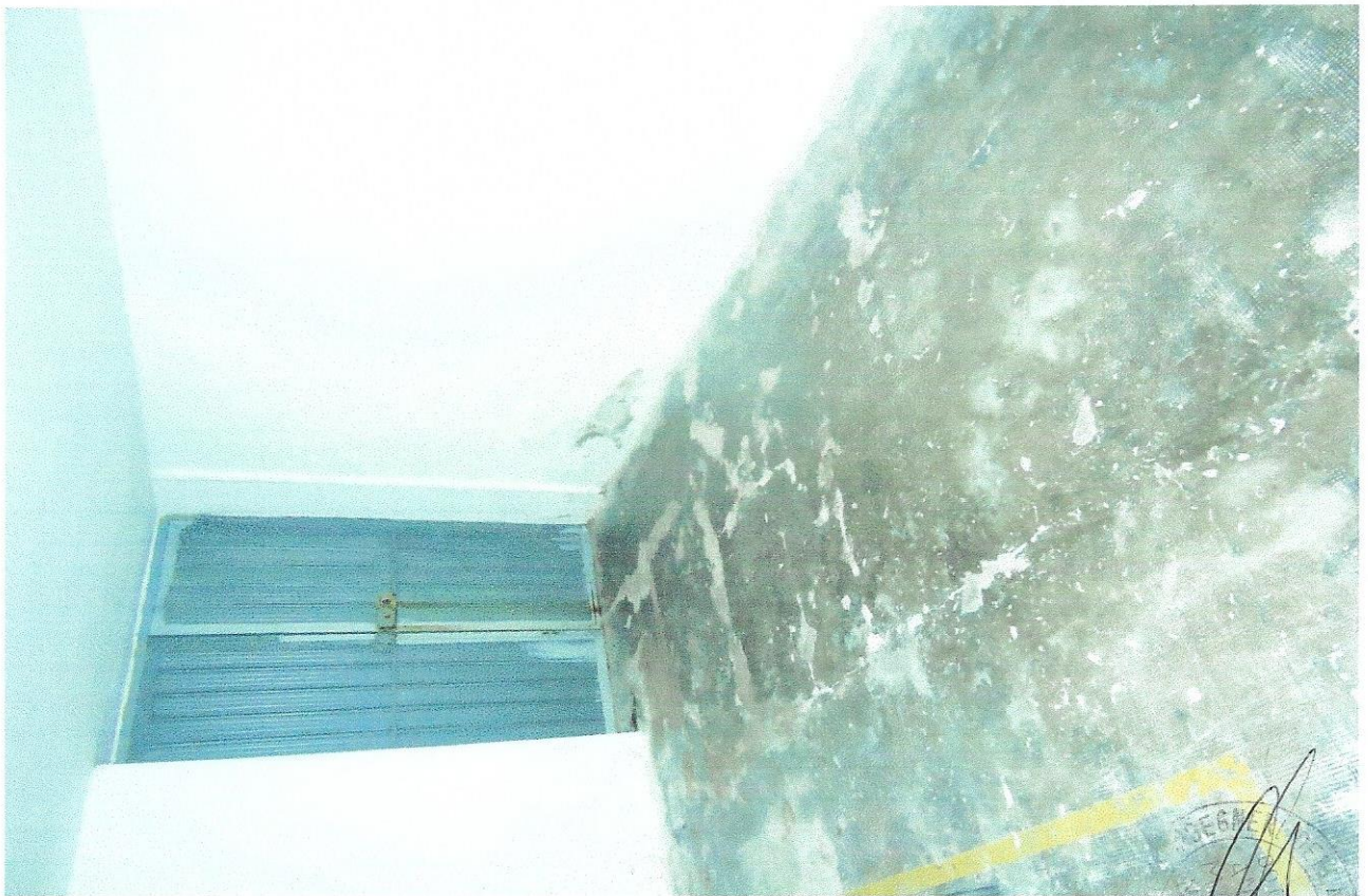
12 – Part. atrio comune depositi pertinenziali