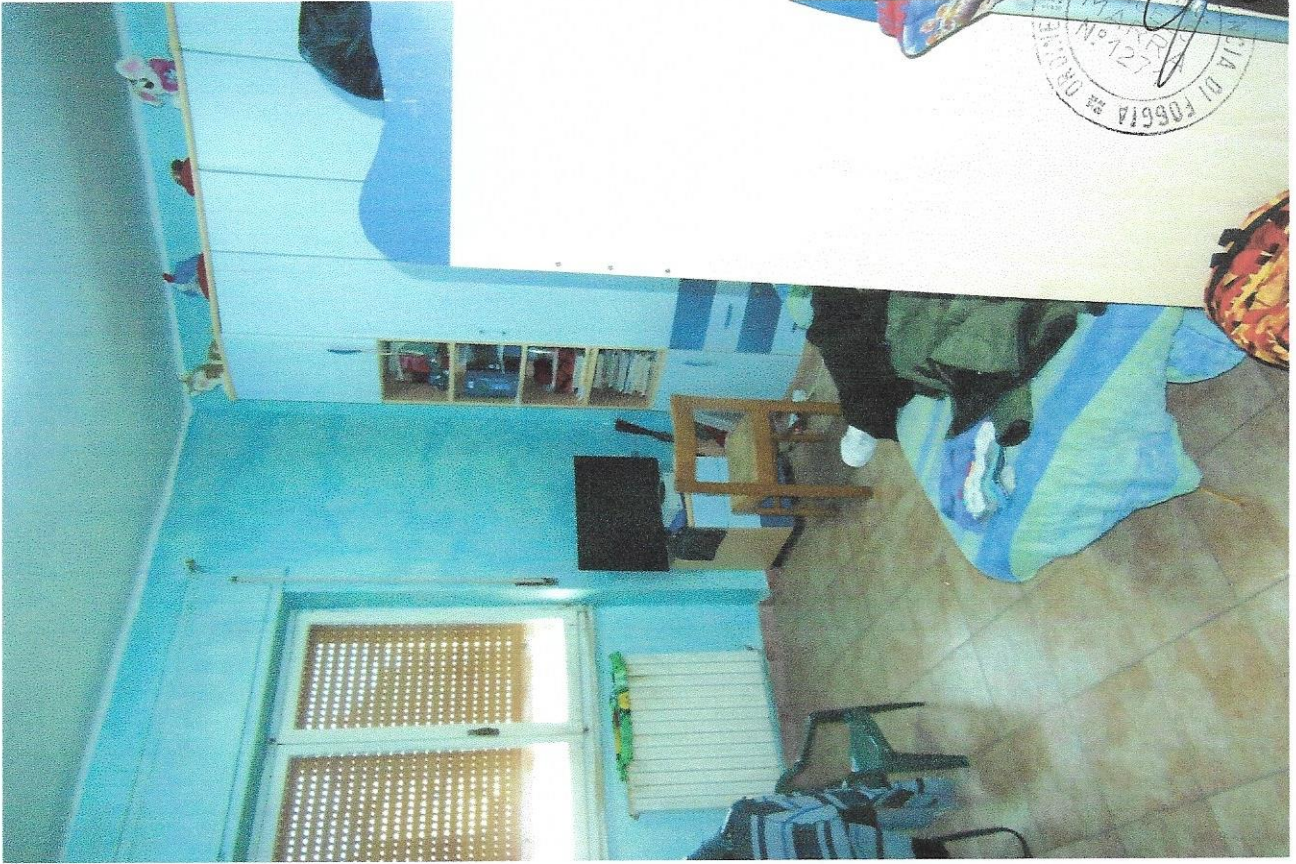
7 – Part. cameretta