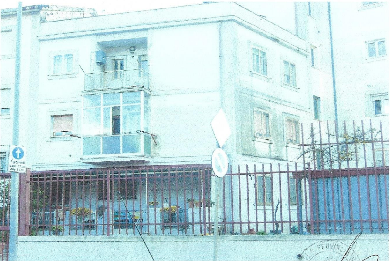
2 – Part. prospetto secondario appartamento su via G. Cesare