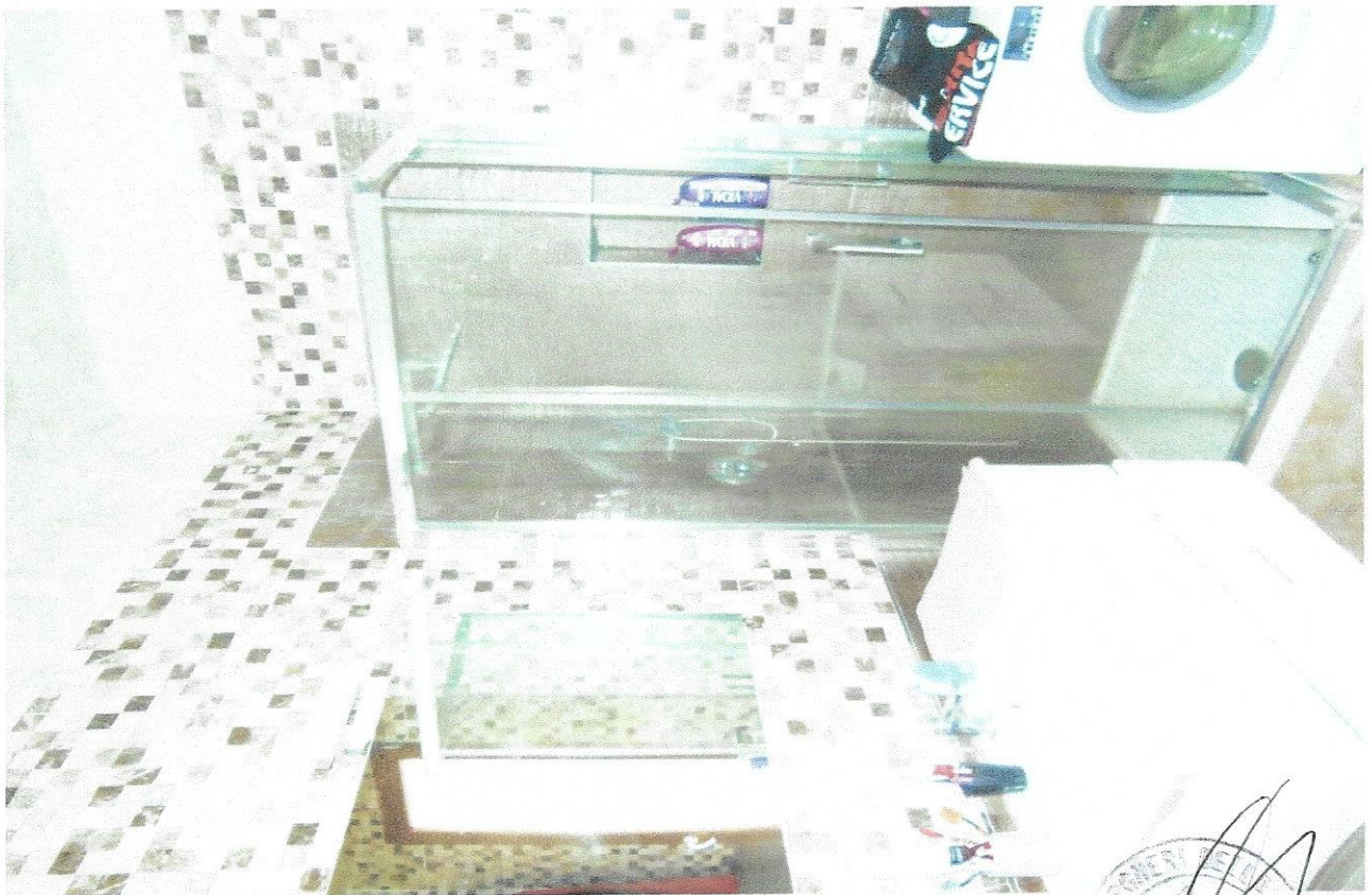
8 – Part. bagno