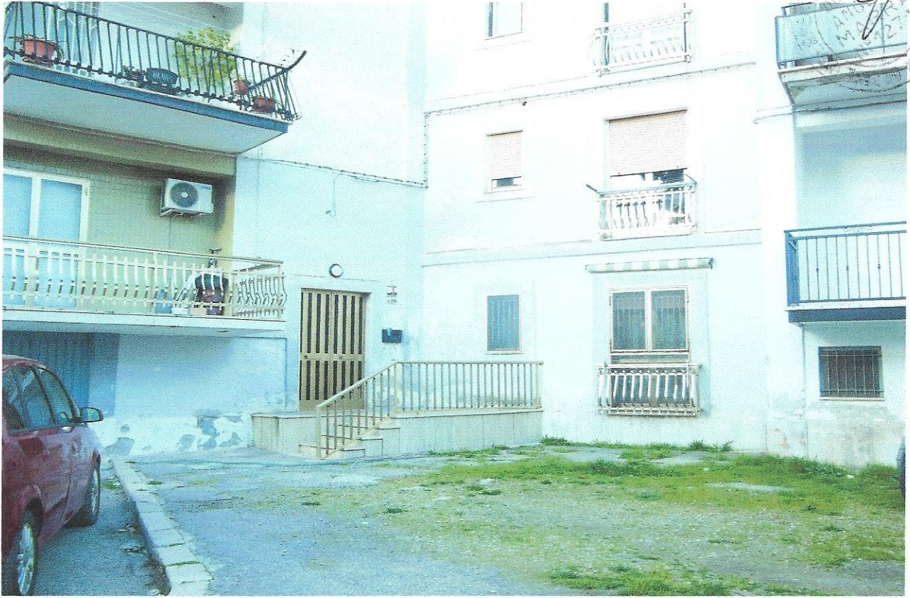
1 – Part. prospetto principale appartamento su via G. Cesare