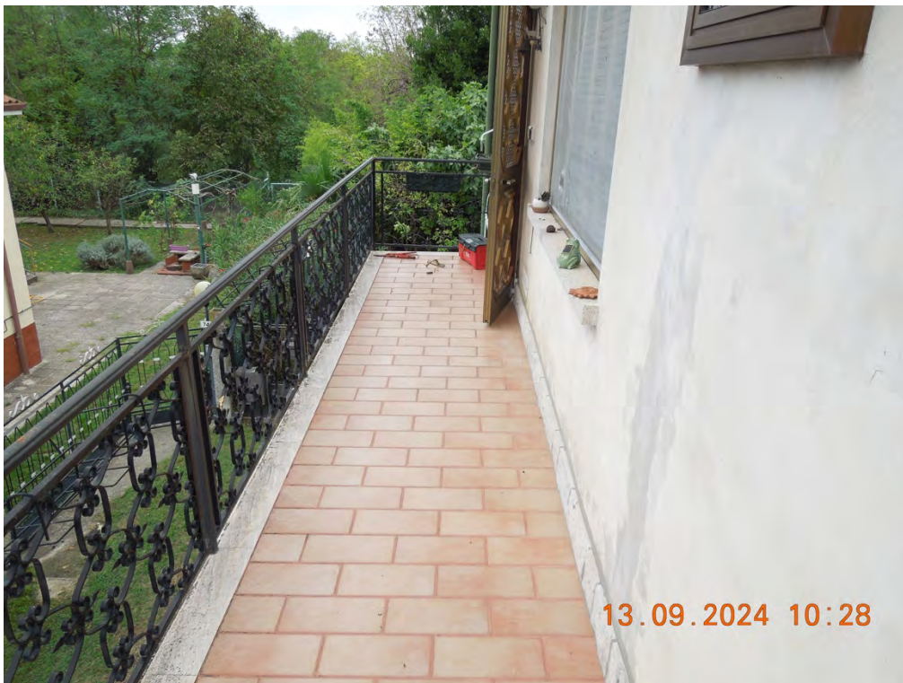
C.2 - Vista terrazzo accesso appartamento