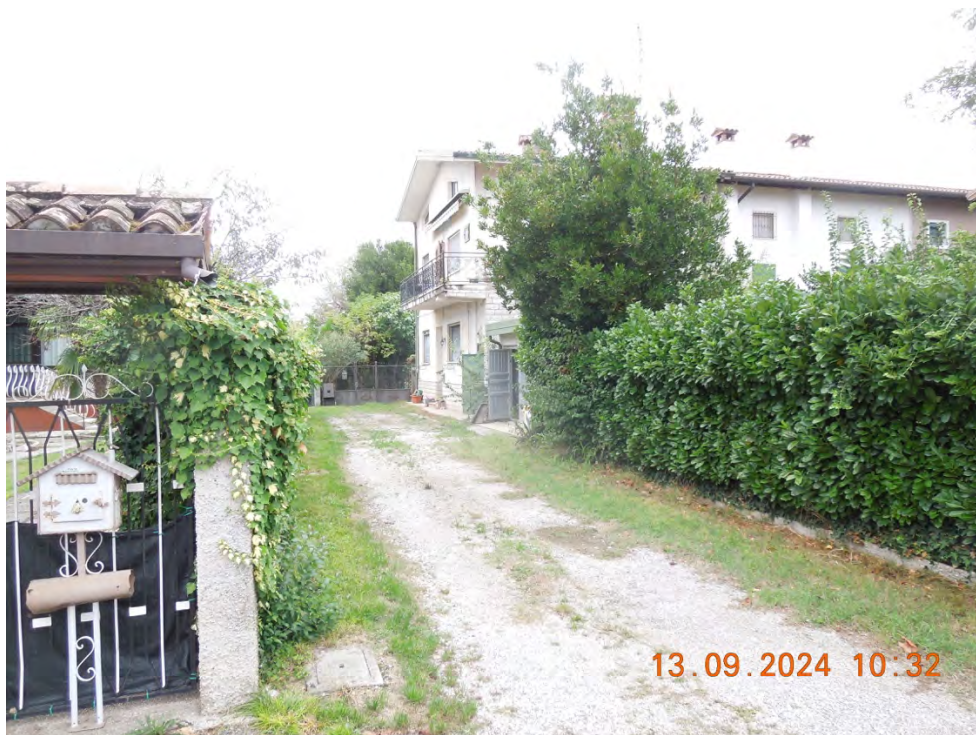
A1 - Vista accesso fabbricato da via D.Alighieri

Fabbricato sito a San Pier d'Isonzo (GO) in via D.Alighieri, 64-66-68