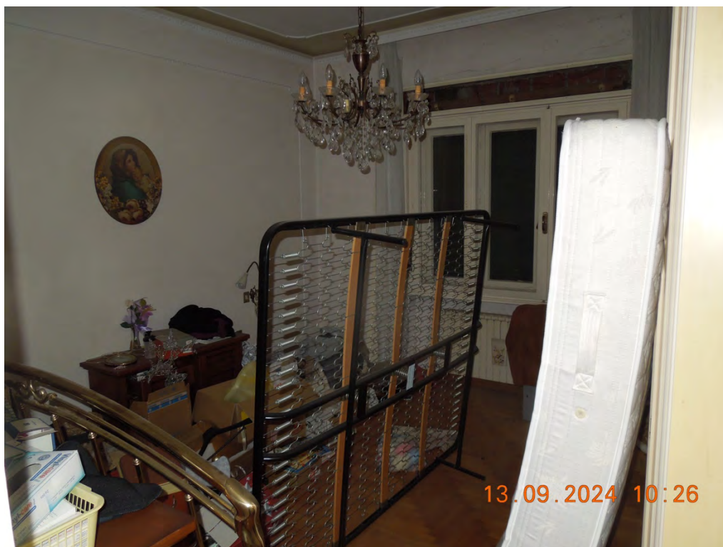
C.10 - Vista interna camera matrimoniale