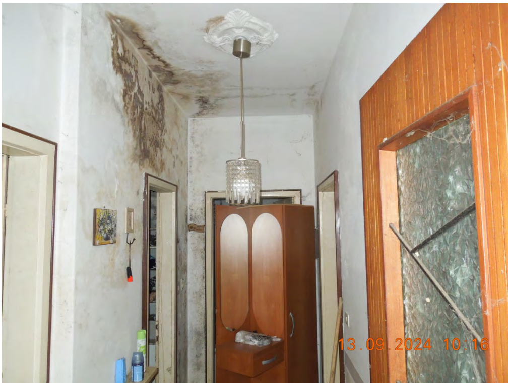
B2 - Vista interna ingresso o