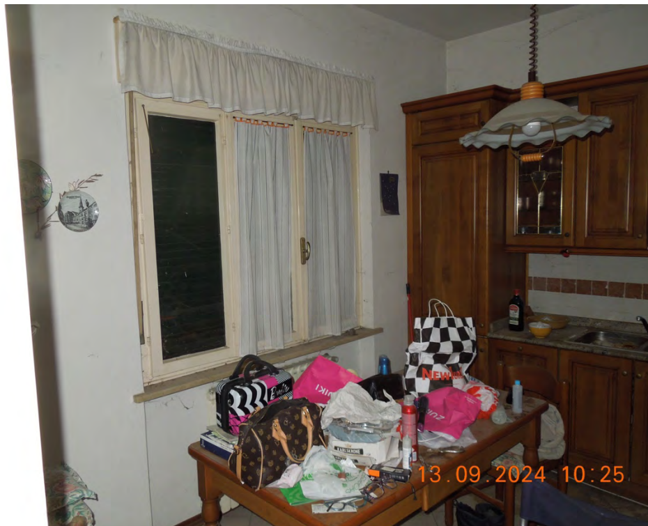
C.7 - - Vista interna cucina