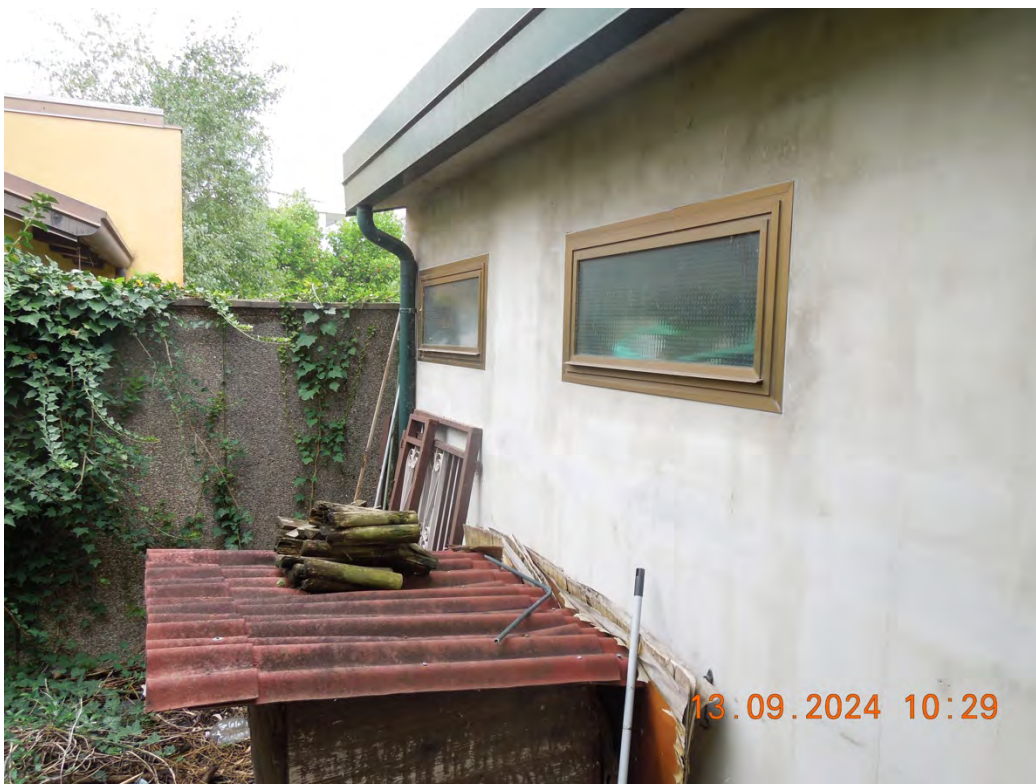
A6 - Vista esterna retro rimessa