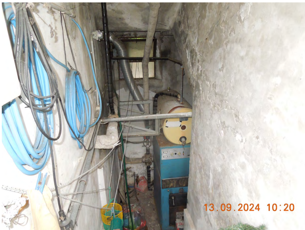
A9 - Vista interna c.t.