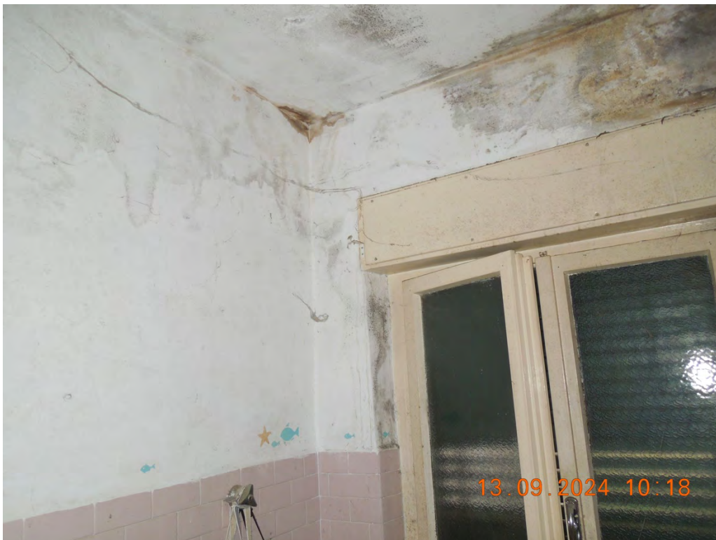
B.9 - Vista interna bagno