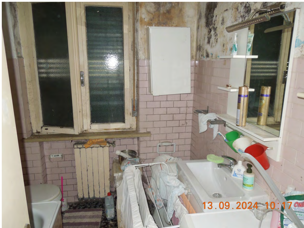
B.7 - Vista interna bagno