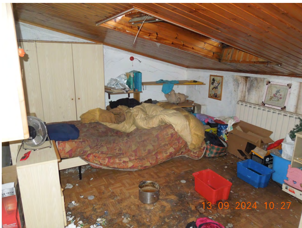
C.14 - Vista interna 1° locale sottotetto