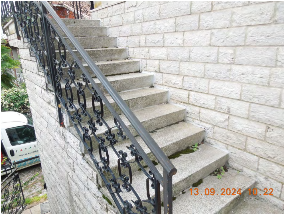
C.1 - Vista scala di accesso al piano 1°