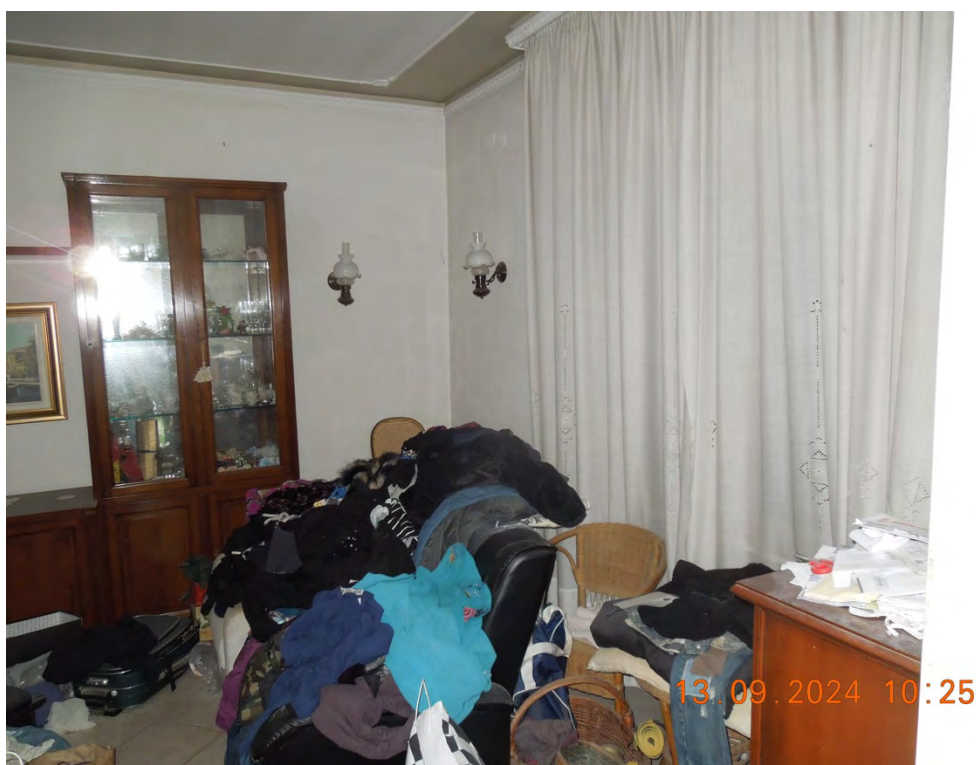
C.6 - Vista interna soggiorno