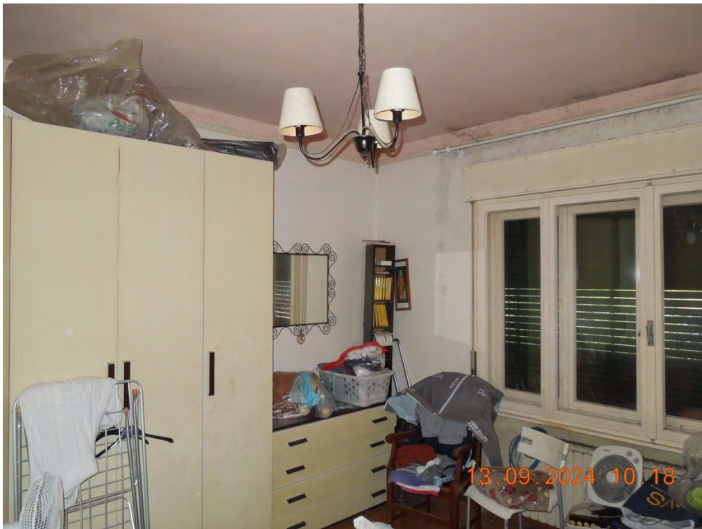
B.14 - Vista interna soggiorno