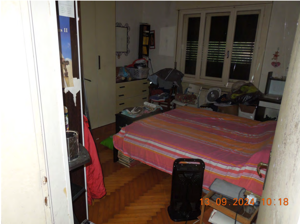
B.13 - Vista interna camera matrimoniale