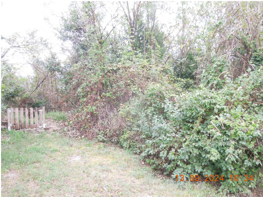
E.3– Vista posteriore proprietà dalla strada campestre