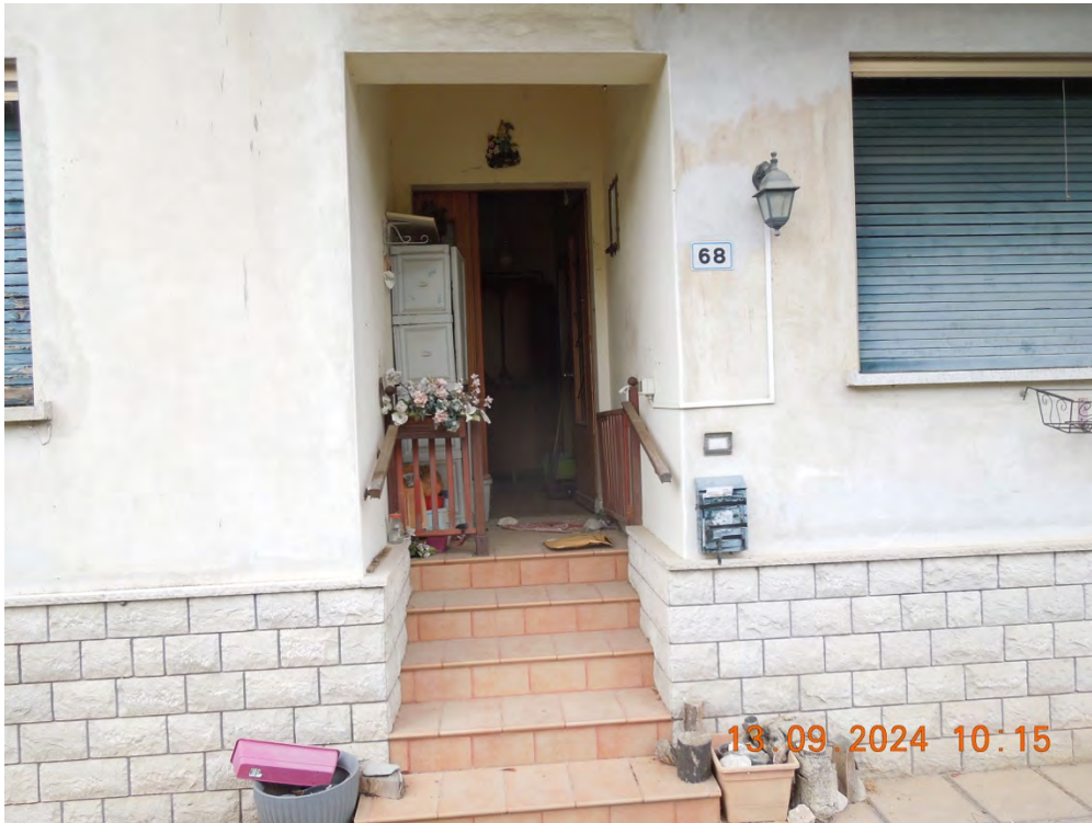
B1 - Vista esterna ingresso appartamento