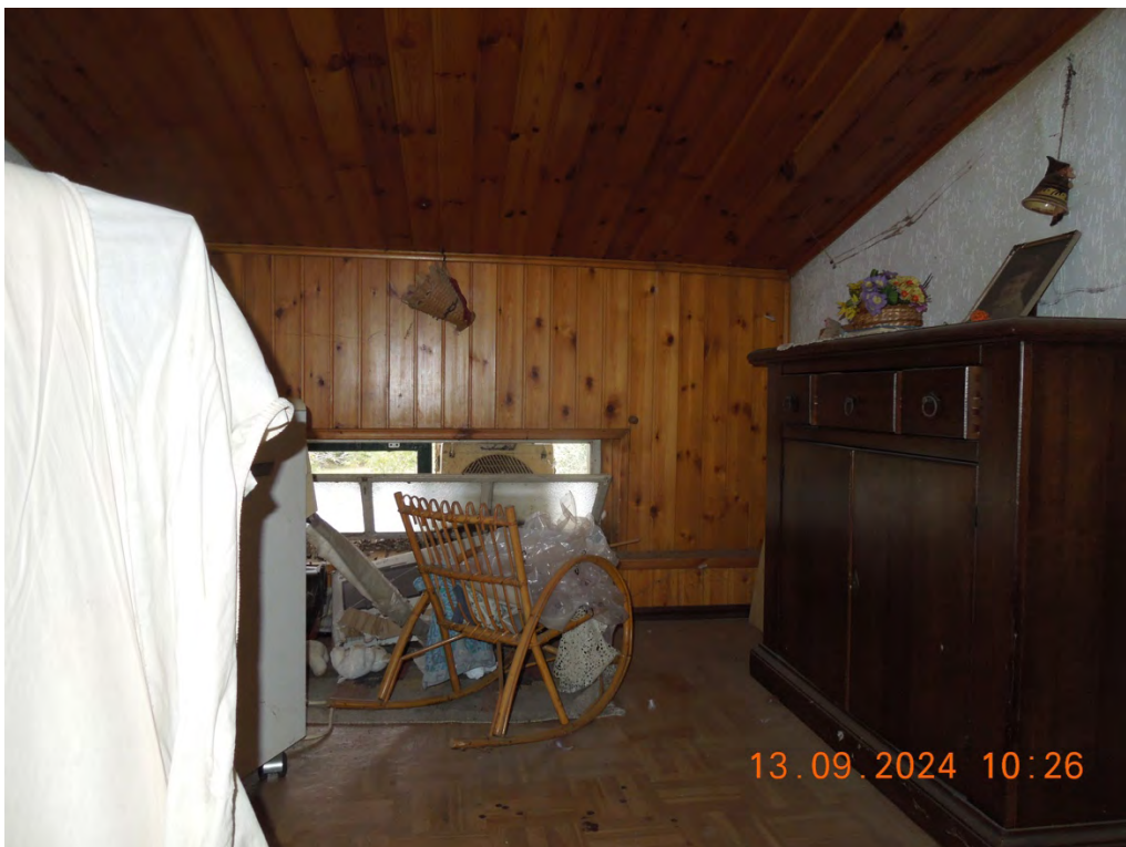
C.12 - Vista interna locale sottotetto arrivo scala