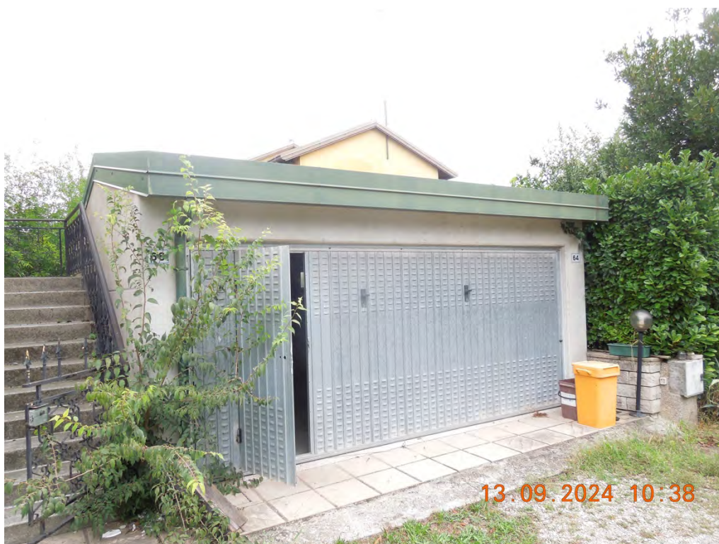
D.2 - Vista accesso esterno rimessa