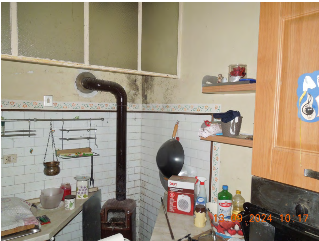
B.6 - Vista interna cucina