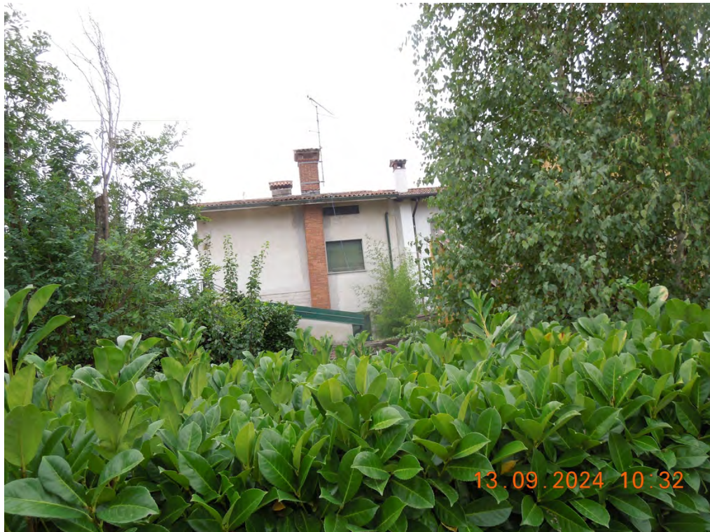
A3 - Vista esterna fronte nord fabbricato