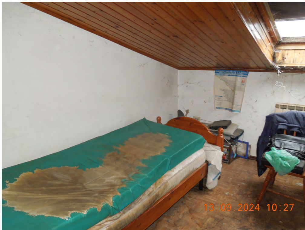
C.15 - Vista interna 2° locale sottotetto