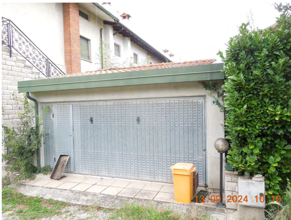
D.1 - Vista accesso esterno rimessa