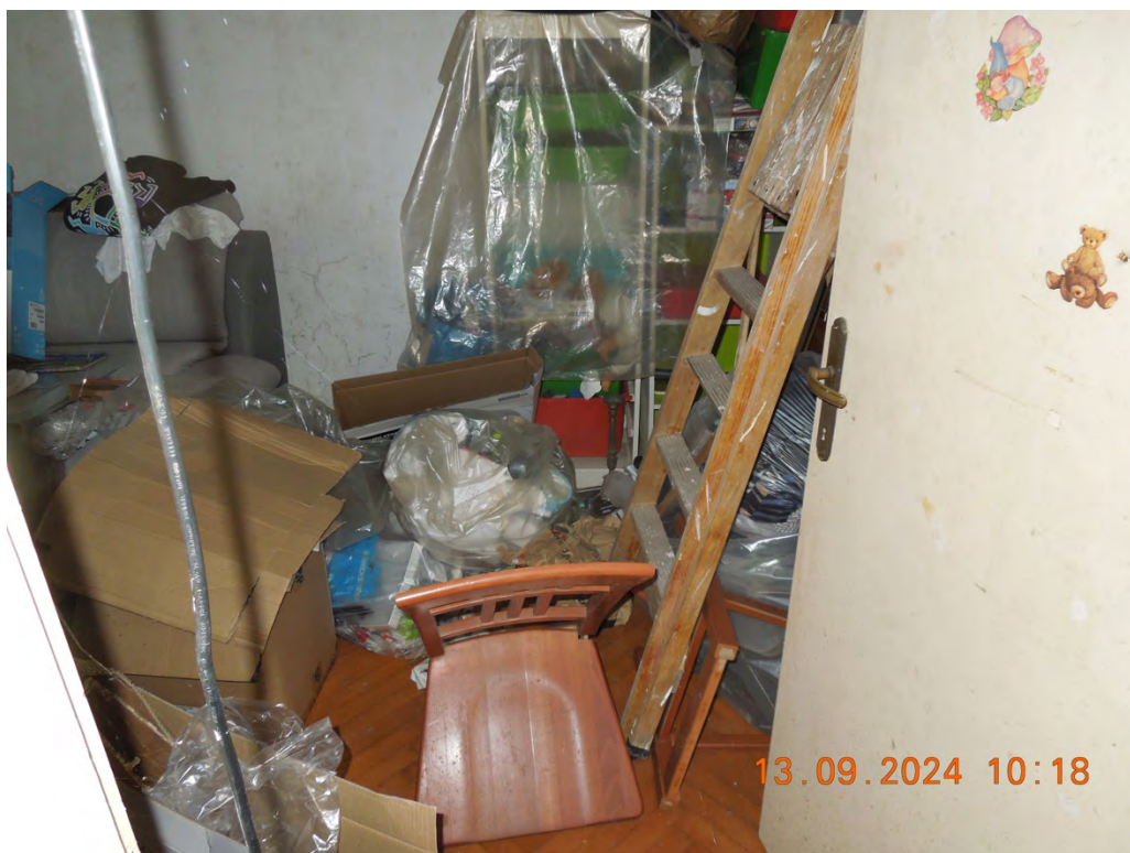
B.12 - Vista interna camera singola