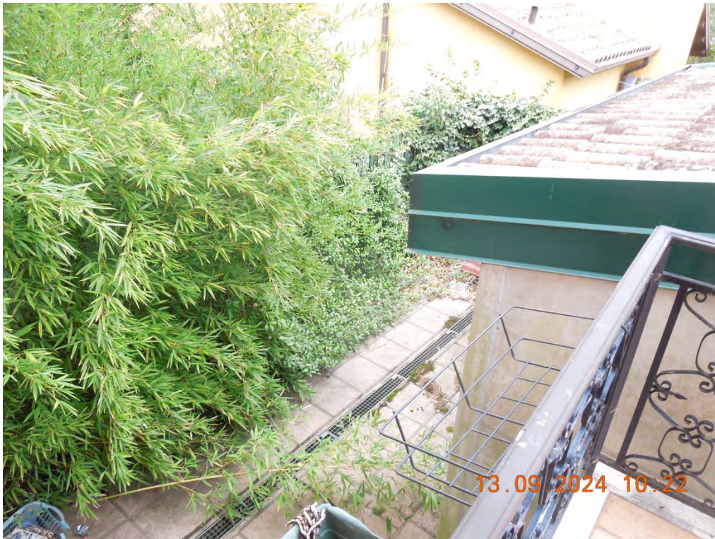
D.7 - Vista cortile retro rimessa