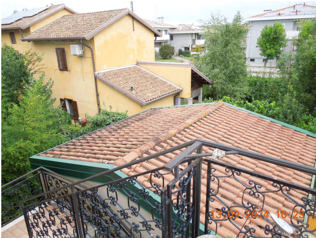
D.3 - Vista copertura rimessa