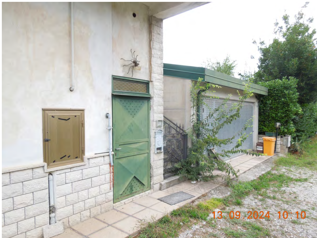
A7 - Vista accesso centrale termica