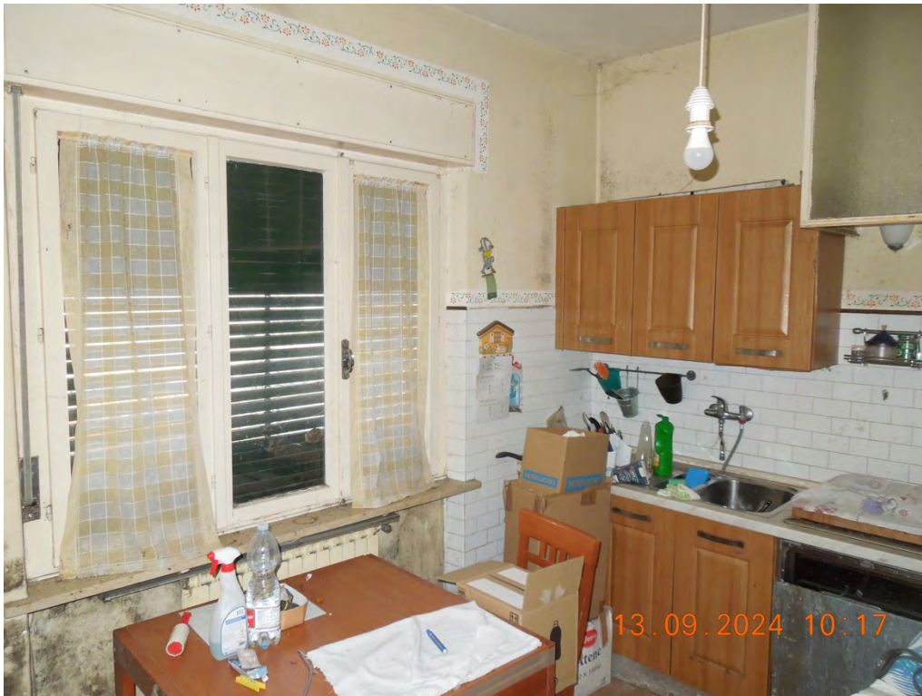
B.5 - Vista interna cucina