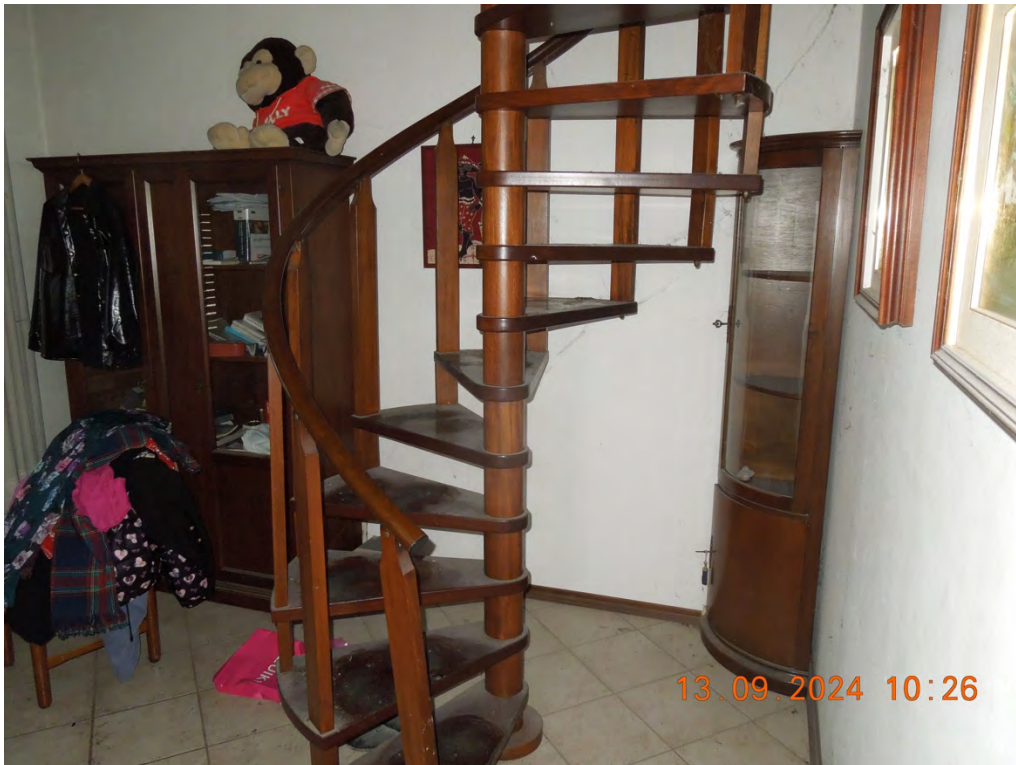
C.11 - Vista interna locale scala di accesso al piano sottotetto