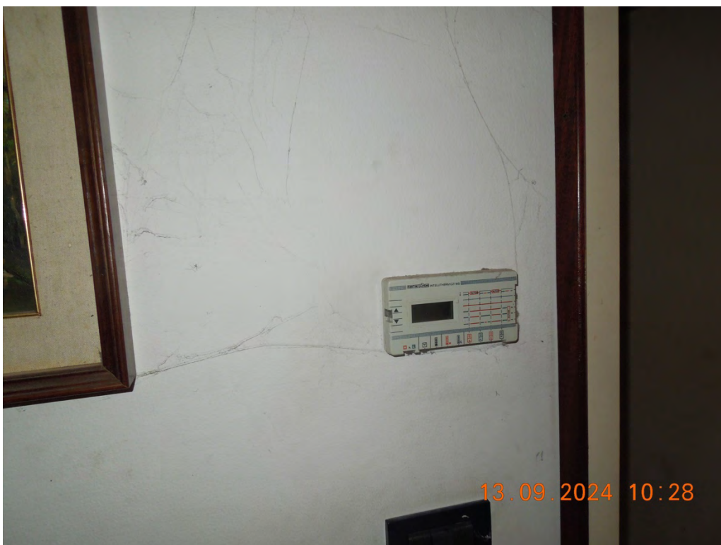
C.18 – vista termostato