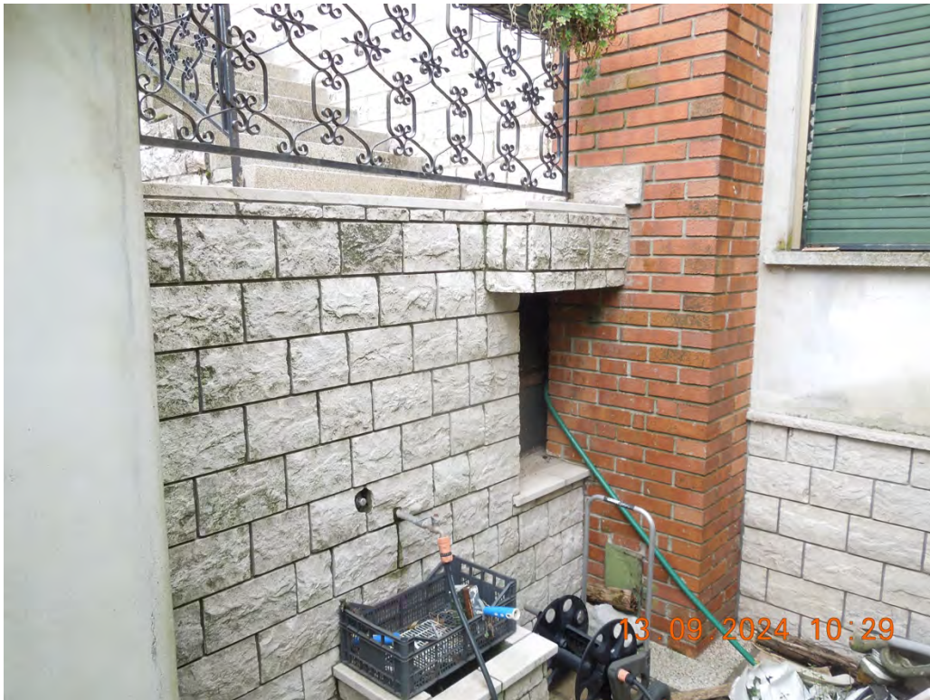
A5 - Vista esterna ct