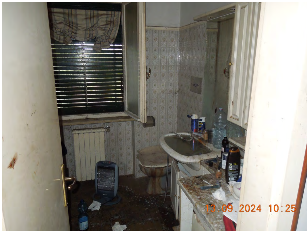
C.9 - Vista interna bagno