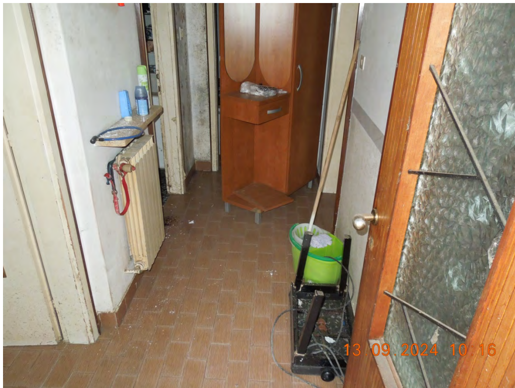
B3 - Vista interna ingresso