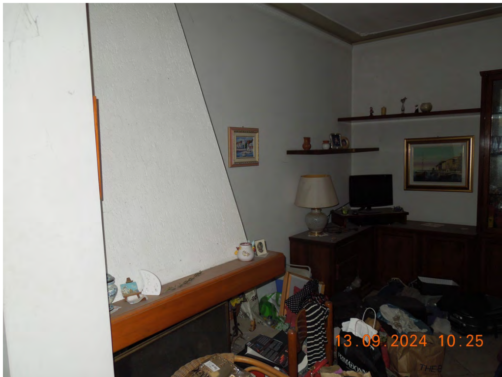
C.5 - Vista interna soggiorno