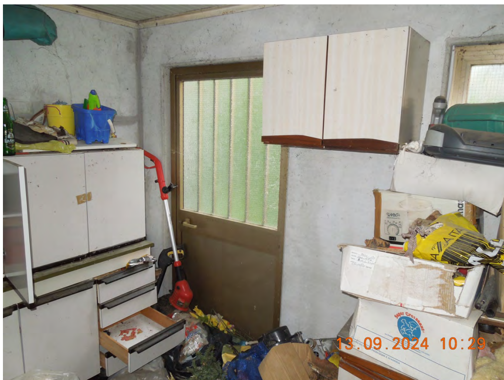
D.6 - Vista uscita posteriore rimessa