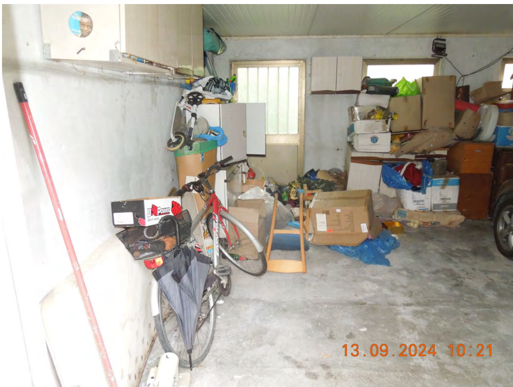
D.4 - Vista interna rimessa