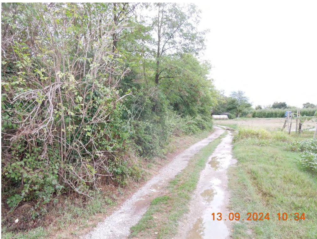
E.4 – Vista laterale proprietà dalla strada campestre