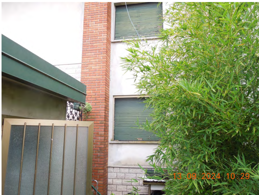
A4 - Vista esterna fabbricato dal retro rimessa