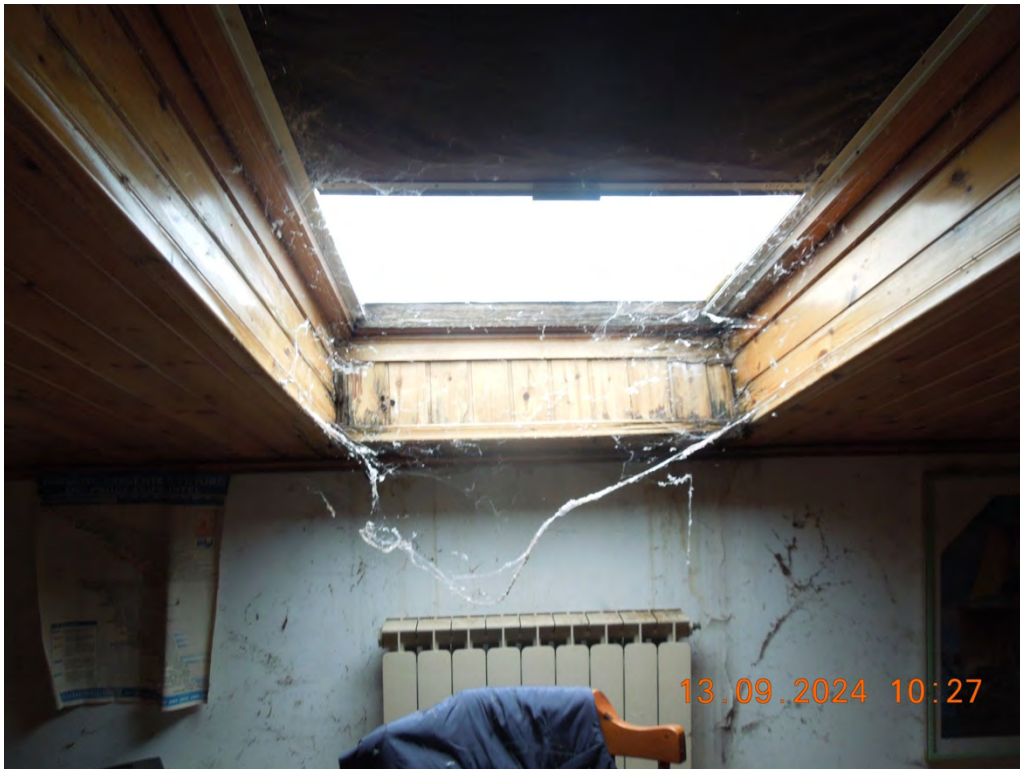
C.17- Vista particolare velux locale sottotetto