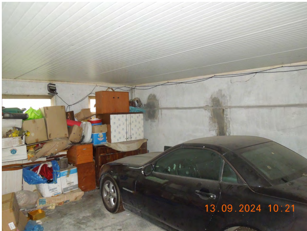
D.5 - Vista interna rimessa