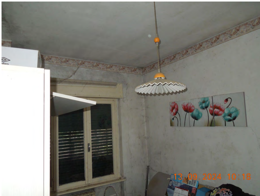
B.11- Vista interna camera singola