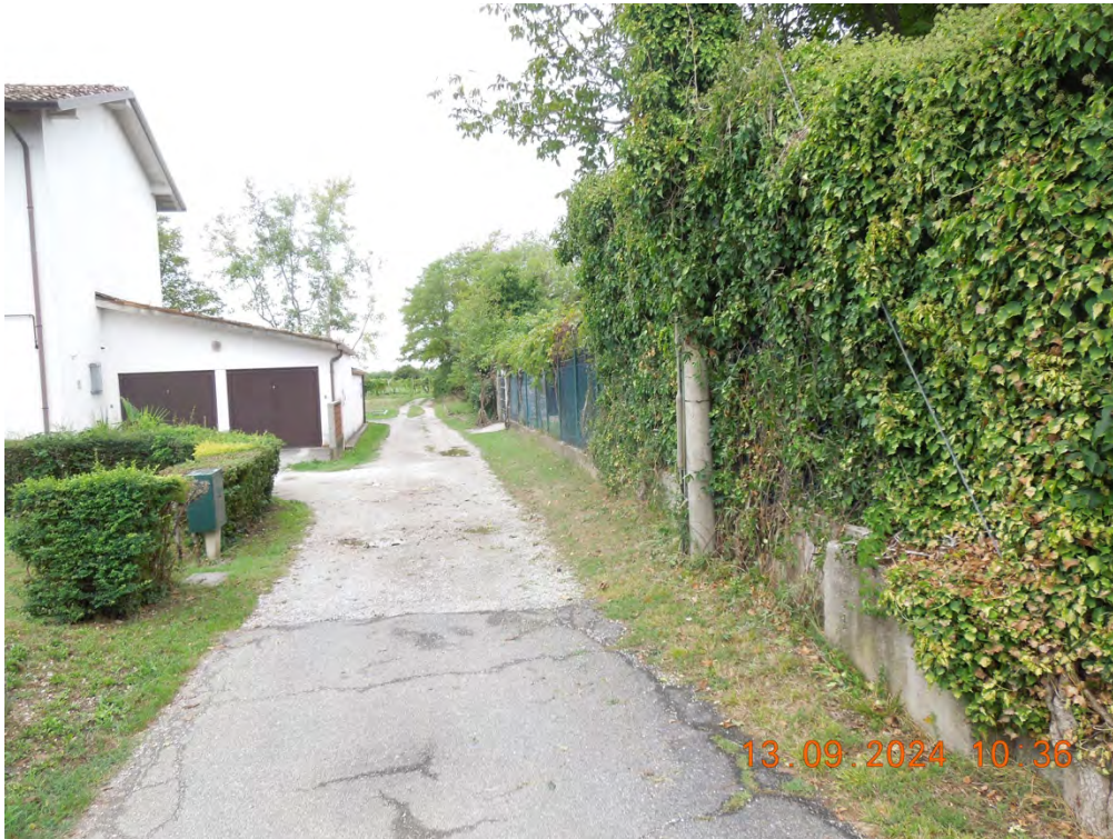
E.1 – Strada campestre accesso terreno da via D. Alighieri