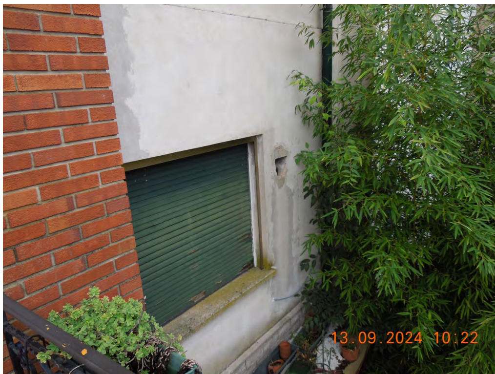
A.10 Vista parete nord sul cortile interno