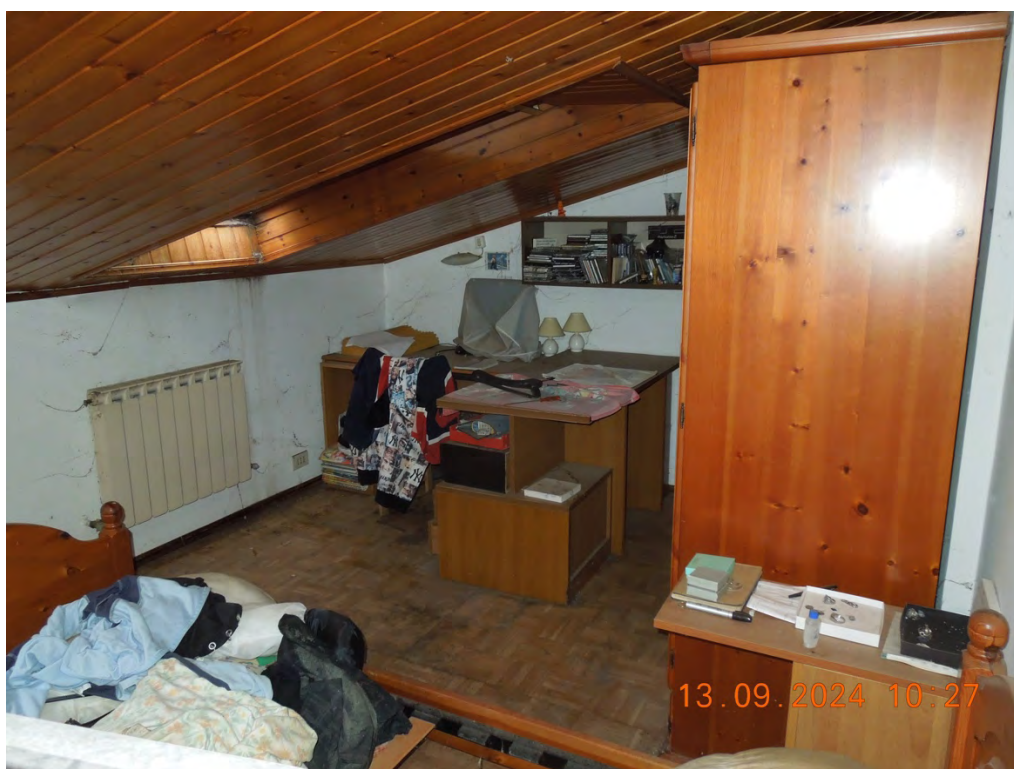
C.16 - Vista interna 2° locale sottotetto