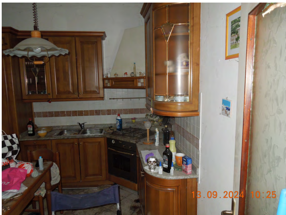
C.8 - Vista interna cucina