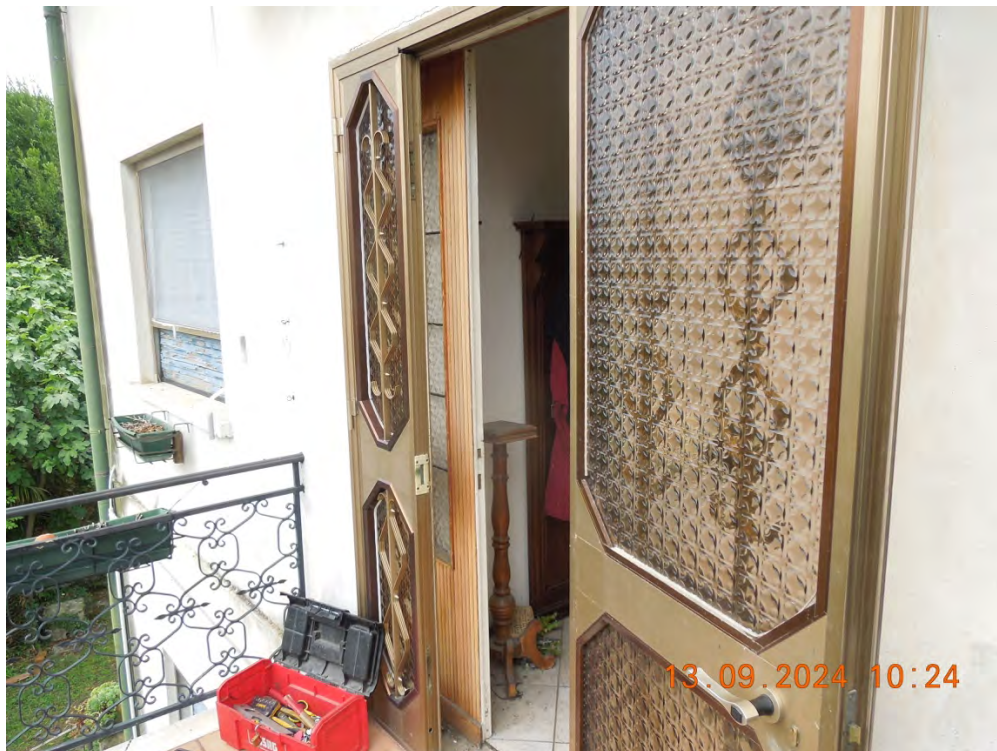
C.3 - Vista accesso esterno appartamento 1°p.