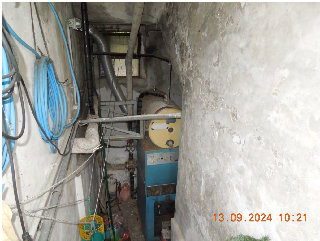
A8 - Vista interna c.t.