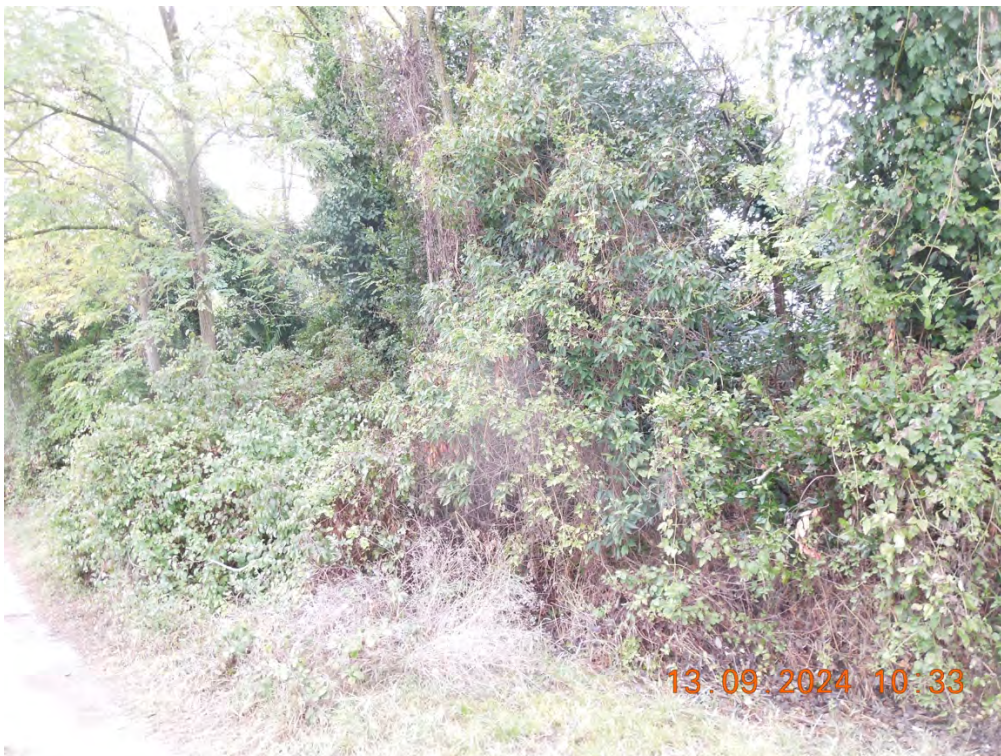
E.2 – Vista laterale proprietà dalla strada campestre