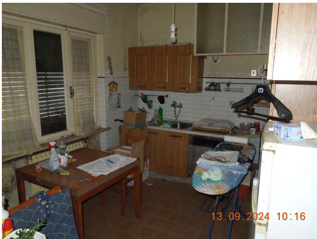
B4 - Vista interna cucina