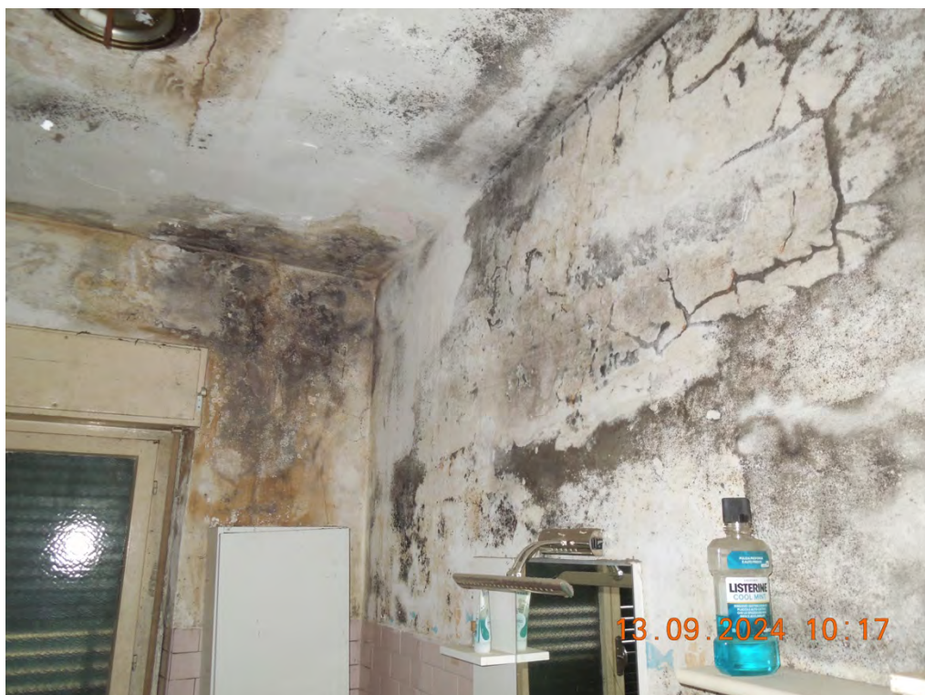
B.8 - Vista interna bagno