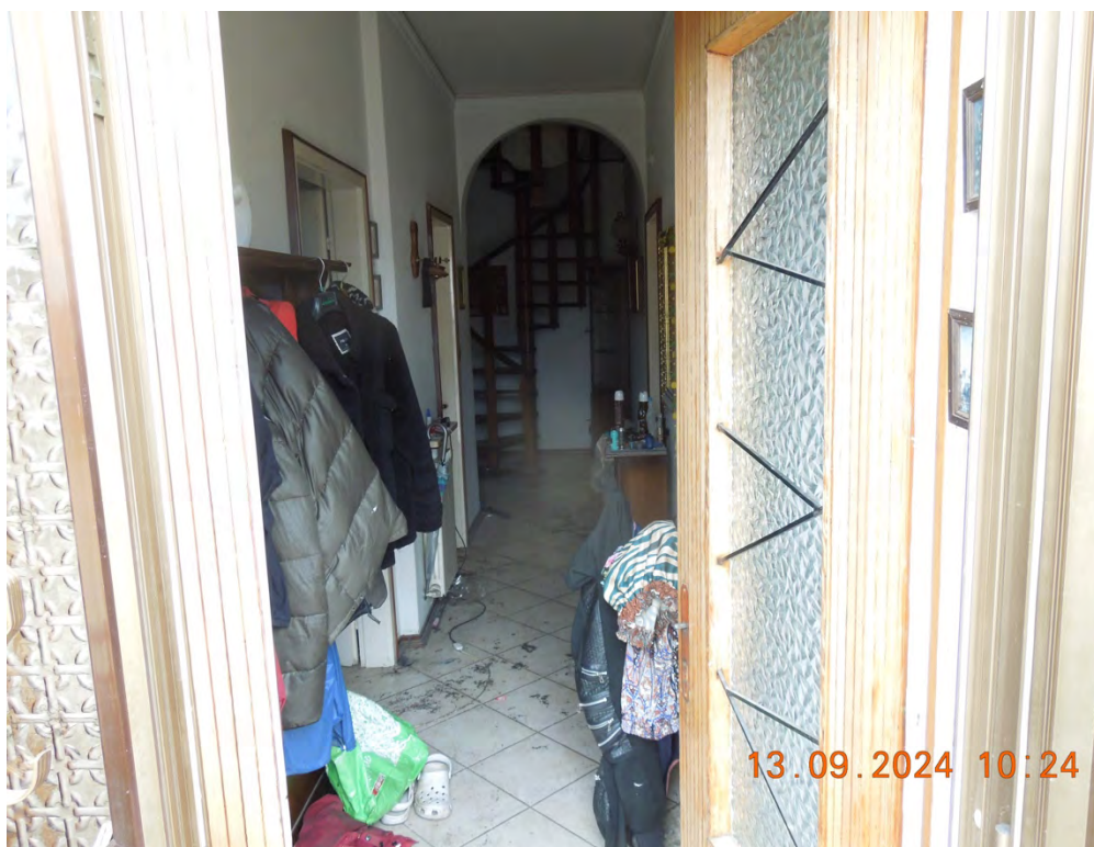
C.4 - Vista interna ingresso