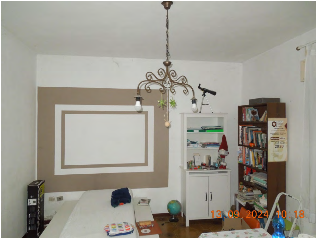
B.15 - Vista interna soggiorno