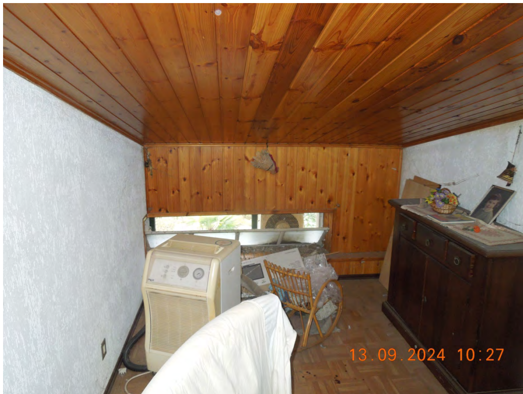
C.13 - Vista interna locale sottotetto arrivo scala