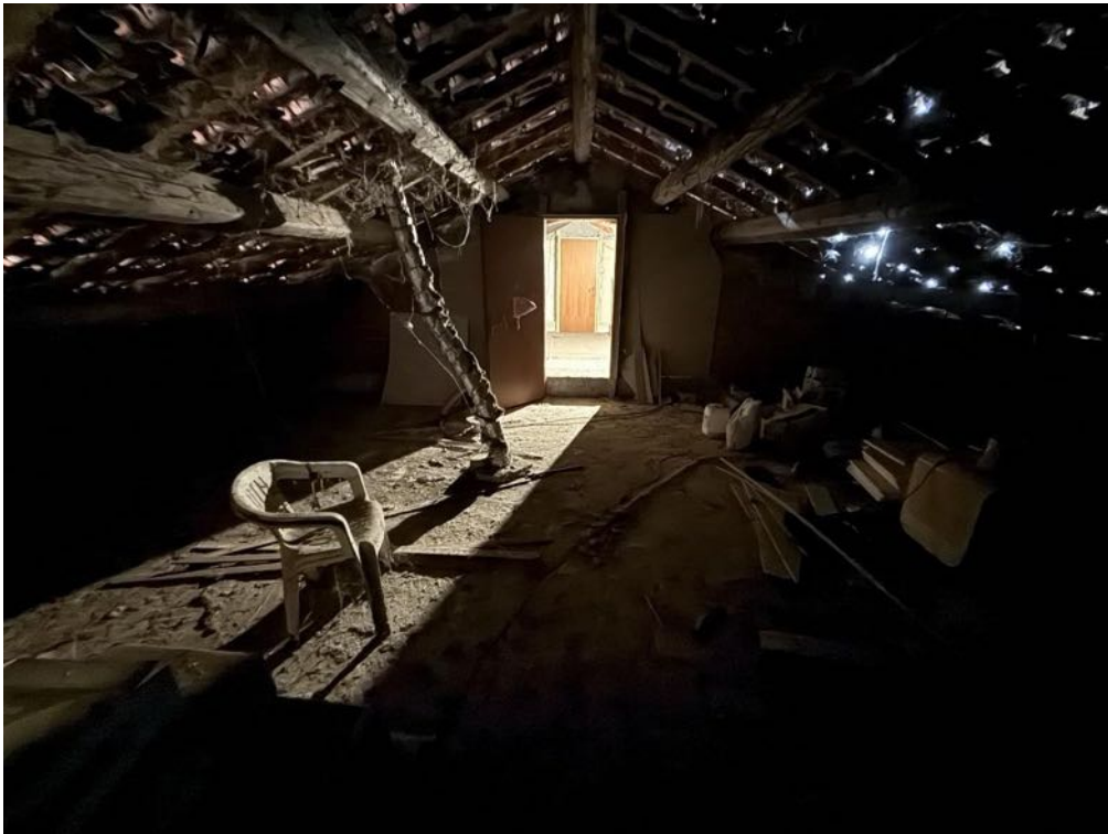
Piano Sottotetto - Appartamento - Locale 3 (foto 1)