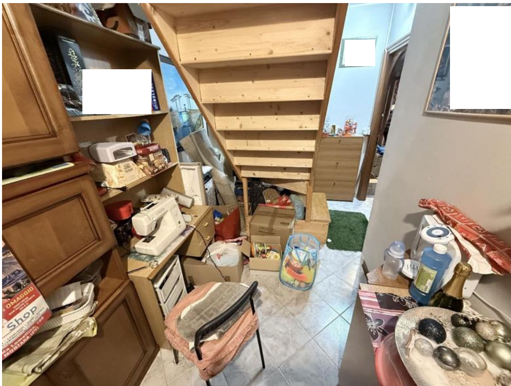
Piano Primo - Appartamento - Ripostiglio 2 (foto 2)