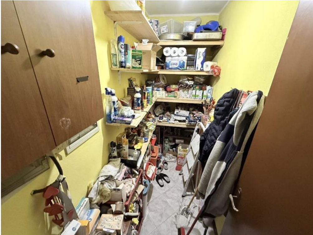
Piano Primo - Appartamento - Ripostiglio 1 (foto 1)