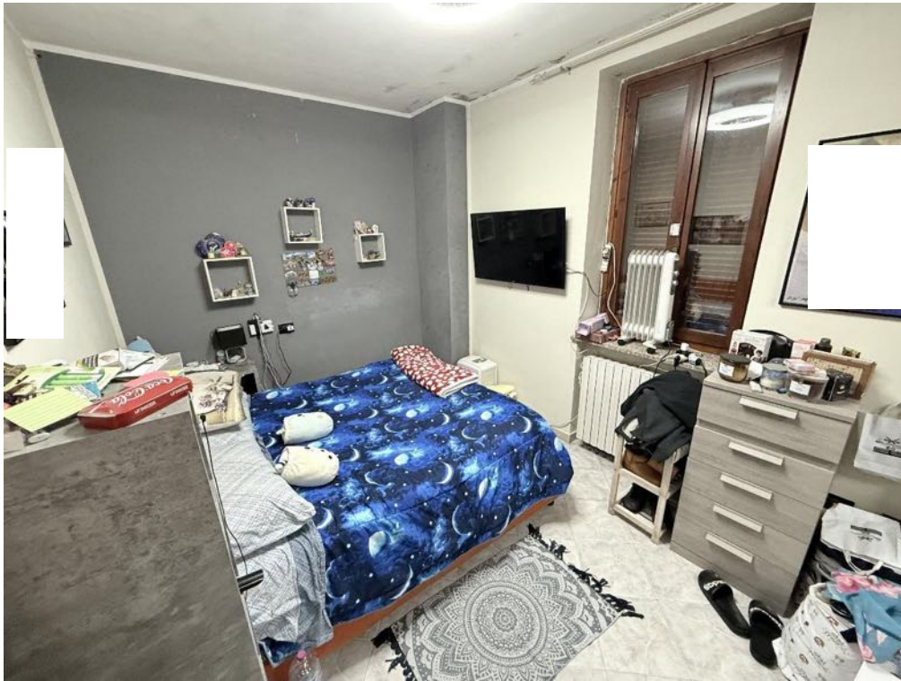
Piano Primo - Appartamento - Camera 1 (foto 1)