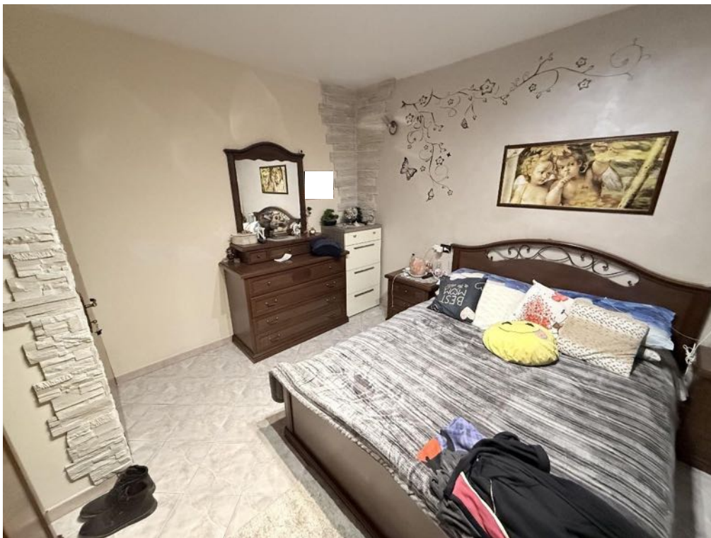
Piano Primo - Appartamento - Camera 2 (foto 4)