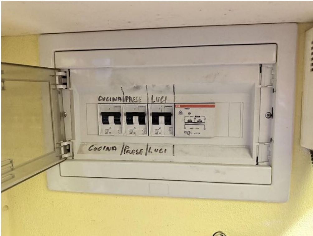
Piano Primo - Appartamento - Dettaglio - Quadro elettrico