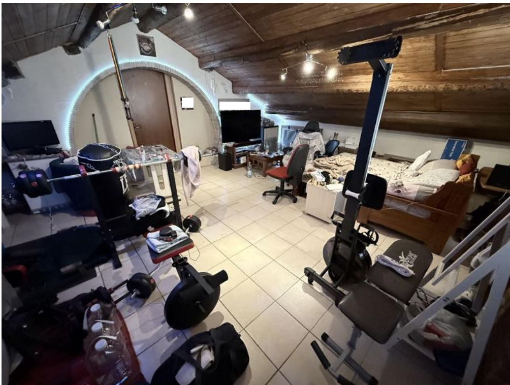
Piano Sottotetto - Appartamento - Locale 1 (foto 1)