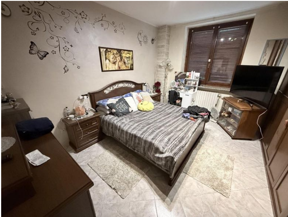
Piano Primo - Appartamento - Camera 2 (foto 1)