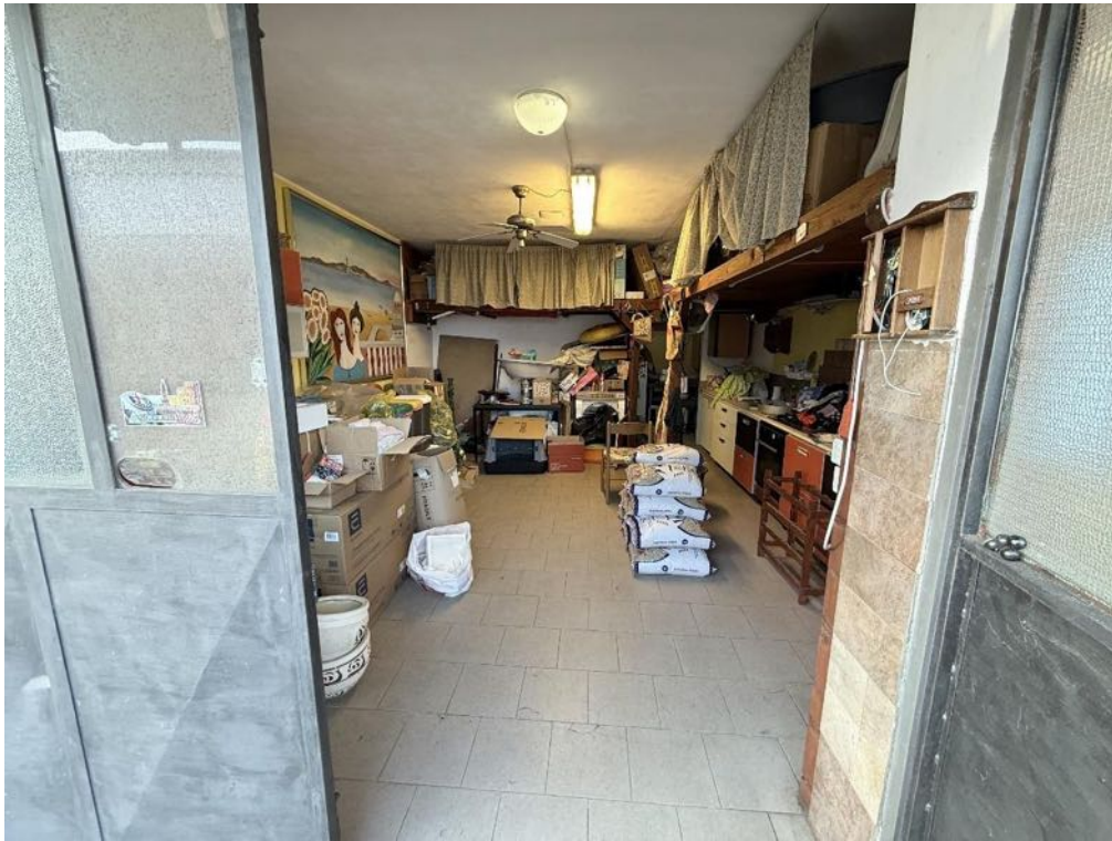
Piano Terra - Box - Accesso (foto 2)