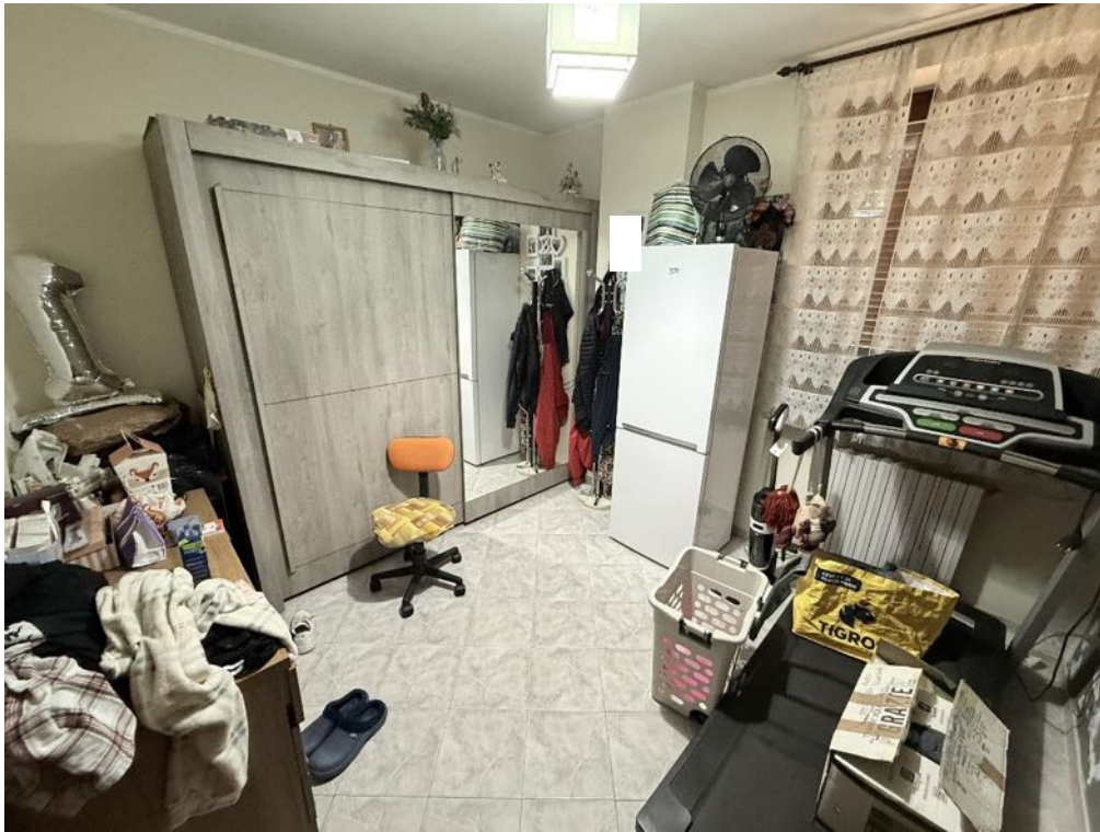
Piano Primo - Appartamento - Studio (foto 1)