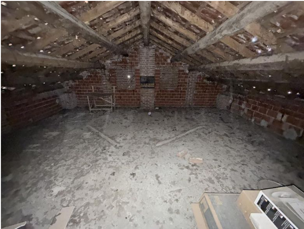
Piano Sottotetto - Appartamento - Locale 4 (foto 2)