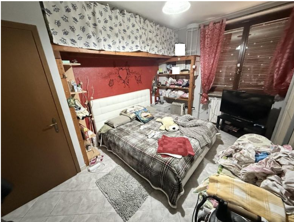
Piano Primo - Appartamento - Camera 3 (foto 2)