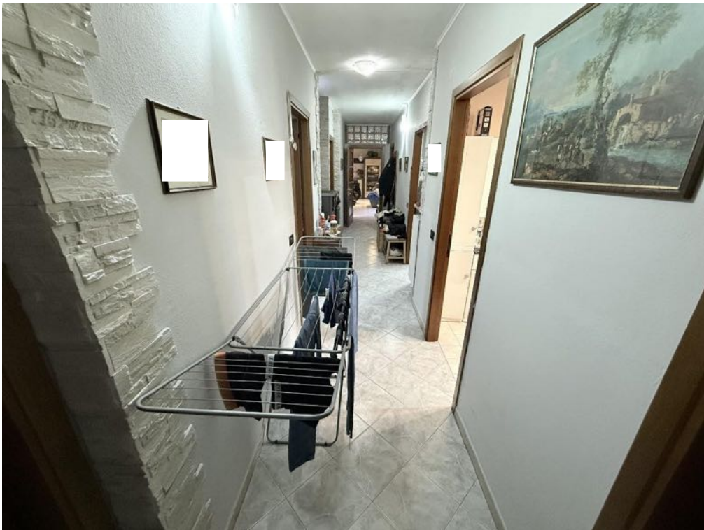
Piano Primo - Appartamento - Corridoio (foto 2)