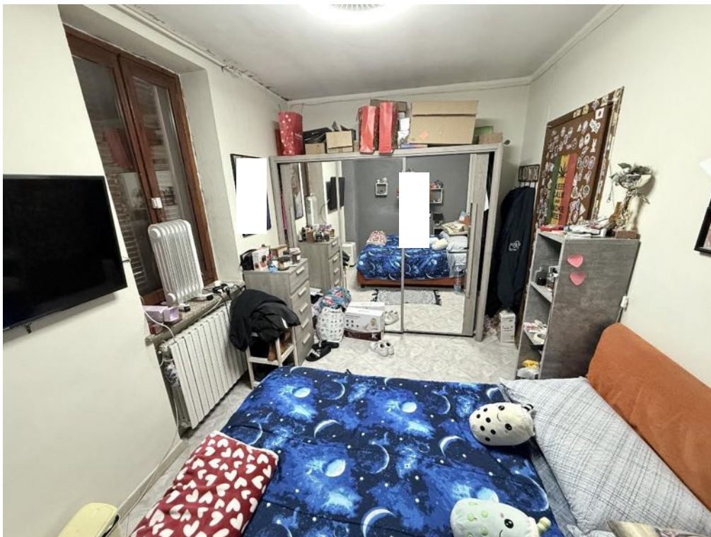
Piano Primo - Appartamento - Camera 1 (foto 4)