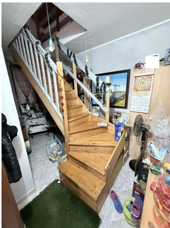
Piano Primo - Appartamento - Scala di accesso al sottotetto (foto 1)