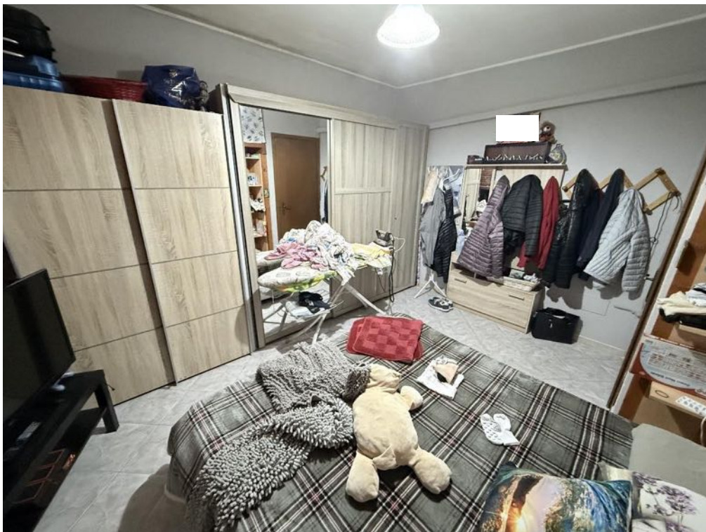
Piano Primo - Appartamento - Camera 3 (foto 4)