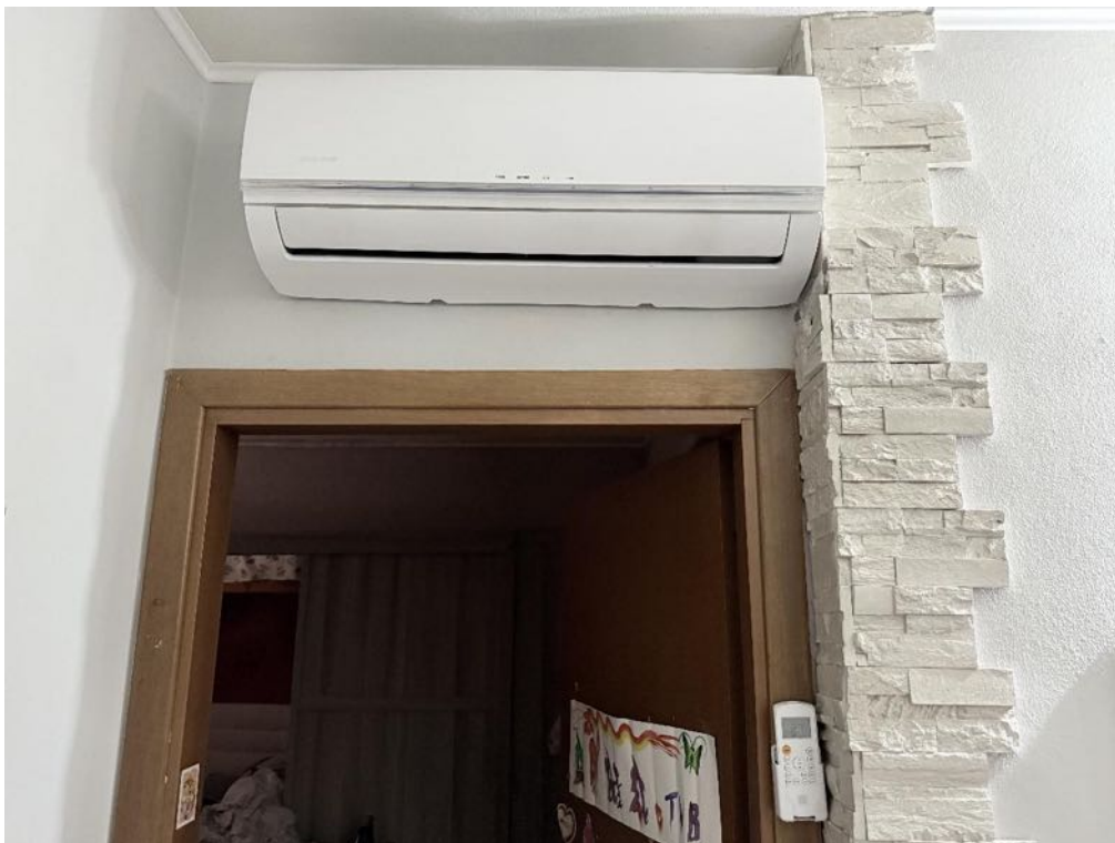
Piano Primo - Appartamento - Dettaglio - Impianto di climatizzazione