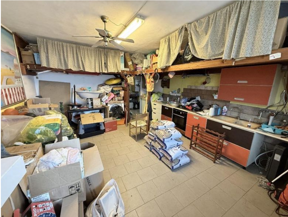
Piano Terra - Locale box (foto 2)