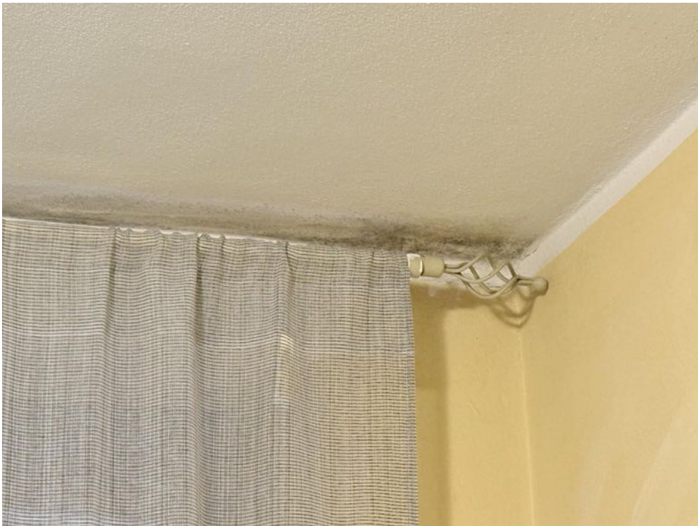
Piano Primo - Appartamento - Dettaglio - Umidità muri (foto 1)