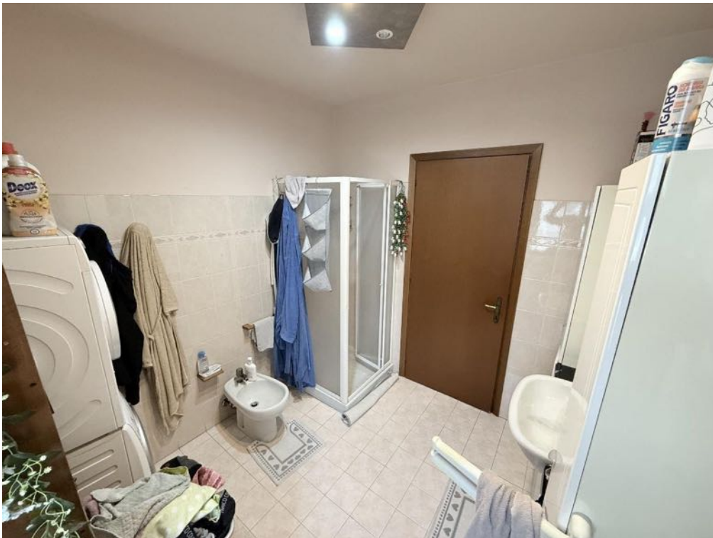
Piano Primo - Appartamento - Bagno 1 (foto 4)