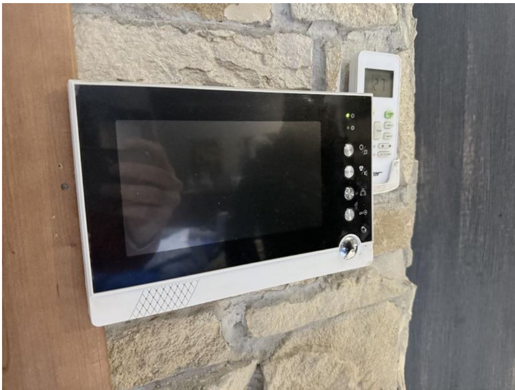
Piano Primo - Appartamento - Dettaglio - Videocitofono