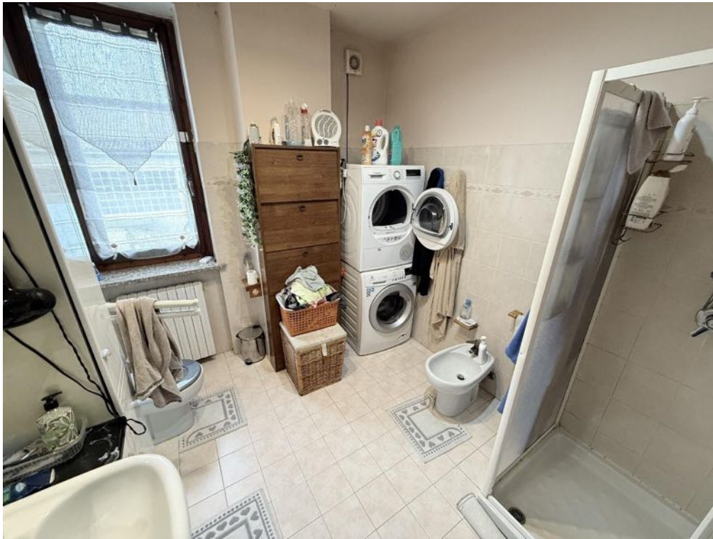
Piano Primo - Appartamento - Bagno 1 (foto 1)