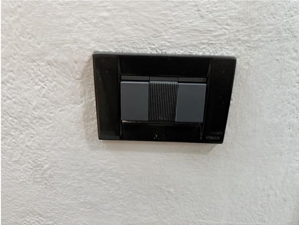
Piano Primo - Appartamento - Dettaglio - Frutti elettrici