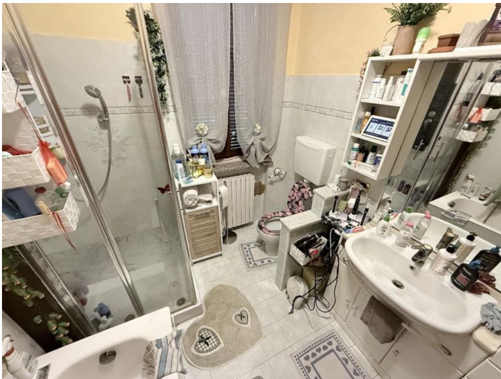
Piano Primo - Appartamento - Bagno 2 (foto 4)