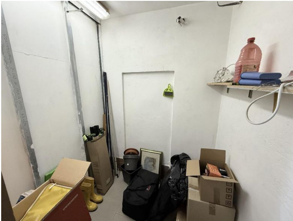
Piano Terra - Locale cantina (foto 2)