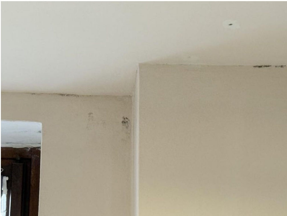
Piano Primo - Appartamento - Dettaglio - Umidità muri (foto 3)