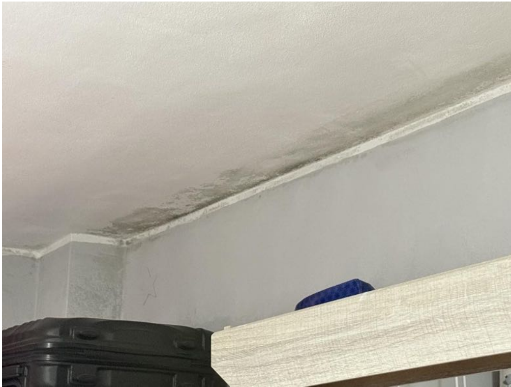
Piano Primo - Appartamento - Dettaglio - Umidità muri (foto 4)