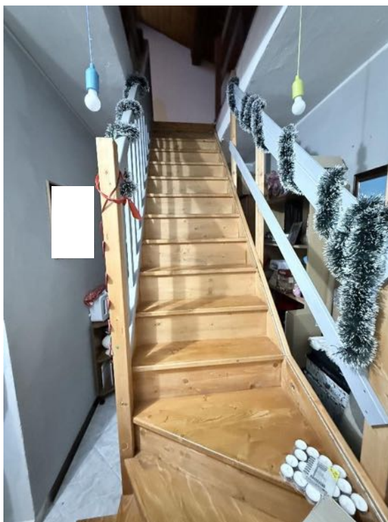
Piano Primo - Appartamento - Scala di accesso al sottotetto (foto 2)