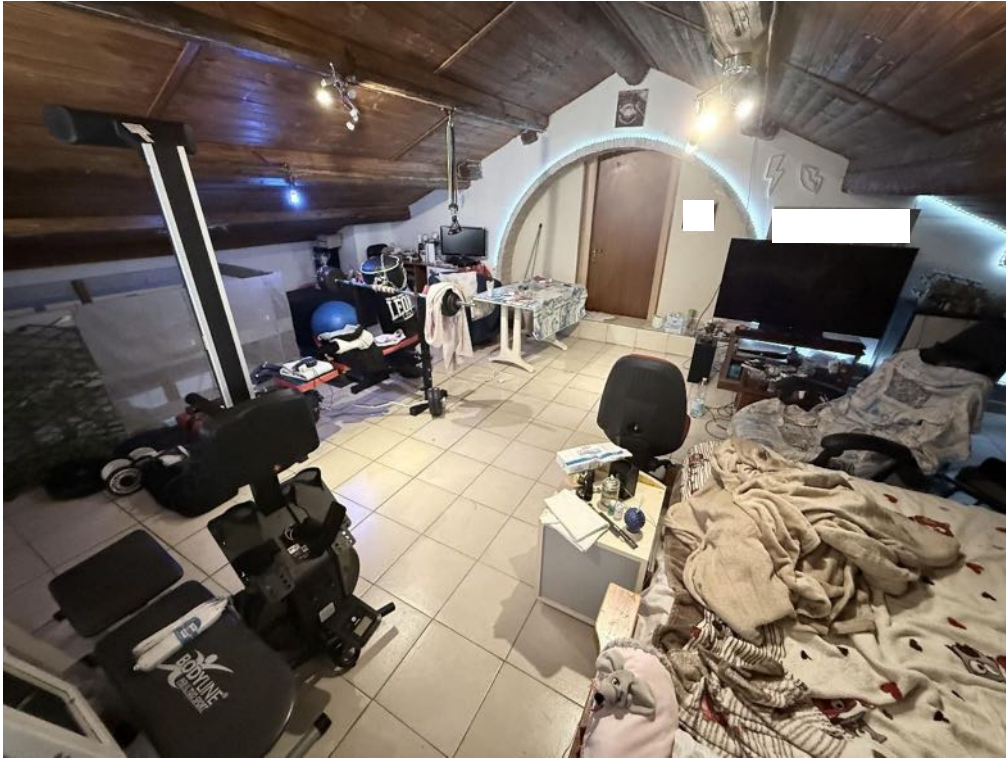
Piano Sottotetto - Appartamento - Locale 1 (foto 2)