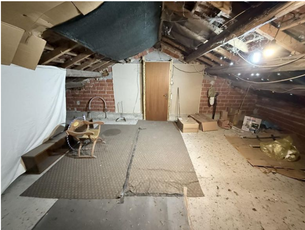
Piano Sottotetto - Appartamento - Locale 2 (foto 1)