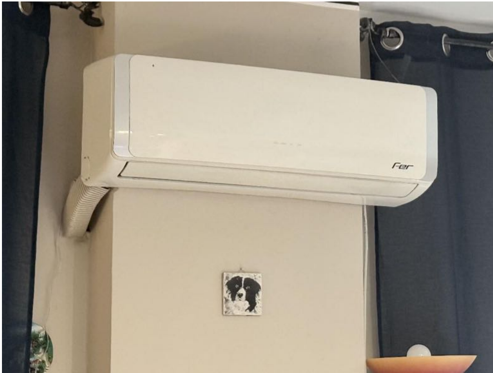
Piano Primo - Appartamento - Dettaglio - Impianto di climatizzazione