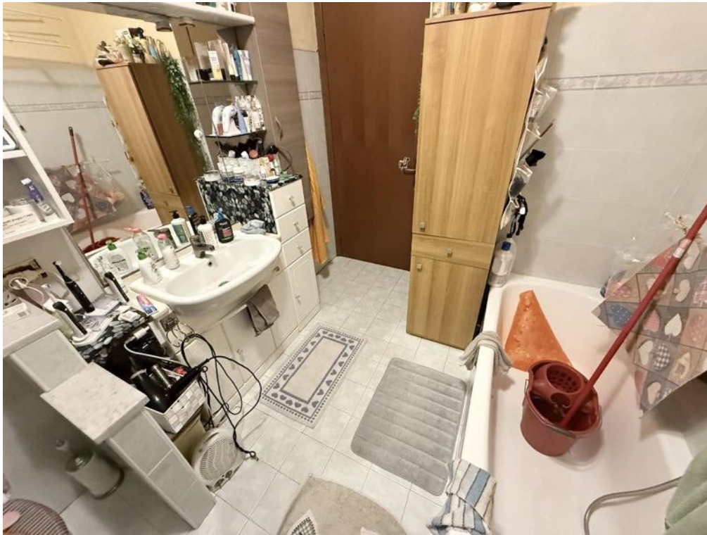
Piano Primo - Appartamento - Bagno 2 (foto 3)