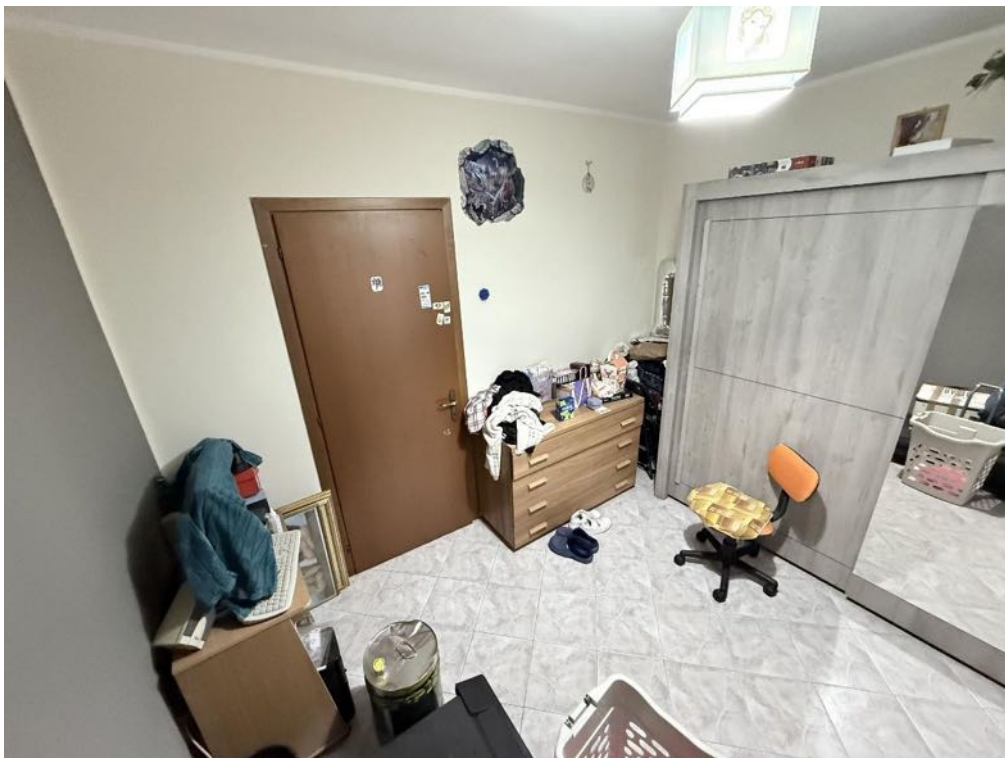
Piano Primo - Appartamento - Studio (foto 4)