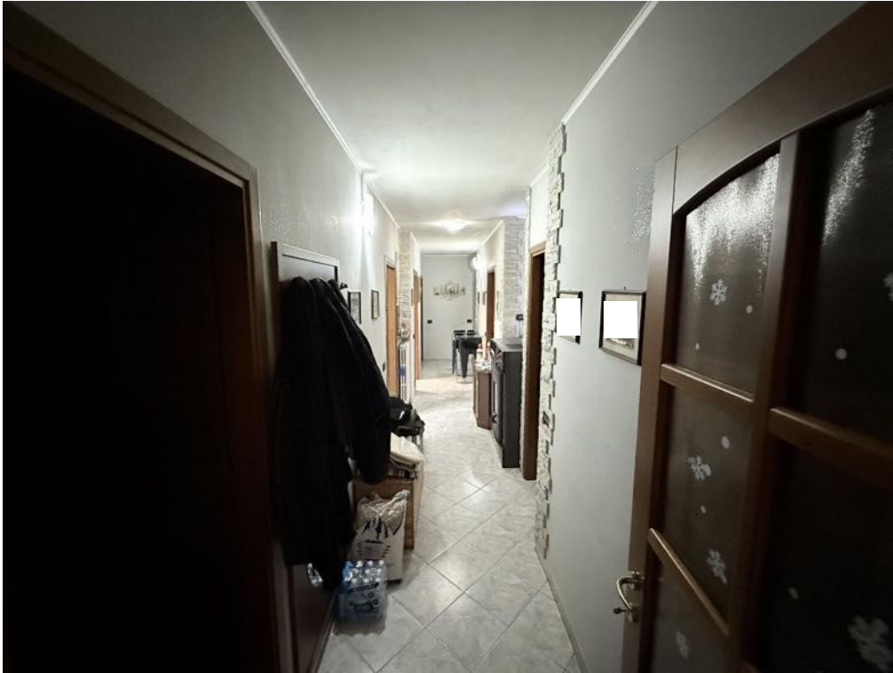
Piano Primo - Appartamento - Corridoio (foto 1)