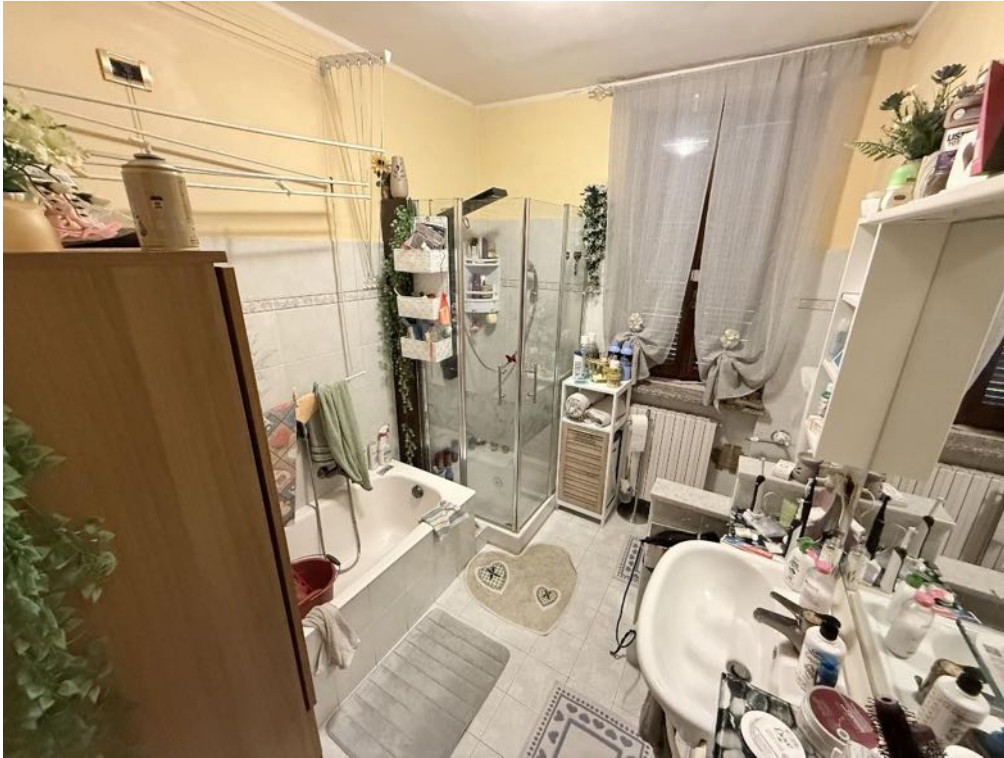
Piano Primo - Appartamento - Bagno 2 (foto 1)