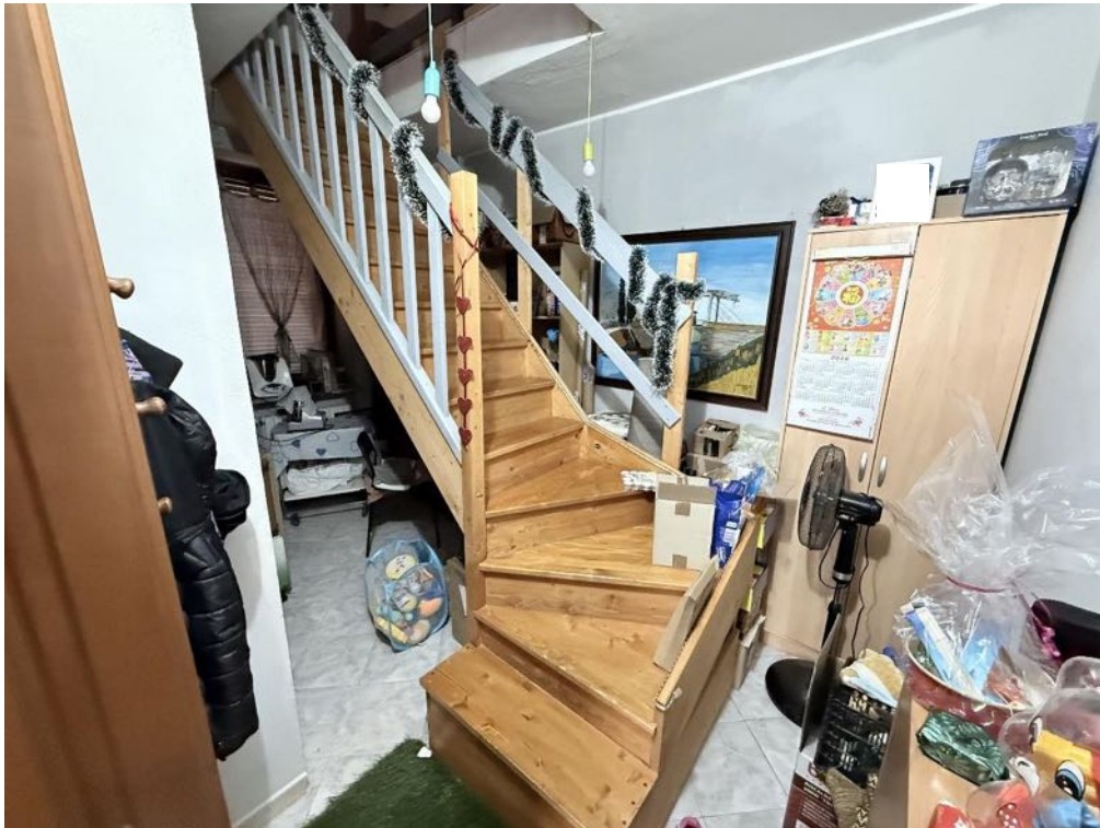
Piano Primo - Appartamento - Ripostiglio 2 (foto 1)