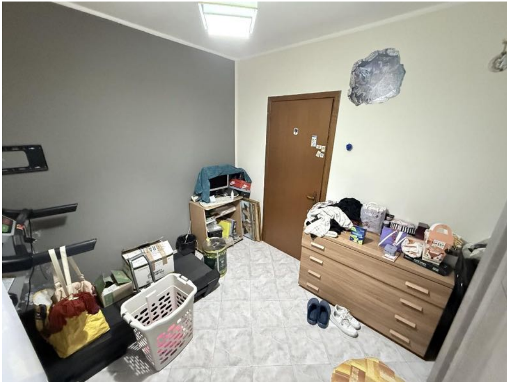
Piano Primo - Appartamento - Studio (foto 3)