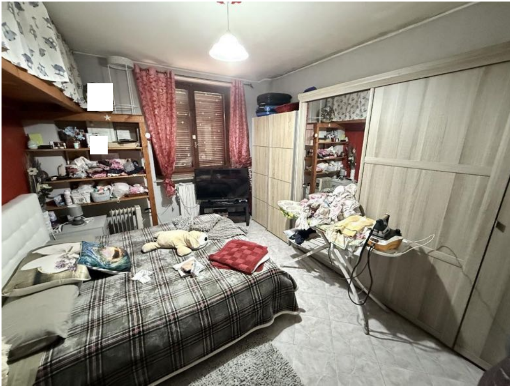
Piano Primo - Appartamento - Camera 3 (foto 1)