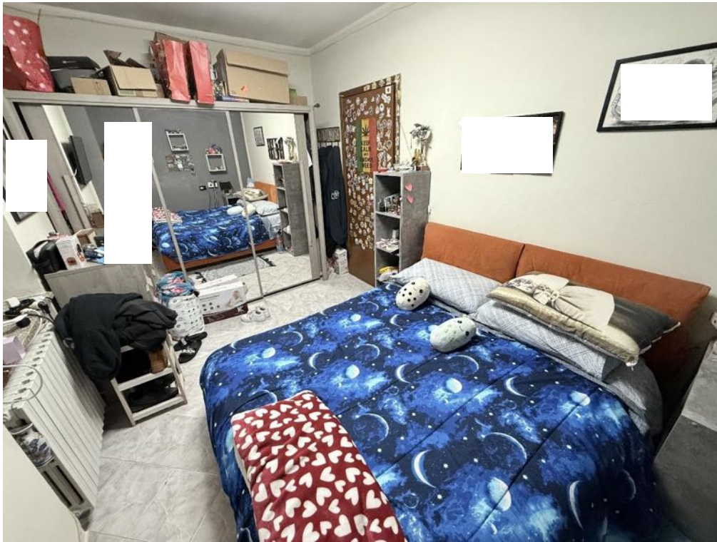
Piano Primo - Appartamento - Camera 1 (foto 3)