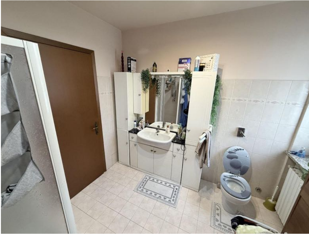
Piano Primo - Appartamento - Bagno 1 (foto 3)