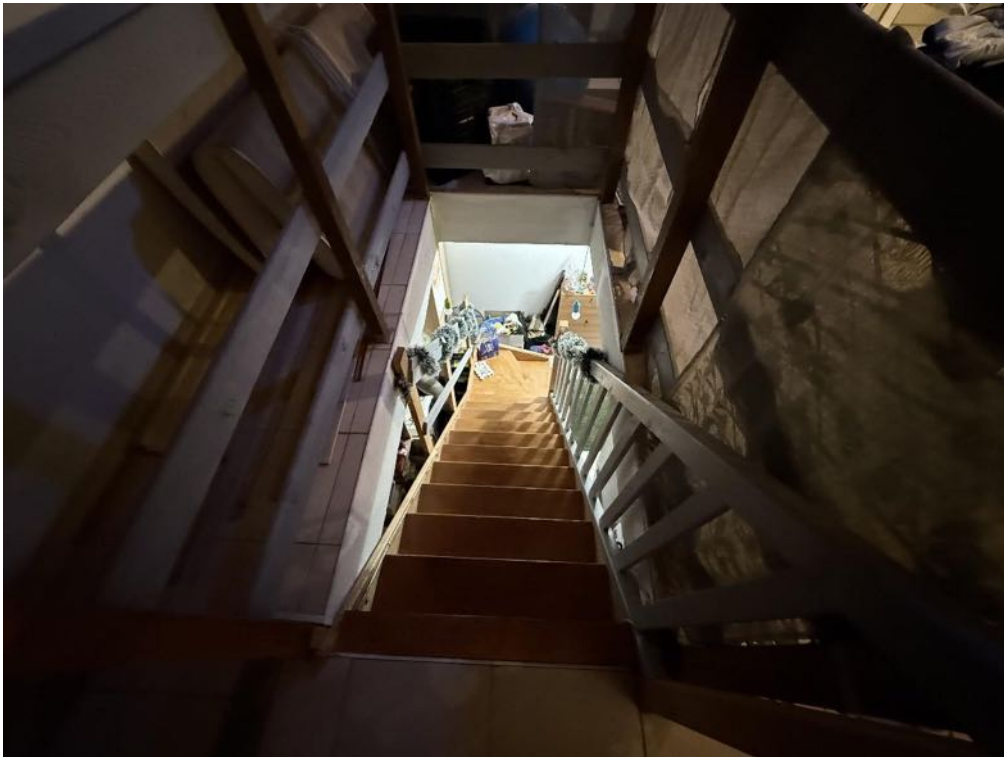
Piano Sottotetto - Appartamento - Scala di accesso al sottotetto