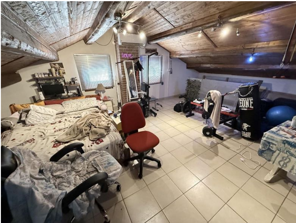
Piano Sottotetto - Appartamento - Locale 1 (foto 3)