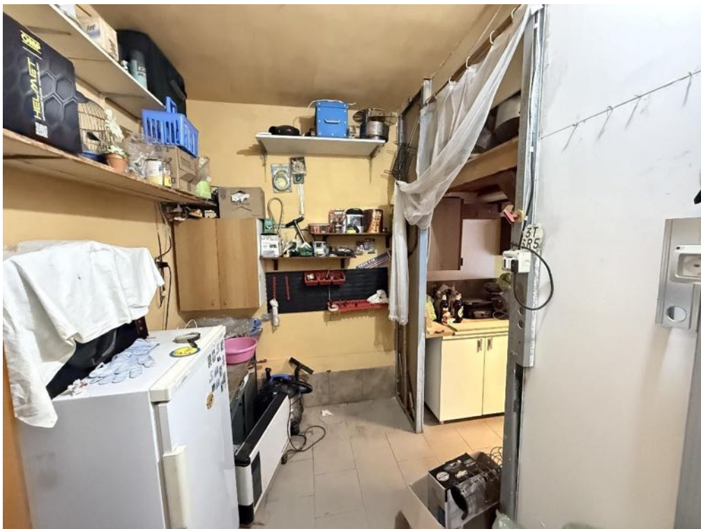
Piano Terra - Disimpegno (foto 2)