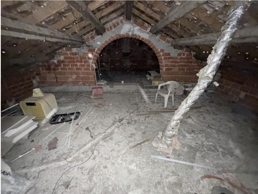
Piano Sottotetto - Appartamento - Locale 3 (foto 2)