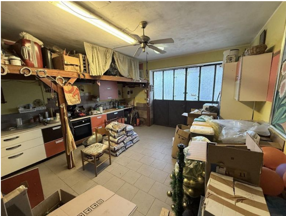
Piano Terra - Locale box (foto 3)