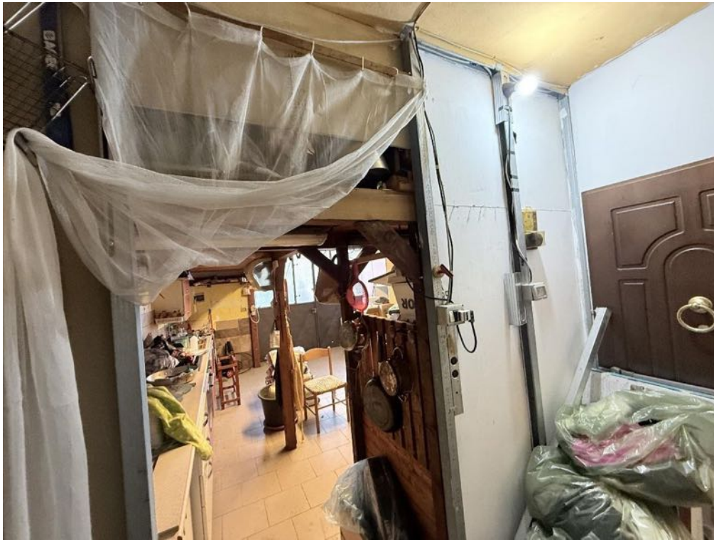
Piano Terra - Disimpegno (foto 1)