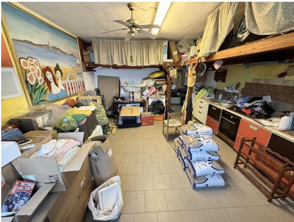
Piano Terra - Locale box (foto 1)