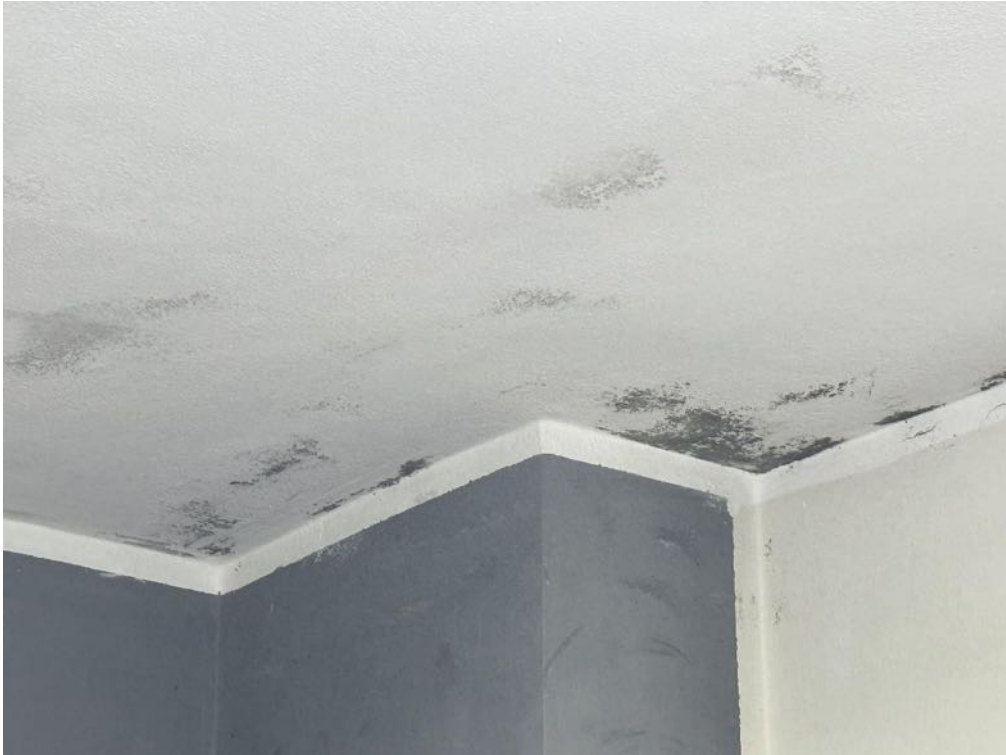
Piano Primo - Appartamento - Dettaglio - Umidità muri (foto 2)