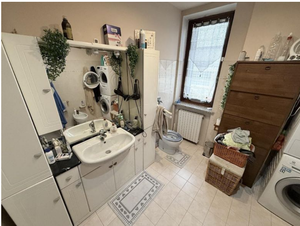
Piano Primo - Appartamento - Bagno 1 (foto 2)