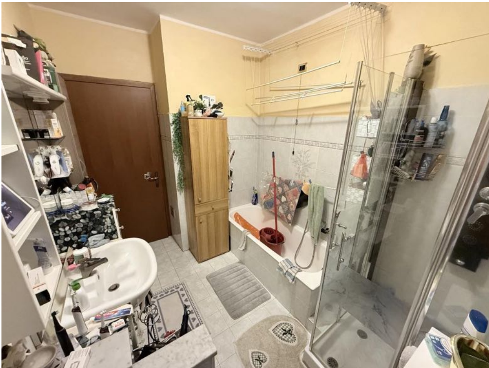
Piano Primo - Appartamento - Bagno 2 (foto 2)