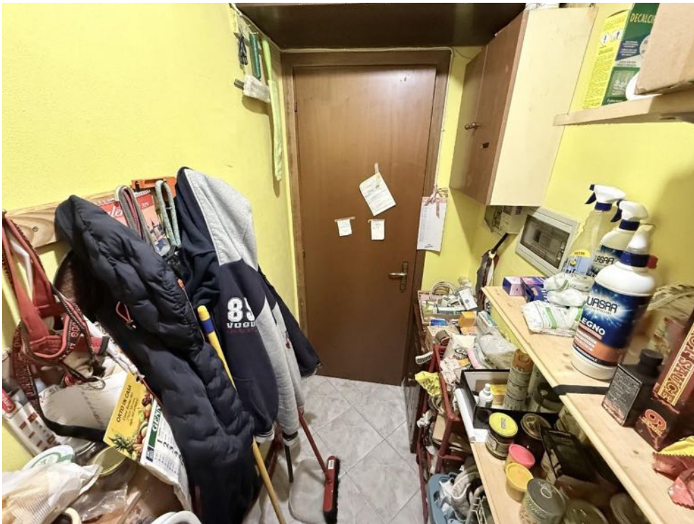
Piano Primo - Appartamento - Ripostiglio 1 (foto 2)