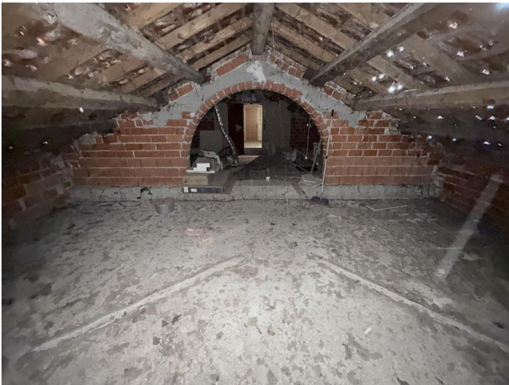
Piano Sottotetto - Appartamento - Locale 4 (foto 1)