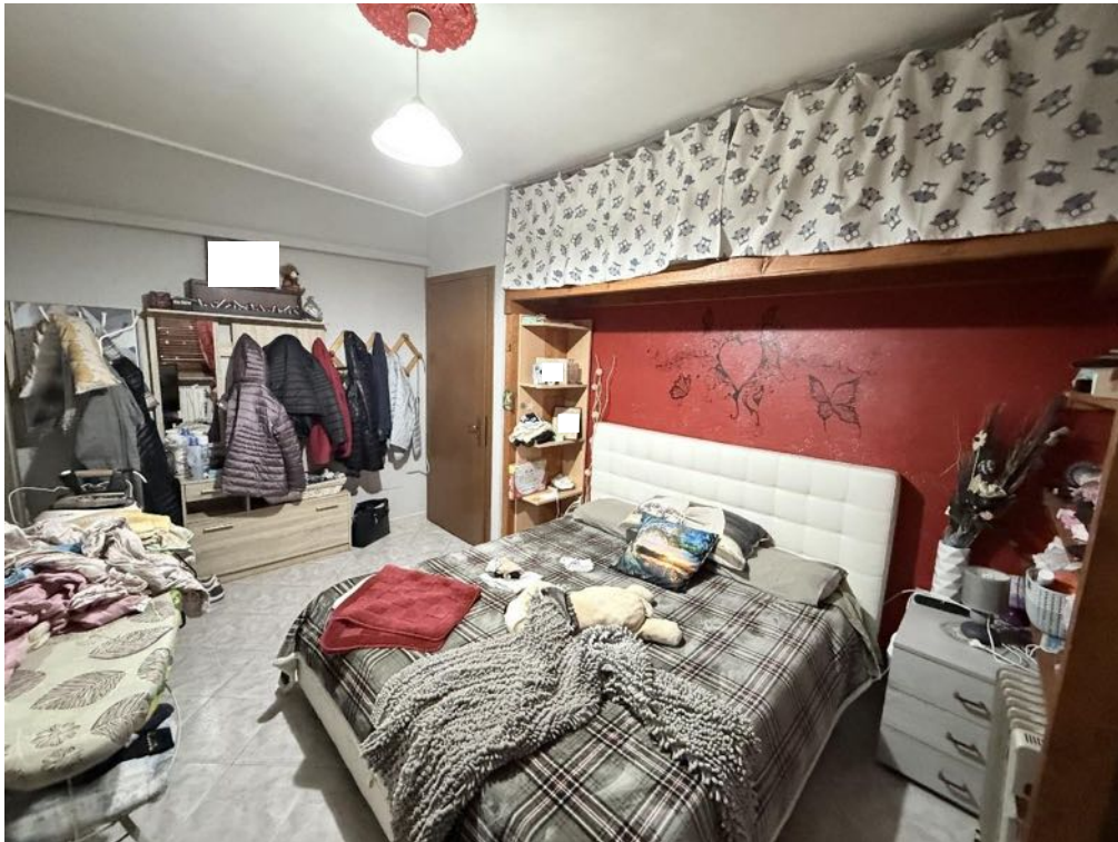
Piano Primo - Appartamento - Camera 3 (foto 3)