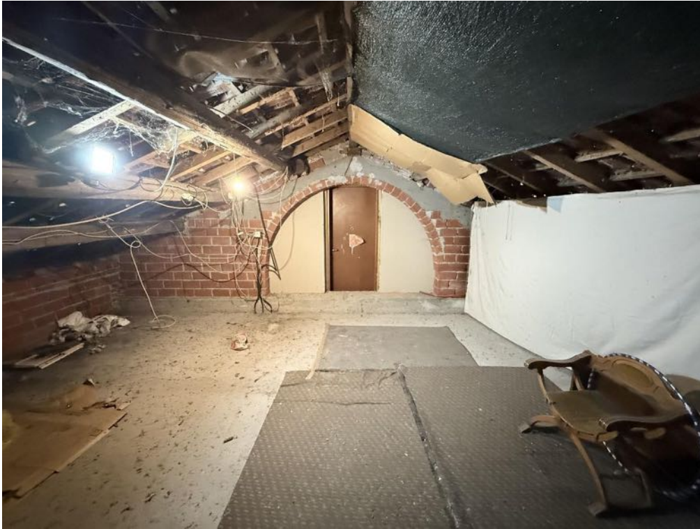
Piano Sottotetto - Appartamento - Locale 2 (foto 2)