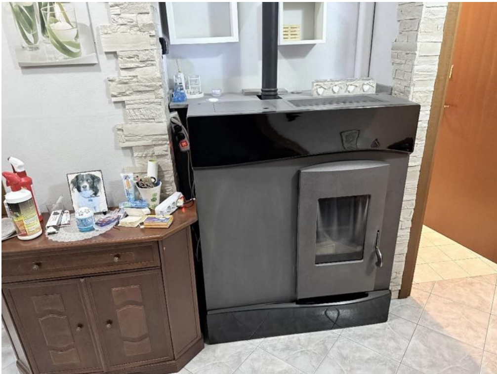
Piano Primo - Appartamento - Dettaglio - Stufa a pellet