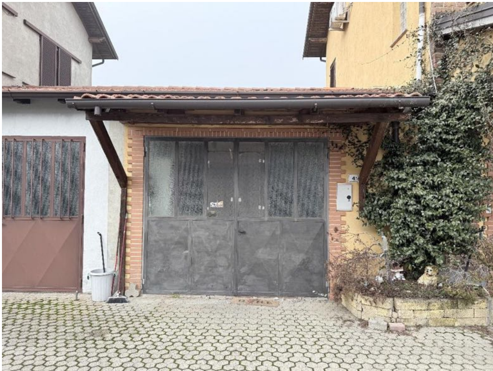
Piano Terra - Box - Accesso (foto 1)