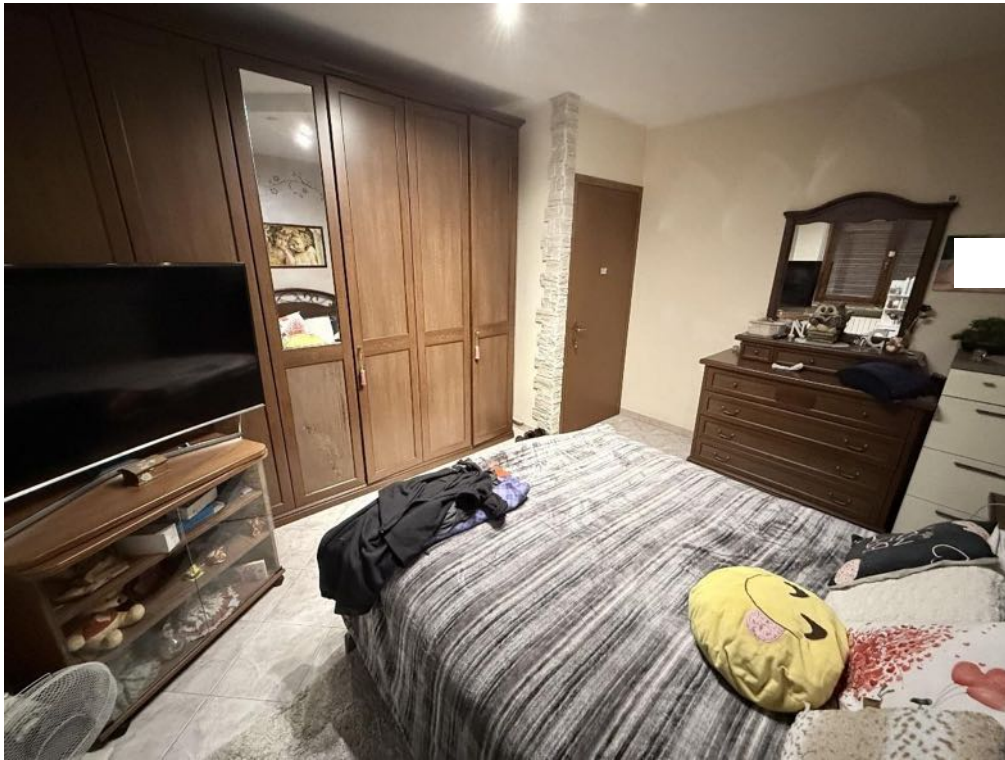
Piano Primo - Appartamento - Camera 2 (foto 3)