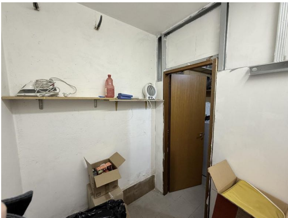
Piano Terra - Locale cantina (foto 1)