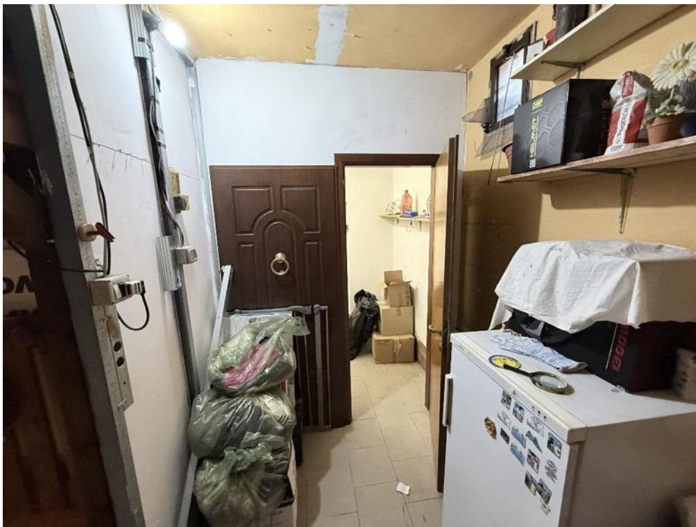
Piano Terra - Disimpegno (foto 3)