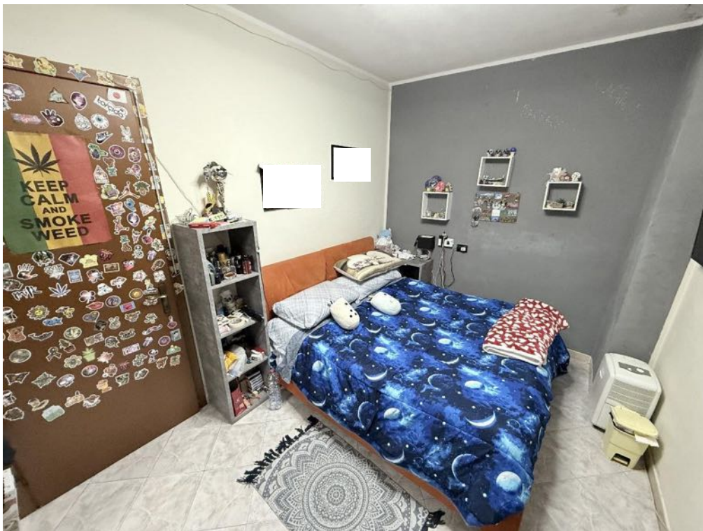
Piano Primo - Appartamento - Camera 1 (foto 2)