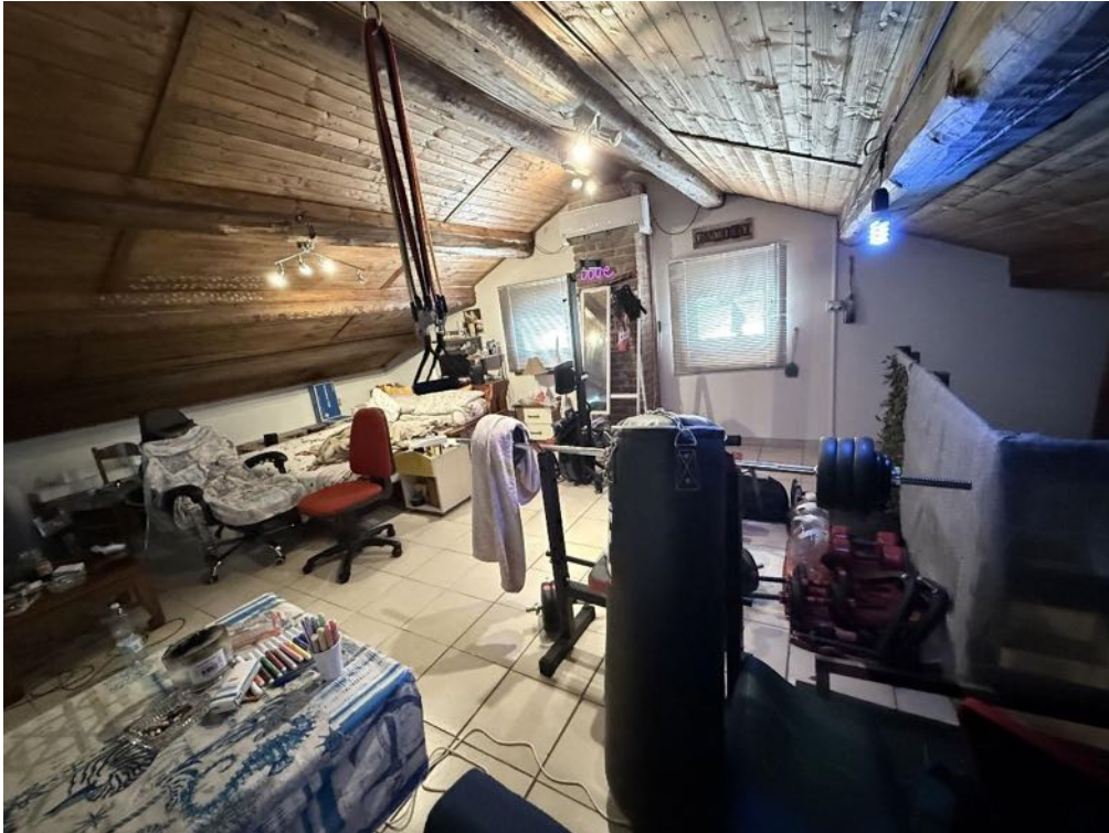
Piano Sottotetto - Appartamento - Locale 1 (foto 4)