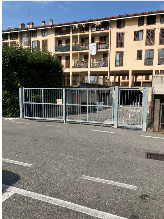
Foto n. 1: Prospetto su via Mazzini e accesso al piano primo interrato.