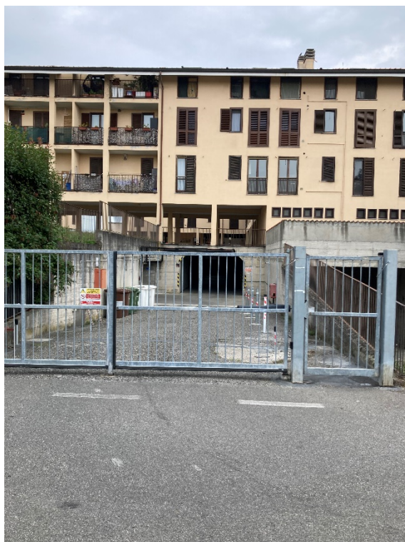
Foto n. 2: Prospetto su via Mazzini e accesso al piano primo interrato.