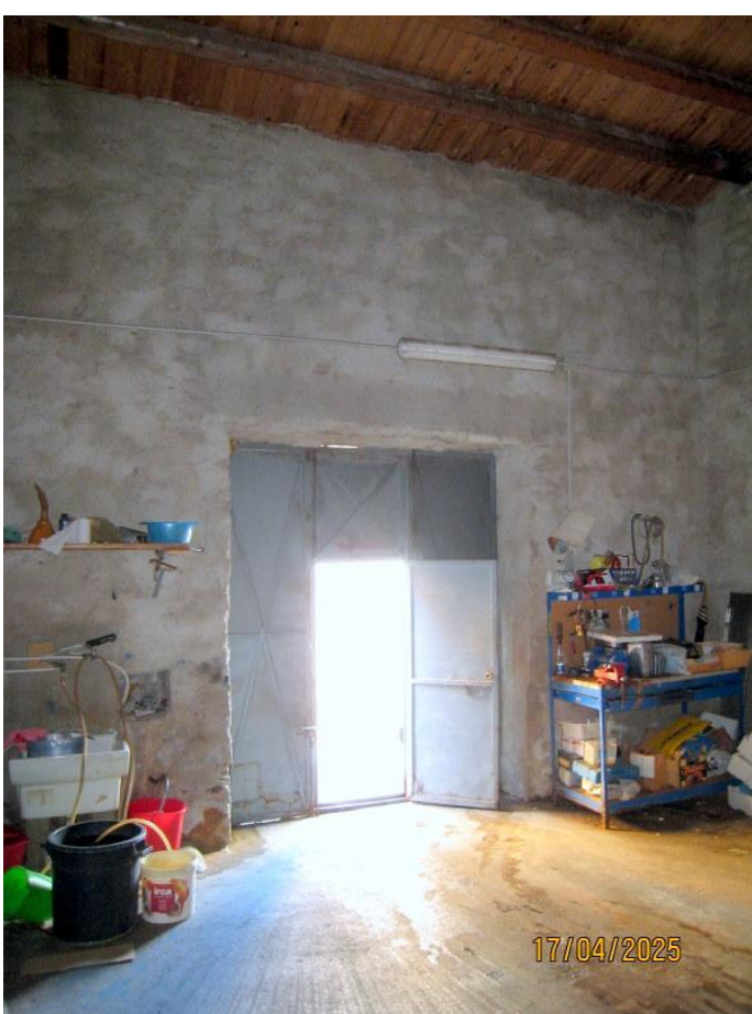
Foto n. 16. Il portone di ingresso visto dall'interno.