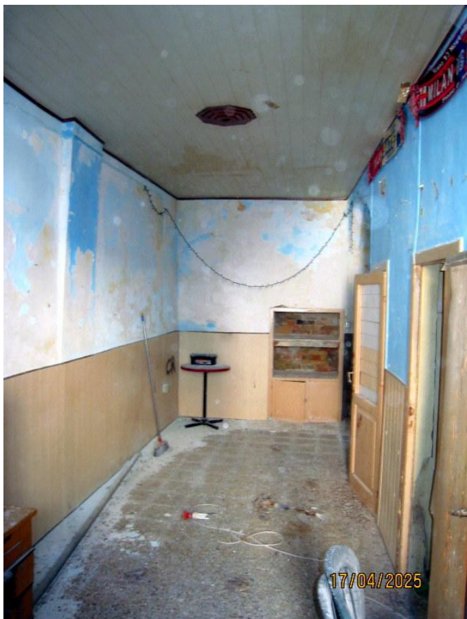
Foto n. 3. La stanza che si ha davanti appena entrati.