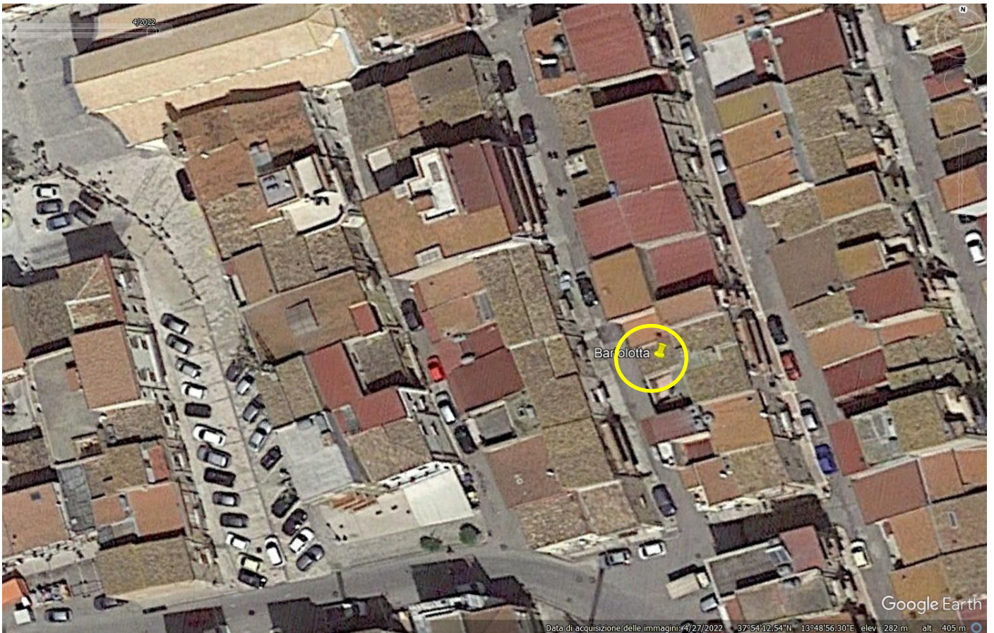
Foto n. 1. Immagine aerea con indicata la posizione del fabbricato di Via Amendola n. 125.