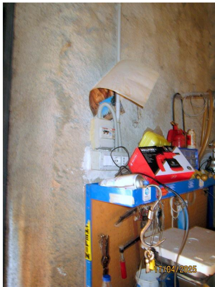
Foto n. 19. Il quadretto elettrico di derivazione dal contatore Enel.