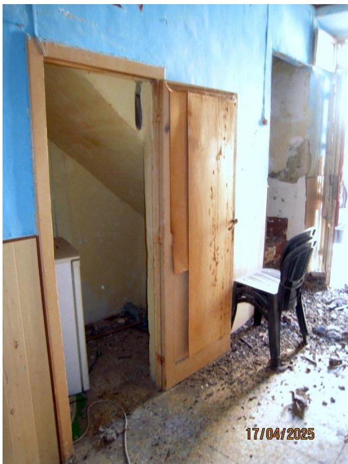
Foto n. 5. Il minuscolo ripostiglio nel sotto scala.