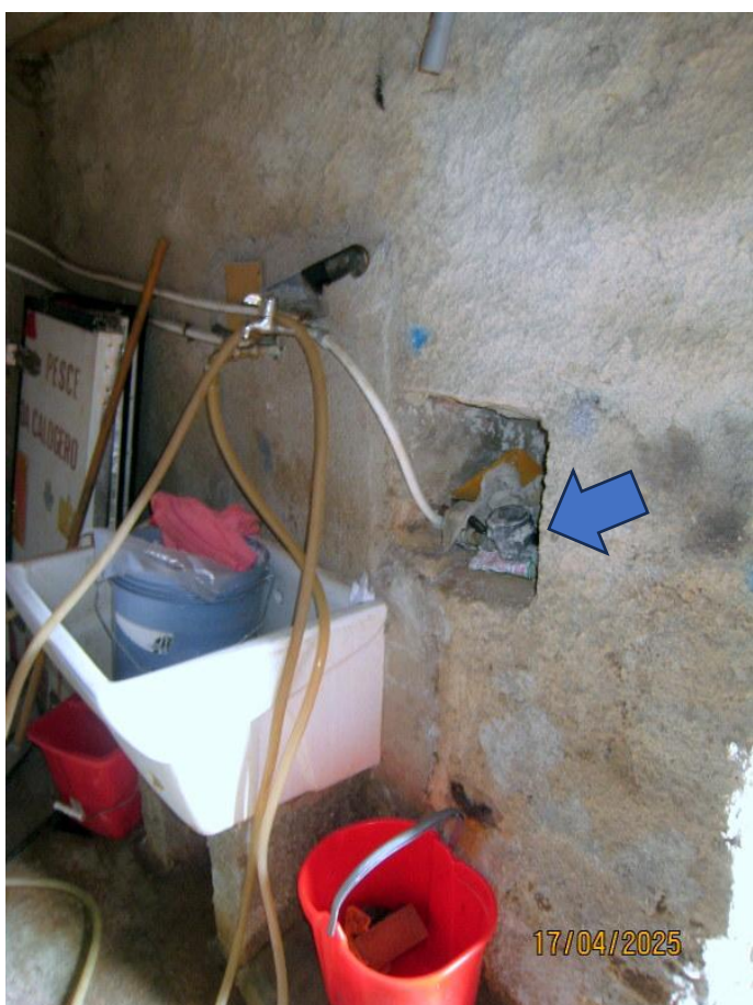
Foto n. 18. Il misuratore idrico.