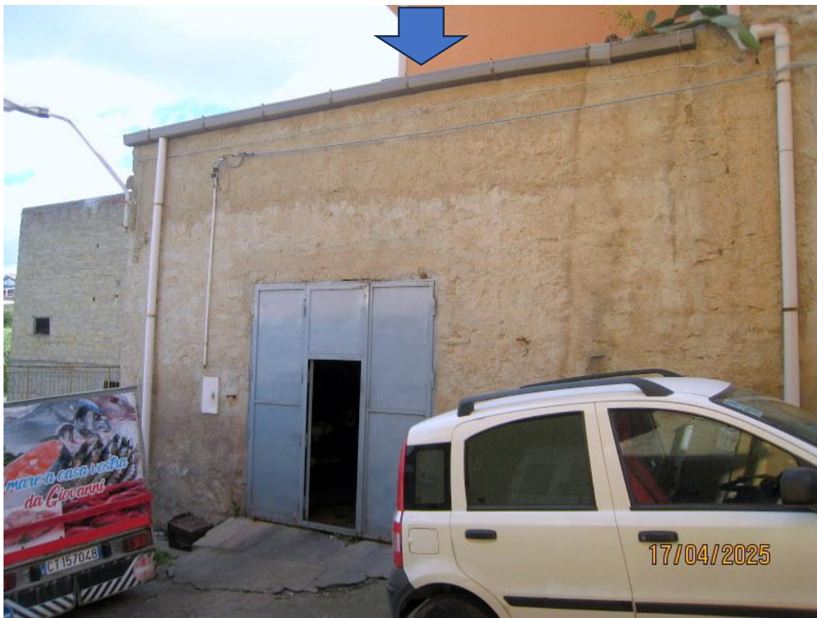
Foto n. 10. Prospetto sulla strada del magazzino ed accesso dalla Via Abbate.