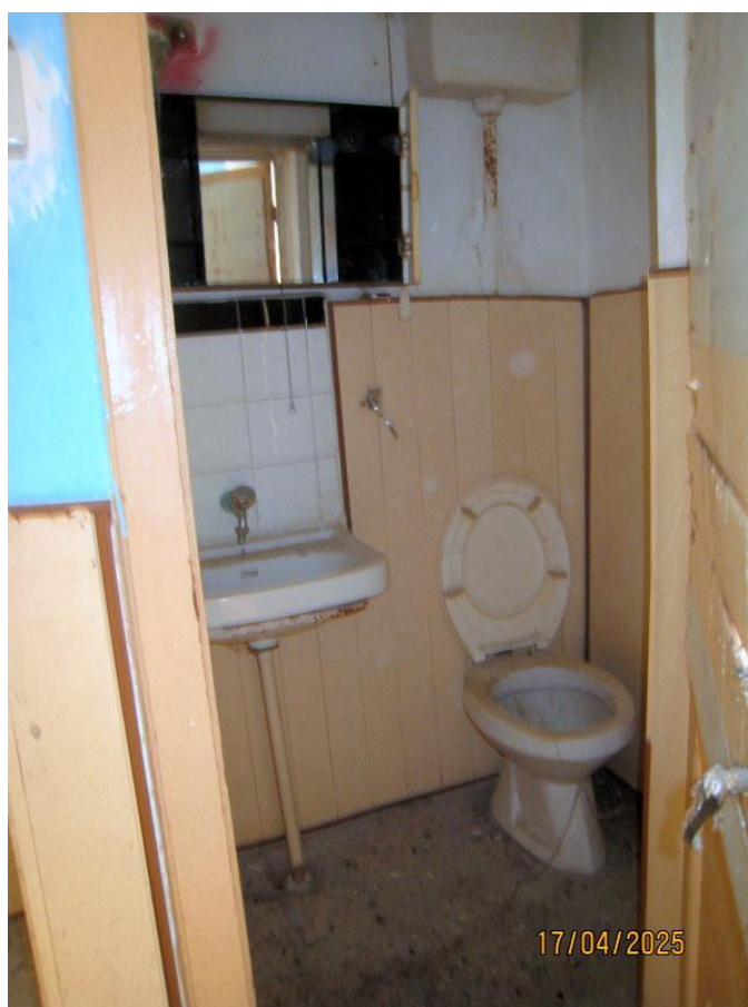
Foto n. 6. Il piccolo w.c. nel sotto scala.