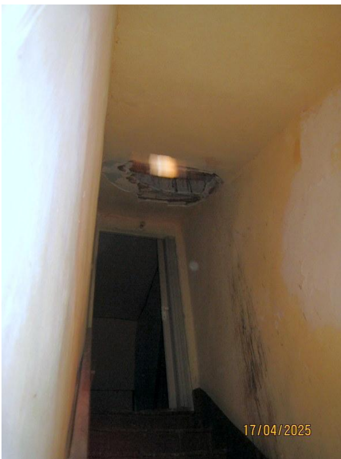
Foto n. 7. La scala tra il P.T. ed il 1° piano è ricoperta di guano.