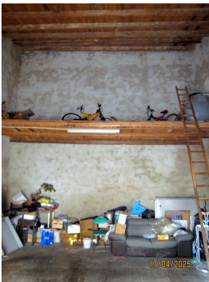
Foto n. 14. Il soppalco in legno. I muri sono pregni di umidità.