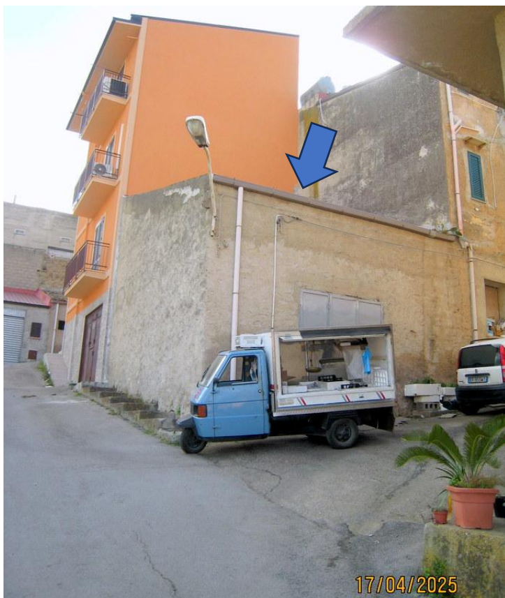
Foto n. 11. Il magazzino è posto ad angolo tra la Via Abbate e la Via Matteotti.