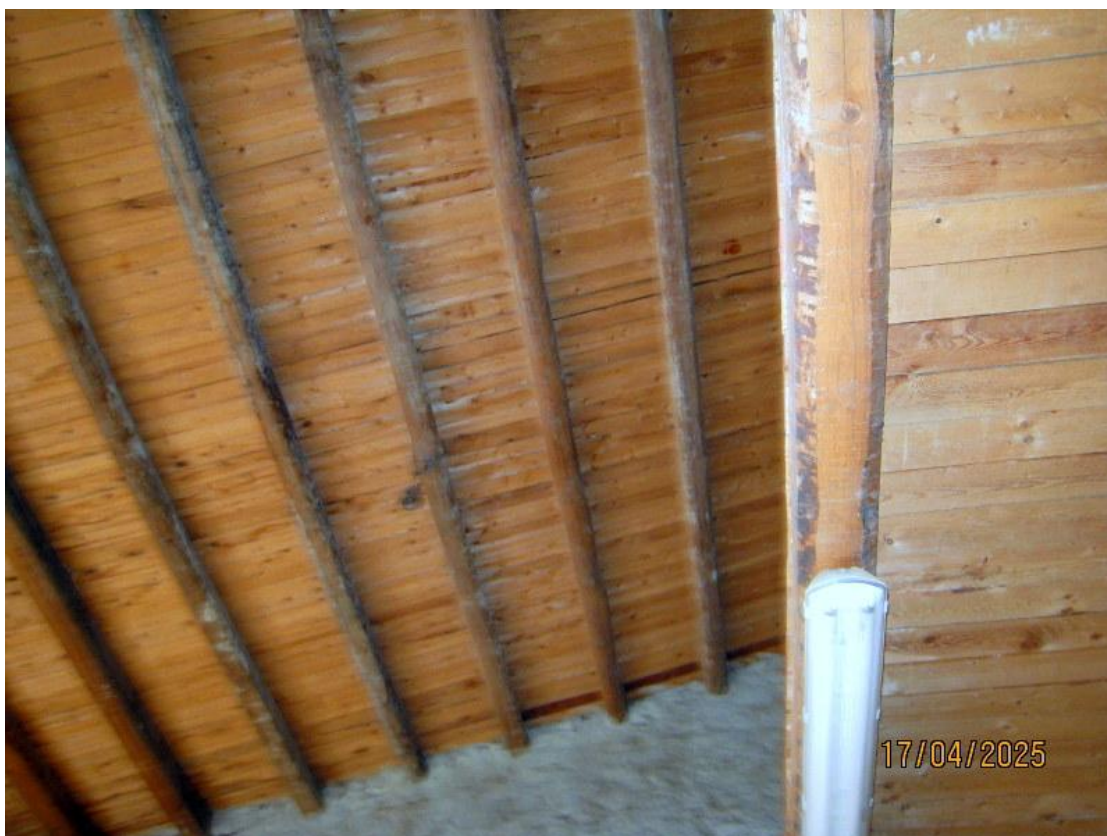
Foto n. 17. tanto il tetto che il soppalco hanno struttura lignea.