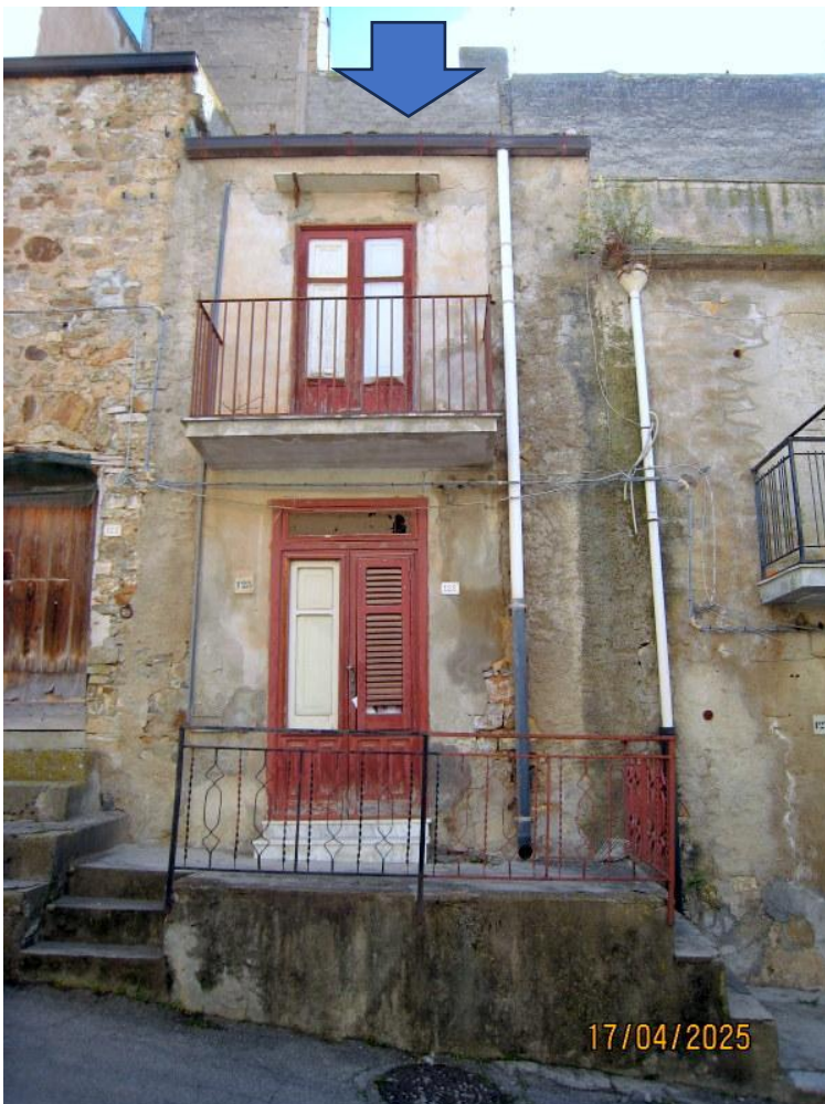
Foto n. 2. Il prospetto su strada. Le condizioni degli intonaci e della muratura sono scadenti, come pure quelli degli infissi esterni.

Anche gli interni, di cui alle foto a seguire, sono in uno stato di totale abbandono e cosparsi da guano di colombi.