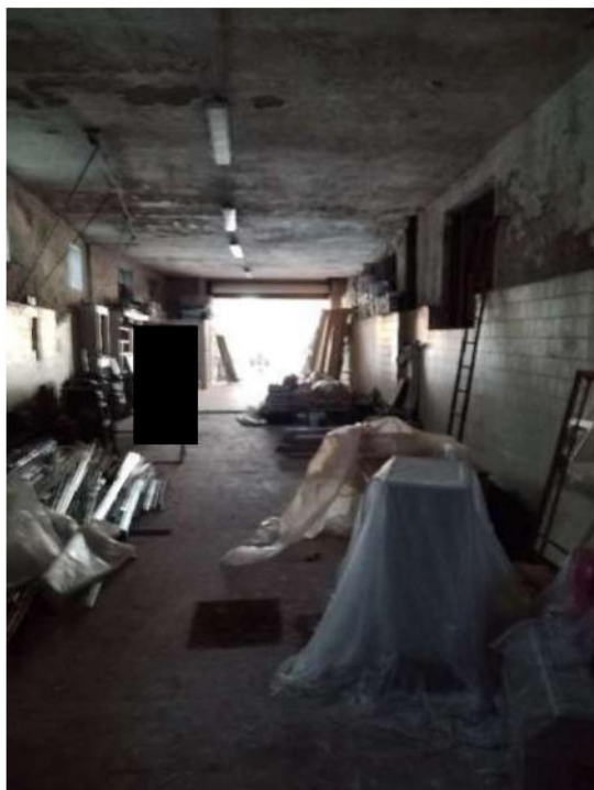
10) Magazzini per la lavorazione Prodotti Vinicoli (fg.6, part.3; sub. 12)