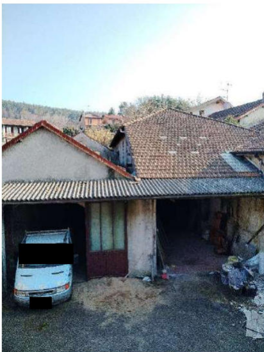
6) Fronte dei depositi verso la corte interna;