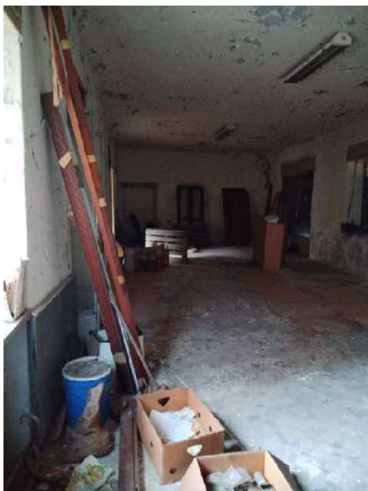
18) Bottega a piano terra con accesso su strada (fg.6, part.3; sub. 14);