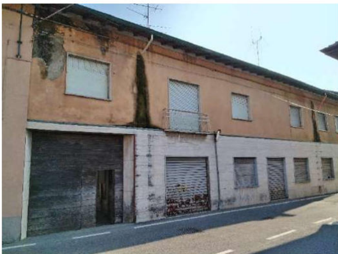
2) Ingresso dei fabbricati in P.zza Antonio Gramsci a Corgeno di Vergiate ,