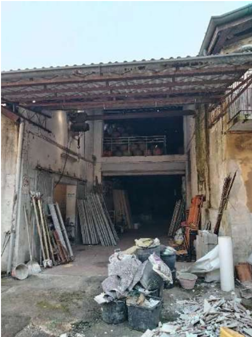
9) Ingresso dei magazzini per la lavorazione Prodotti Vinicoli (fg.6, part.3; sub. 12)