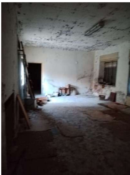
17) Bottega a piano terra con accesso su strada (fg.6, part.3; sub. 14);