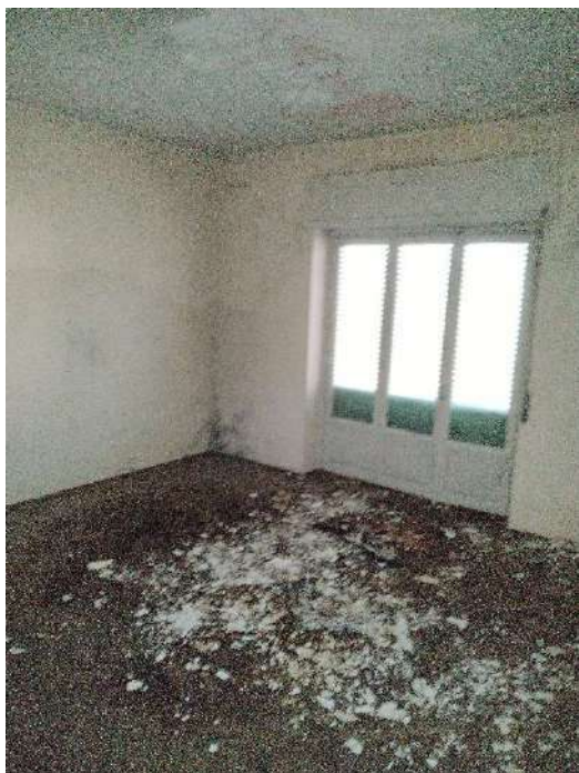
27) Appartamento a piano primo (fg.6, part.3; sub. 17);