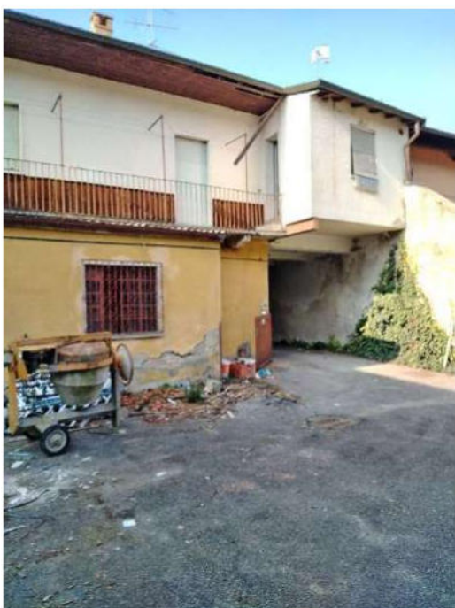
7) Retro dei fabbricati su strada che affacciano sulla corte interna;