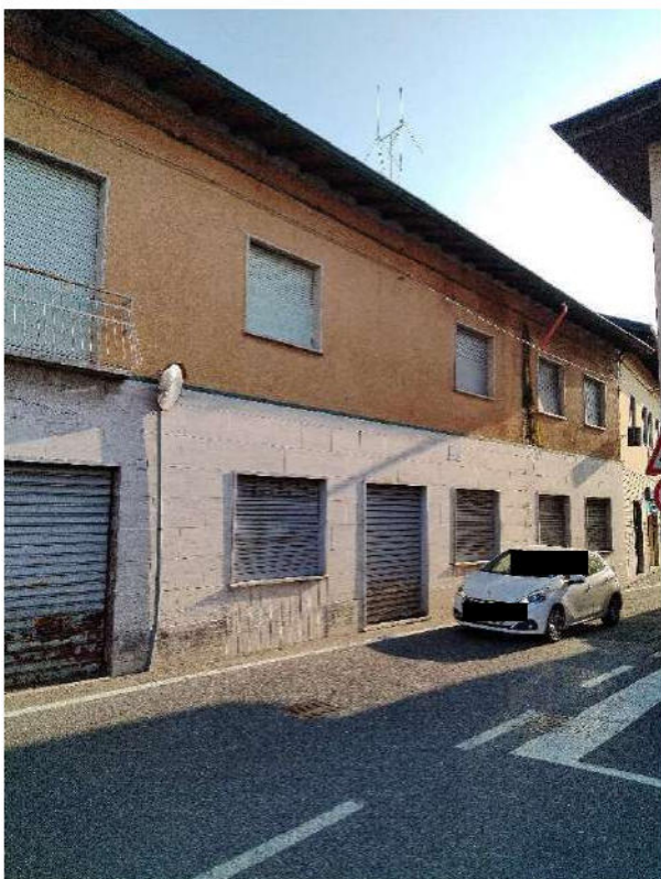
3) Prospetto della proprietà Lungo via Fratelli Rosselli ;