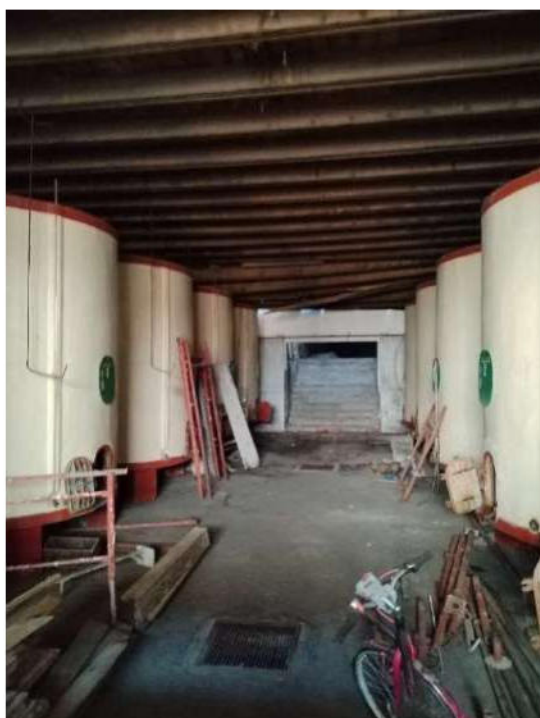
11) Magazzini per la lavorazione Prodotti Vinicoli (fg.6, part.3; sub. 12)