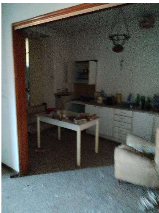
23) Appartamento a piano primo cucina (fg.6, part.3; sub. 16);