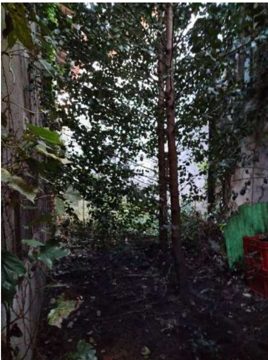
13) Magazzini per la lavorazione Prodotti Vinicoli (fg.6, part.3; sub. 12)