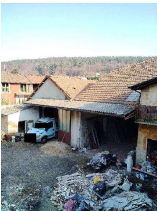
5) Fotografia dall'alto della corte interna;