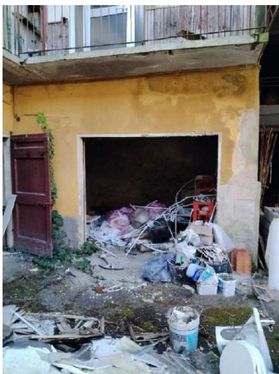
19) Deposito (fg.6, part.3; sub. 15);