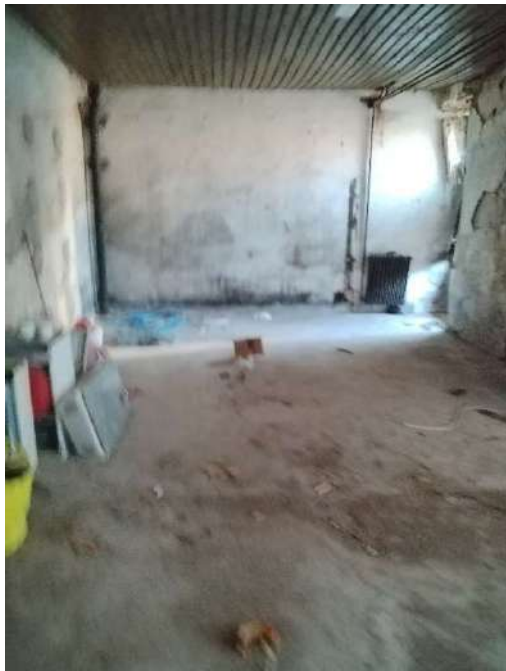
15) Deposito Materiali Vari (fg.6, part.3; sub. 13)