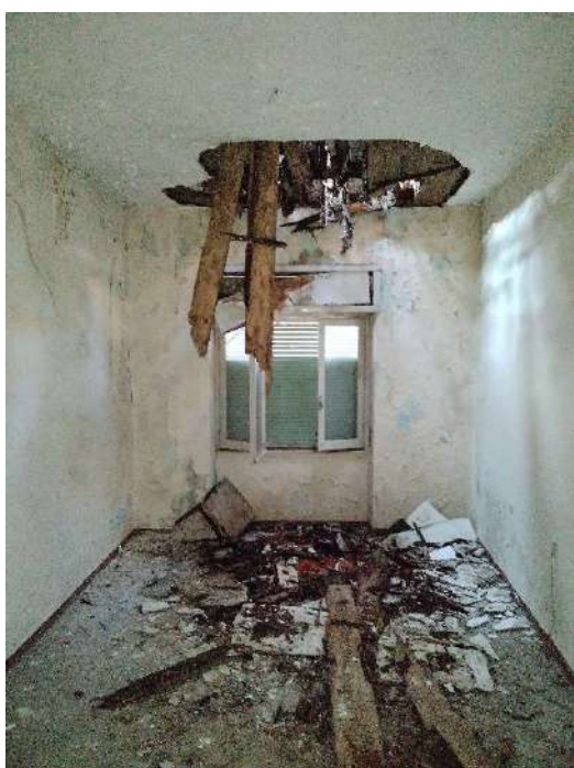
28) Appartamento a piano primo (fg.6, part.3; sub. 17);