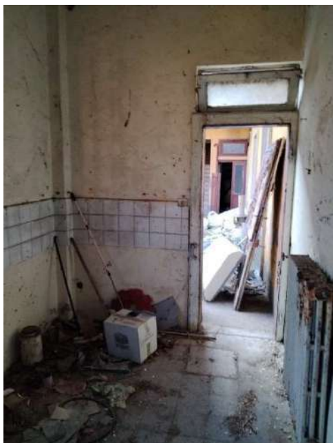
16) Ingresso alla bottega a piano terra con accesso su strada (fg.6, part.3; sub. 14)