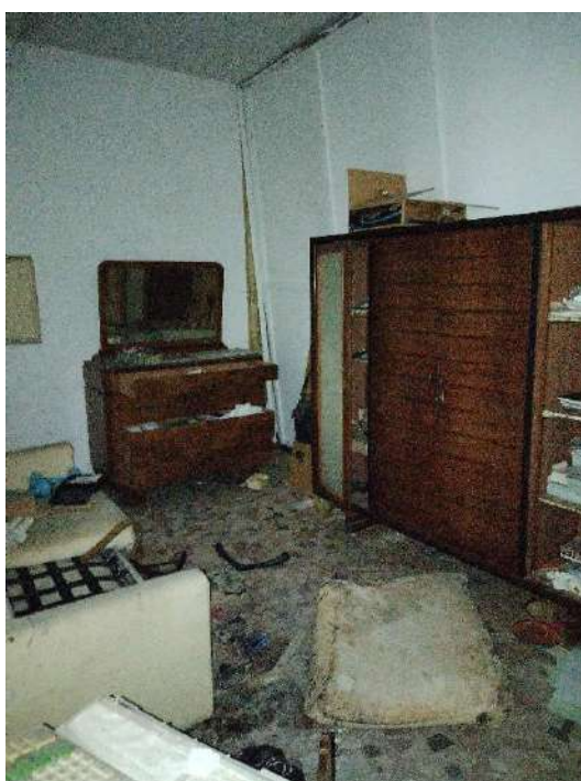
26) Altro ambiente (fg.6, part.3; sub. 16);