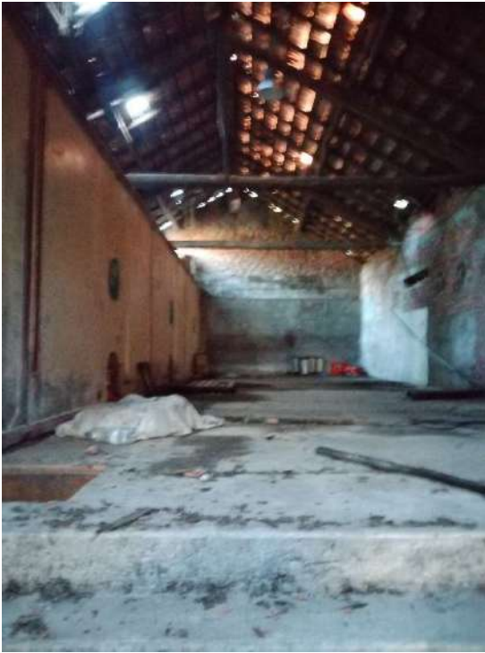
12) Magazzini per la lavorazione Prodotti Vinicoli (fg.6, part.3; sub. 12)