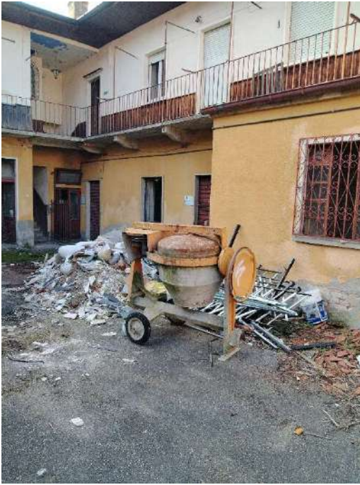
8) Retro dei fabbricati su strada che affacciano sulla corte Interna;