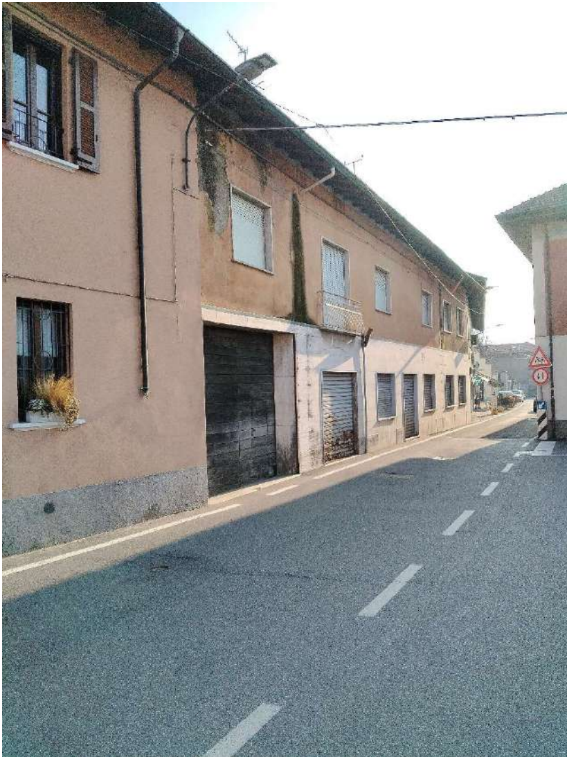
1) Panoramica dei fabbricati in P.zza Antonio Gramsci a Corgeno di Vergiate ,

LOTTO 4 _ Beni in Corgeno di Vergiate, P.zza Antonio Gramsci