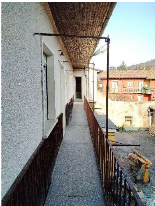
22) Ballatoio di distribuzione a piano primo ;