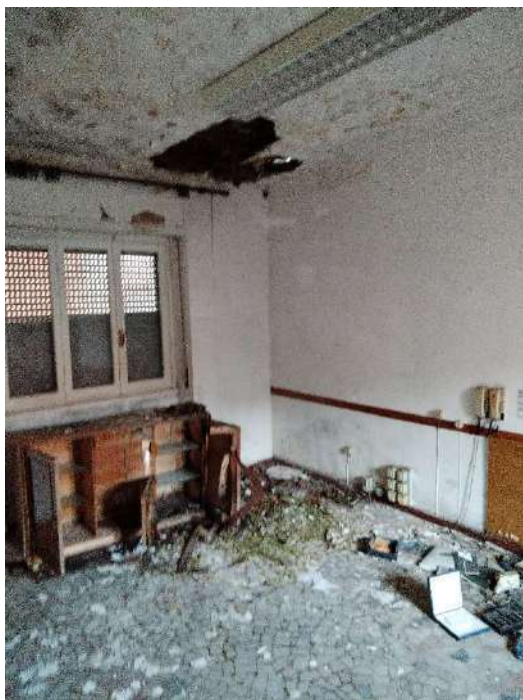
25) Ambiente a confine con la cucina (fg.6, part.3; sub. 16);