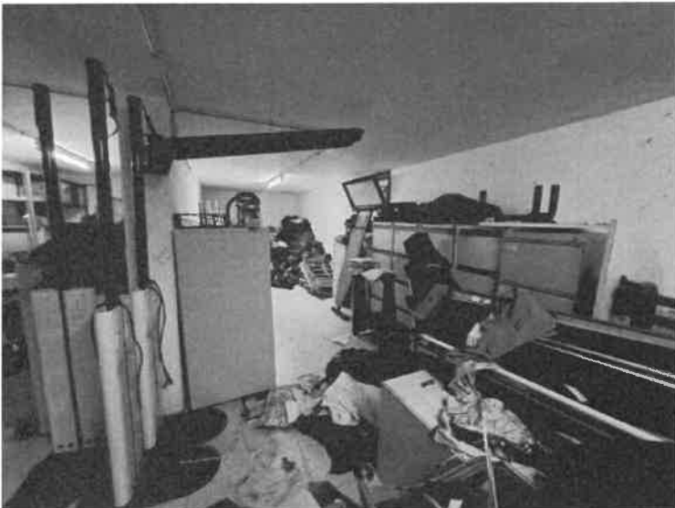
Foto n. 10: Vista interna del piano interrato ad uso autorimessa, sub.25