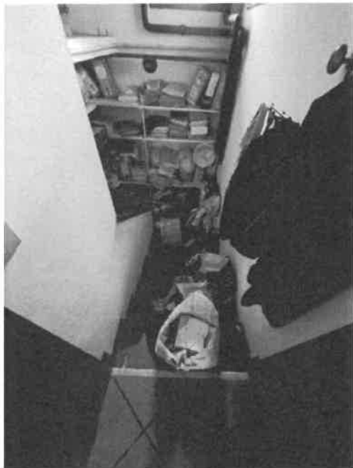
Foto n. 13: Vista interna della scala che collega piano terra con piano interrato, di cui al sub.26

Documentazione fotografica Esecuzione Immobiliare n. 255/2024