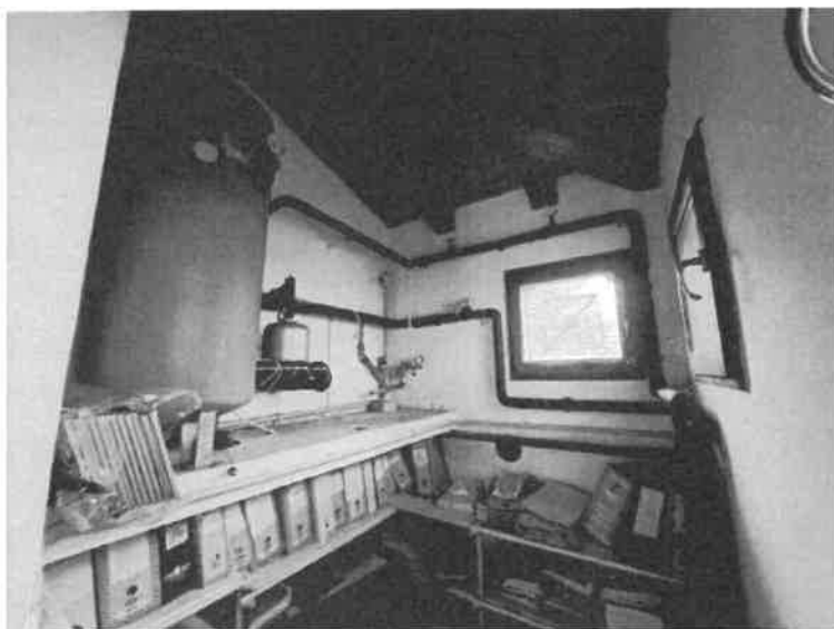
Foto n. 14: Vista interna del vanoscala che collega piano terra con piano interrato, di cui al sub.26