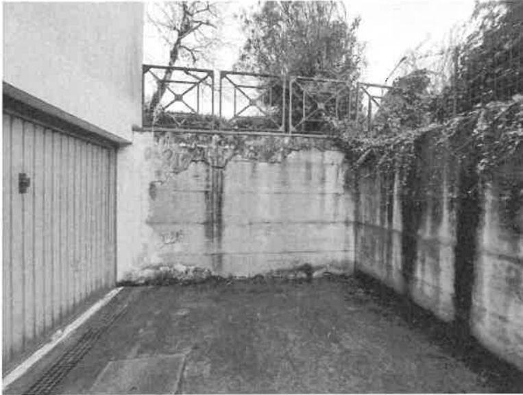
Foto n. 5: Vista del portone di accesso carraio al piano interrato sub.25

Documentazione fotografica Esecuzione Immobiliare n. 255/2024