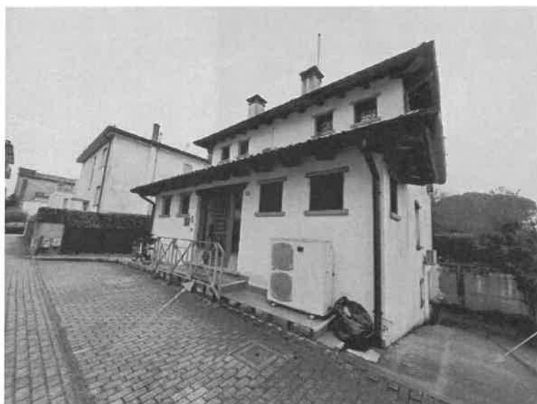
Foto n. 4: Vista del fabbricato ad uso direzionale ove sono ubicati i beni oggetto di pignoramento, ove la porta rossa rappresenta l'accesso al locale ingresso sub.26, e la rampa esclusiva del sub.25