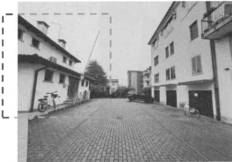
Foto n. 2: Vista dello scoperto comune di accesso e manovra, con evidenziato il fabbricato ad uso direzionale ove sono ubicati i beni oggetto di pignoramento.