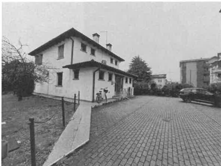
Foto n. 3: Vista del fabbricato ad uso direzionale ove sono ubicati i beni oggetto di pignoramento, ove la porta rossa rappresenta l'accesso al locale ingresso sub.26