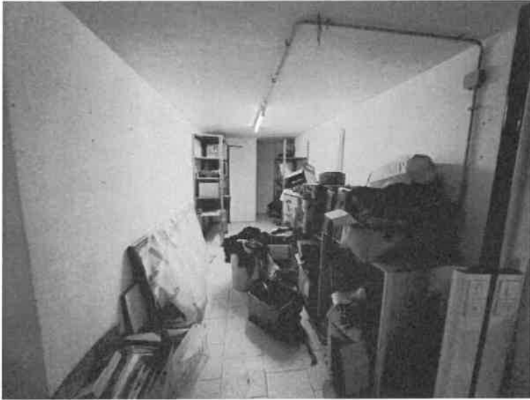
Foto n. 9: Vista interna del piano interrato ad uso autorimessa, sub.25

Documentazione fotografica Esecuzione Immobiliare n. 255/2024