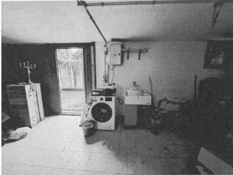
Foto n. 7: Vista interna del piano interrato ad uso autorimessa, sub.25

Documentazione fotografica Esecuzione Immobiliare n. 255/2024