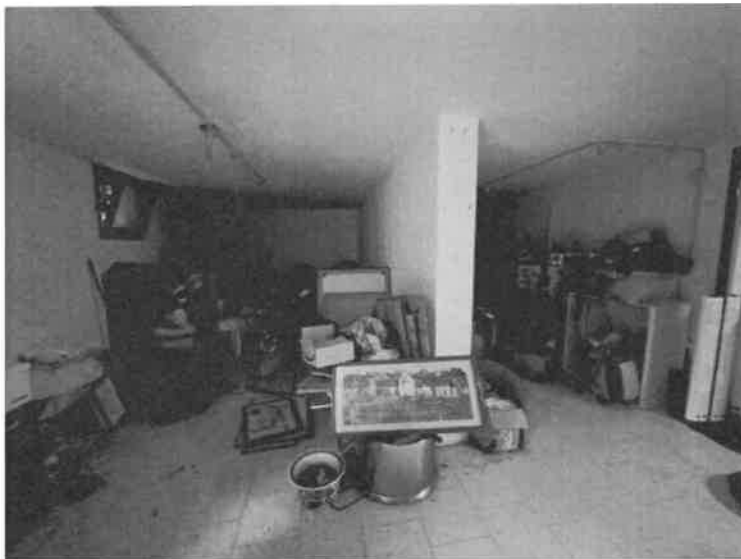
Foto n. 8: Vista interna del piano interrato ad uso autorimessa, sub.25