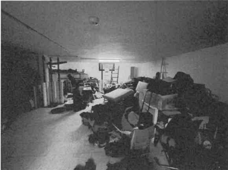
Foto n. 6: Vista interna del piano interrato ad uso autorimessa, sub.25