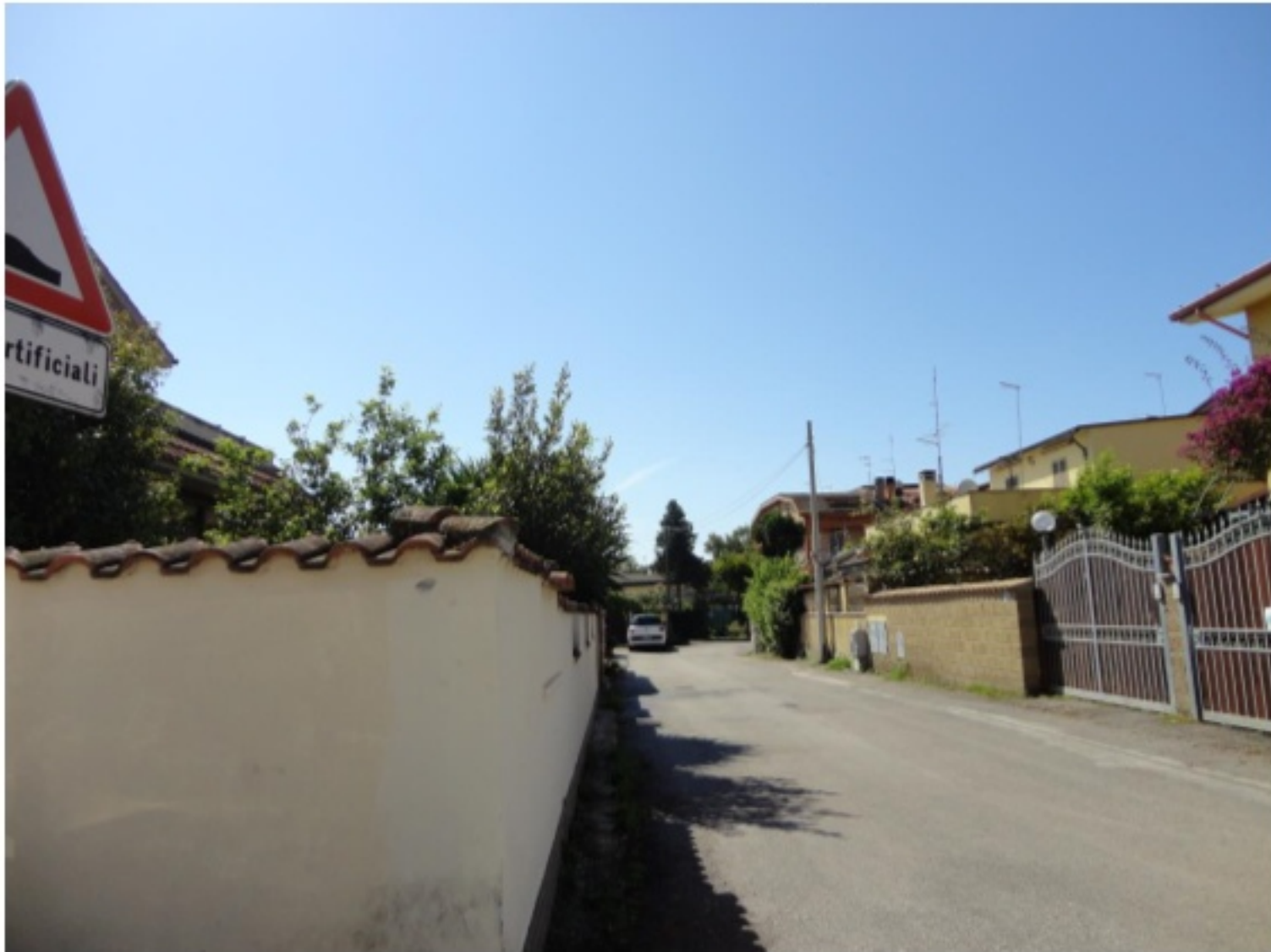
Immagine della via di accesso