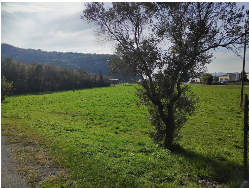
Figura 3. Vista da ovest