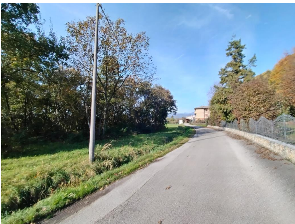
Figura 4. Accesso da via Pianeta ovest