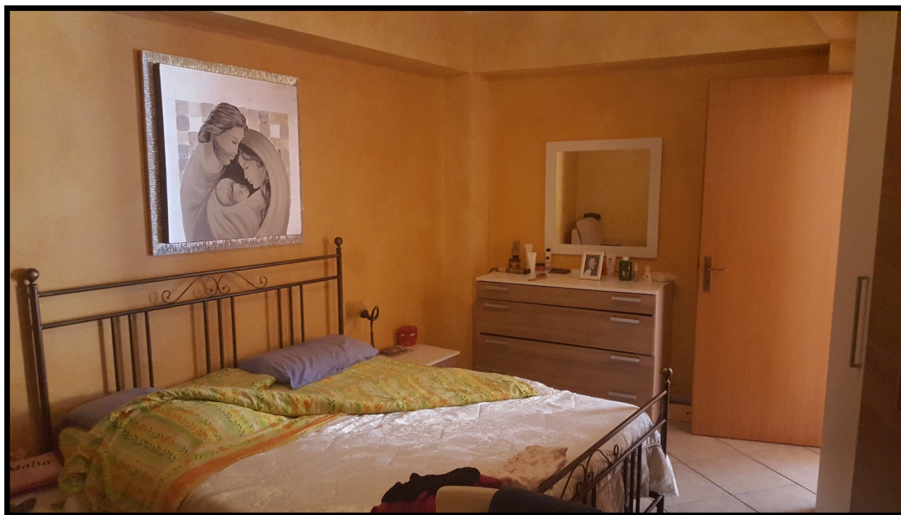
Foto 02 - Camera da letto matrimoniale