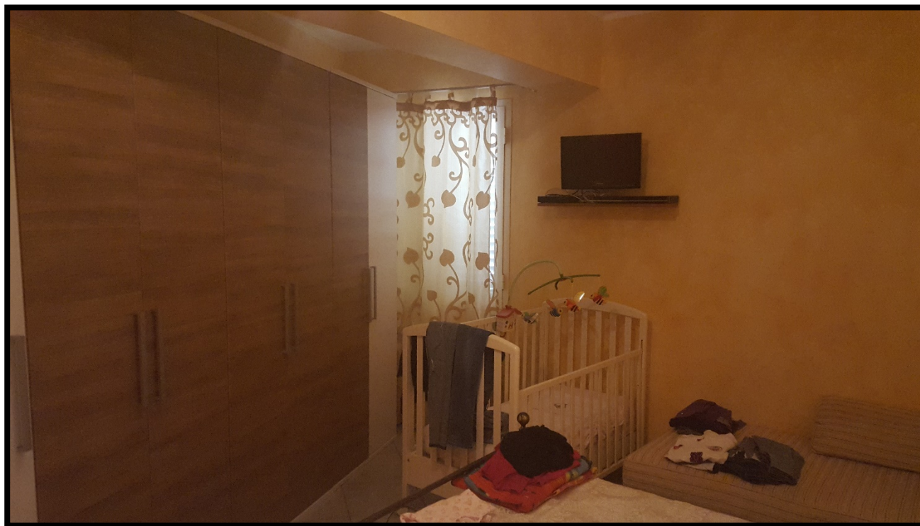
Foto 01 - Camera da letto matrimoniale