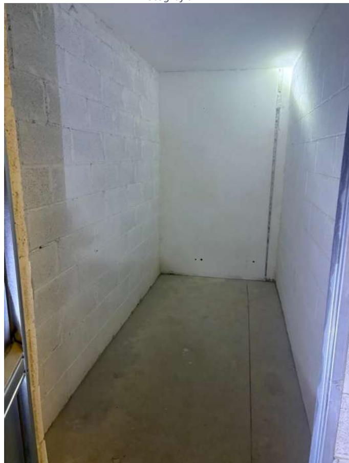
Fotografia n. 2