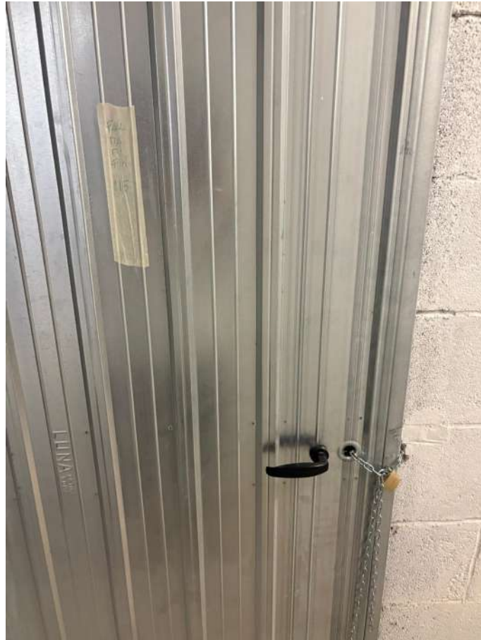
Fotografia n. 1