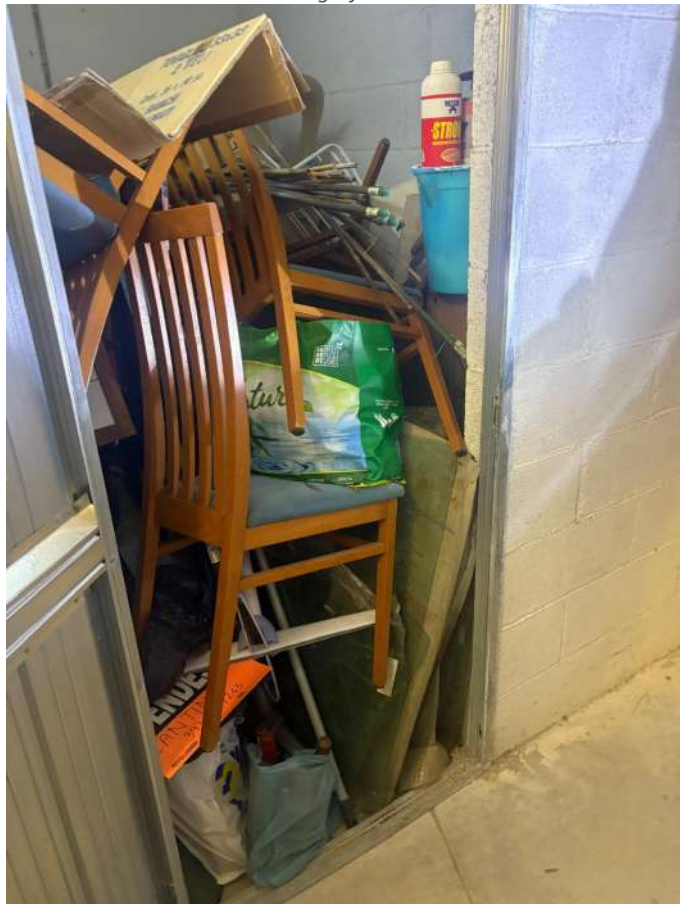
Fotografia n. 4