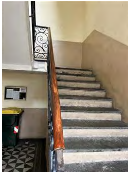
Scala condominiale (prima rampa)