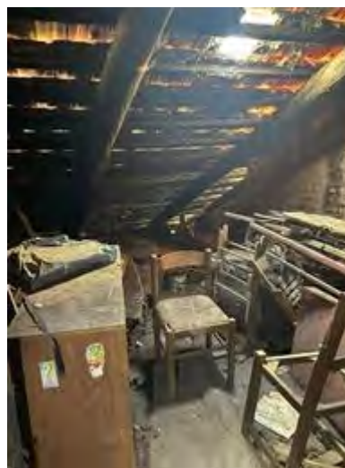
Interno della soffitta n. "3"