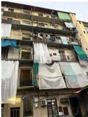
Porzione del fronte lato cortile