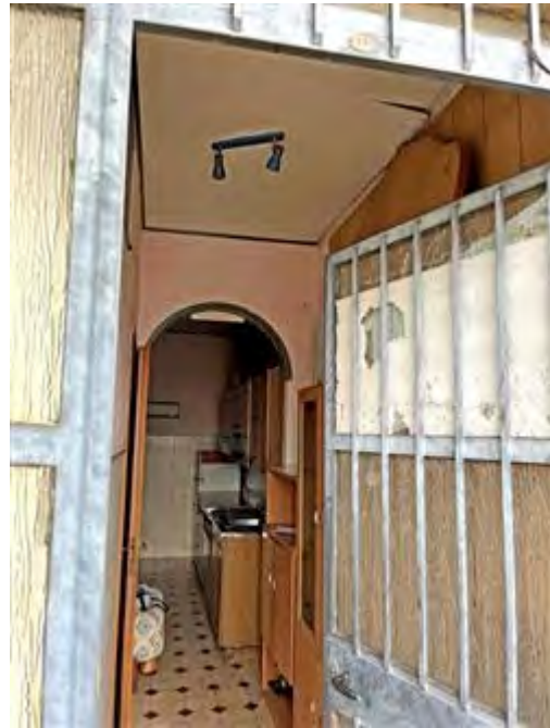
Porta di ingresso all'alloggio pignorato