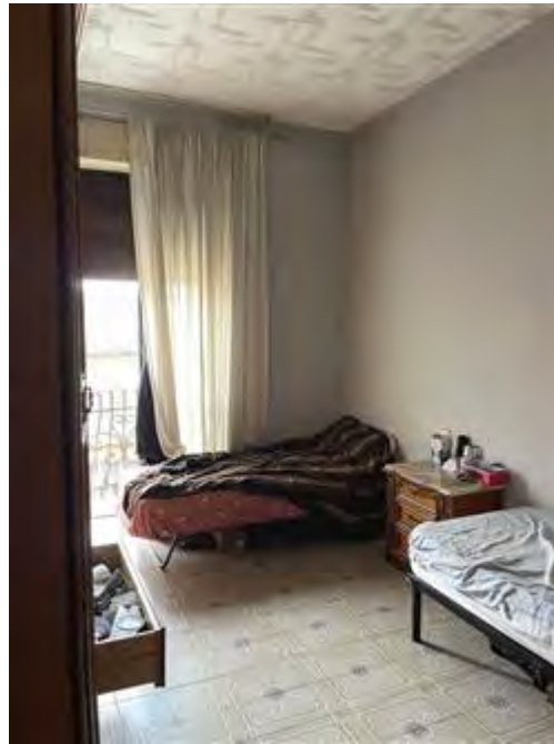
Camera lato corso VERCELLI