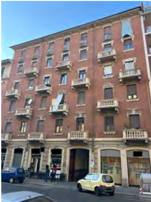
Fronte lato Corso VERCELLI