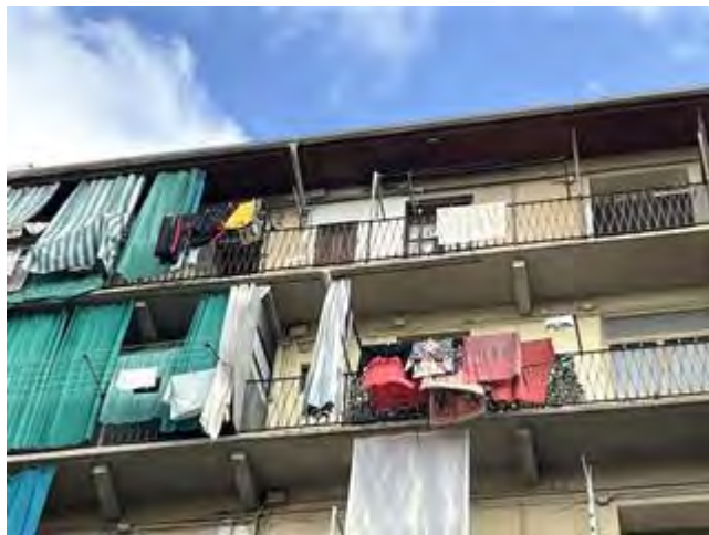
Porzione del fronte lato cortile