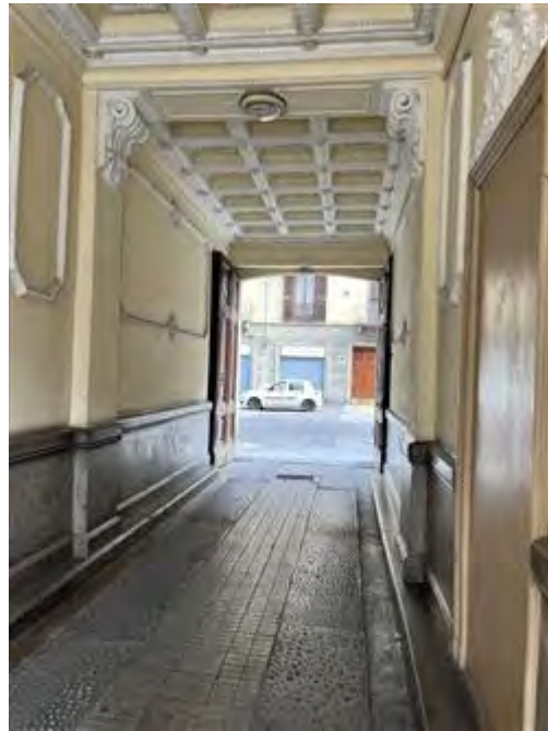
Androne comune di accesso