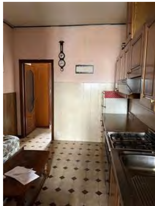
Salottino con area cottura