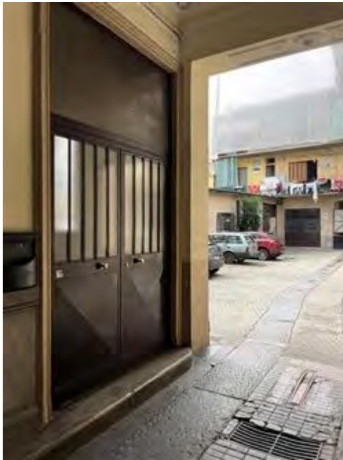
Accesso alla scala condominiale