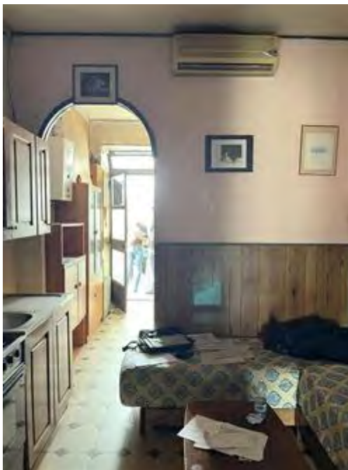
Salottino con area cottura