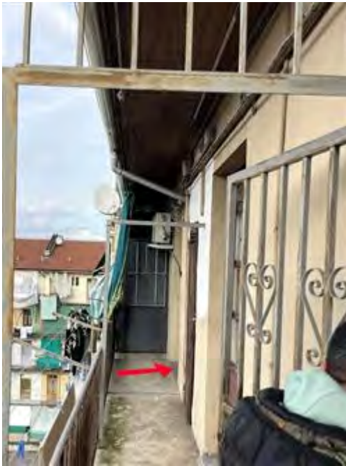
Accesso al ballatoio (la freccia indica l'ingresso all'alloggio pignorato)