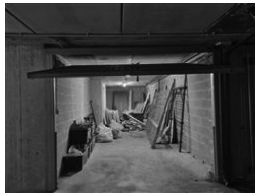
PIANO SECONDO SOTTOSTRADA