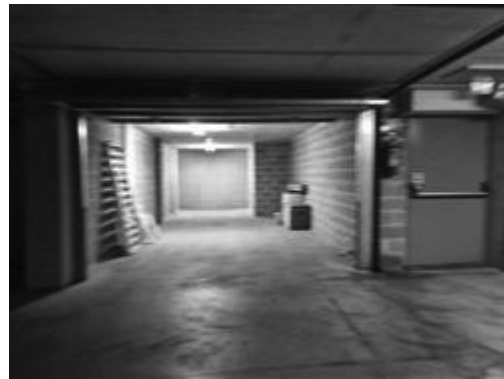
PIANO SECONDO SOTTOSTRADA