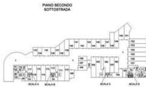
PIANO SECONDO INTERRATO