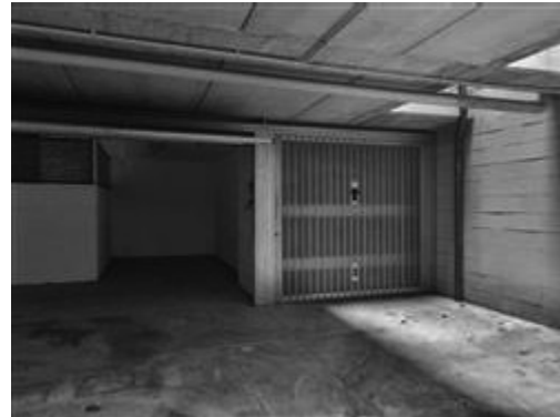
PIANO SECONDO SOTTOSTRADA