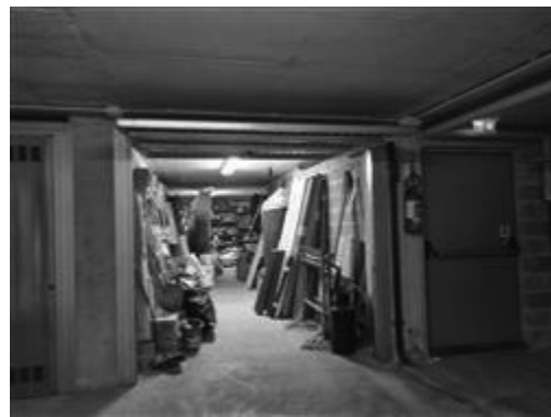
PIANO SECONDO SOTTOSTRADA