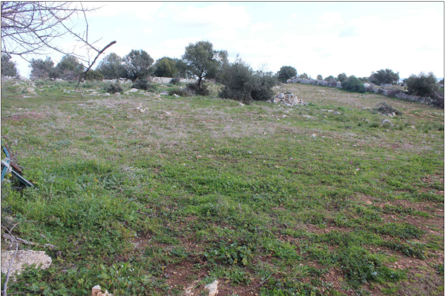
16) Viste sui terreni