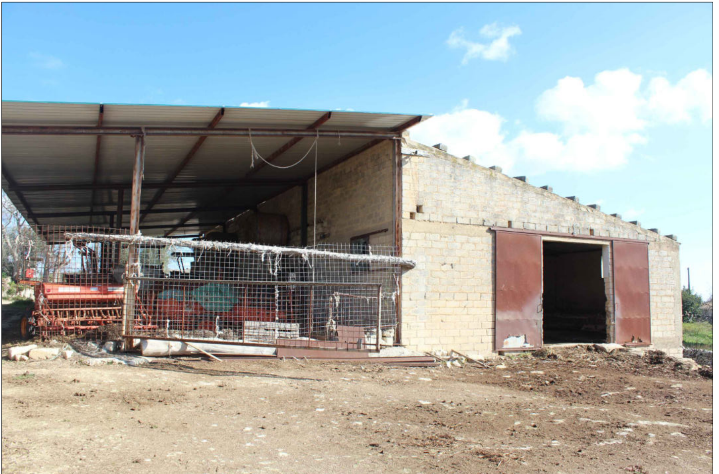
2) Fabbricato rurale adibito a stalla (non censito in catasto) Foglio 160 Particella 136