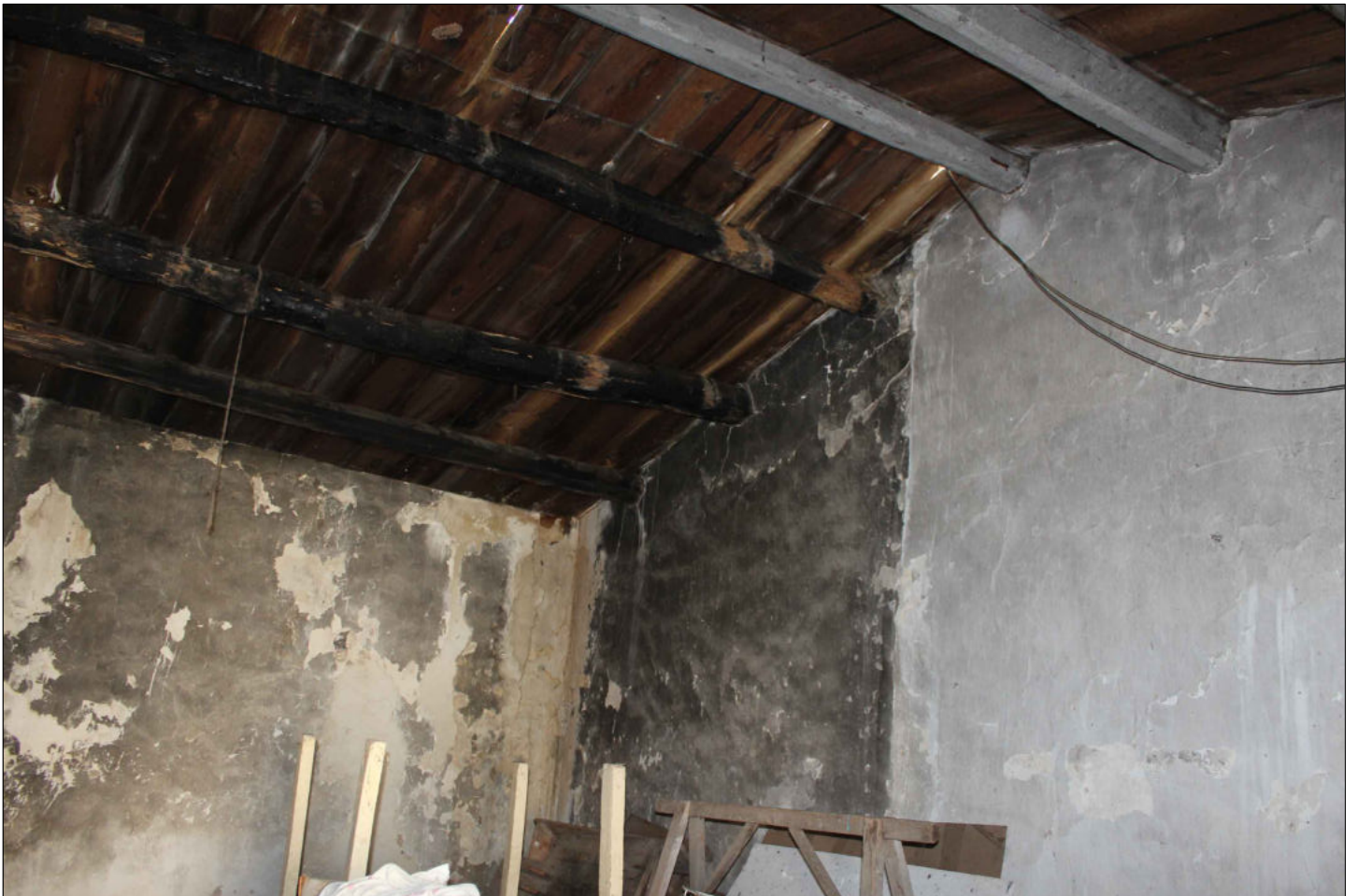
8) Fabbricato (censito D/10) Foglio 160 Particella 137