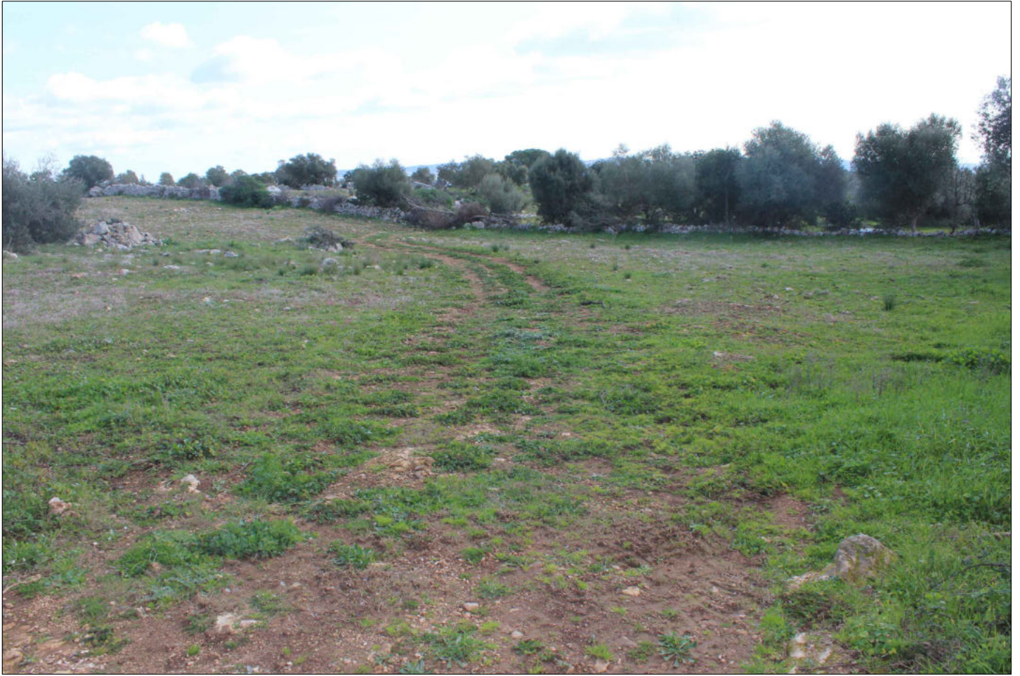
15) Viste sui terreni