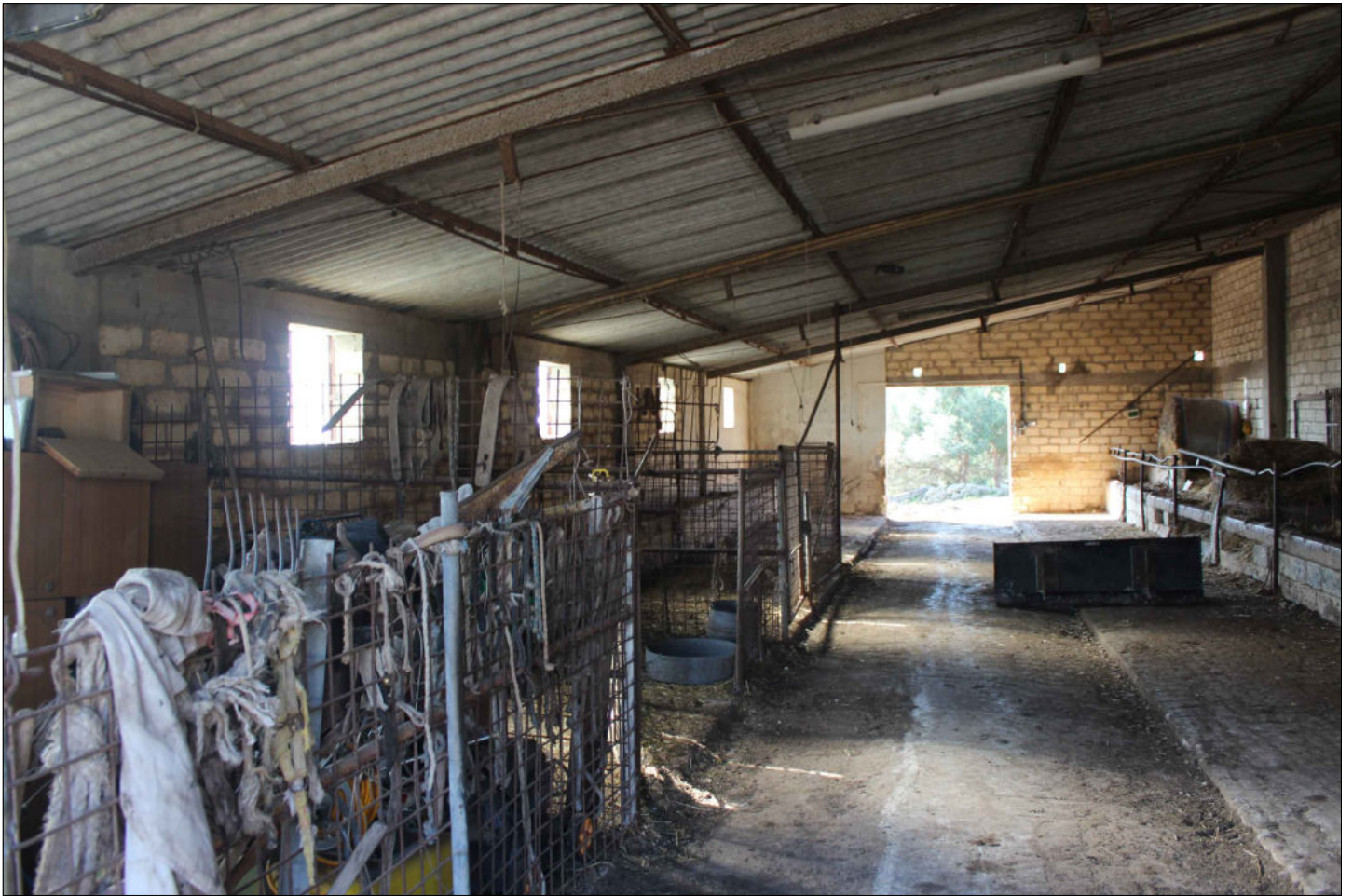
3) Fabbricato rurale adibito a stalla (non censito in catasto) Foglio 160 Particella 136