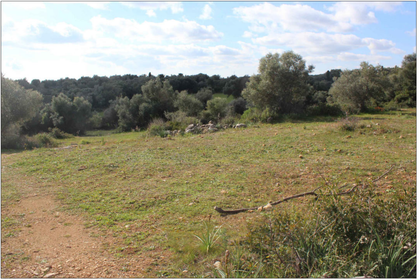
17) Viste sui terreni con la presenza di alberi di ulivi