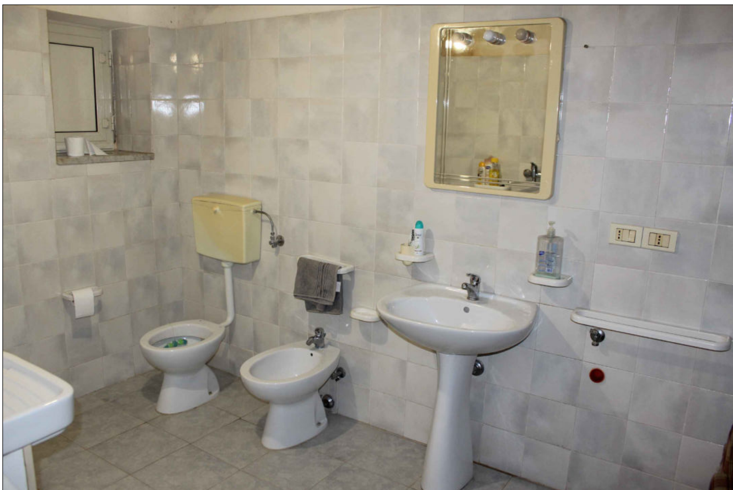
14) Fabbricato rurale (non censito in catasto) Foglio 160 Particella 37