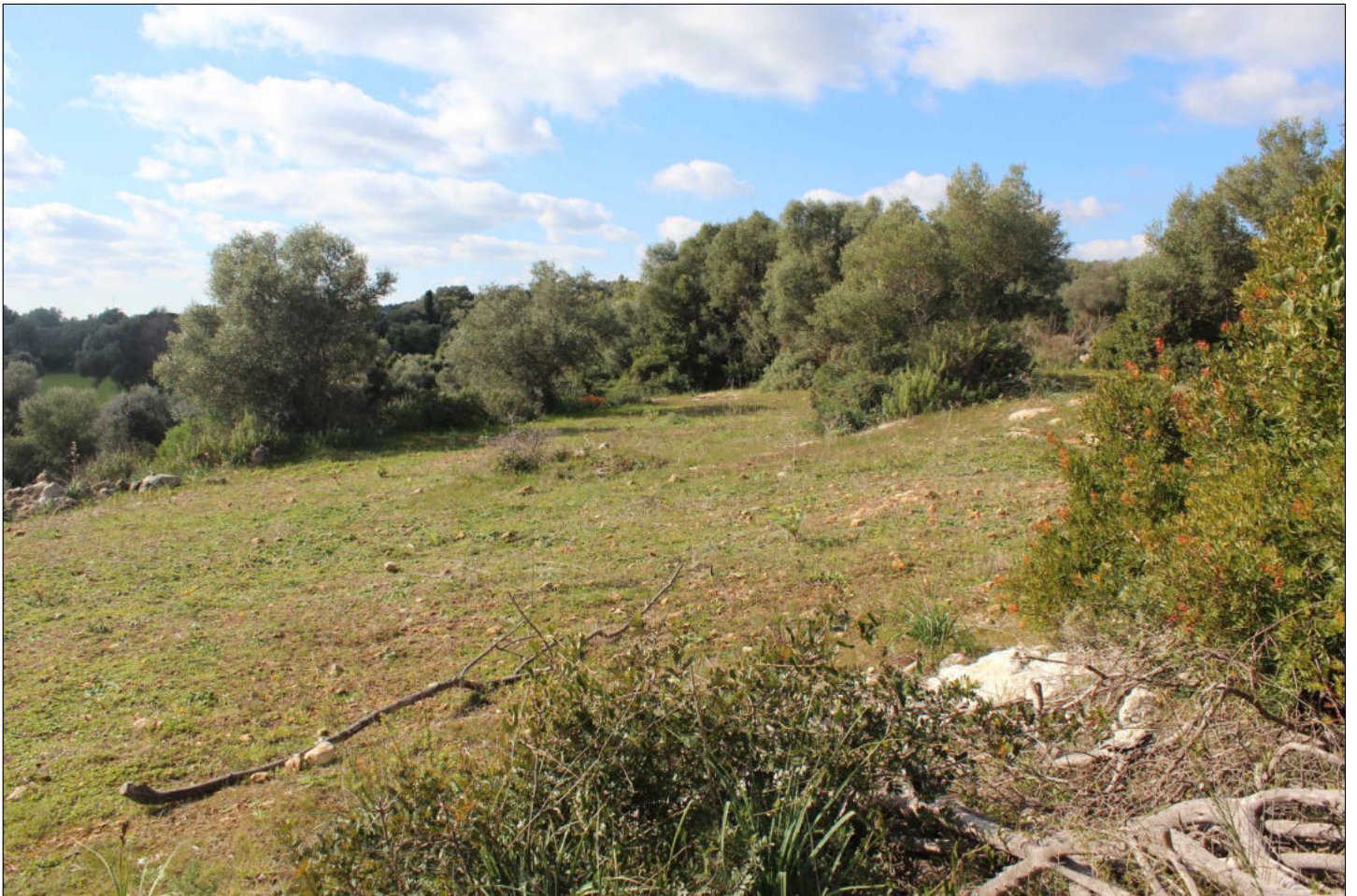
18) Viste sui terreni con la presenza di alberi di ulivi