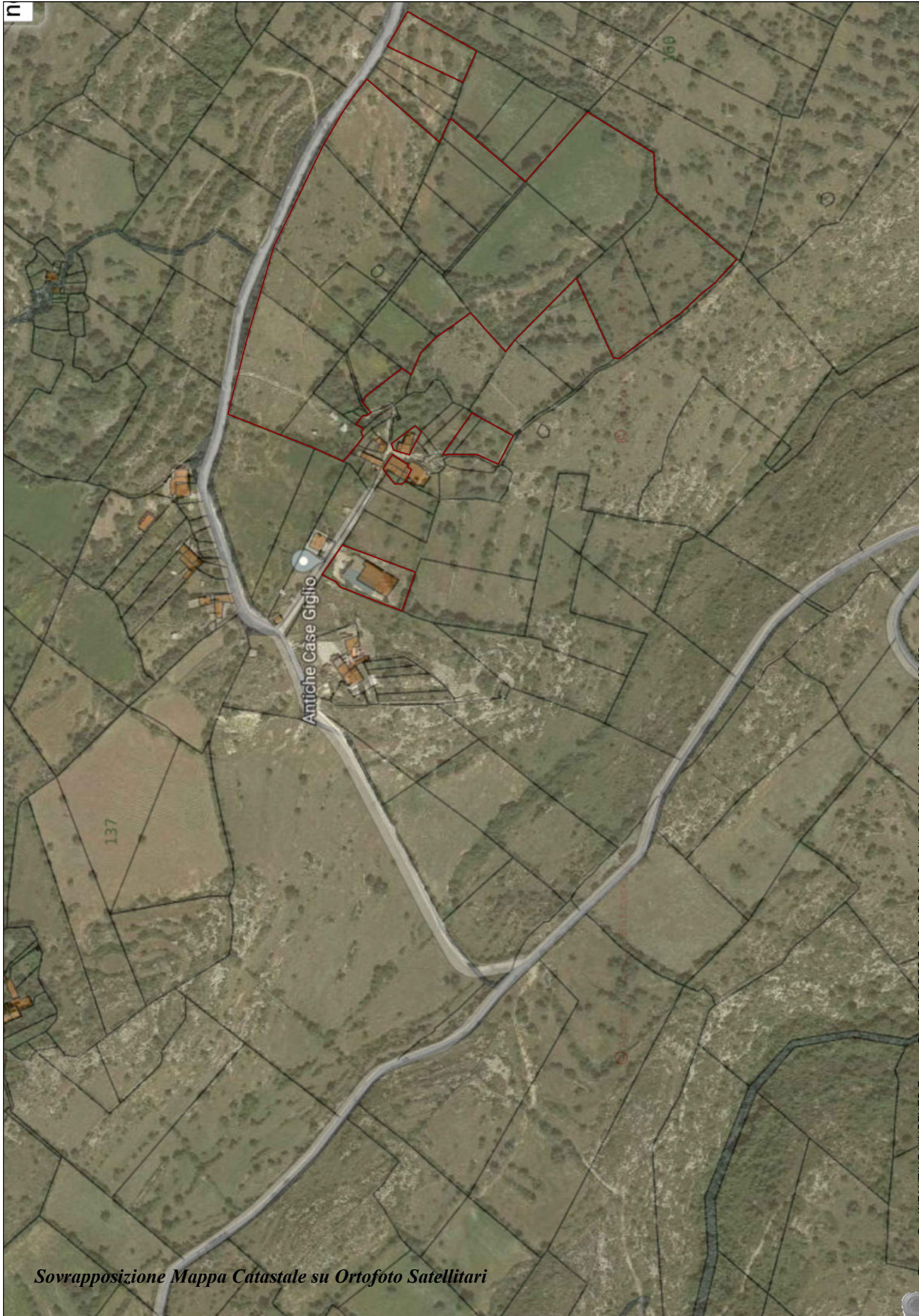
Sovrapposizione Mappa Catastale su Ortofoto Satellitari