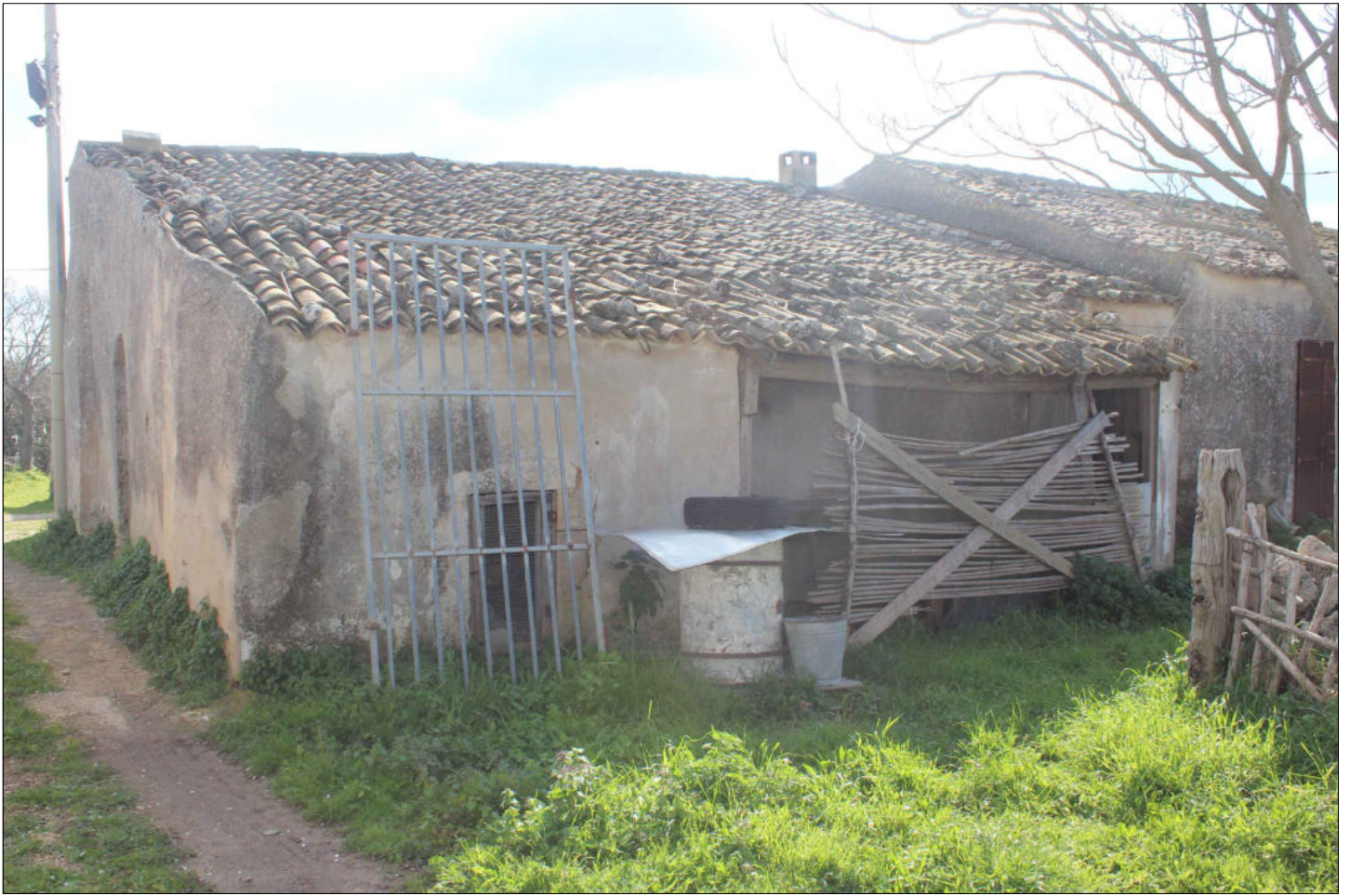
11) Fabbricato rurale (non censito in catasto) Foglio 160 P.lle 35-36-37-106 Angolo Nord-Ovest