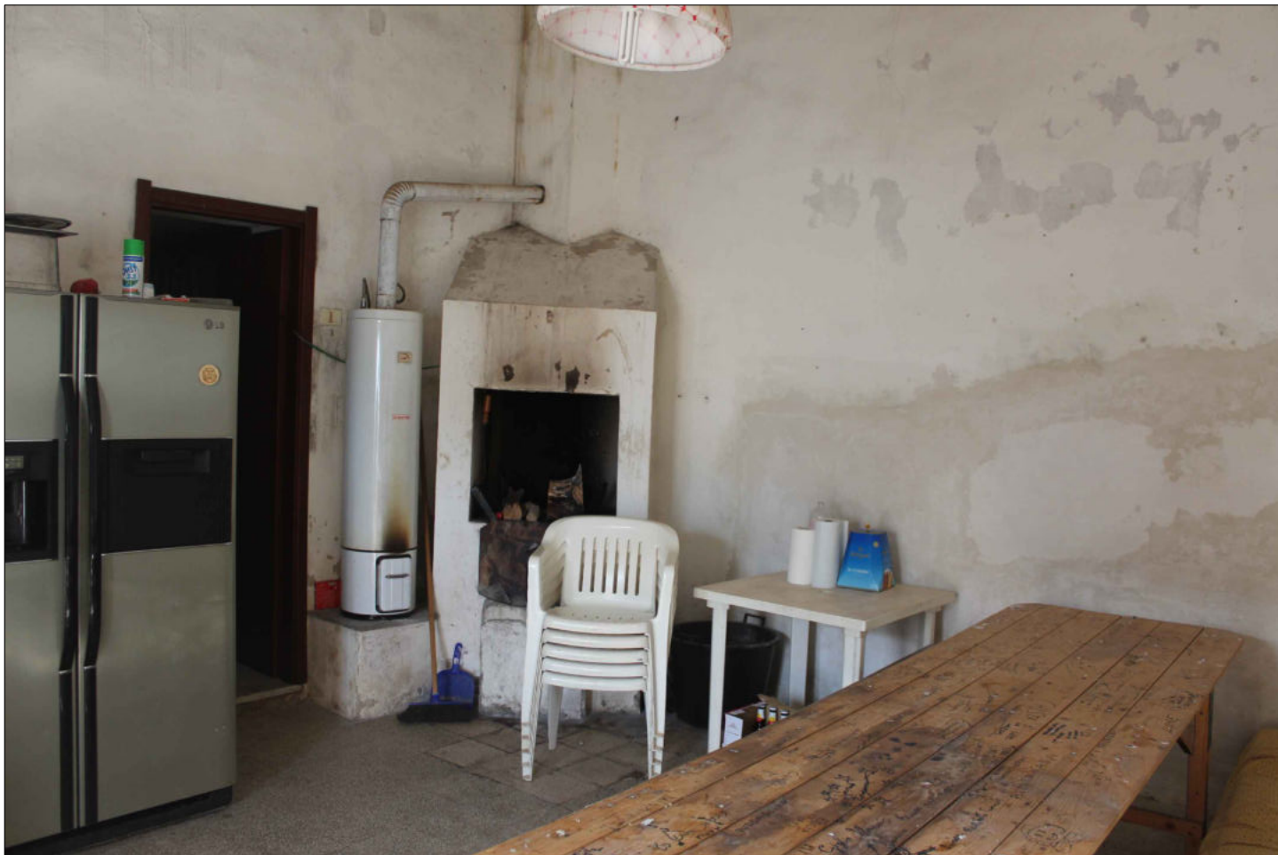
13) Fabbricato rurale (non censito in catasto) Foglio 160 Particella 37