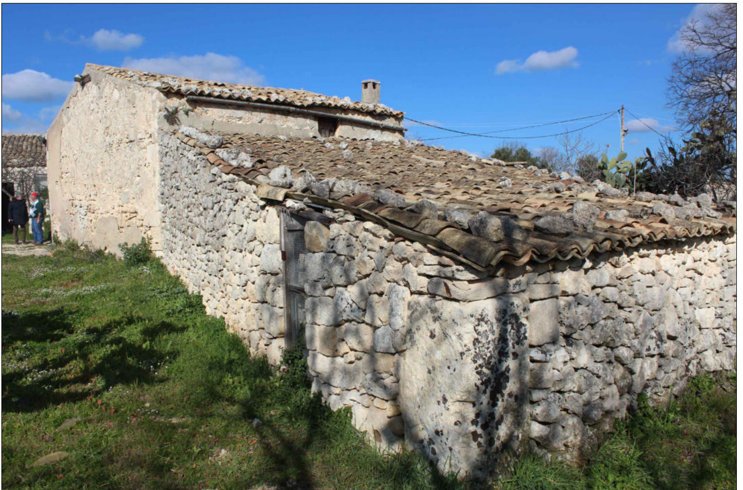
6) Fabbricato (censito D/10) Foglio 160 Particella 137