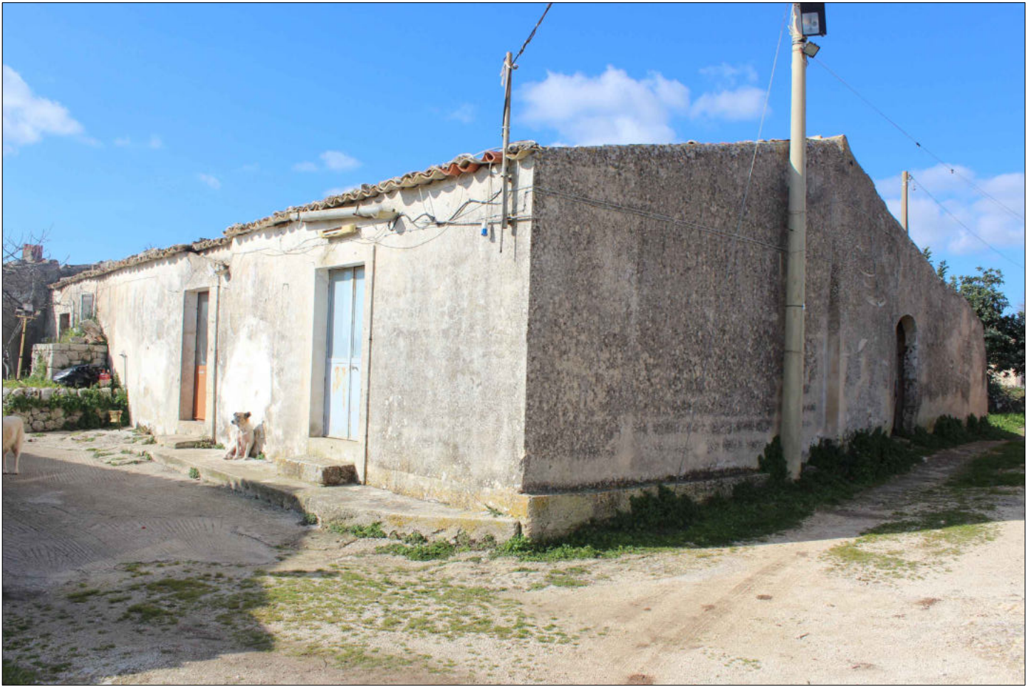
9) Fabbricato rurale (non censito in catasto) Foglio 160 P.lle 35-36-37-106 Angolo Nord-Est