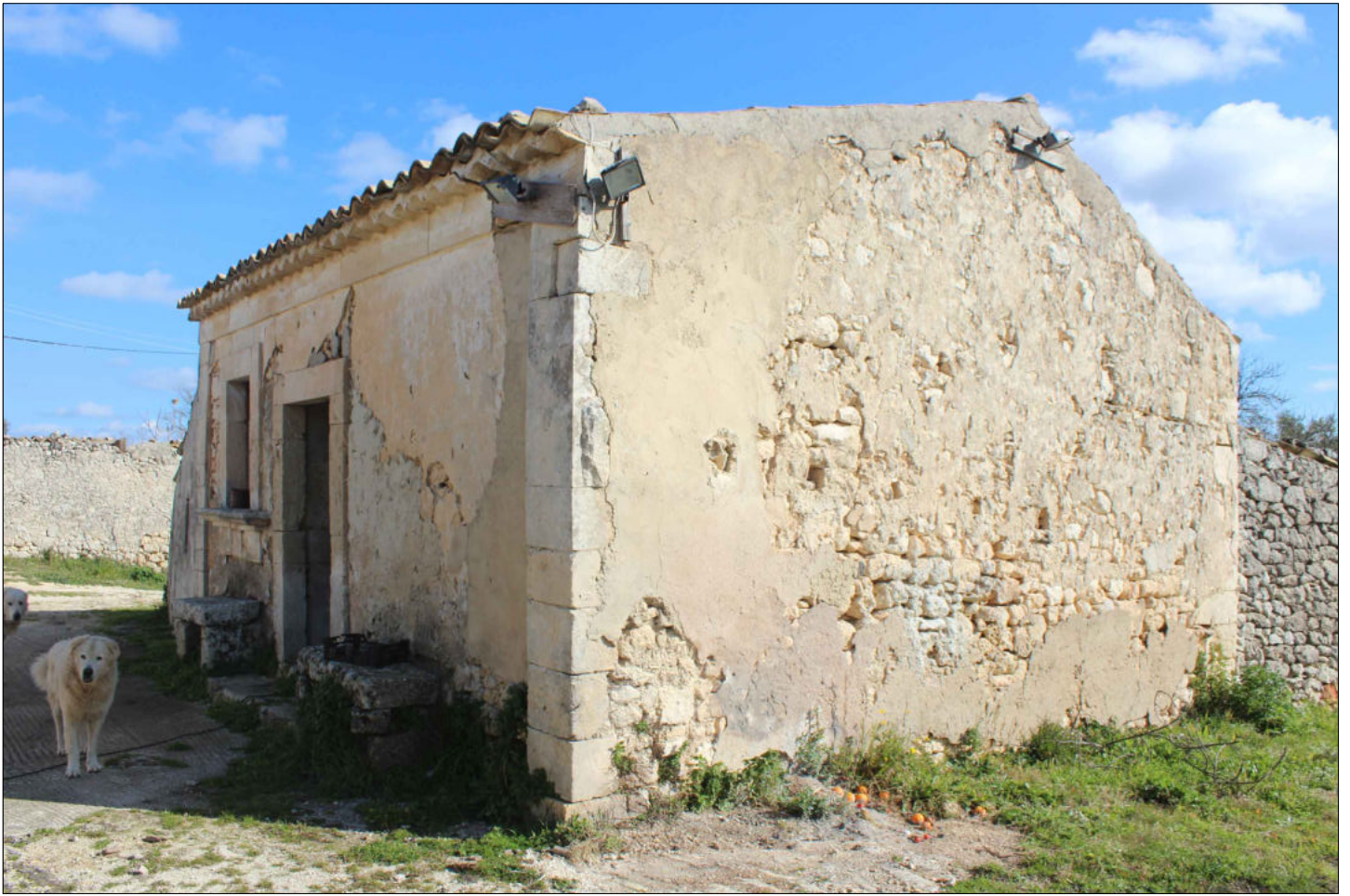
5) Fabbricato (censito D/10) Foglio 160 Particella 137