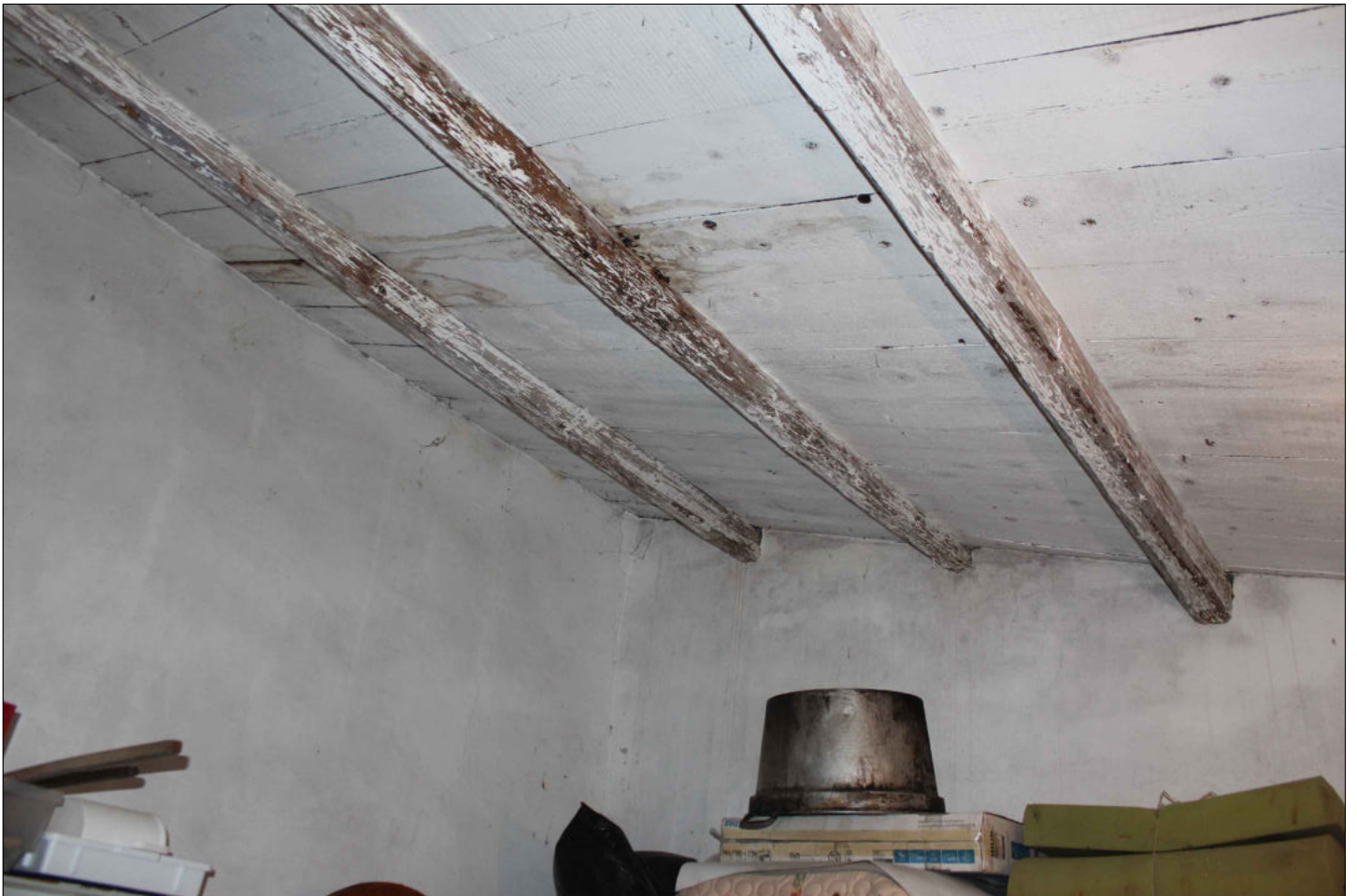
12) Fabbricato rurale (non censito in catasto) Foglio 160 Particella 37