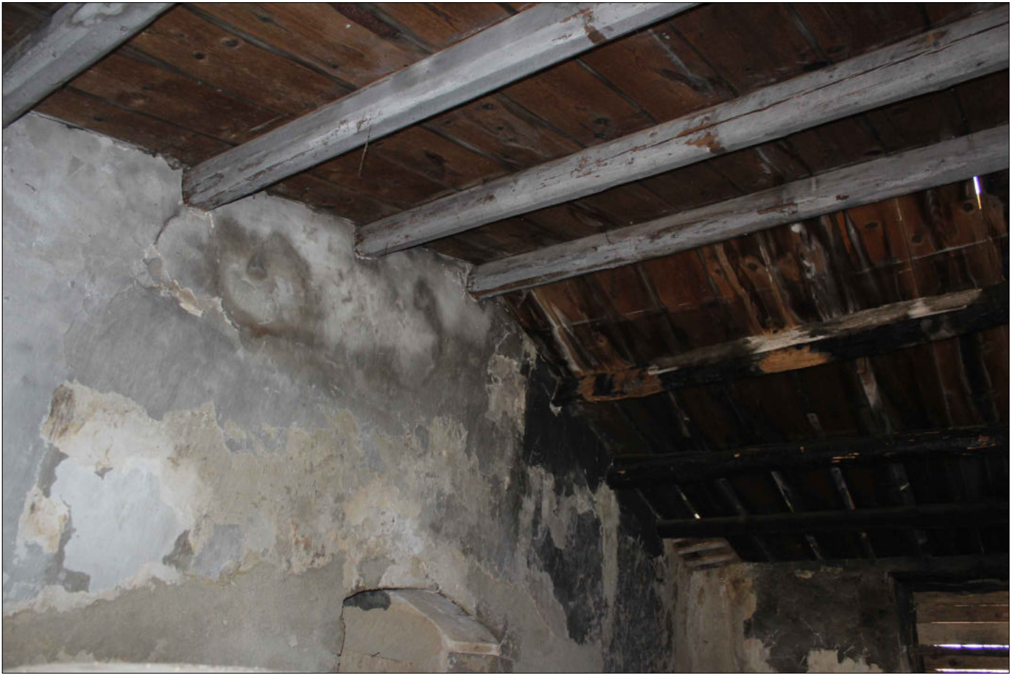
7) Fabbricato (censito D/10) Foglio 160 Particella 137