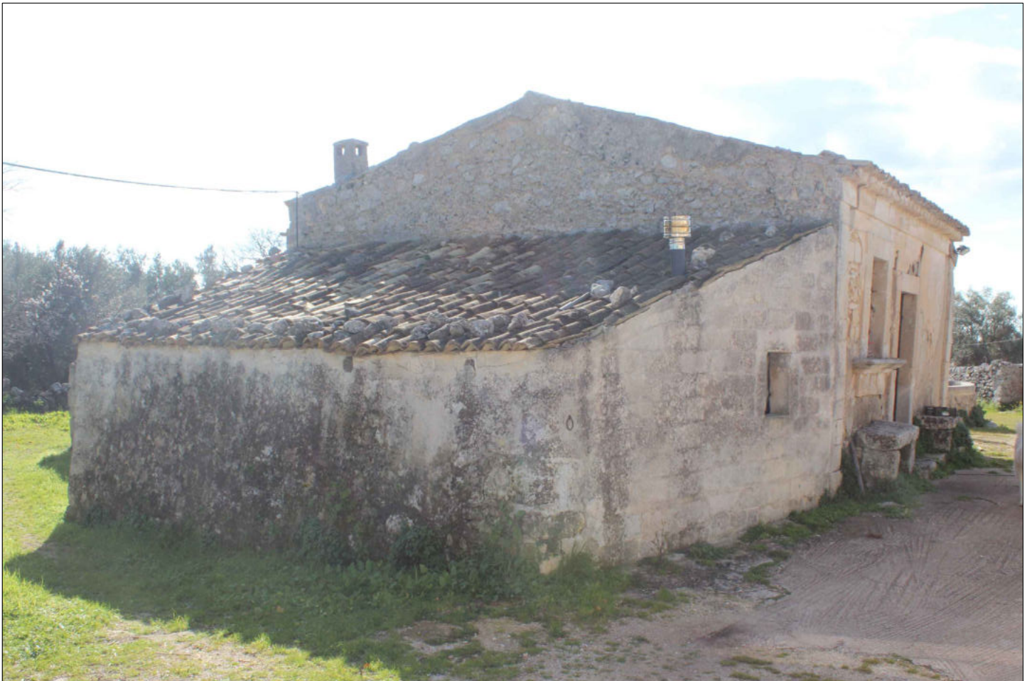
4) Fabbricato (censito D/10)Foglio 160 Particella 137