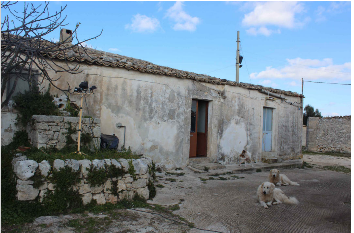
10) Fabbricato rurale (non censito in catasto) Foglio 160 P.lle 35-36-37-106 Lato Est