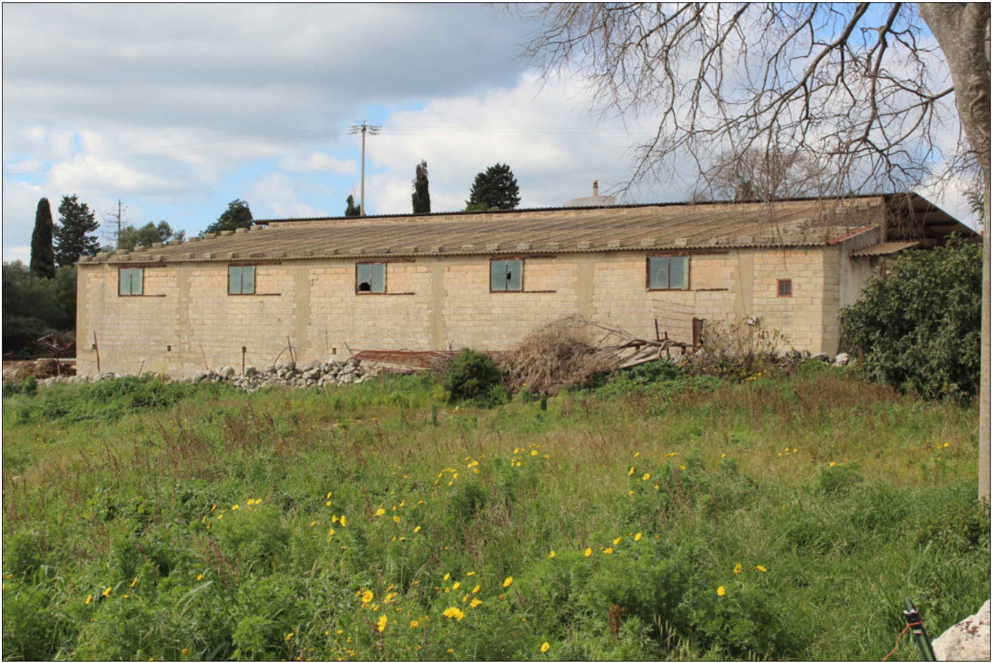
1) Fabbricato rurale adibito a stalla (non censito in catasto) Foglio 160 Particella 136