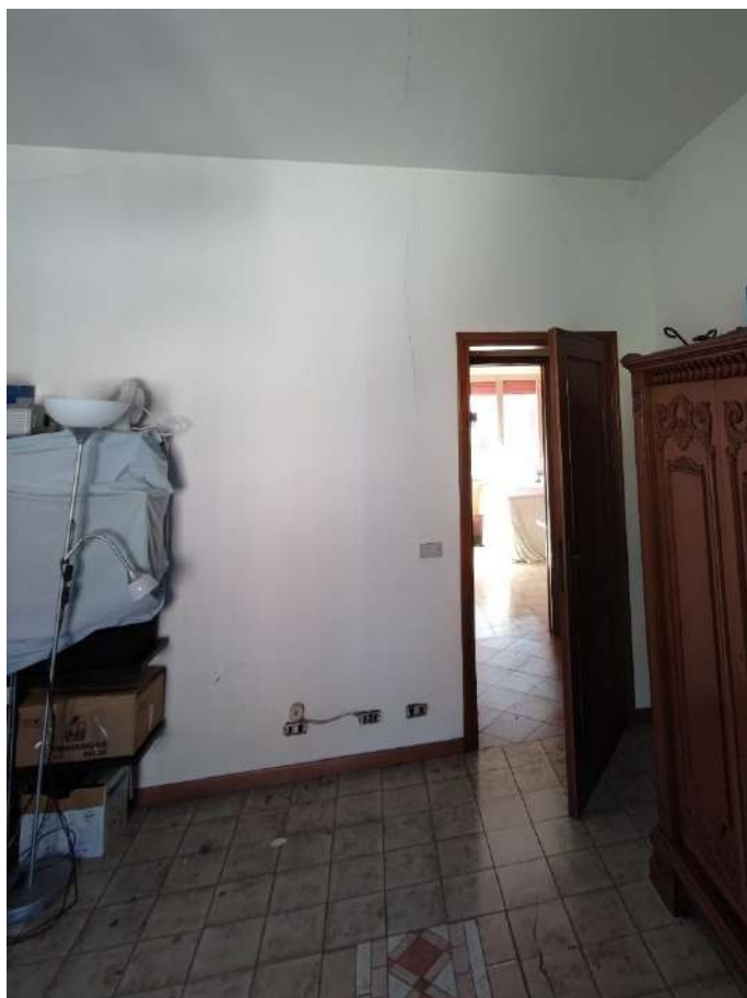
FOTO 15: Camera a nord-ovest (si nota la lesione su pavimento, parete e soffitto)