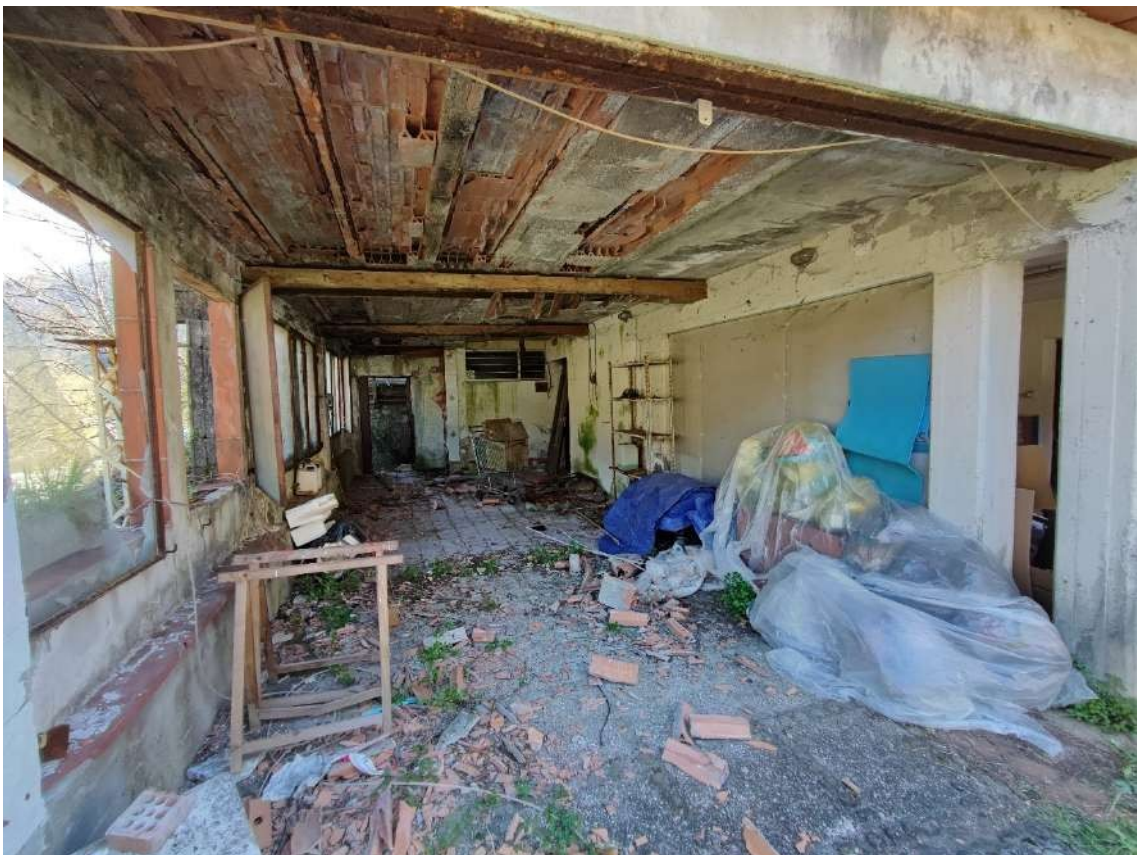
FOTO 28: locale ad uso sgombero a nord sottostante la terrazza del p.t.