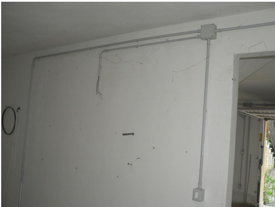
Fotogramma n. 16 Locale al Piano Seminterrato