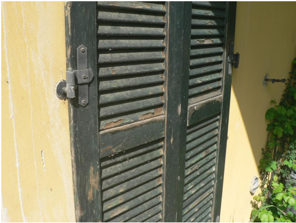
Fotogramma n. 7 Infisso lato Ovest