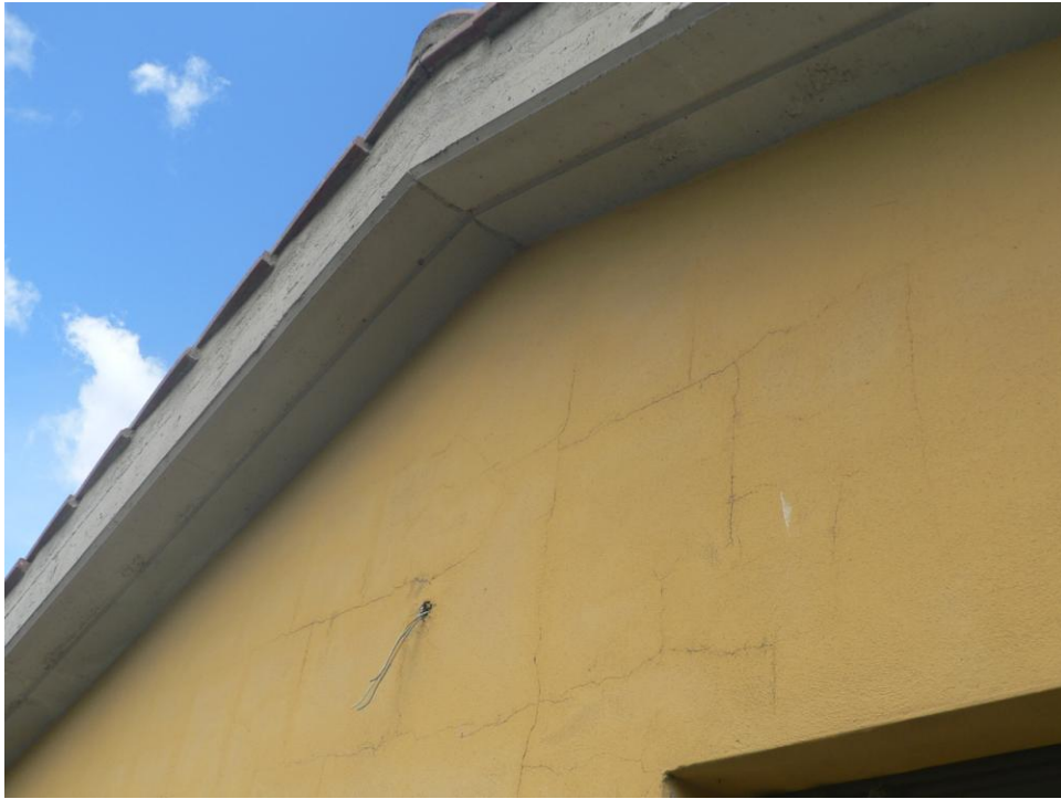
Fotogramma n. 11 Parete lato Sud