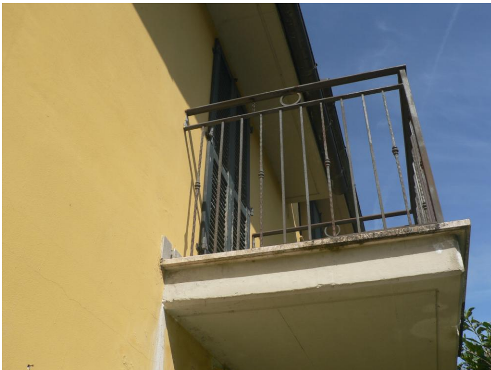
Fotogramma n. 6 Balcone Lato ovest