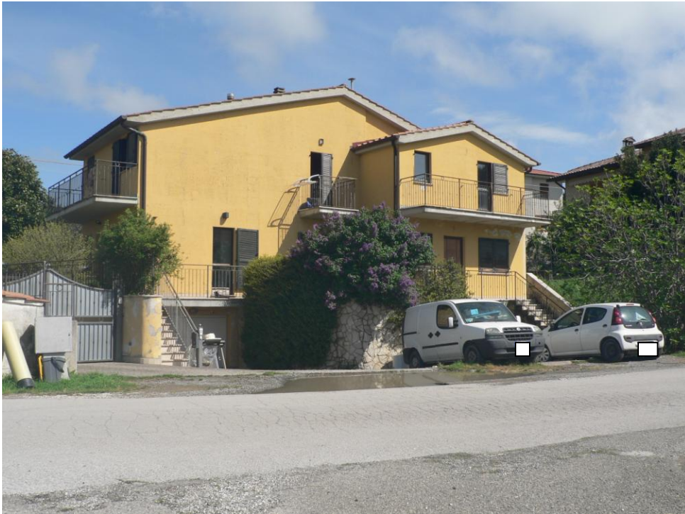
Fotogramma n. 3 Prospetto Lato Sud