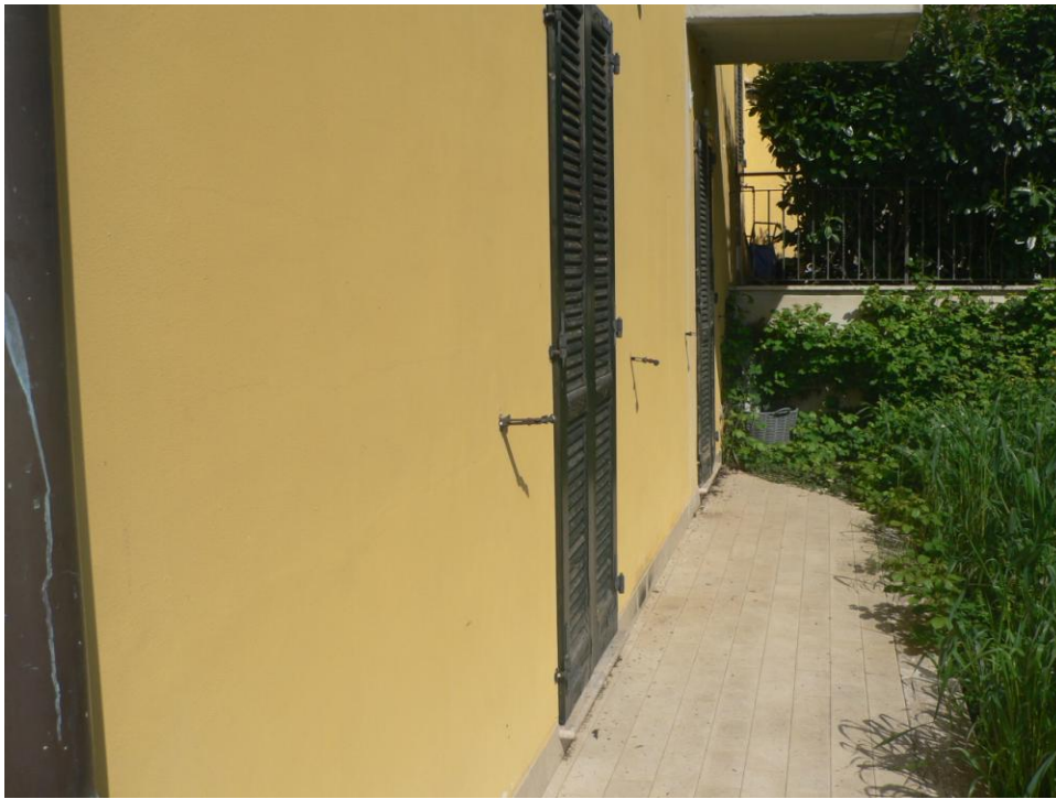
Fotogramma n. 5 Prospetto lato Ovest