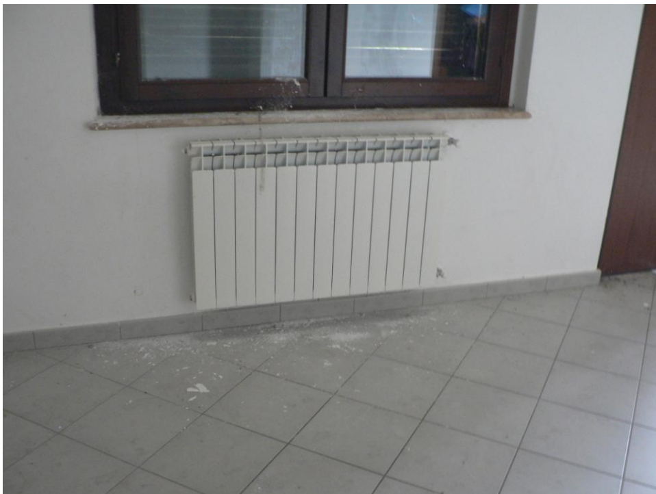
Fotogramma n. 10 Soggiorno