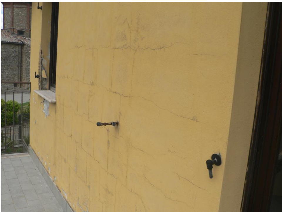
Fotogramma n. 12 Parete lato Sud