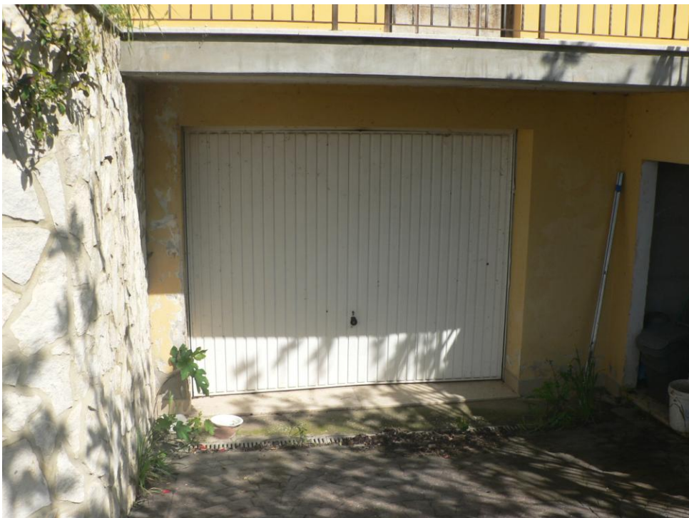
Fotogramma n. 4 Garage lato Sud