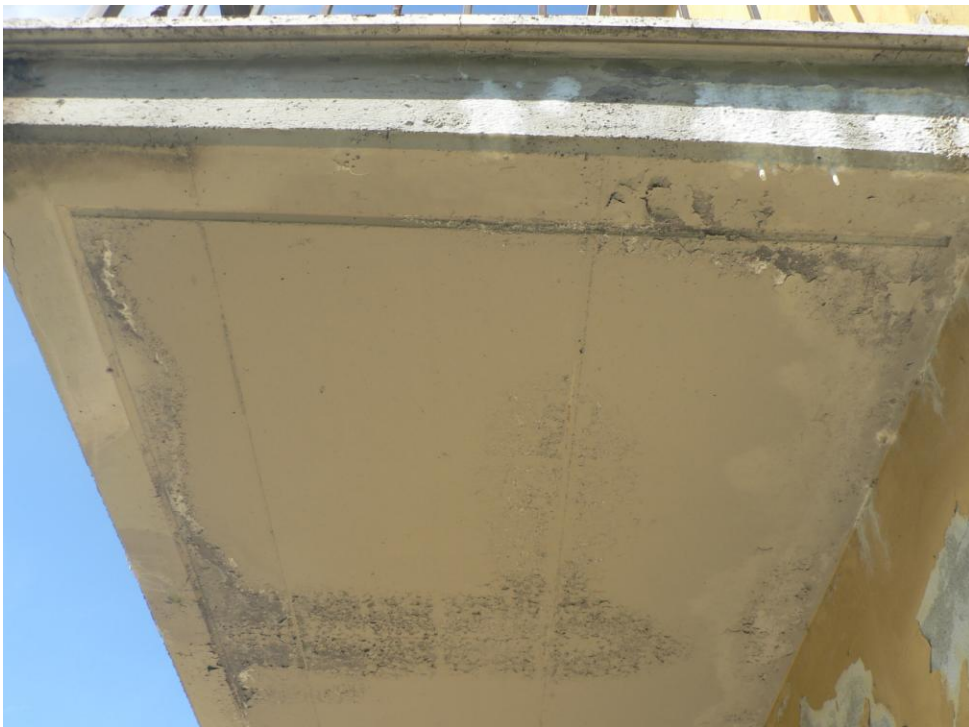
Fotogramma n. 8 Lato inferiore balcone lato Sud