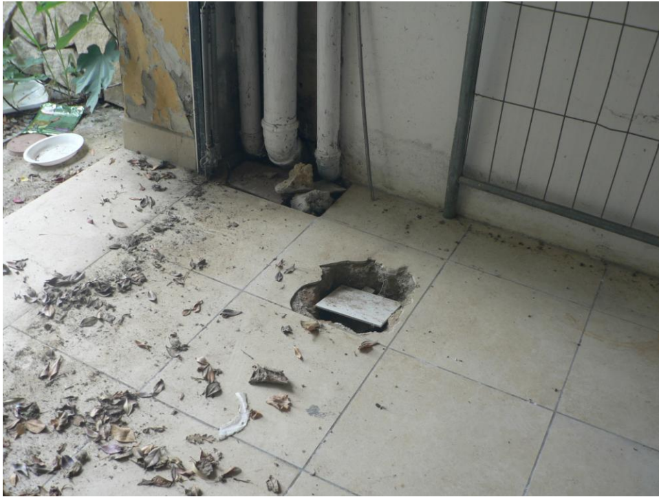
Fotogramma n. 15 Pavimento Garage Piano Seminterrato