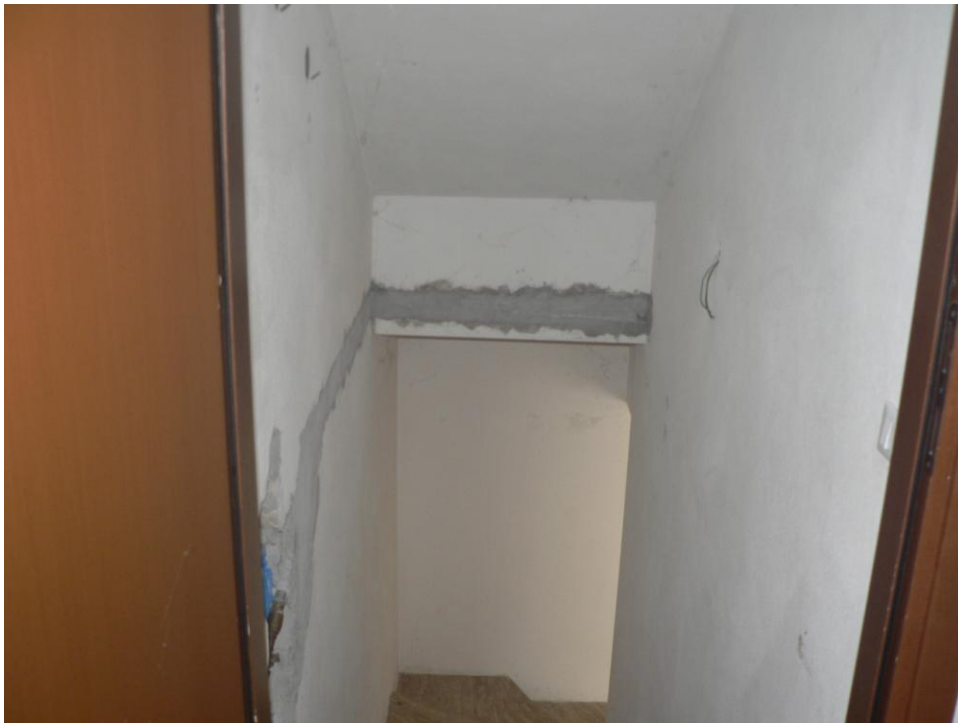
Fotogramma n. 13 Scala di accesso al Piano Seminterrato