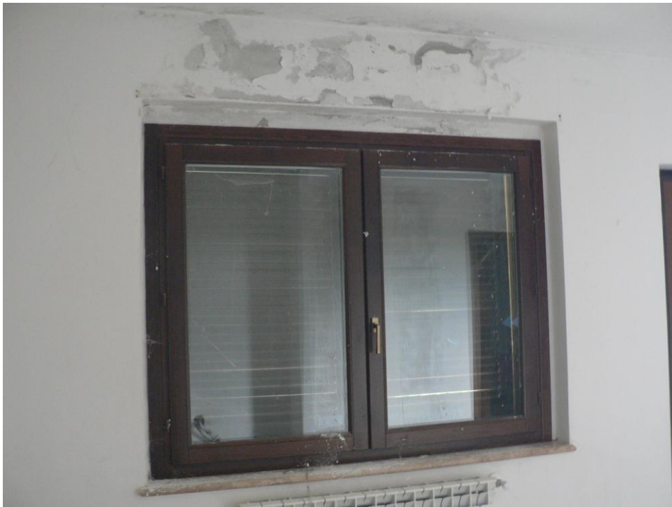
Fotogramma n. 9 Soggiorno