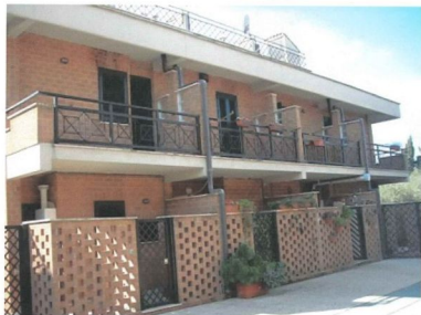
Appartamento in Palazzina Quadrifamiliare a Schiera in Località Mazza Prebenda – Anzio (l'interno 8 è il terzo da sinistra)