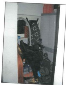
foto 07 - ripostiglio