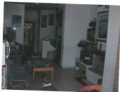
foto 03 - soggiorno con ingresso