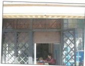
foto 04 - infisso e vetrocemento della cucina visti dal giardino