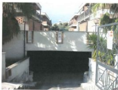
Accesso ai locali nel seminterrato