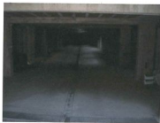
Tunnel distributivo condominiale