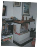
foto 6 - particolare camino nel soggiorno