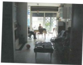
foto 01 - angolo cottura e pranzo visti dal soggiorno