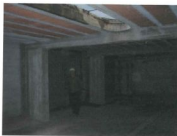
Accesso al box di proprietà dell'esecutato