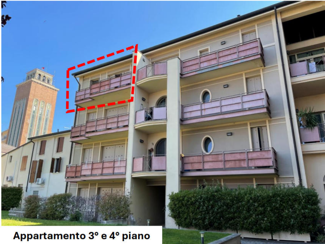
Appartamento 3° e 4° piano