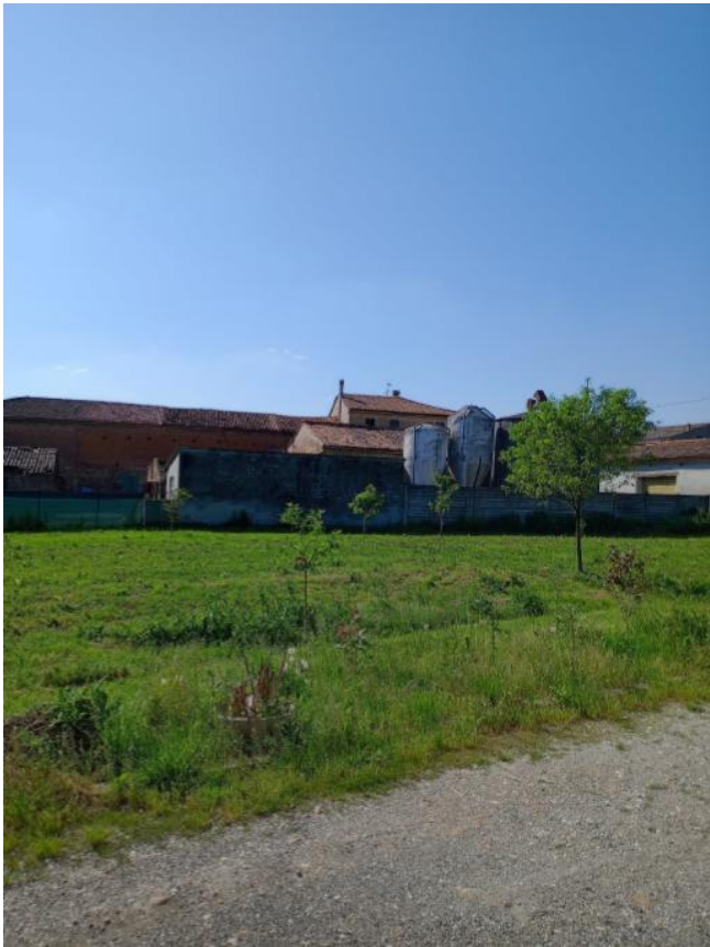
Area Urbana, mapp. 486/504 Immagine dal web, anno 2022