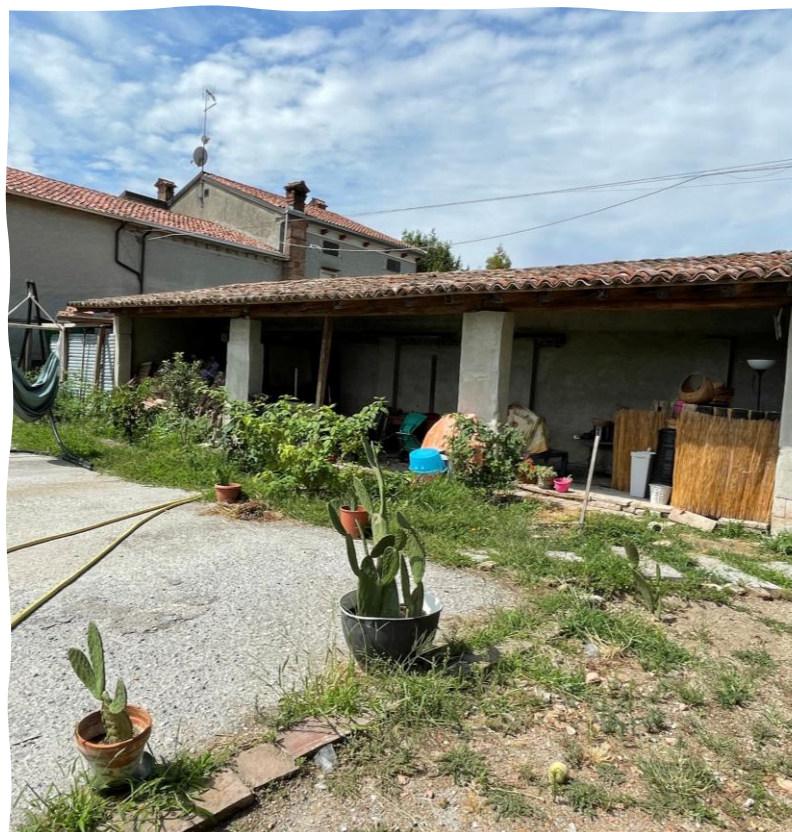
Deposito mapp. 484/507