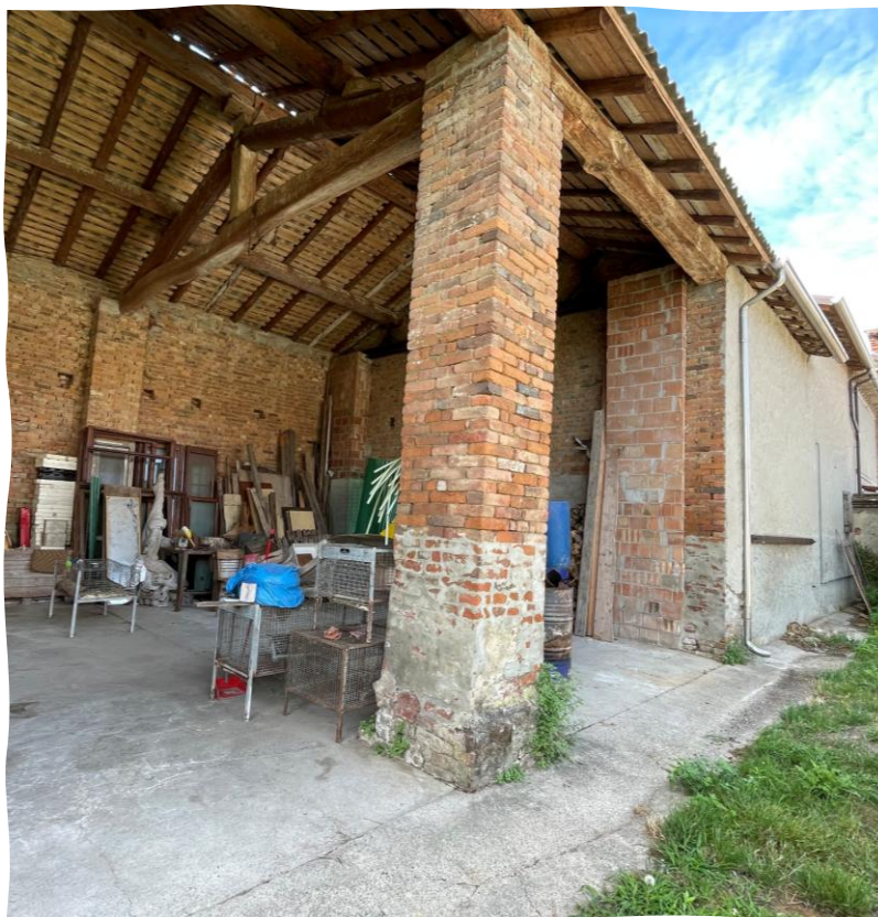
Deposito mapp. 484/508