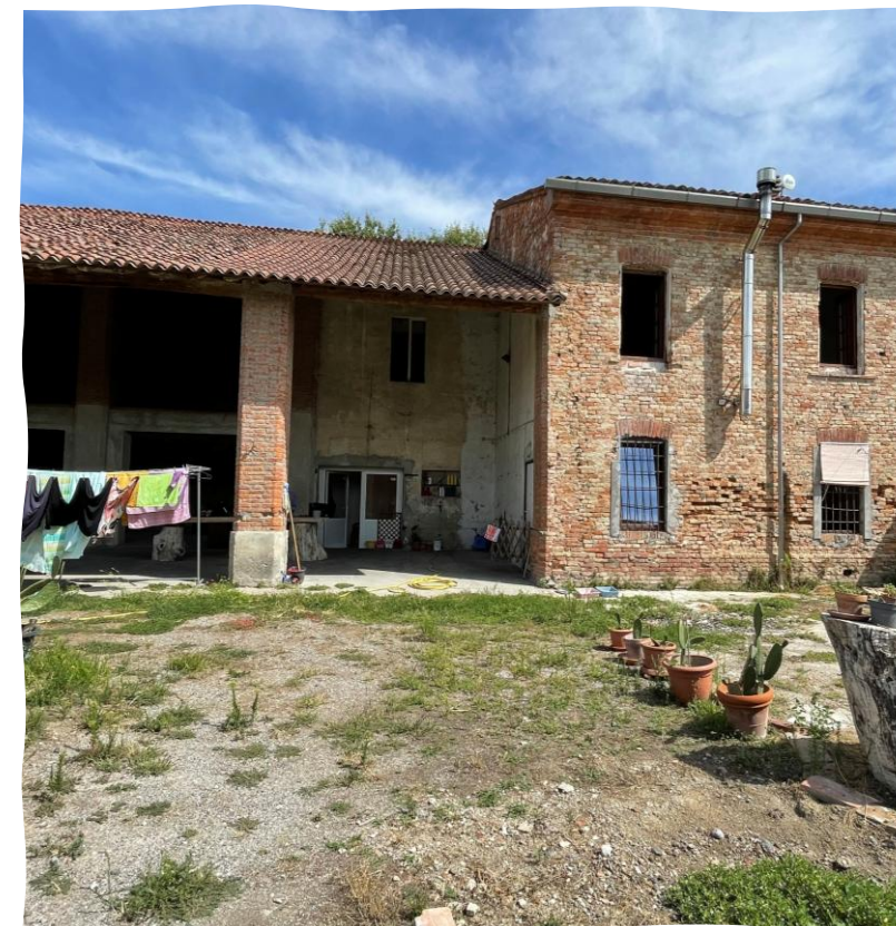
Deposito-Portico mapp. 484/506 e Abitazione mapp. 484/505