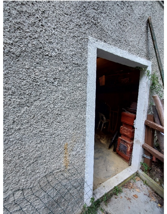
FOTO 21,22,23: ingresso esterno al vano cantina e interno della cantina