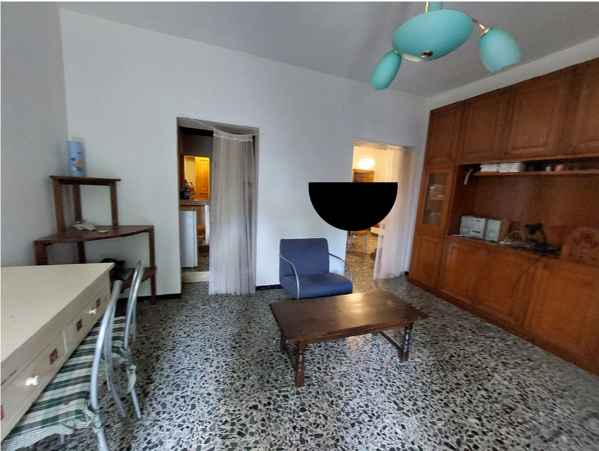
FOTO 8: vano di ingresso – vista verso il disimpegno e verso la cucina