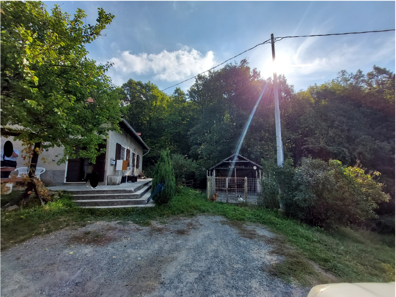
FOTO 1,2: immobile via Cicone civ 5 e 7 (piano terra) – civ. 9 (piano primo)