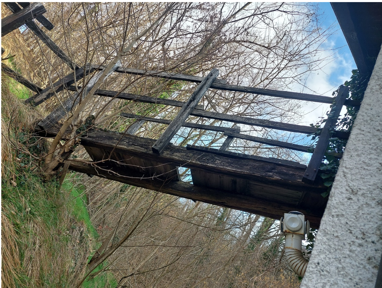
FOTO 37: particolare della passerella pericolante di accesso al sottotetto dall'esterno