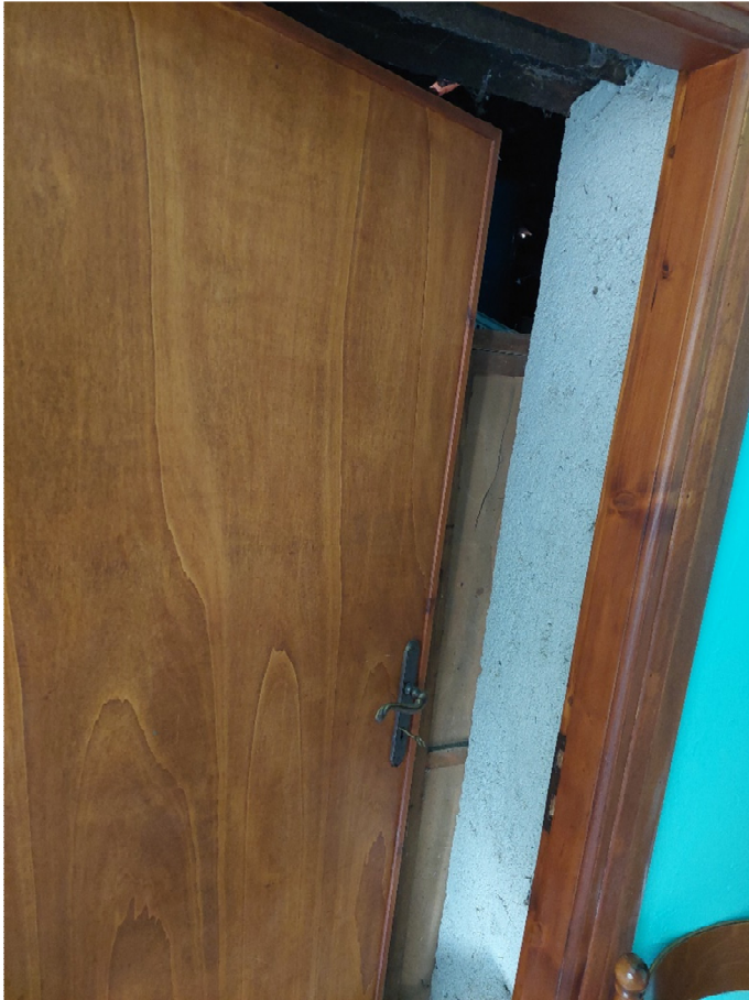
FOTO 35: porta che conduce al sottotetto collegato internamente con il civ. 5-7