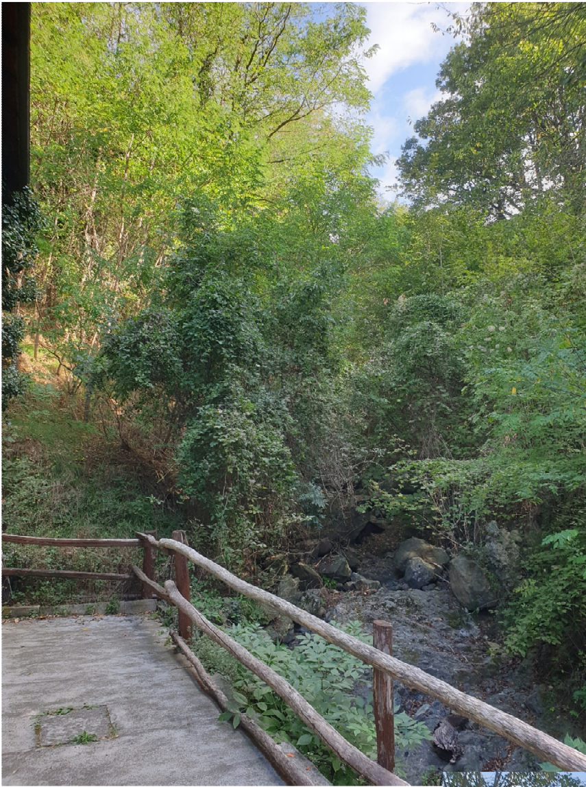
FOTO 43: area prospiciente il prospetto est – vista del Rio Coscia