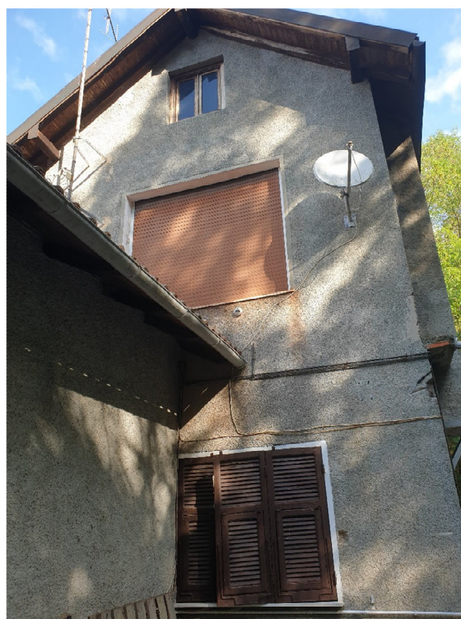
FOTO 42: vista del prospetto sud del corpo di fabbrica con affacci civ. 9