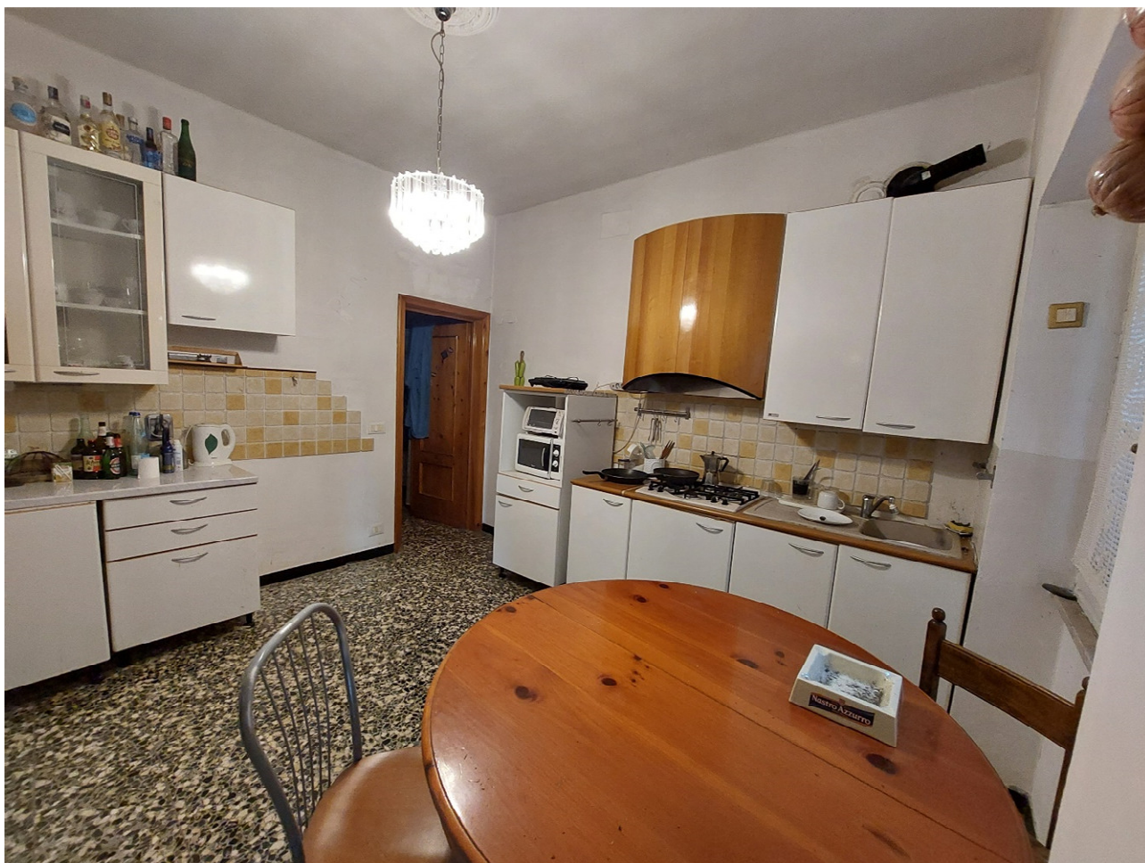
FOTO 10: cucina – vista verso la porta che conduce alla camera da letto