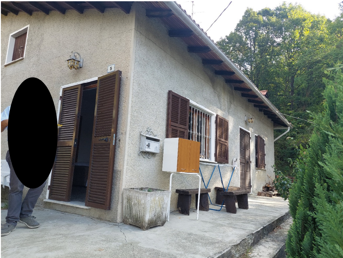
FOTO 3,4: immobile via Cicone civ 5 e 7 (piano terra) – civ. 9 (piano primo)