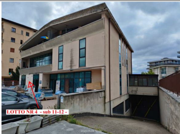
Prospetto intero edificio lungo via C. Renzi