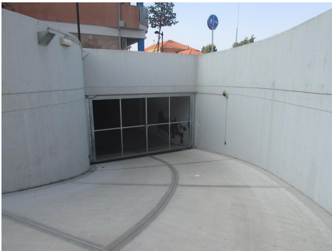
Ingresso comune garages