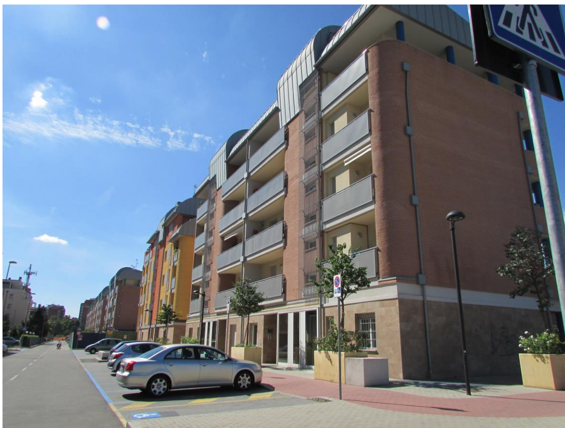
Edifici sopra garages