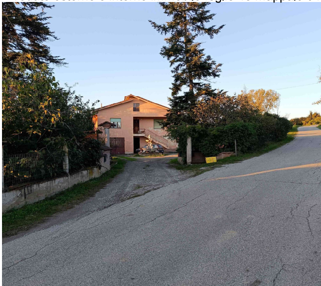
Vedute esterne e interne immobile foglio 46 mappale 340 subalterno 2

https://www.google.it/maps/@44.5323255,7.9752495,478m/data=!3m1!1e3?entry=ttu&g_ep=EgoyMDI0MTEwOC4wIjKXMDS0oASAFQAw%3D%3D