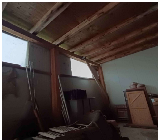
Vedute esterne e interne immobile foglio 46 mappale 363 subalterno 1