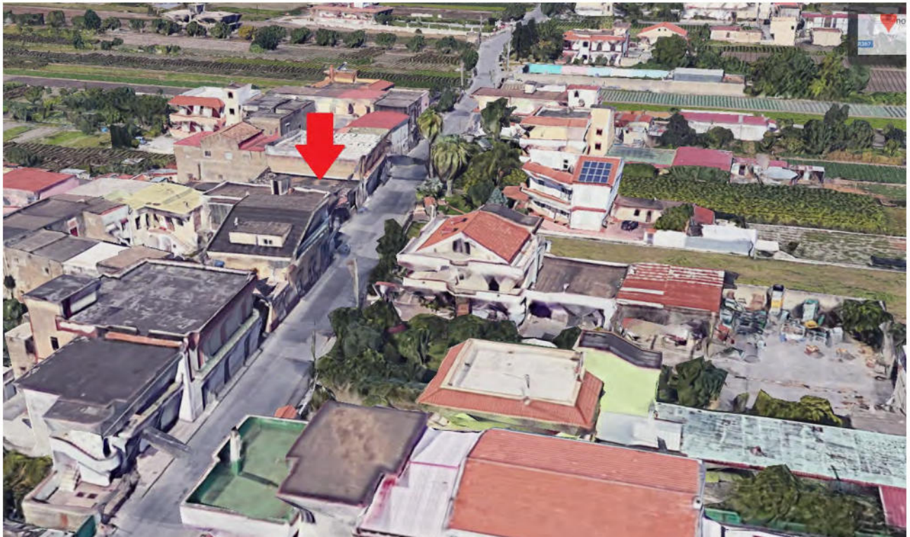
FOTO N° 02: Lotto Unico - Via Nuova Lavorate n° 16 - Fraz. Lavorate 84087 Sarno (SA)