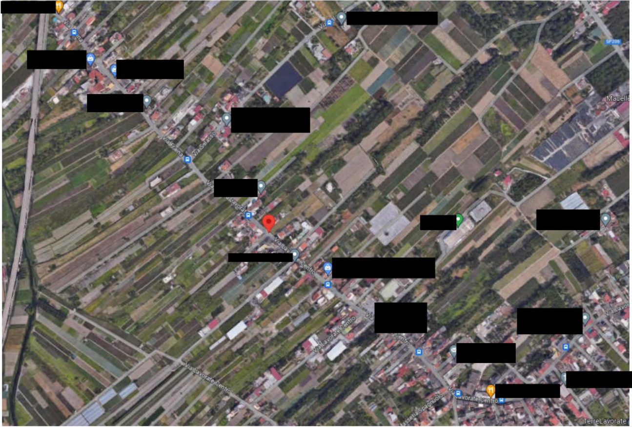
FOTO N° 01: Lotto Unico - Inquadramento Territoriale - 40°47'24.2"N 14°38'13.0"E