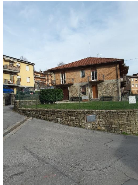
Vista della proprietà delimitata dalle due strade (via dell'Orto via del Faggio) per mezzo di un muro in muratura e sasso a vista, di varia altezza poichè segue l'andamento naturale del terreno, e sovrastante rete metallica plastificata sorretta da paletti in ferro