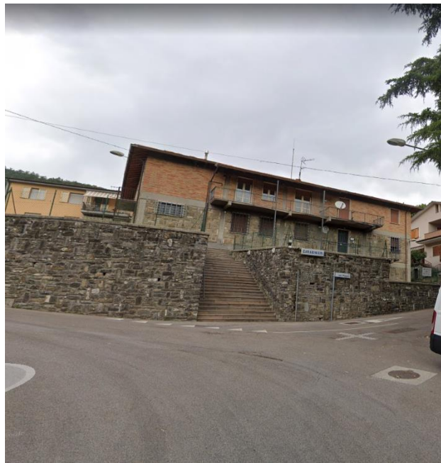
Vista esterna del fabbricato che comprende le porzioni immobiliari pignorate