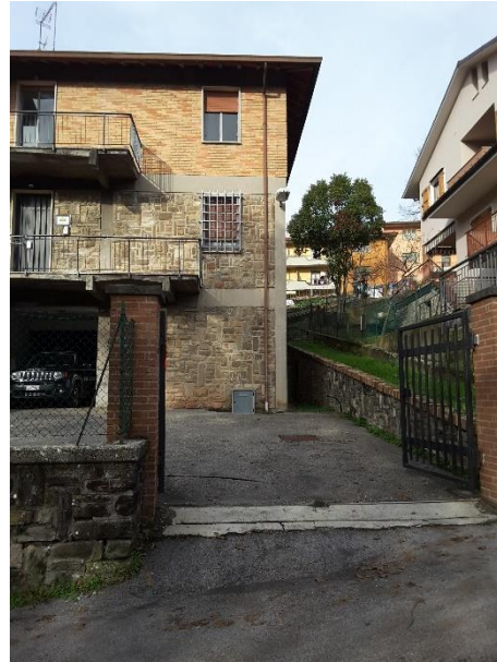
Vista su via Del Faggio della recinzione, interrotta da un cancello in ferro a due ante posto a filo della recinzione e sorretto da due colonne in mattoni faccia vista