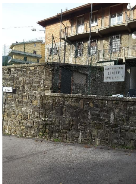
Vista esterna dell'immobile, le facciate sono in parte rivestite in pietra/sasso al piano terra e primo sottostrada ed in parte in muratura faccia vista ai piani superiori