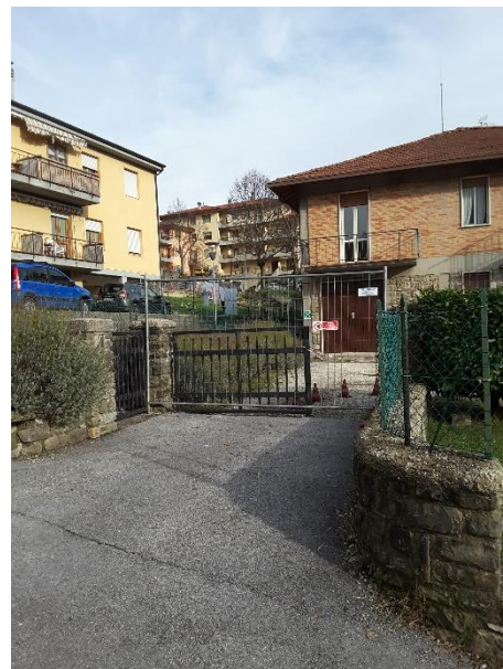
Vista su via dell'Orto della recinzione interrotta da un cancello carrabile e uno pedonale entrambi in profilati metallici e arretrati alla recinzione (verso l'area cortilizia di proprietà)