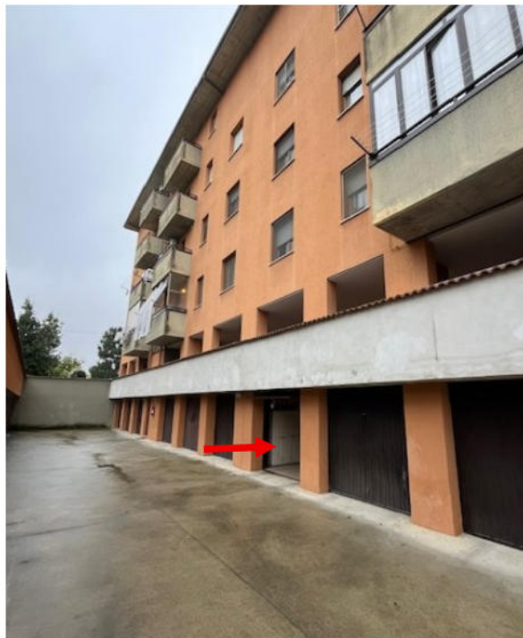
Vista corte comune con ingresso al box