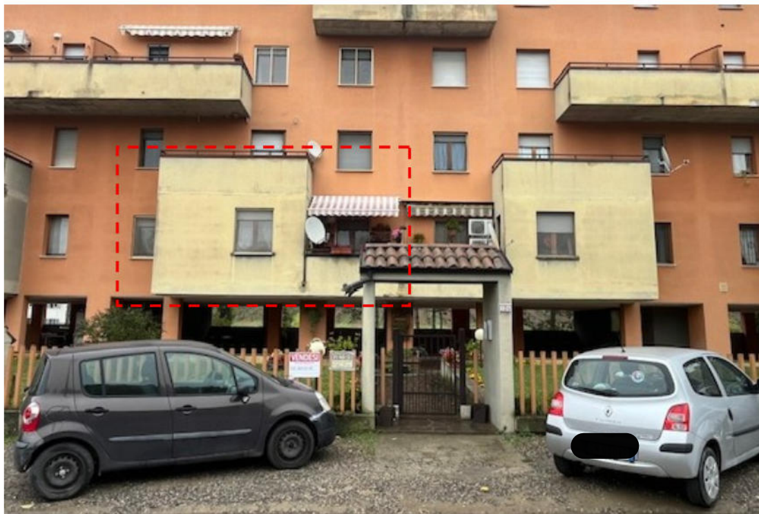
Vista prospetto su via Vigorelli (con rettangolo rosso si indica l'appartamento in oggetto)