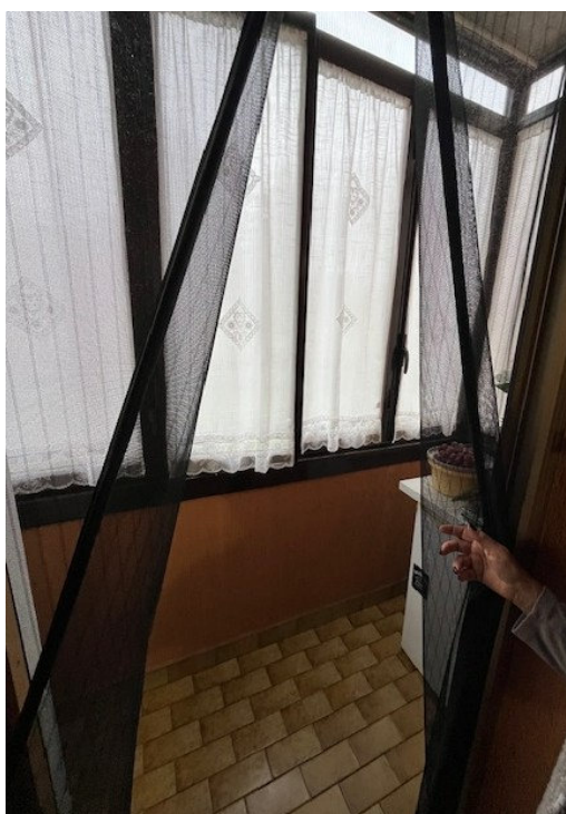
Balcone annesso alla cucina (est)