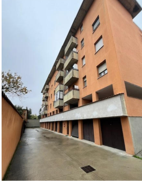
Vista prospetto est

Viale A. Necchi 4 27100 Pavia e-mail nverdi2@gmail.com pec mail: nicola.verdi@ingpec.eu P.IVA 01806320188 Iscritto all'Albo degli Ingegneri della Provincia di Pavia al n. 1981