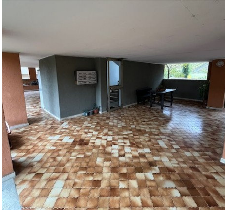
Portico comune di accesso al piano terra