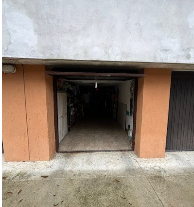
Vista del box

Viale A. Necchi 4 27100 Pavia e-mail nverdi2@gmail.com pec mail: nicola.verdi@ingpec.eu P.IVA 01806320188 Iscritto all'Albo degli Ingegneri della Provincia di Pavia al n. 1981