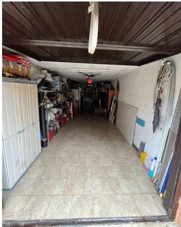
Vista del box