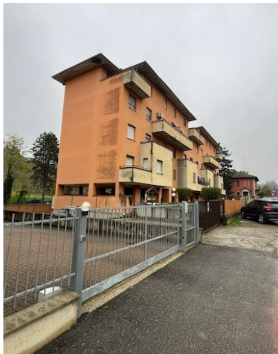
Vista prospetto nord