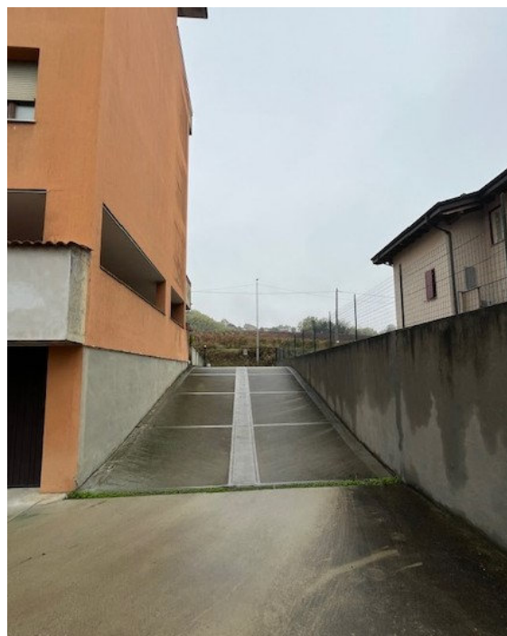
Vista rampa carraia