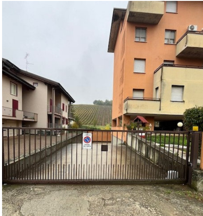
Vista ingresso carraio da via Vigorelli

Viale A. Necchi 4 27100 Pavia e-mail nverdi2@gmail.com pec mail: nicola.verdi@ingpec.eu P.IVA 01806320188 Iscritto all'Albo degli Ingegneri della Provincia di Pavia al n. 1981