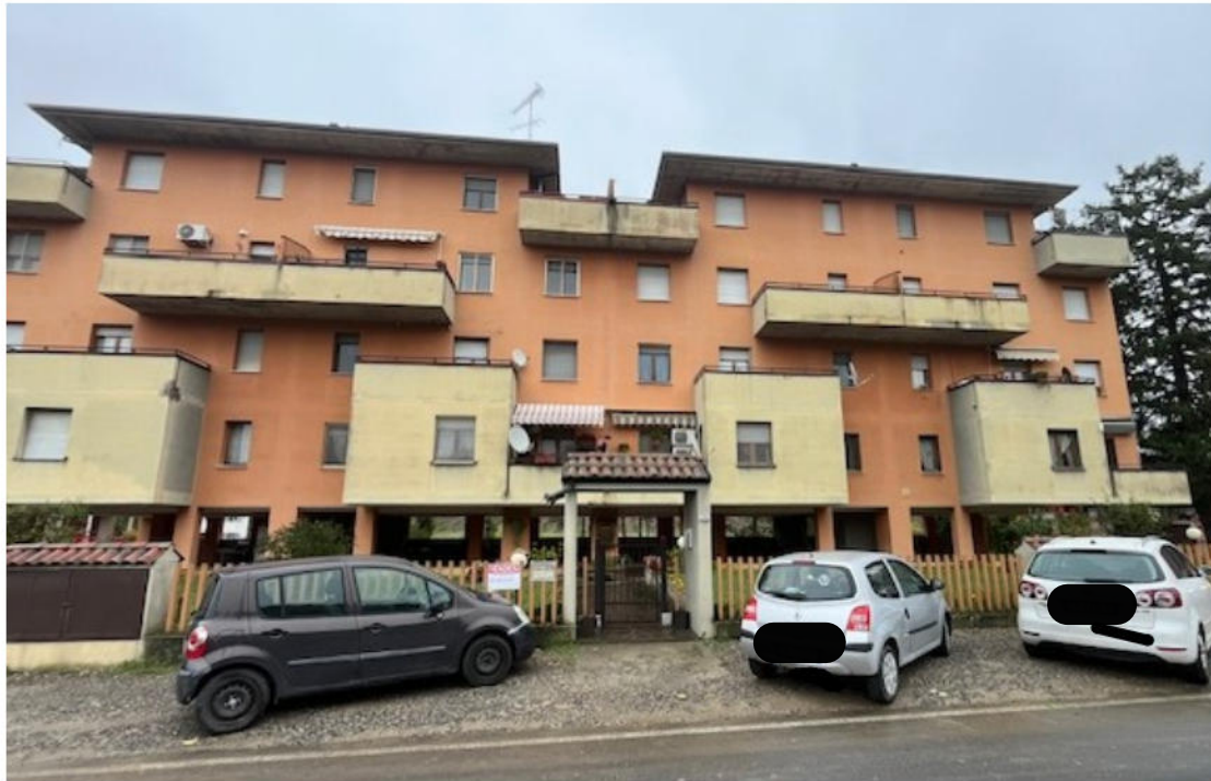
Vista prospetto su via Vigorelli