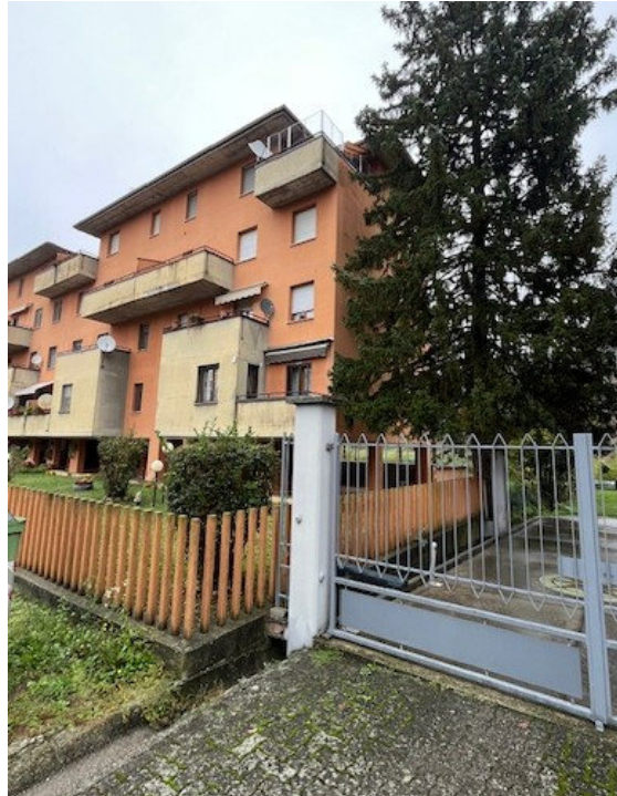
Vista prospetto sud

Viale A. Necchi 4 27100 Pavia e-mail nverdi2@gmail.com pec mail: nicola.verdi@ingpec.eu P.IVA 01806320188 Iscritto all'Albo degli Ingegneri della Provincia di Pavia al n. 1981