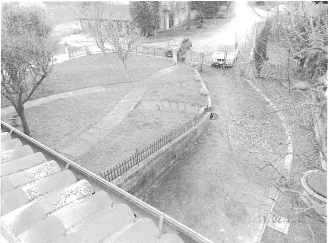
Vista dello scoperto pertinenziale comprendente anche altri mappali non pignorati PAG. 9