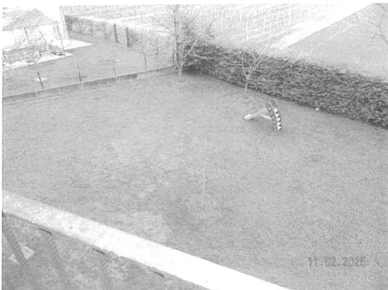
Vista dello scoperto pertinenziale comprendente anche altri mappali non pignorati