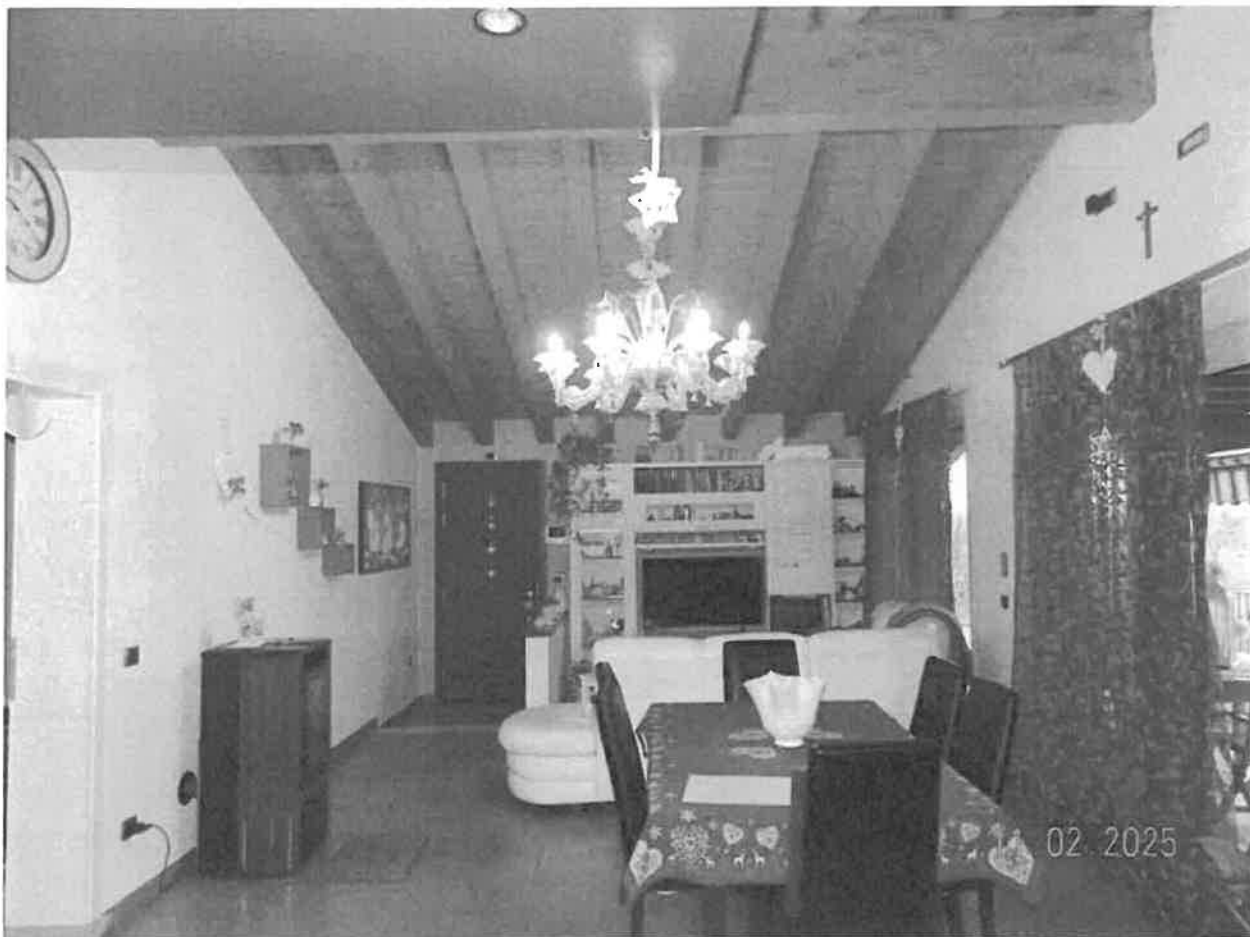
Zona giorno - Vista verso la zona ingresso