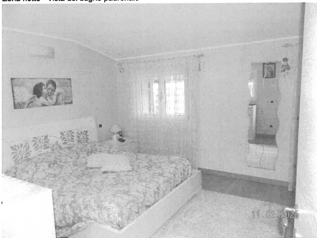
Zona notte - Vista della camera matrimoniale