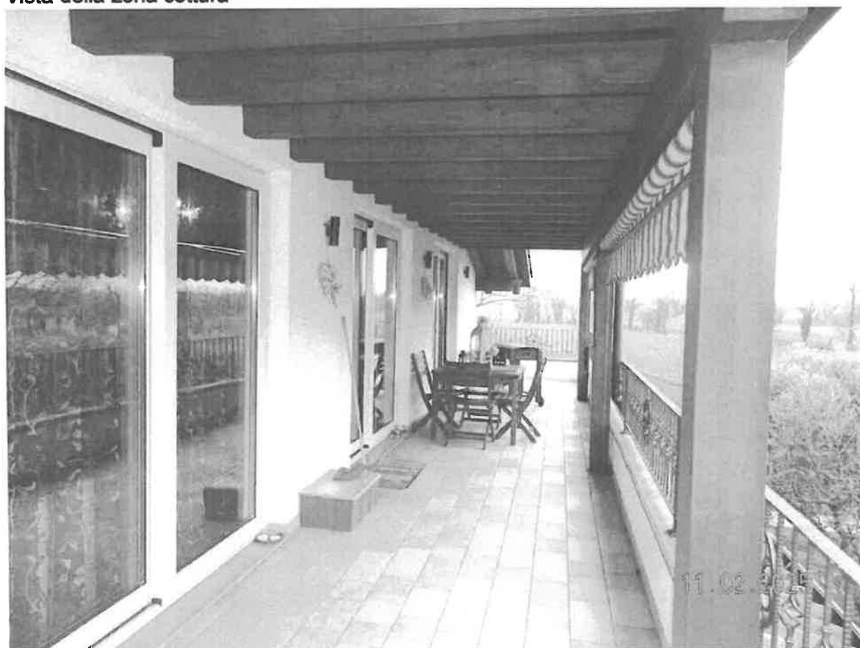
Vista della terrazza parzialmente coperta - antistante la zona giorno