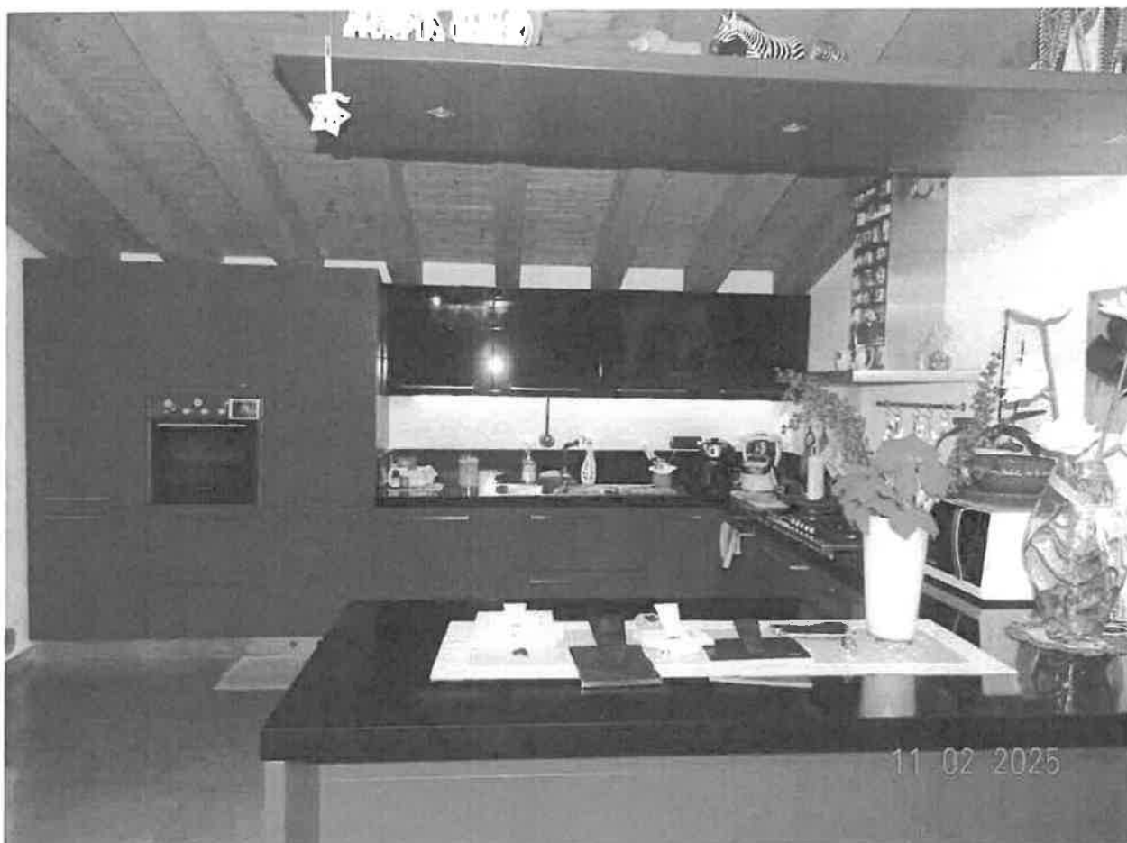
Vista della zona cottura