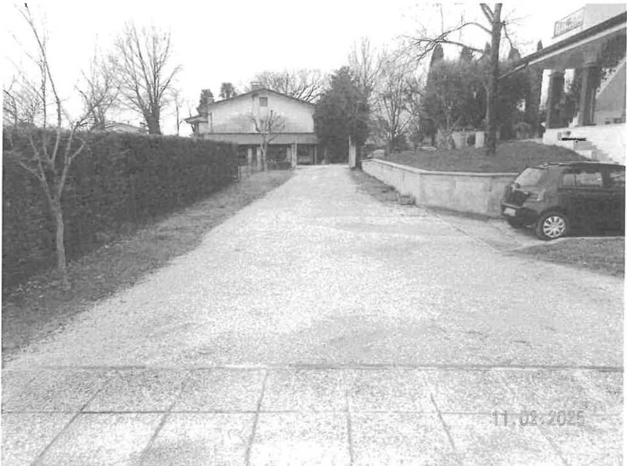
Vista dello scoperto pertinenziale comprendente anche altri mappali non pignorati