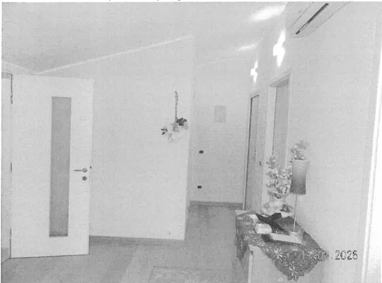
Zona notte - Vista del disimpegno