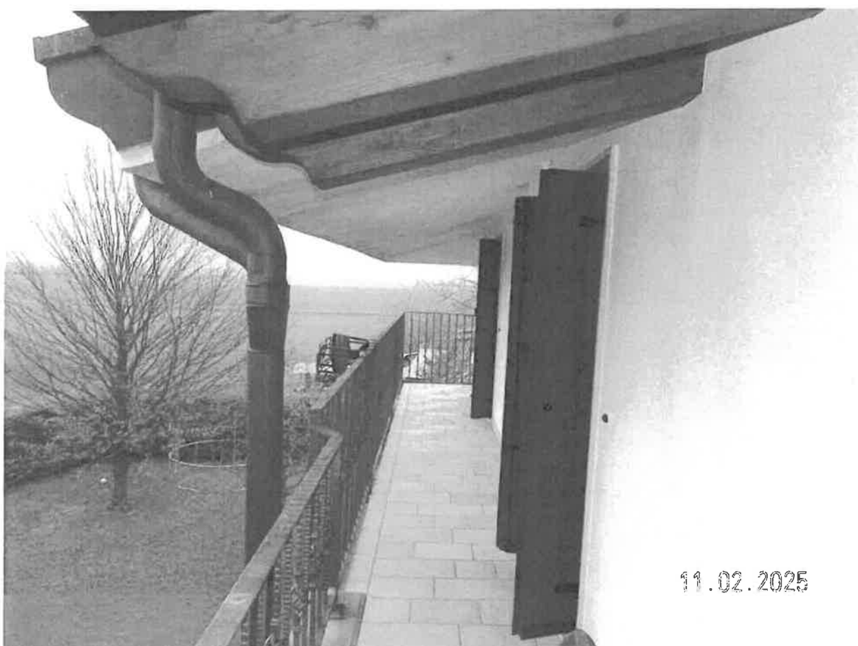
Zona notte - Vista del poggiolo antistante la camera e il locale ripostiglio adibito a camera