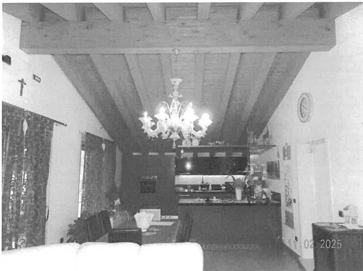
Zona giorno - Vista verso la zona cottura