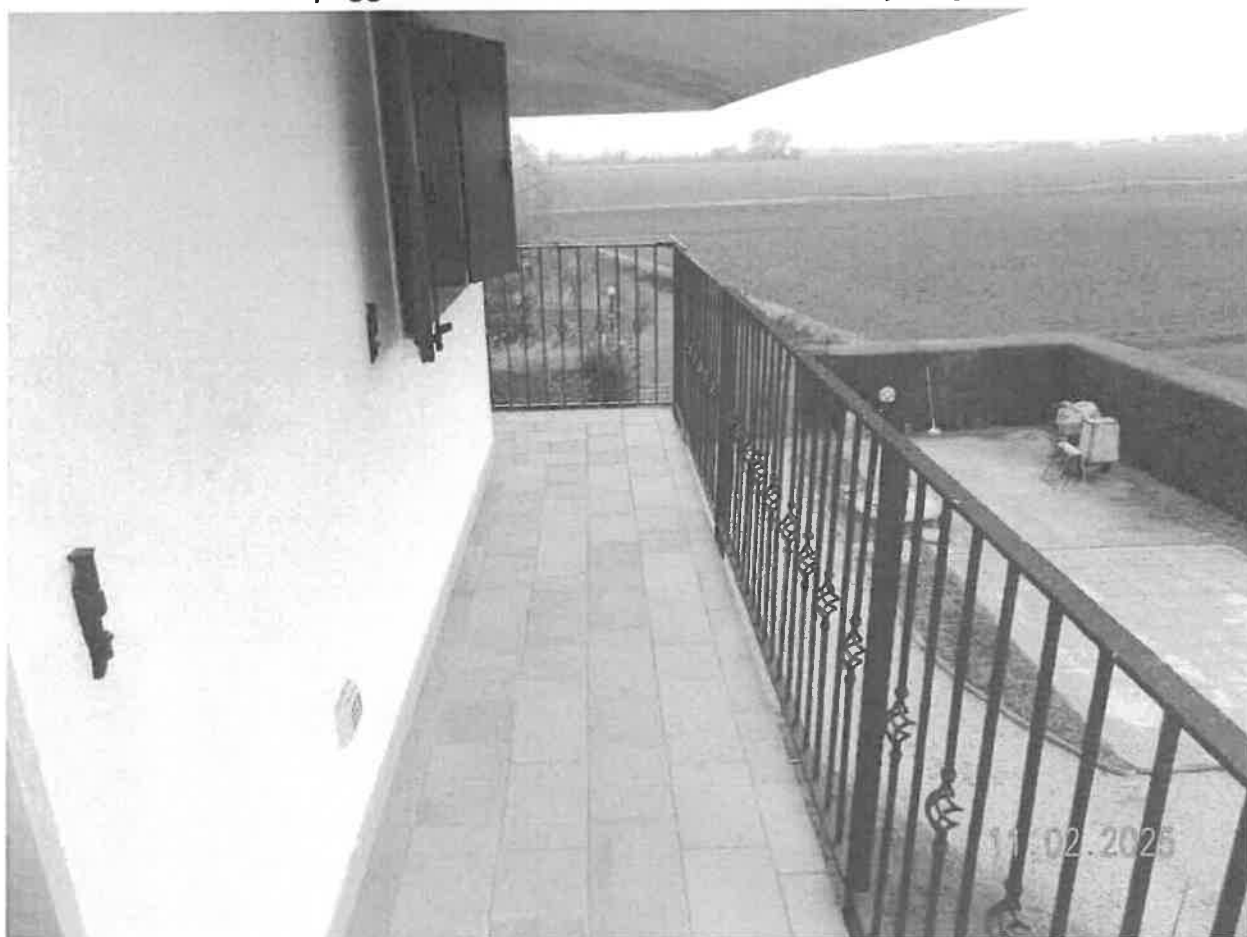
Zona notte - Vista del poggiolo antistante la camera matrimoniale