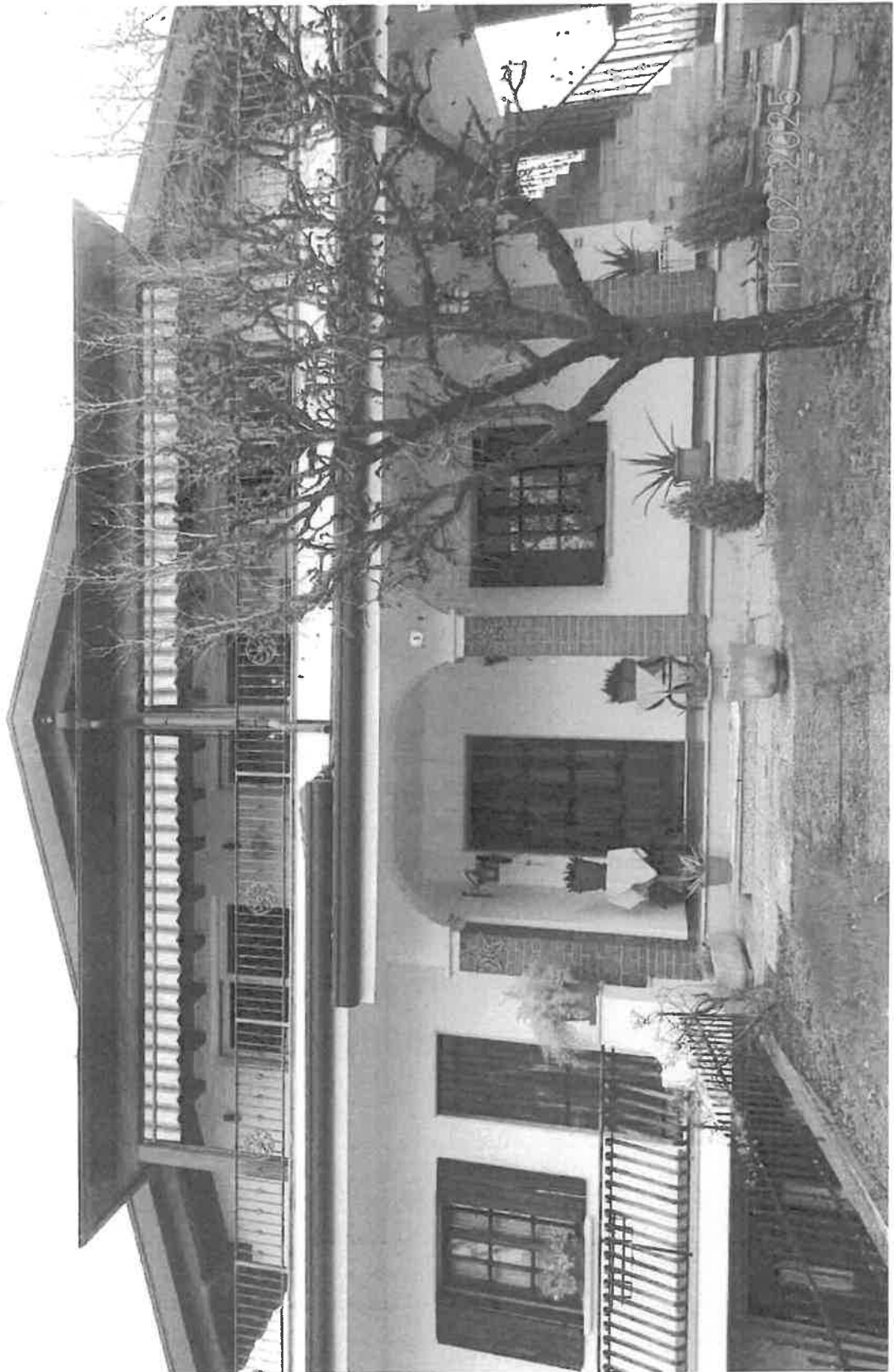
Vista dell'intero fabbricato eretto sulla particella 122 del foglio 2