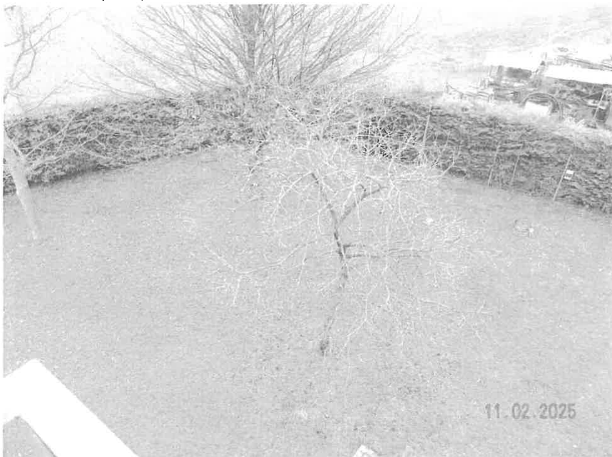
Vista dello scoperto pertinenziale comprendente anche altri mappali non pignorati PAG. 10