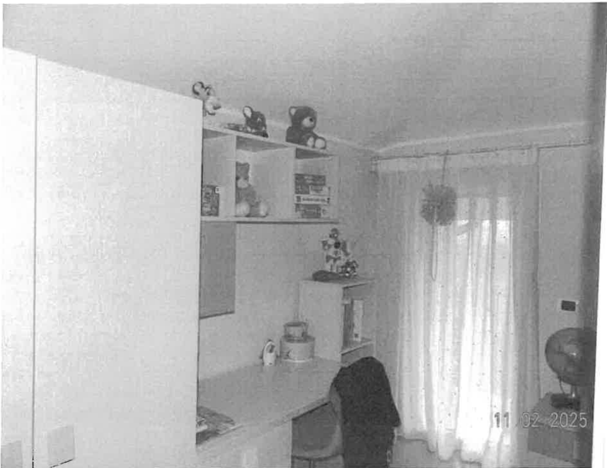
Zona notte - Vista dell'ampio locale ripostiglio adibito a camera