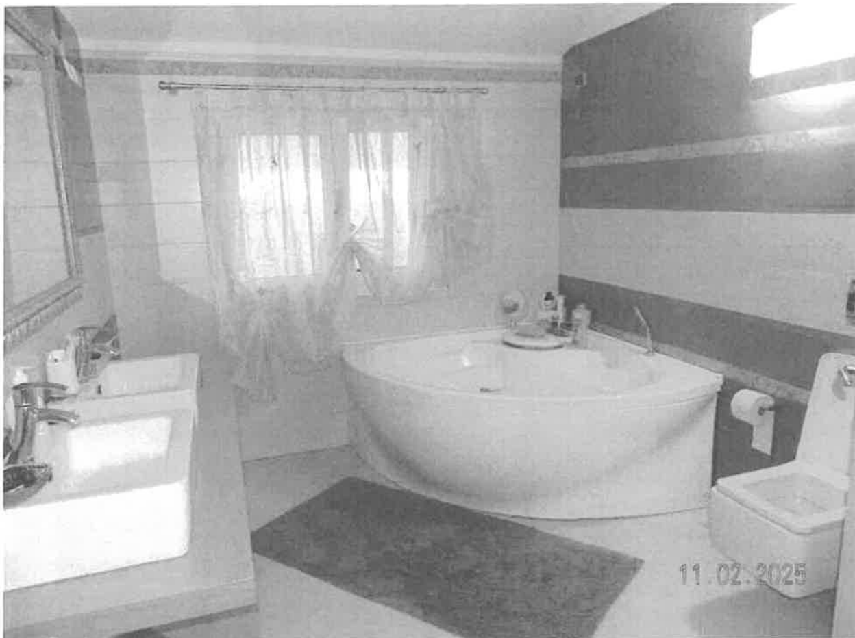
Zona notte - Vista del bagno padronale