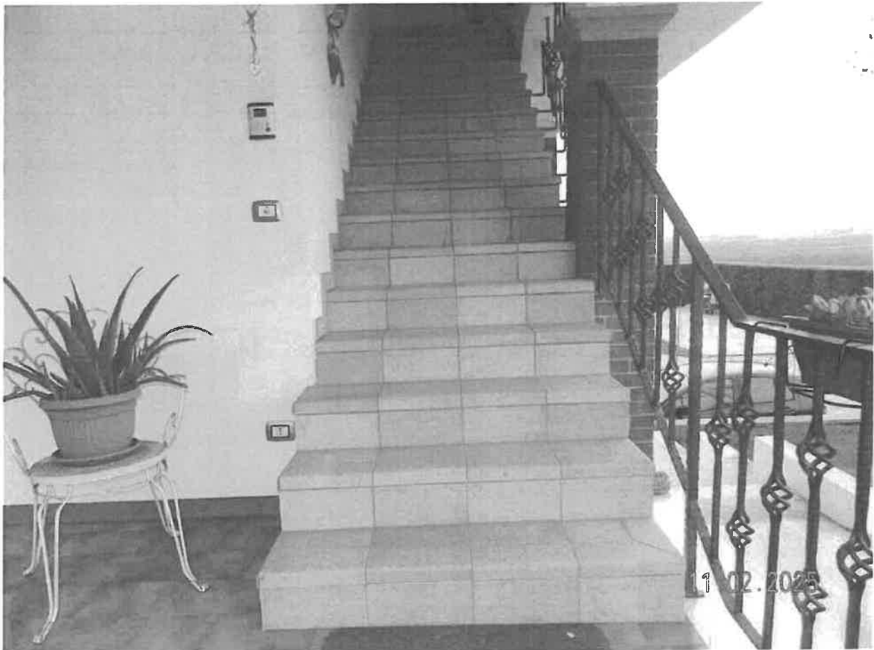
Vista della scala esterna esclusiva