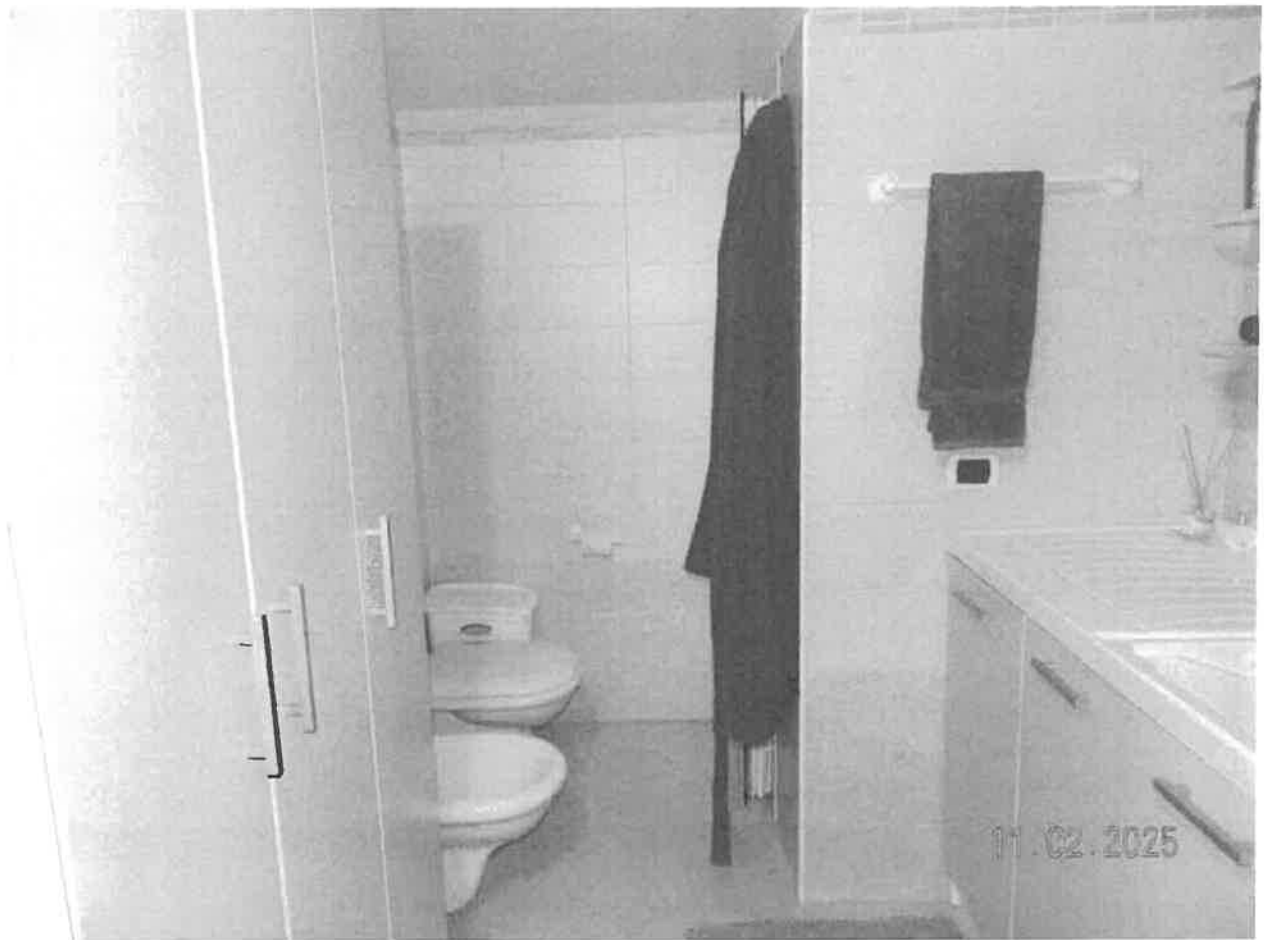
Zona notte - Vista del bagno