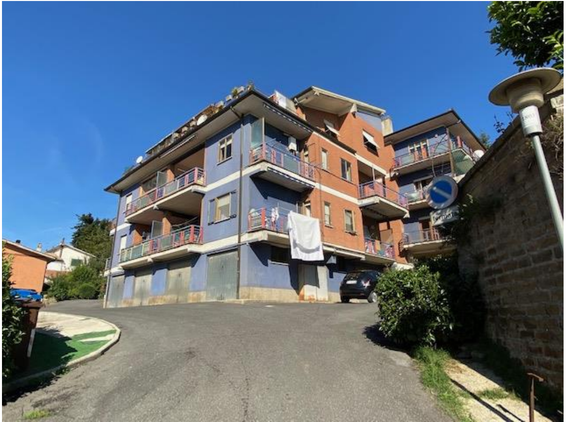
CORTILE CONDOMINIALE -ACCESSO DA VIA G. ALBERTI