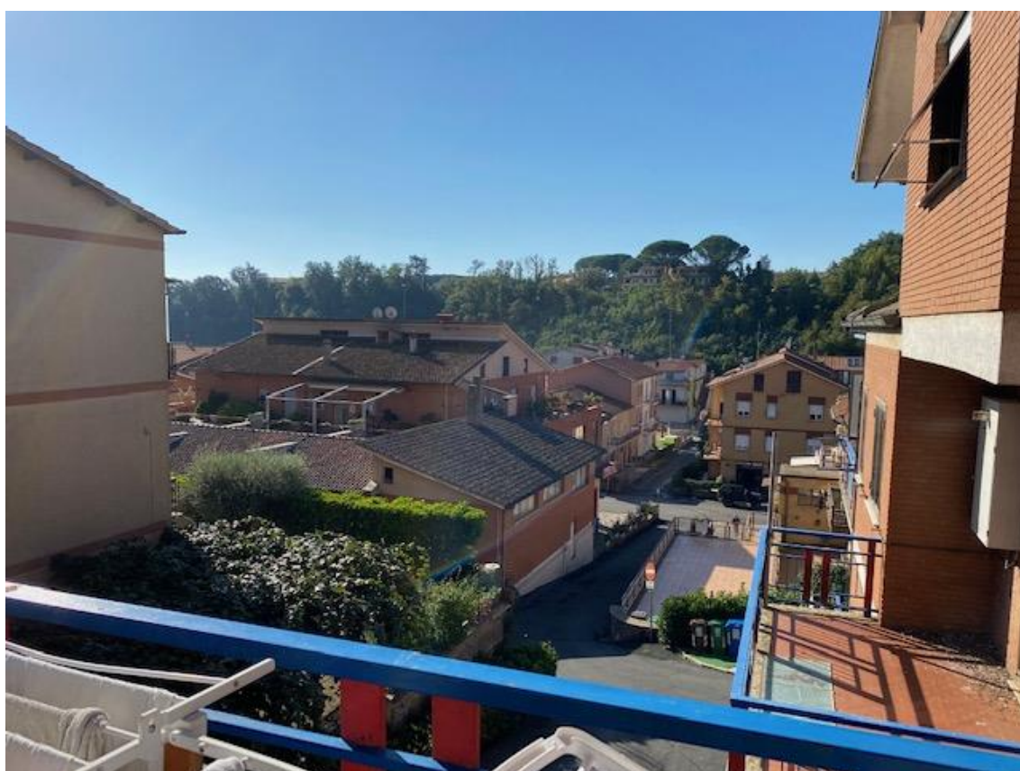
TERRAZZO CON ACCESSO DAL SALONE