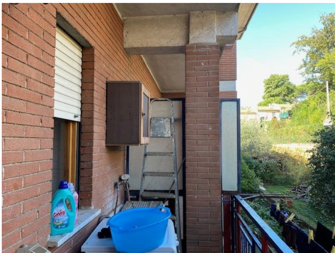
TERRAZZO CON ACCESSO DAL RIPOSTIGLIO