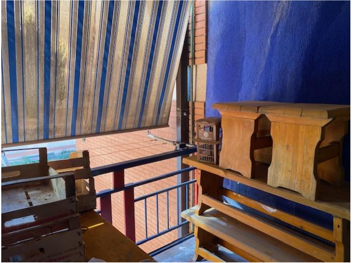
TERRAZZO COPERTO SULLA CUCINA