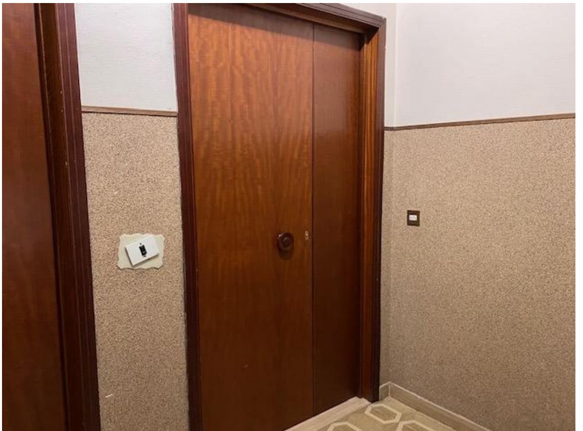
PORTONE DI INGRESSO ALL'APPARTAMENTO