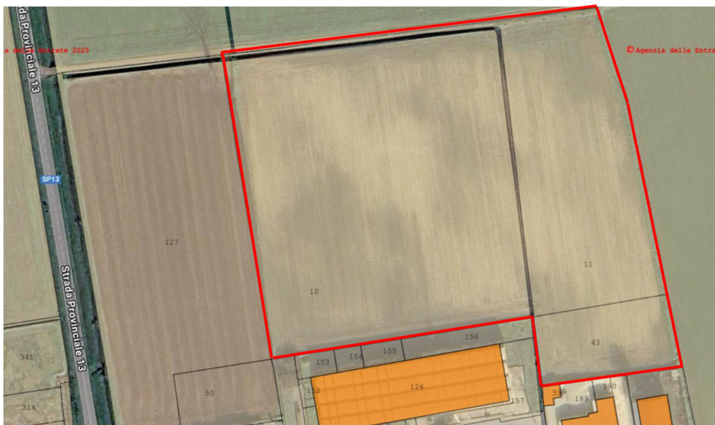
Sovrapposizione ortofoto (vista satellitare + mappa catastale)