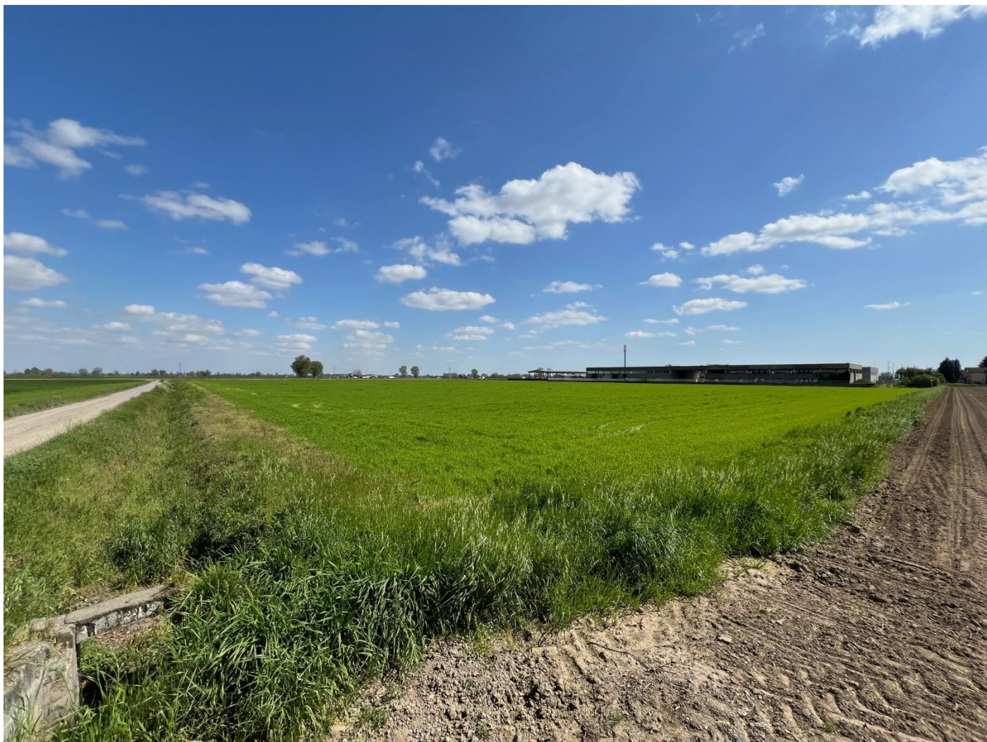
Fotografia del terreno in oggetto