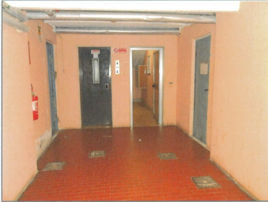
Foto 3 parti comuni