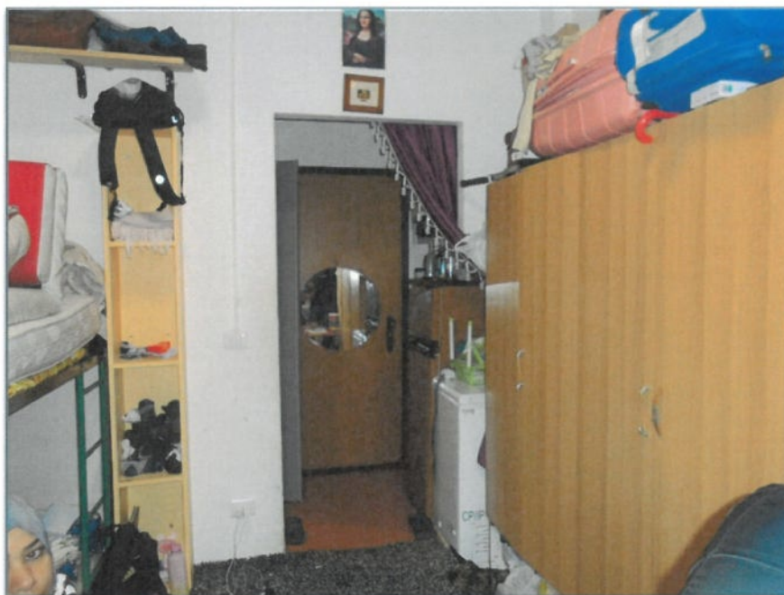
Foto 8 monocale