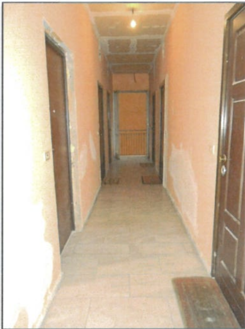
Foto 6 parti comuni