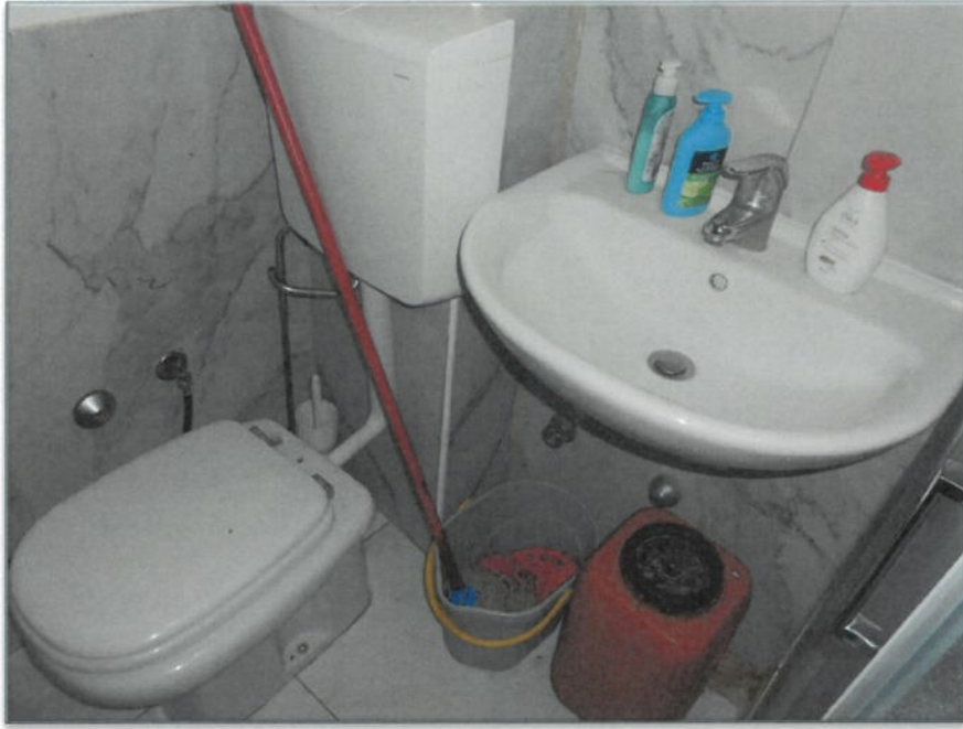
Foto 11 bagno