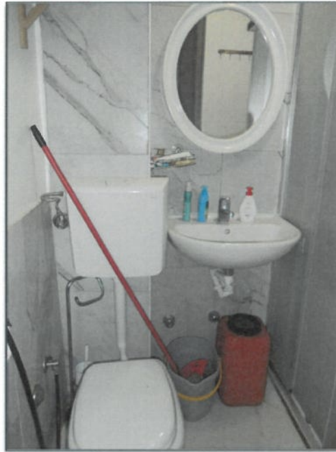
Foto 13 bagno