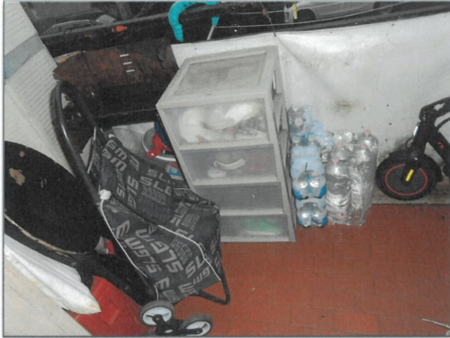
Foto 15 balcone