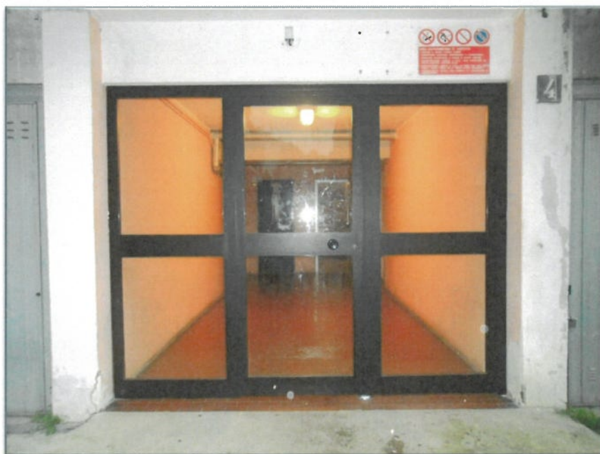
Foto 2 portone ingresso