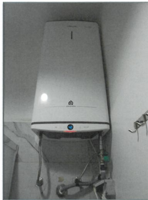
Foto 14 caldaia