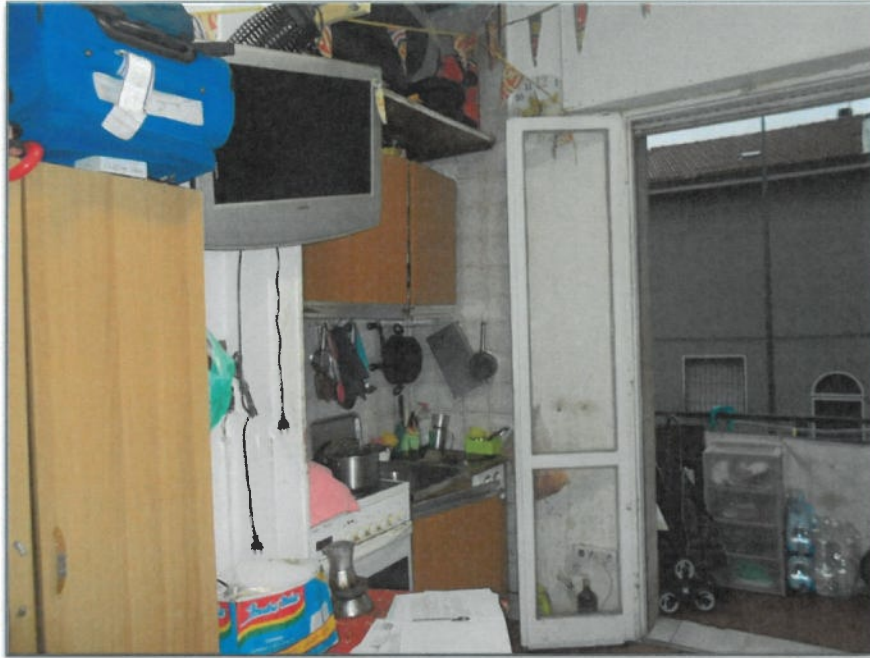
Foto 9 angolo cottura