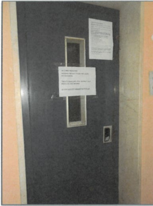
Foto 5 ascensore non funzionante