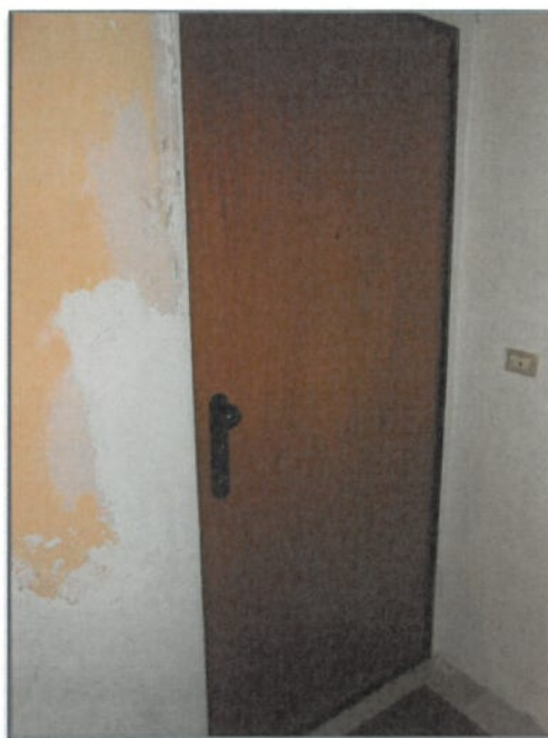
Foto 7 porta d'ingresso