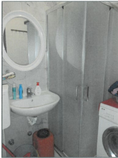
Foto 12 bagno