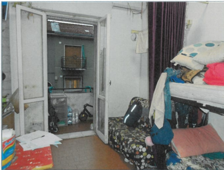
Foto 10 monocale