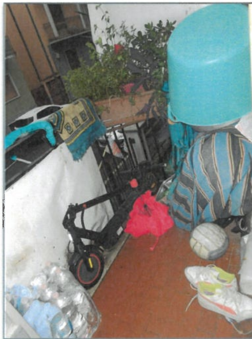
Foto 16 balcone