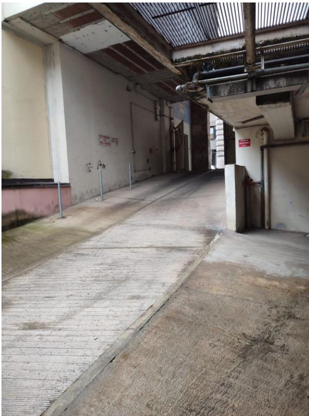
Rampa interna accesso al piano S1