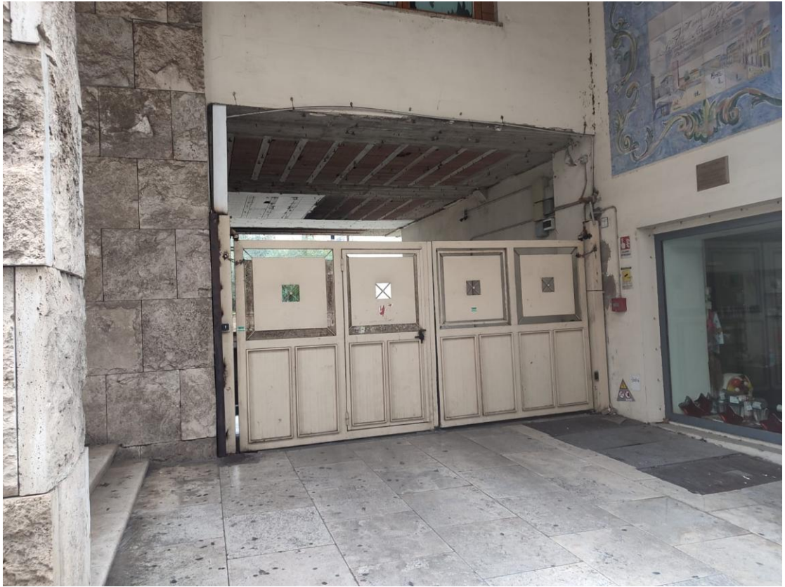
Particolare ingresso al piano S1