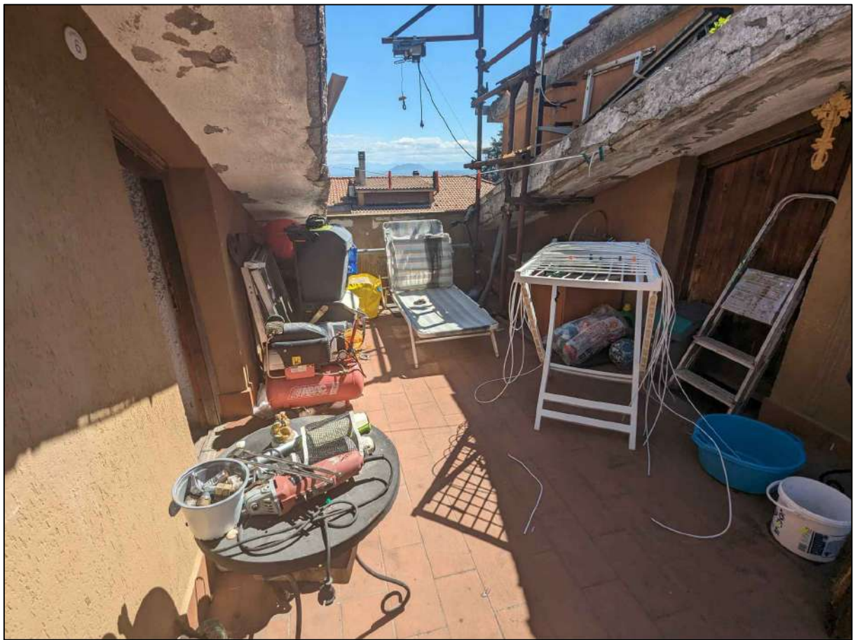
FOTO N.3 LASTRICO