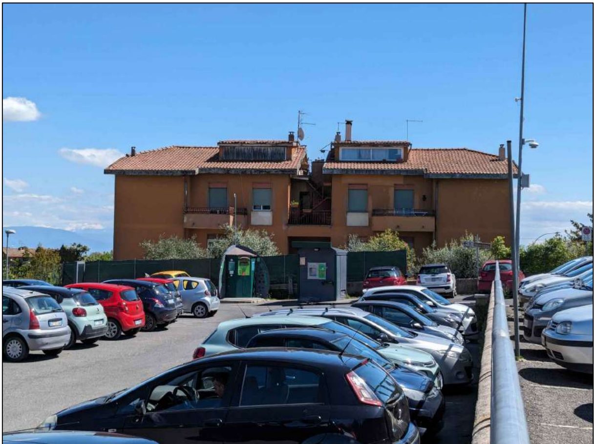
FOTO N.20 PROSPETTO FABB.