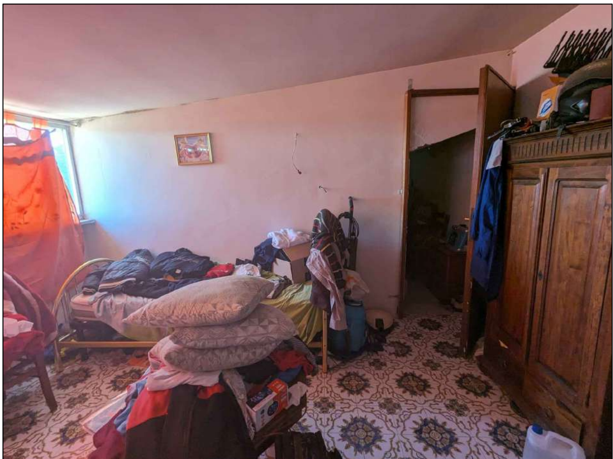
FOTO N.10 SOGGIORNO