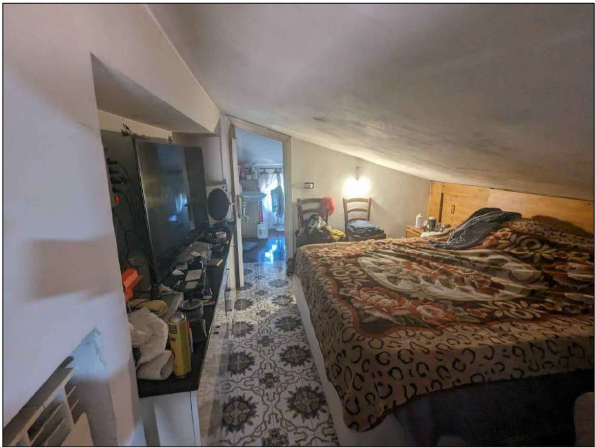
FOTO N.7 CAMERA