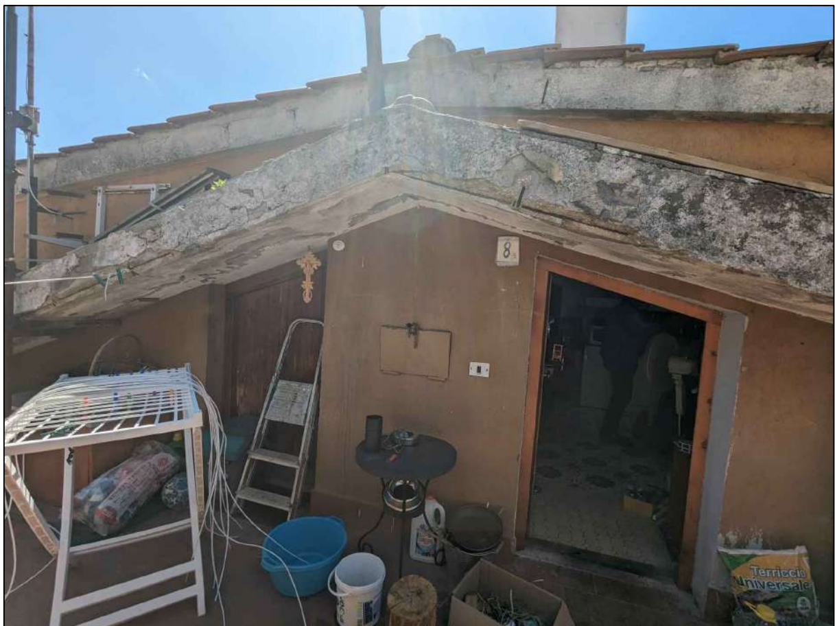
FOTO N.4 INGRESSO PROP.