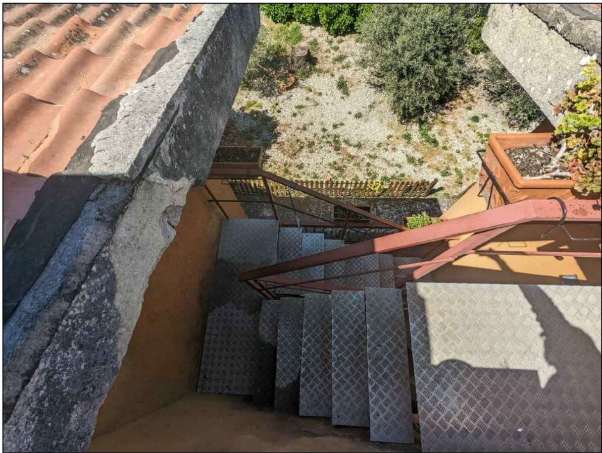
FOTO N.1 SCALA D'ACCESSO