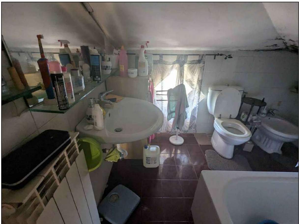
FOTO N.8 WC