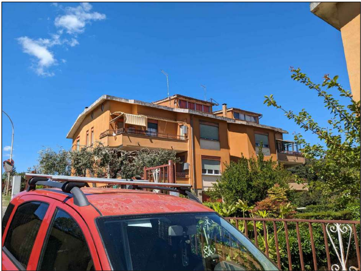
FOTO N.21 PROSPETTO FABB.