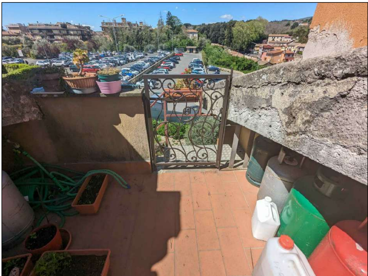
FOTO N.2 CANCELLO D'INGRESSO