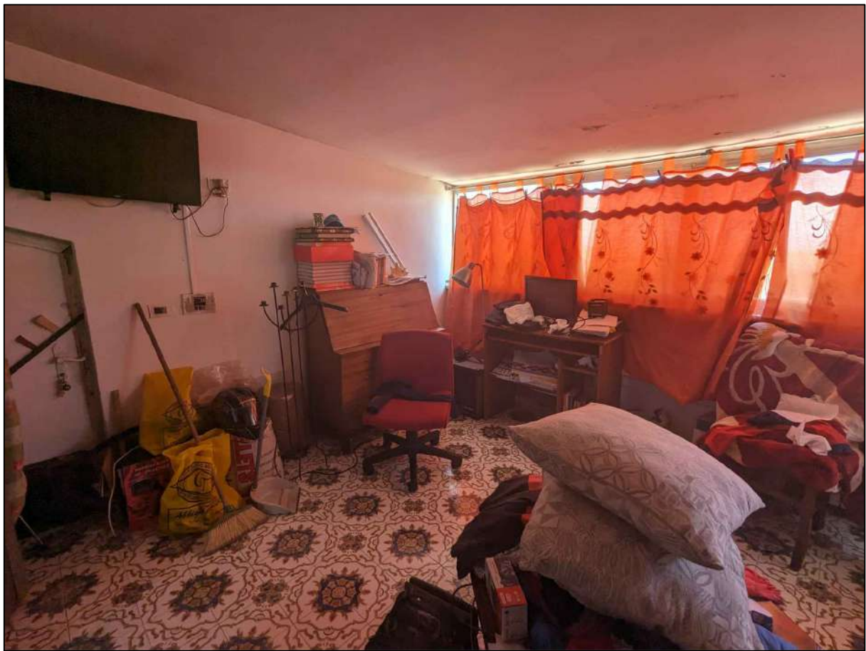
FOTO N.9 SOGGIORNO