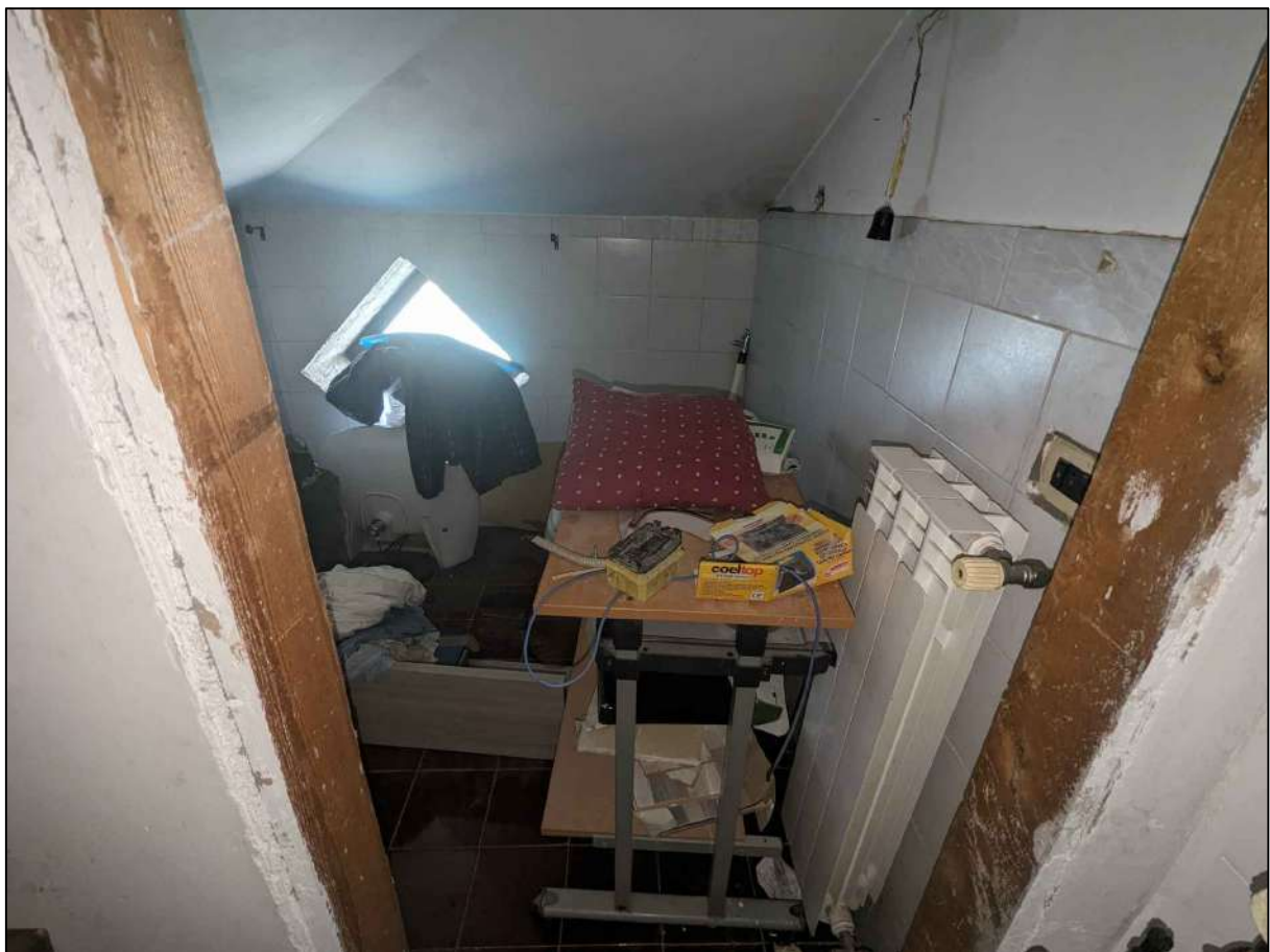
FOTO N.12 WC