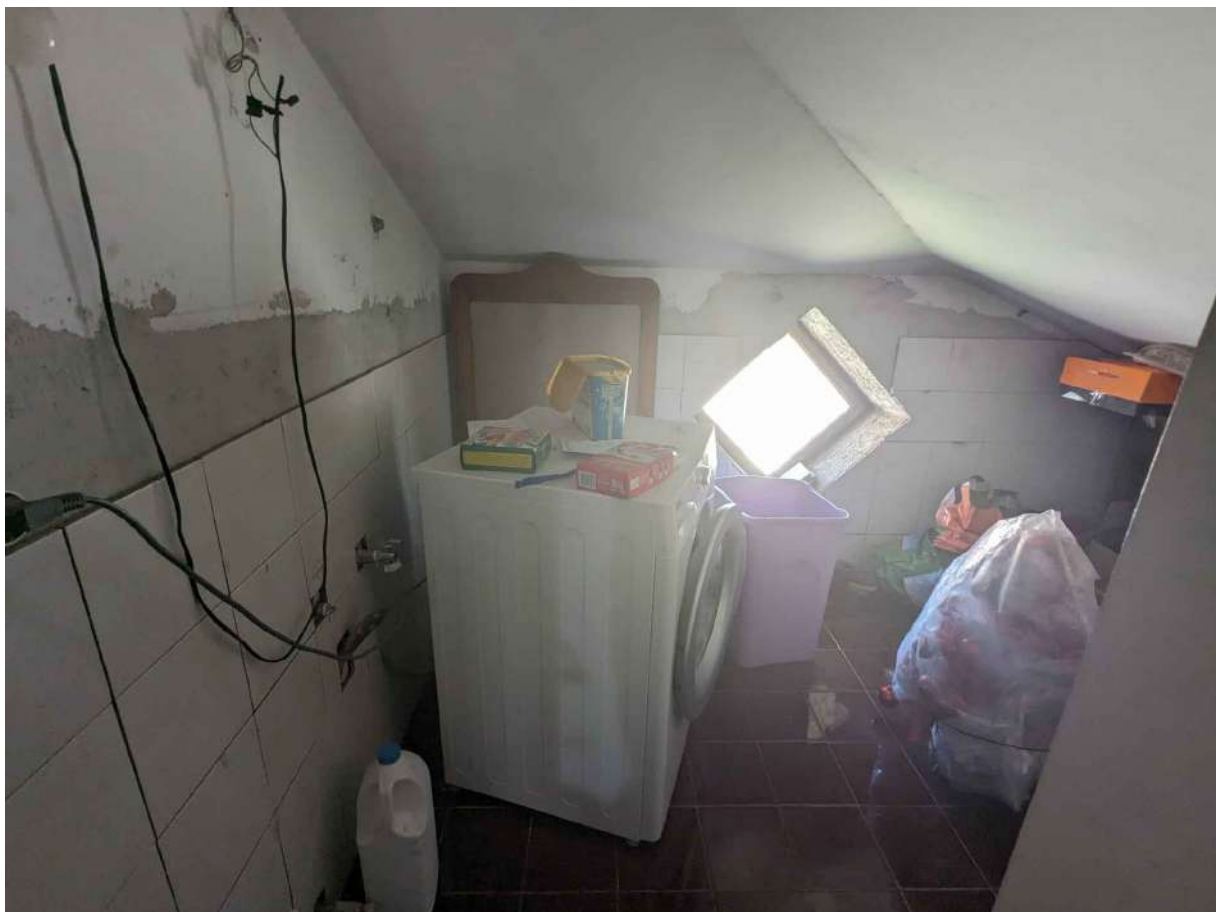
FOTO N.18 WC