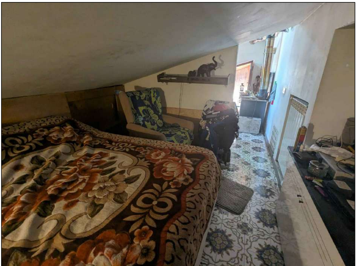
FOTO N.6 CAMERA