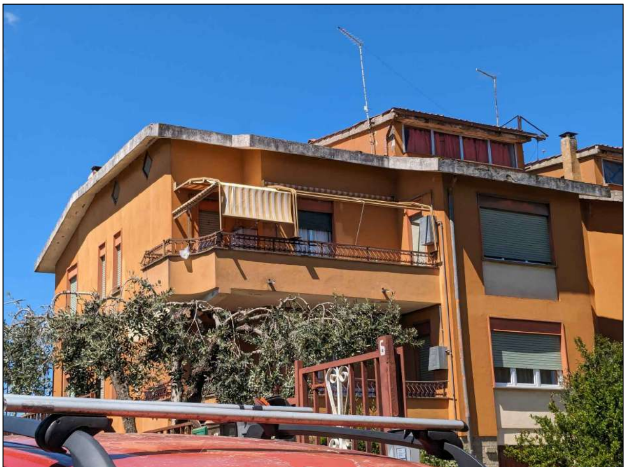
FOTO N.22 PROSPETTO FABB.