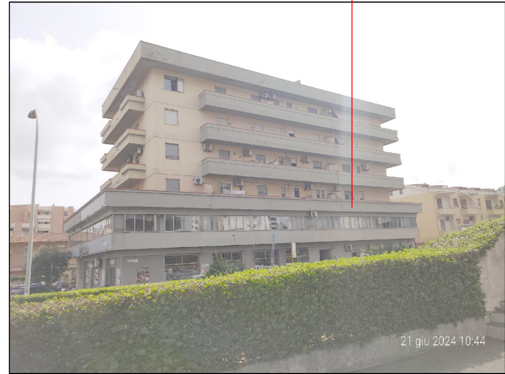
Foto n.1 - Prospetto Via Enrico De Mattel-