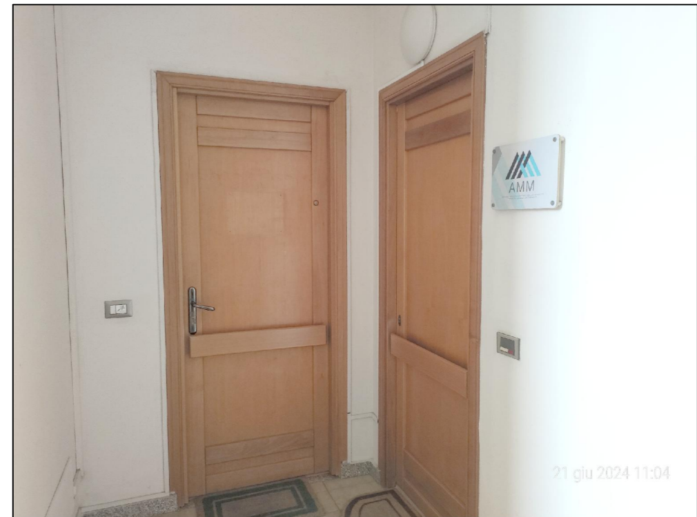
Foto n.2 - Ingresso-